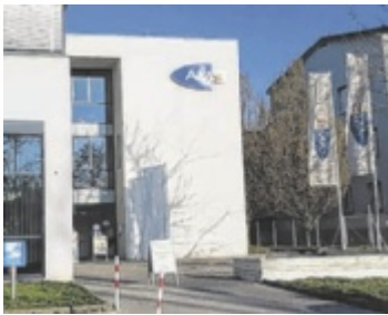
Das AMS Steyr ist Anlaufstelle für Menschen aus 21 Gemeinden.

Rund die Hälfte aller in Steyr und Steyr-Land vorgemerkten Arbeitslosen kann als höchste abgeschlossene Ausbildung lediglich die Pflichtschule vorweisen. Etwa fünf Prozent der Arbeitslosen sind Akademiker. ■