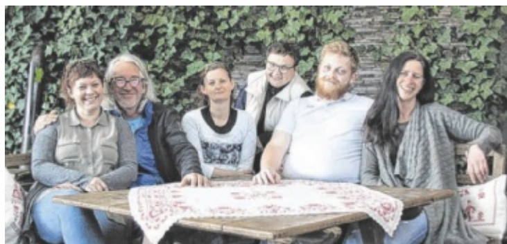
Bühne Großraming inszeniert Ringsgwandl-Stück, Premiere ist am 20. Juni.