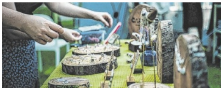
Der Kreativmarkt startet Samstagmittag (28. Juni)

STEYR. Seit Anfang Mai dürfen sogenannte Big Bags (flexible Schüttgutbehälter) in Altstoffsammelzentren (ASZ) abgegeben werden, damit sie im Sinne der Kreislaufwirtschaft verwertet werden. Wegen Platzmangel und nicht vorhandenen Pressmaschinen ist dies jedoch im ASZ Steyr nicht möglich. Steyrer dürfen ihre Big Bags ab sofort kostenlos in den Altstoffsammelzentren in Steyr-Land abgeben. Möglich macht dies eine Kooperation der Stadtbetriebe Steyr mit dem Bezirksabfallverband Steyr-Land. Wichtig ist, dass die Big Bags als Verpackung genutzt wurden und sauber sowie restentleert sind.