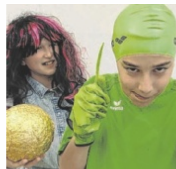
Schüler erobern Bühne.

Die Premiere steigt am Montag, 16. Juni, weitere Aufführungen folgen am Dienstag, 17. Juni, Montag, 23. Juni, und Dienstag, 24. Juni, jeweils um 19 Uhr. Die Schüler entführen ihr Publikum in eine Märchenwelt, die ins Wanken gerät. Klassische Figuren treffen auf digitale Verwirrung, alte Geschichten auf Fake News, wie sie vor allem auf Social Media zu finden sind. In der turbulenten Inszenierung geraten die Jugendlichen mitten ins Geschehen – und müssen ihren Weg zu-