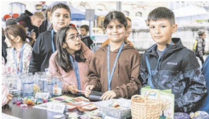
Kinder als Unternehmer am Steyrer Wochenmarkt

Besucher finden rund um den Leopoldbrunnen Marktstände mit handgefertigten Produkten der Kinder der VS Wehrgraben, VS Tabor, Steyrdorfschule und VS St. Ulrich vor. Ihre mit viel