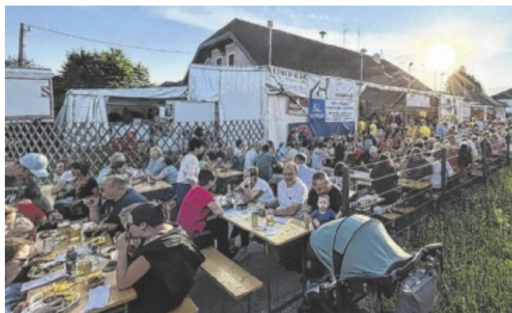
Vor der Geburtstagsfeier steigt noch ein Grillabend im FF-Haus.