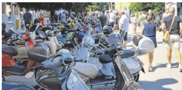
Fest für alle Vespa-Liebhaber bzw. die ganze Familie in Bad Hall

Welt“ mit Ausblick in die Berge – sind ein Geschicklichkeitsparcours und ein Familienprogramm mit Hüpfburg, Kinderschminken und Wasserspielplatz geplant. Kulinarisch erwarten die Gäste regional gerösteter Kaffee, Mehlspeisen und Pizzen der Vespa Ape. Außerdem winken Gewinne, etwa für die weiteste Anreise und das älteste Fahrzeug. Auskünfte: office@herzblutkaffee.at ■