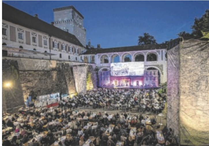
Im Schlossgraben erklingen legendäre Hits der Kultband Abba.