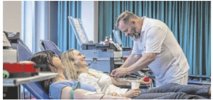
Eine firmeninterne Blutspende-Aktion fand zuletzt bei BMD statt.

Blut ist nach wie vor das wichtigste Notfallmedikament und kann nicht künstlich hergestellt werden. Besonders in den Sommermonaten wird Blut oft knapp. Mögliche Gründe sind, dass viele regelmäßige Spender im Urlaub sind und wegen der hohen Temperaturen erfahrungsgemäß seltener Blut spenden. Dabei spenden nur etwa vier Prozent der Menschen in Oberösterreich regelmäßig ihr Blut. Eine Blutkonserve ist 42 Tage haltbar – deshalb soll man besonders jetzt die Zeit zum Spenden nutzen.