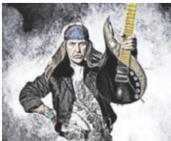
Uli Jon Roth