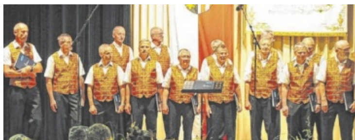
Der Garstner Männerchor gestaltet mit weiteren einen bunten Abend.

ringt. Generationenkonflikte, soziale Isolation und die Verzweiflung über den Verlust der eigenen Identität werden eindringlich, aber auch mit Augenzwinkern inszeniert. Ringsgwandls musikalische Bearbeitung verleiht der zeitlosen Thematik überraschende Leichtigkeit. Spieltermine: 20., 26., 27. und 28. Juni sowie 4., 5., 6., 10., 11. und 12. Juli (20 Uhr, außer So., 6. Juli: 18 Uhr), Karten: www.buehne-grossraming.at , Café Mandl's (13.+27. Juni, 16–18 Uhr) ■