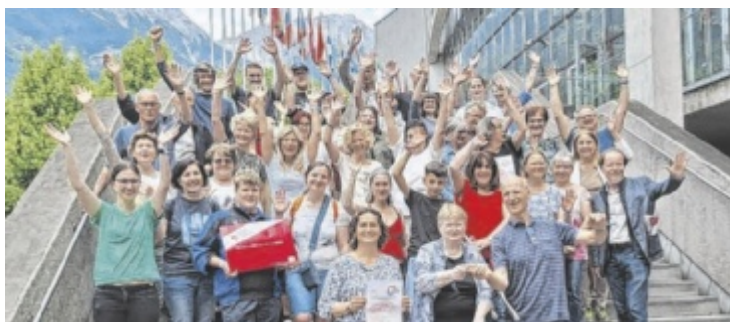
Akkordeonorchester des Oberösterreichischen Landesmusikschulwerkes

arbeiter in ihrem Element: ESS bietet Simulationssoftware an, um bei der Fahrzeuglackierung Kosten und Emissionen zu sparen. Teil des Erfolges sind die hohen Investitionen in Forschung, die sich in neuen Produkten und Umsatzsteigerungen niederschlagen. Die Exportquote liegt bei nahezu 100 Prozent. ■