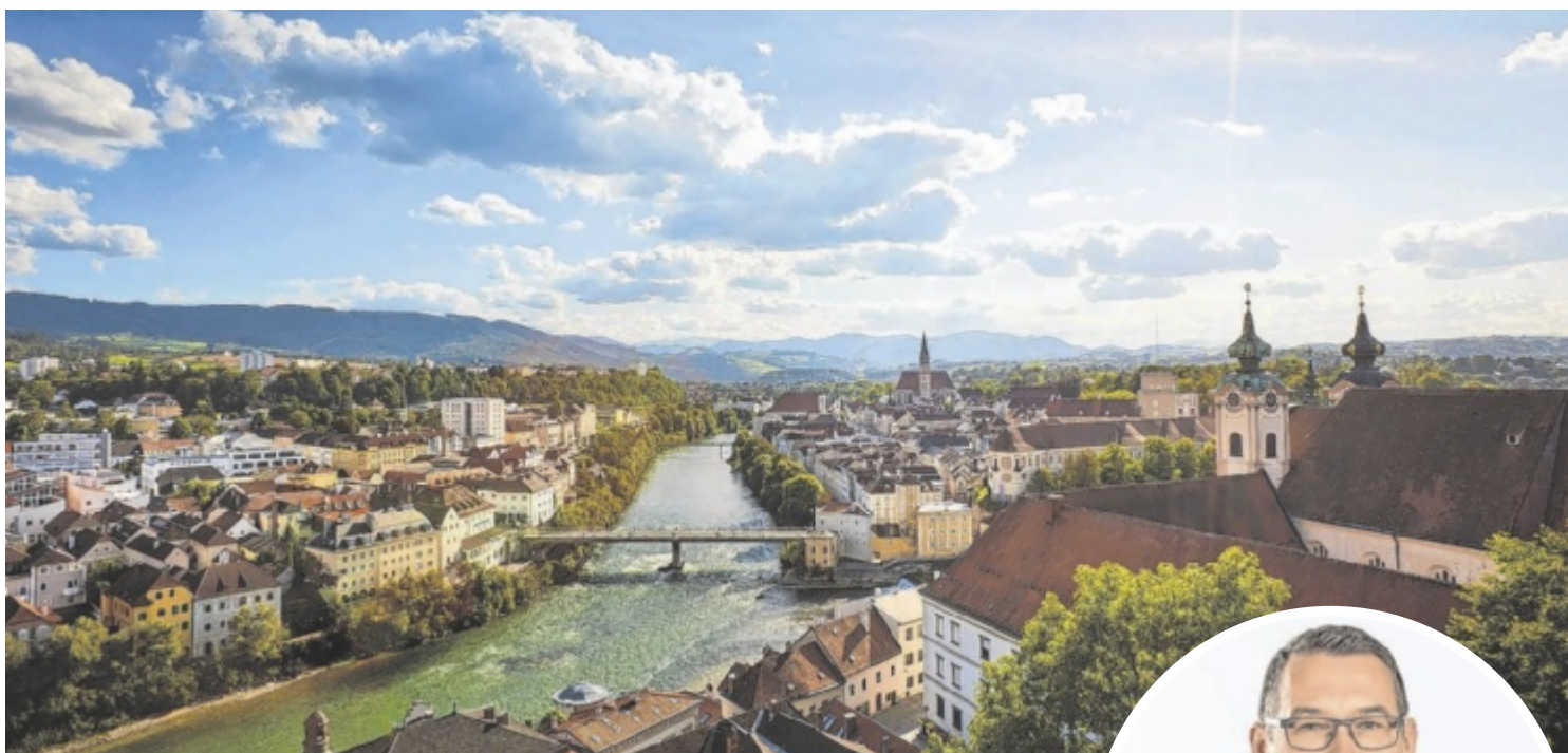
Die Steyrer Altstadt am Zusammenfluss von Enns und Steyr