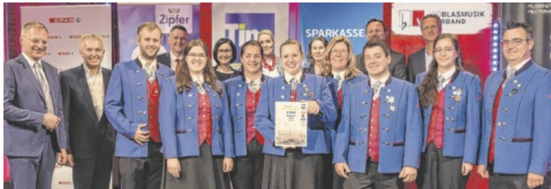
Der Musikverein Gleink, Bezirksieger in der Region Steyr, wurde bei der Landeswahl Sechster.

Fleißig Stimmen gesammelt wurde auch in Steyr, der Musikverein Gleink durfte sich am Ende über Rang sechs freuen. Insgesamt wurden über 300.000 Stimmen in den letzten Wochen abgegeben, davon allein rund 243.000 bei der Landeswahl, wobei alle Stimmzettel aus den