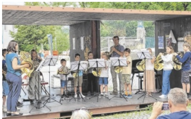
Schüler der LMS Steyr zeigen am 14. Juni ihr Können auf der Bühne.

schen, Celli, Querflöten, Klarinetten, Gitarren und Klavier. Auch eine Jazzband spielt auf. Darüber hinaus treten junge Sänger und die Jüngsten aus der Musikwerkstatt auf. Ein Highlight bietet die Schauspielklasse, die einzige ihrer Art im oberösterreichischen Landesmusikschulwerk: Sie zeigt ein eigenes Theaterstück. Bei Schlechtwetter im Reithoffersaal (Pyrachstraße 7); Eintritt frei ■