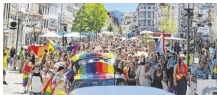
Die Pride Parade in Steyr findet am 5. Juli statt.