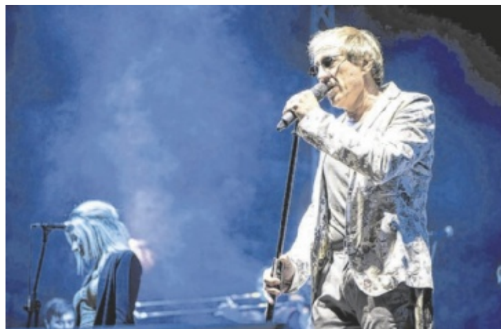
„Lui e gli amici del Re“ bringen italienische Klassiker nach Steyr.