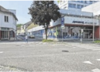
Fahrzeuge aus der Johannesgasse (oben) haben nun gegenüber jenen aus der Pachergasse Vorrang.