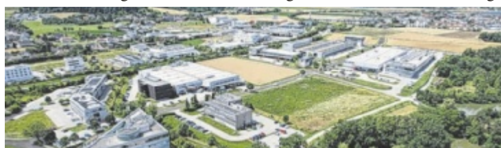
Das Stadtgut Steyr: www.stadtgut-steyr.at