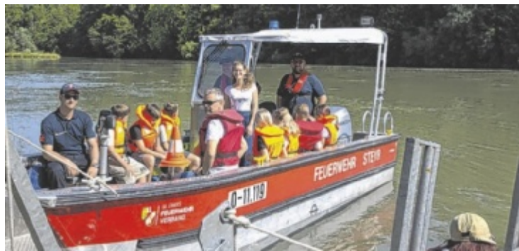
Jugendliche lernen den Wasserzug der Feuerwehr kennen.