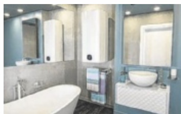
Wasser und Geld sparen

Heißes Wasser weniger lange laufen lassen. Damit lässt sich die Menge des Wasserverbrauchs merklich reduzieren. Nutzung eines Einhebelmischers statt separater Wasserhähne für kaltes und warmes Wasser: Einhebelmischer sind auf Dauer nachweislich sparsamer, weil einfacher zu bedienen. Sparduschkopf und Strahlregler reduzieren den Wasserverbrauch: Während herkömmliche Duschköpfe eine Durchflussmenge von zehn bis 20 Litern pro Minute haben, verbraucht ein Sparduschkopf nur rund sechs Liter pro Minute bei gleichem Komfort. Duschen statt Baden reduziert den Wasserverbrauch massiv: Während für ein Vollbad etwa 120 bis