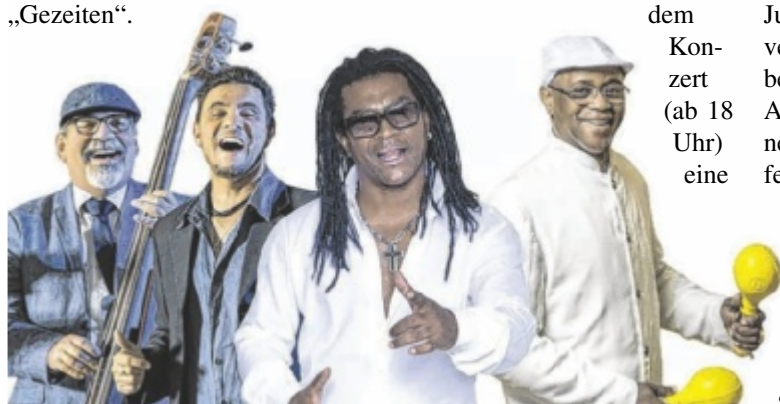
The Sons of Buena Vista treten am Donnerstag auf.

Mi., 18. bis Sa., 21. Juni Ried, Tonninger-Parkplatz (Eingang Mühlbachgasse) Tickets: www.kik-ried.com und im KiK-Büro zu den Öffnungszeiten (Mo-Fr von 9-12 Uhr)