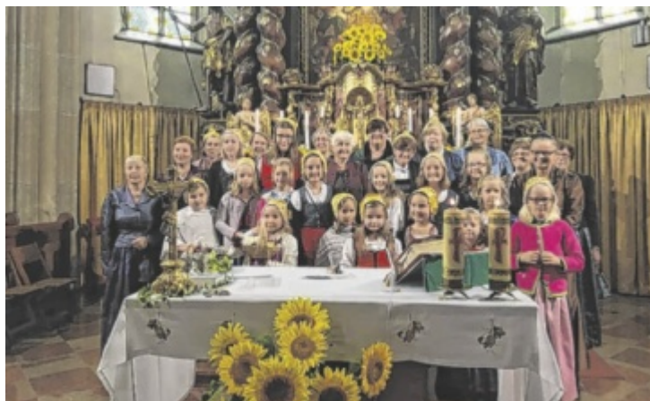
Die Goldhaubengruppe Gurten beim Festgottesdienst

Wer in Gurten an festlichen Feiertagen zur Kirche kommt, kennt den Anblick: Mit Stolz tragen die Frauen der Goldhaubengruppe ihre kunstvoll gefertigten Trachten, Zeichen eines gelebten Brauchtums, das weit mehr bedeutet als schöne Kleidung. Gegründet im Jahr 1974, wurde die Gruppe seither von fünf engagierten Obfrauen geführt – und