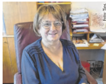
Bürgermeisterin Petra Mies (SPÖ)

Mies: Wir erschließen derzeit neue Baugründe – acht von insgesamt 14 sind bereits verkauft. Drei Bauwerber starten heuer mit dem Bau. Besonders freut mich, dass wir den vom Land OÖ genehmigten Finanzierungsplan für den neuen Turnsaal am 12. Juni im Gemeinderat beschließen werden und am 16. Juni die Bauverhandlung stattfinden wird. Der bestehende Turnsaal wird in den nächsten Monaten abgerissen und geplant ist, dass der