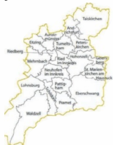
Die 19 Pfarrgemeinden der neuen Pfarre Ried