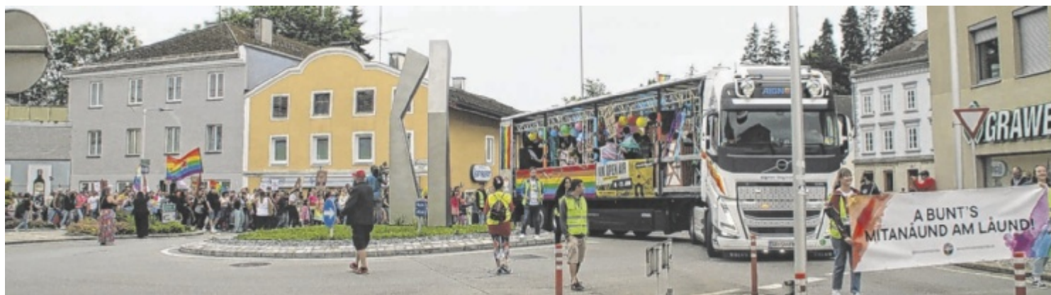
Die Pride Parade zog mit zwei Wagen und mehreren hundert Teilnehmern etwa eineinhalb Stunden lang durch die Stadt.