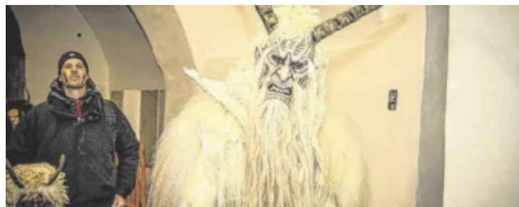
Die Bochteifen zeichnen sich durch ihre schaurig-schönen Masken aus.

Doch damit nicht genug: Die Gruppe ist offen für Zuwachs und freut sich über Interessierte, die Teil dieser besonderen Gemeinschaft werden wollen. Ein echtes Highlight im Jahreslauf ist die Heimveranstaltung am 5. Dezember im Pfarrheim Gurten: Unter dem Motto Krampuskränzchen erwartet die Besucher ein stimmungsvoller Abend mit einem Besuch des Nikolaus, der