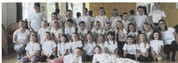
Kinder ab vier Jahren können mitmachen.

Ein besonderes Ereignis war heuer die 130. Vollversammlung der Feuerwehr – ein eindrucksvoller Meilenstein, der das langjährige Wirken der Kameraden würdigt. Auch in der Aus- und Weiterbildung setzt die FF Gurten Maßstäbe: Am 9. Mai wurde die Branddienstleistungsprüfung erfolgreich absolviert – erstmals auch mit einer Gruppe in Gold. Insgesamt nahmen acht Mitglieder in Bronze, fünf in Silber und sieben in Gold teil – ein Beweis für die hohe Motivation und Einsatzbereitschaft der Truppe. ■