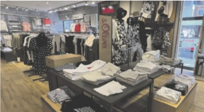
Cool, stylisch und trendy - s.Oliver ist jetzt im Erdgeschoss neben Smith&Soul zu finden.