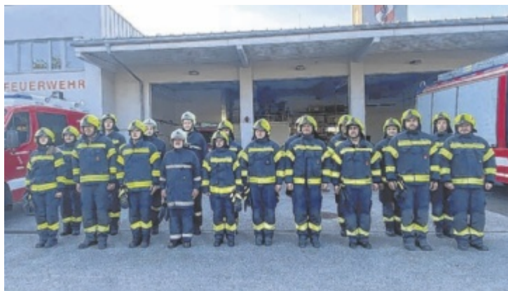
Die Mannschaft ist für den Ernstfall bestens gerüstet.

Mit insgesamt 104 Mitgliedern, davon 63 Aktive und 18 Jugendliche, ist sie bestens aufgestellt, um im Ernstfall rasch und professionell Hilfe zu leisten. Jährlich bewältigt die FF Gurten rund 60 bis 80 Einsätze, wobei etwa fünf bis zehn Prozent davon auf Brandeinsätze entfallen. Die breite Einsatzpalette reicht von technischen Hilfeleistungen bis hin zu klassischen Bränden – im-