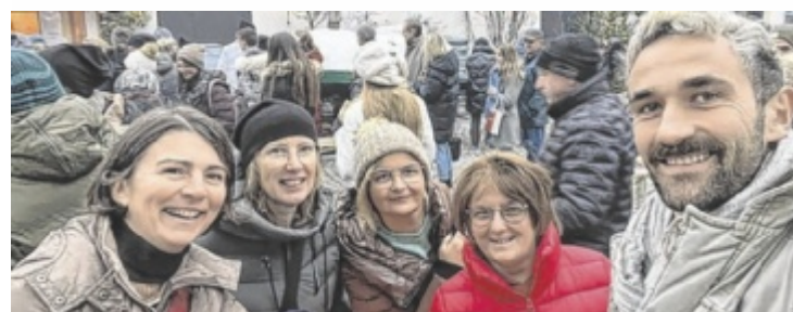
Mitglieder der Gesunden Gemeinde beim Besuch des Adventmarktes

eigenen Reihen. Ein besonderes Highlight ist die Teilnahme an „Gemma OÖ - Gemeinsam aktiv für mehr Gesundheit“ - eine Initiative des Landes Oberösterreich, bei der Gurten fleißig Bewegungsminuten sammelt. Auch der jährliche Skitag gehört fix ins Programm und erfreut sich großer Beliebtheit. Die Gesunde Gemeinde profitiert vom großen ehrenamtlichen Engagement vieler Aktiver – viele davon sind in mehreren Vereinen tätig. ■