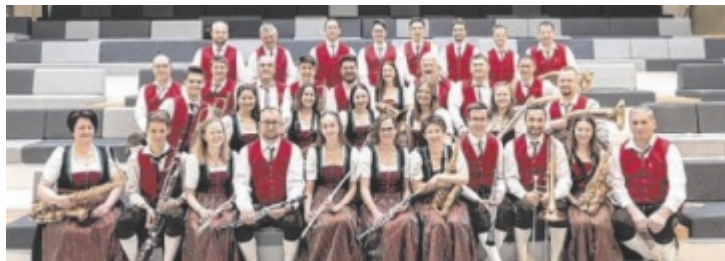
Was den Musikverein Gurten besonders auszeichnet, ist das gelebte Miteinander.

Ob kirchliche Feste wie Fronleichnam, Begräbnisse und Erstkommunionen oder weltliche Veranstaltungen wie Frühschoppen, der Musikverein ist ein fixer Bestandteil des Gemeindelebens. Regelmäßig sind die Musiker beim Maibaumfest der Landjugend, dem Kirtagsfrühschoppen von Sportverein und Pfarrgemeinderat sowie beim Frühschoppen der Feuerwehr im Einsatz. Auch beim Genussfest in Gurten sorgt der Musikverein für den passenden musikalischen Rahmen. Darüber hinaus unterstützt er den Sportverein bei