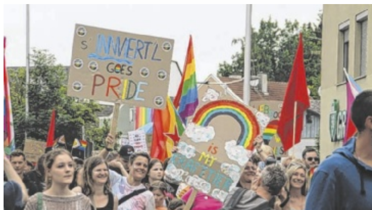
Die Demonstranten trugen zahlreiche Plakate, von „Pride-typisch“ über politisch bis witzig.