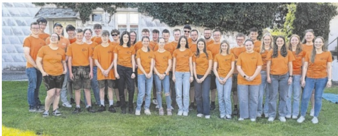
Die Landjugend lädt am Samstag, 30. August zum Sommernachtsfest beim Stummer z'Neurattig.

Zu den Höhepunkten im Jahreskalender zählen der beliebte Maibaumfrühschoppen und das stimmungsvolle Sommerachtsfest, die zahlreiche Besucher anlocken. Im Winter sorgt