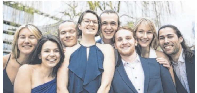
Vocalodie singen achttimmige Lieder über den Abend.