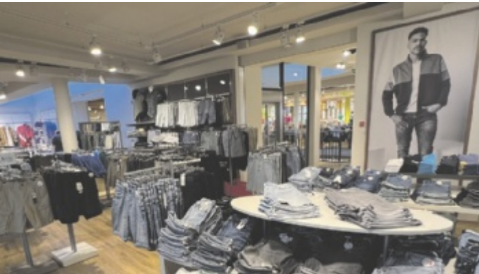
Die Herrenabteilung überzeugt mit der größten Hosenauswahl, kompakt präsentiert.