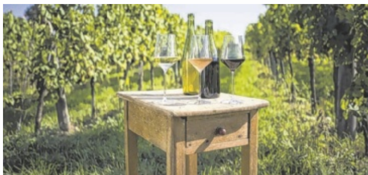
Am Tag der offenen Kellertür am 14. Juni können die Besucher Wein im Weingarten genießen.

Unter den teilnehmenden Weinbaubetrieben finden sich gleich neun Betriebe, die erst unlängst beim Landesweinwettbewerb „Best of OÖ“ als Landessieger ausgezeichnet wurden. Der Tag der offenen Kellertür ist daher die beste Gelegenheit, sich über die Top-Qualitäten der heimischen Weine ein umfassendes Bild zu machen. Neben der Verkostung der aktuellen Weine geben die OÖ Win-