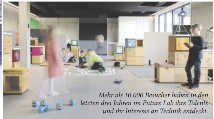
Mehr als 10.000 Besucher haben in den letzten drei Jahren im Future Lab ihre Talente und ihr Interesse an Technik entdeckt.