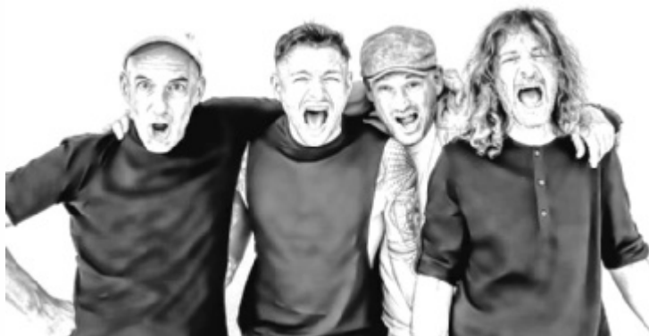
Junger kommen mit einem neuen Programm zum KiK Open Air.

Headliner ist die österreichische Hip-Hop-Band schlechthin: Texta. Nach mittlerweile über 30 Jahren sind die Linzer immer noch frisch und relevant wie eh und je. In Ried präsentieren sie ihr brandneues Album „Gezeiten“.