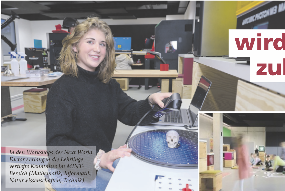
In den Workshops der Next World Factory erlangen die Lehrlinge vertiefte Kenntnisse im MINT-Bereich (Mathematik, Informatik, Naturwissenschaften, Technik).