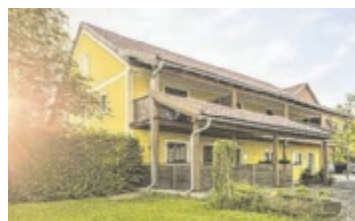
Pension Sachsenbucherhof

Ein weiteres Herzensprojekt von Markus Schneiderbauer ist ÖKO-