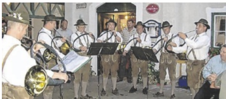
Die Jagdhornbläser spielen bei diversen Feierlichkeiten im Ort auf.

Schon bald nach der Gründung begannen die Mitglieder mit intensiver Probenarbeit. Bereits Mitte der 1990er-Jahre konnte die Gruppe erste Jägermaiaandachten und Hubertusmessen im Heimatort musikalisch umrahmen.