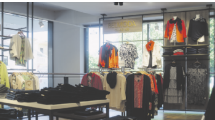
Mehr Platz und beste Auswahl von Belmoda über Frank Walder bis Betty Barclay bietet die Abteilung für Damenmode bis Größe 48 im 1. Stock