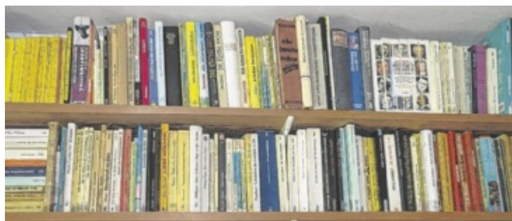
Von 9 – 13 Uhr gibt es einen Bücherflohmarkt.