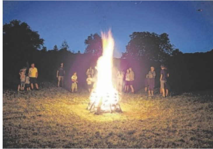
Beim Sonnwendfest der Grünen Kronstorf

Ab 18 Uhr gibt es einen Fahrradparcours für Kinder. Alle TeilnehmerInnen bekommen eine kleine Belohnung.