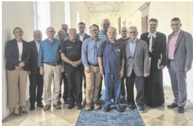
Der neu gewählte Vorstand des Oö. Feuerwehrmuseums