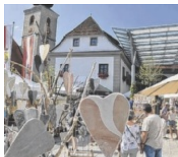
Buntes Marktreiben

Alle neuen Junitermine bis 2030 sind bereits auf sierning.gv.at bis 2030 eingetragen. Damit können Kunsthandwerker langfristig ihre Ausstellungstermine planen. Zwei Tage lang steht Sierning wieder ganz im Zeichen von Kunst, Design und Kunsthandwerk. Das Ausstellungsgelände mit über 3.000 Quadratmetern im Schloss, im Gemeindefoyer, im überdachten Schlosshof, auf den Schlossvorplätzen und am Oberen Kirchenplatz bieten überschaubare und saubere Flanierzonen. Alle Areale fließen ineinander und sind in Rundkursen erlebbar, was für die Besucher kurze Wege bringt.