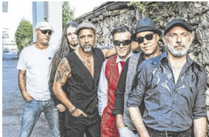
Doktor Südbahn & die SymPartie

Doktor Südbahn & die SymPartie erzählen in musikalischer Form die Geschichte des Ostbahn Kurti, später Dr. Kurt Ostbahn - von der Entstehung im Jahr 1984 bis hin zu den großen Kaiserwiesen Konzerten, von denen das letzte 2019 stattfand.