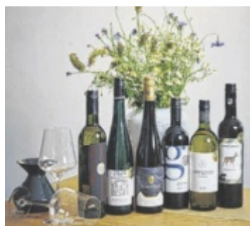
Ein „Best of OÖ 2025“-Probierpaket mit sechs prämierten Weinen ist bei den Geschwister Wurm erhältlich.

Am Samstag, 21. Juni, lädt das Weinspektakel auf Schloss Tillysburg in St. Florian ab 16.30 Uhr zu einem genussvollen Abend mit Wein, Kulinarik, Kunst und Musik. Neben einer Weinverkostung (bis 20.30 Uhr) sorgen Live-Musik und eine After-Party für Stimmung. Tickets kosten 35 Euro im Vorverkauf, an der Abendkasse 40 Euro, ein Shuttle fährt ab dem Bahnhof in Asten für fünf Euro. Infos: www.weinspektakel.at . ■