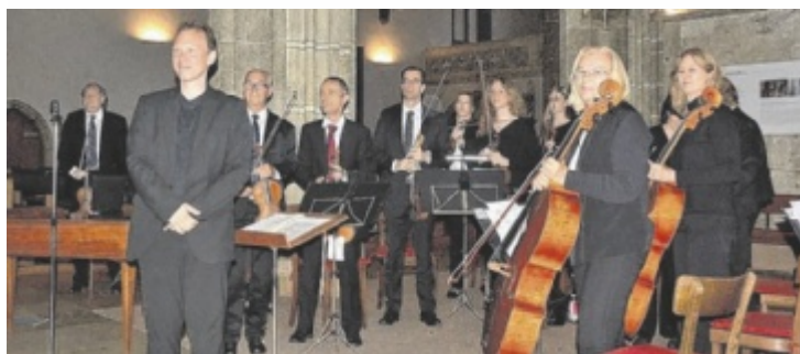
Vorgetragen wurden Werke von Mozart, Haydn, Bruckner und Elgar.