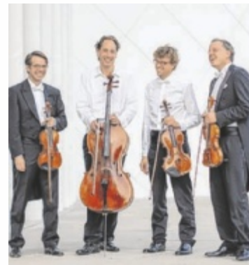
Varian Fry Quartett