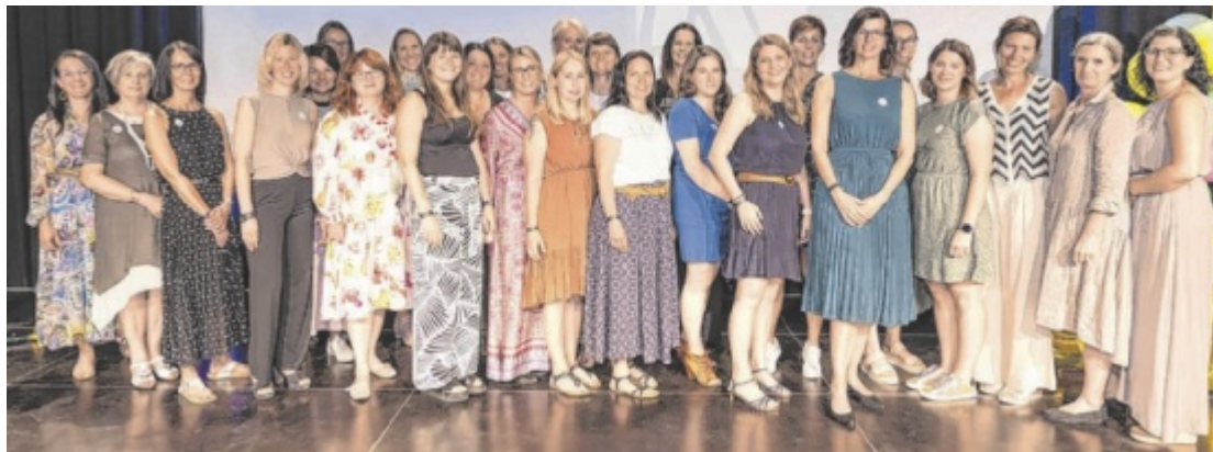
Beim Jubiläum 25 Jahre MOKI in der Spinnerei Traun

Zum MOKI-Jubiläumsfest waren Patienten und ihre Angehörigen sowie die Mitglieder des MOKI OÖ-Teams gemeinsam mit ihren Familien eingeladen. Auch zahlreiche Wegbegleiter und Sponsoren nahmen teil. Gefeierte wurde mit einem stimmungsvollen Festakt, einem bunten Spieleprogramm, gesponsert von der OÖ Kinderwelt, einem Maskottchen-Malwettbewerb, einem Eisbus und einer Fotobox, die viele schöne Erinnerungen festhielt.