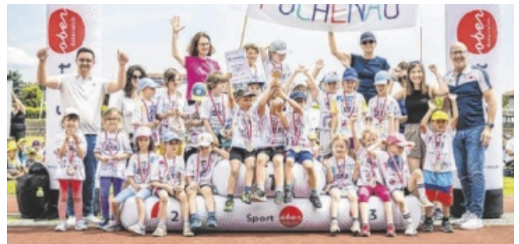
Bei der Kindergarten-Olympiade ist jedes Kind ein Gewinner.