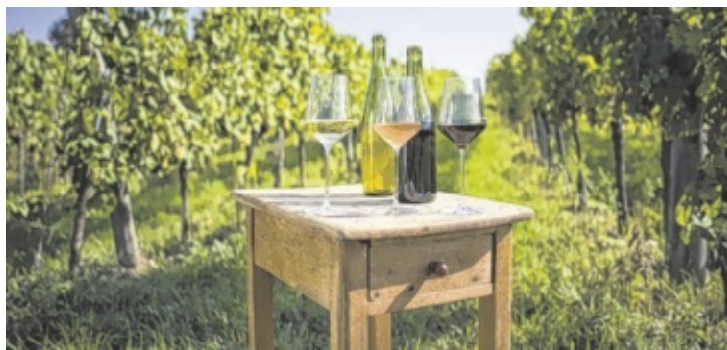
Wein im Weingarten beim Tag der offenen Kellertür genießen.