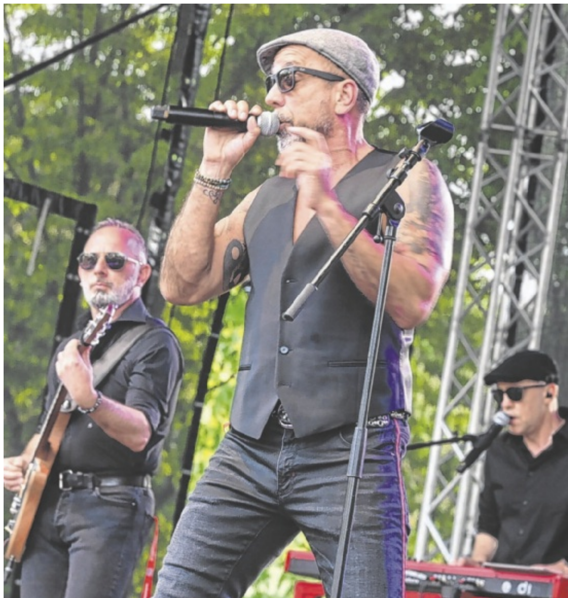
Doktor Südbahn & die SymPartie Ein Tribute-Konzert auf den Spuren des Willi Resetarits, nahe am Original, kommt ins Valentinum, St. Valentin. Tips verlost 2x2 Eintrittskarten. Seite 18 / Foto: Angela Maier