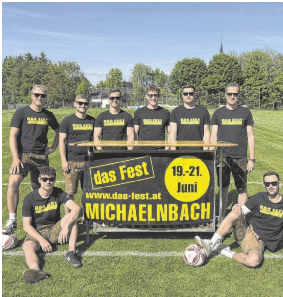
Brass-Fest in Michaelnbach „Das Fest“ in Michaelnbach geht von Donnerstag, 19. bis Samstag, 21. Juni, in die nächste Runde. Tips verlost 3x2 Karten für das Brass-Fest am Freitag. Seite 25