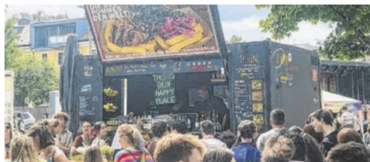
Genussstationen beim Street Food Market in Haag

köstlichen Gerichten aus aller Welt. Das Tolle daran ist: Die Gerichte werden im Foodtruck frisch zubereitet und direkt in die Hand der Gäste serviert. Neben einer gemütlicher Atmosphäre gibt es gute Musik von DJ The_BGM & Schmidl und weitere Überraschungen. Geöffnet hat der Streetfood Market in Haag am Samstag von 11 bis 24 und am Sonntag von 10 bis 19 Uhr. Der Eintritt ist frei. ■