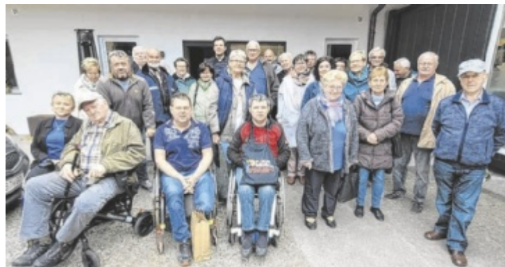
Eine schokoladige Exkursion nach Meggenhofen