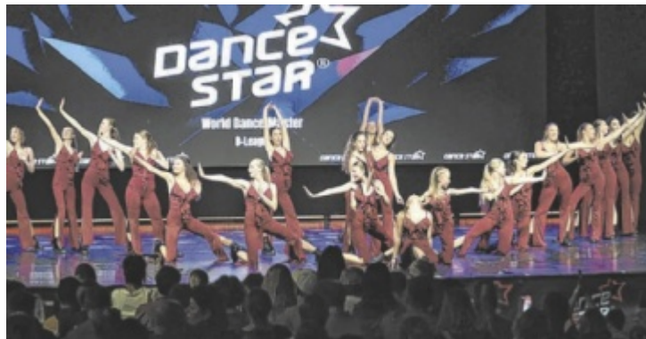
Das Tanzwerk der Tanzschule Hippmann in Wels hat in Porec Medaillen abgeräumt.