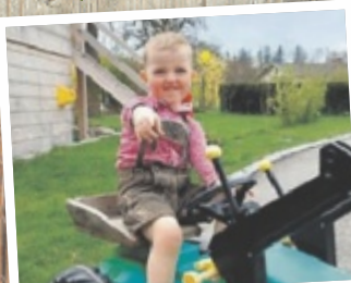
Yvonne aus Grieskirchen