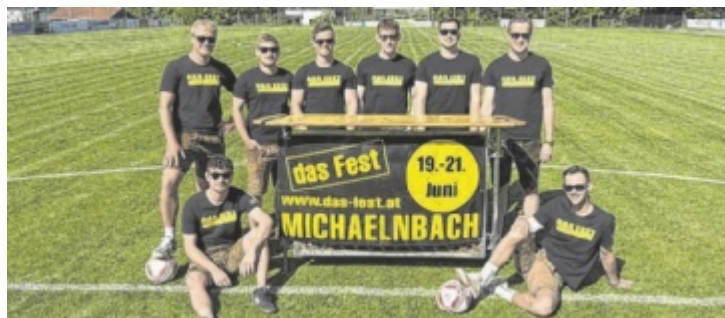
Die Sportunion Michaelnbach lädt zu „Das Fest 2025“.

Der diesjährige Veranstalter, die Sportunion Michaelnbach, lädt am Donnerstag, 19. Juni, ab 10.30 Uhr zum weithin bekannten Frühschoppen – heuer musikalisch umrahmt vom Musikverein Michaelnbach. Am Abend zu „Auf'd Nacht in Tracht“ betreten „Die glorreichen Halunken“ die Bühne. Beim Frühschoppen gilt für alle freier Eintritt, ab 19 Uhr nur noch