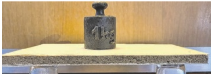
Die MEDIWALLS Platte überzeugt unter anderem mit Bruchfestigkeit.

Ab 2026 dürfen zudem Gipskartonabfälle nicht mehr deponiert werden. Die MEDIWALLS Trockenbauplatte aus OÖ möchte die entstehende Lücke füllen.