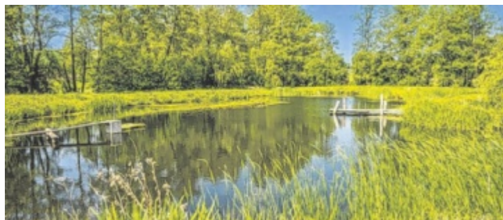
Wunderbarer Blick auf den großen Teich

Auf rund drei Hektar vormals überflutetem Grünland entstand durch innovative Erdarbeiten und nachhaltige Bepflanzung ein vielfältiges Ökosystem aus Teichen, Dämmen, Obst- und Nussbäumen, Wildobsthecken, Wildkräutern und vielem mehr. Der Wald-Wasser-Garten erfüllt dabei mehrere Funktionen zugleich: Hochwasserschutz, Förderung der Biodiversität, natur-