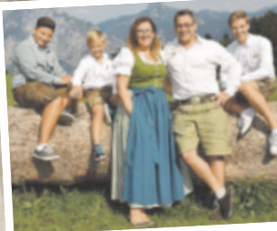
Günther aus Vöcklabruck