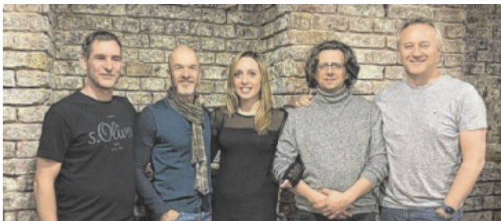
Die Formation „Salty Dogs and a Biscuit“ kommt aus Wien nach Pram.