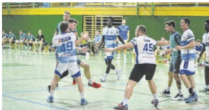
Die Saison endet für den HC Eferding mit Platz vier der Tabelle.