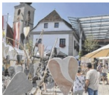
Buntes Markttreiben

Alle neuen Junitermine bis 2030 sind bereits auf sierning.gv.at bis 2030 eingetragen. Damit können Kunsthandwerker langfristig ihre Ausstellungstermine planen. Zwei Tage lang steht Sierning wieder ganz im Zeichen von Kunst, Design und Kunsthandwerk. Das Ausstellungsgelände mit über 3.000 Quadratmetern im Schloss, im Gemeindefoyer, im überdachten Schlosshof, auf den Schlossvorplätzen und am Oberen Kirchenplatz bieten überschaubare und saubere Flanierzonen. Alle Areale fließen ineinander und sind in Rundkursen erlebbar, was für die Besucher kurze Wege bringt.