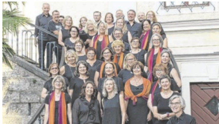
Der Chor „Choice of Voice“ stellt sich in den Dienst der guten Sache.

Damit auch künftig letzte Wünsche von schwerkranken Personen erfüllt werden können, geht