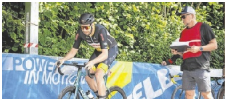
288 Fahrer waren am Start.

ten. Doch zur Halbzeit führten die Linzer mit 25:21. In der zweiten Spielhälfte versuchten die Eferdinger aufzuholen, doch am Ende stand 39:46 auf der Anzeigetafel. Somit verabschiedet sich der HC Eferding mit dem vierten Tabellenplatz in die Sommerpause. ■