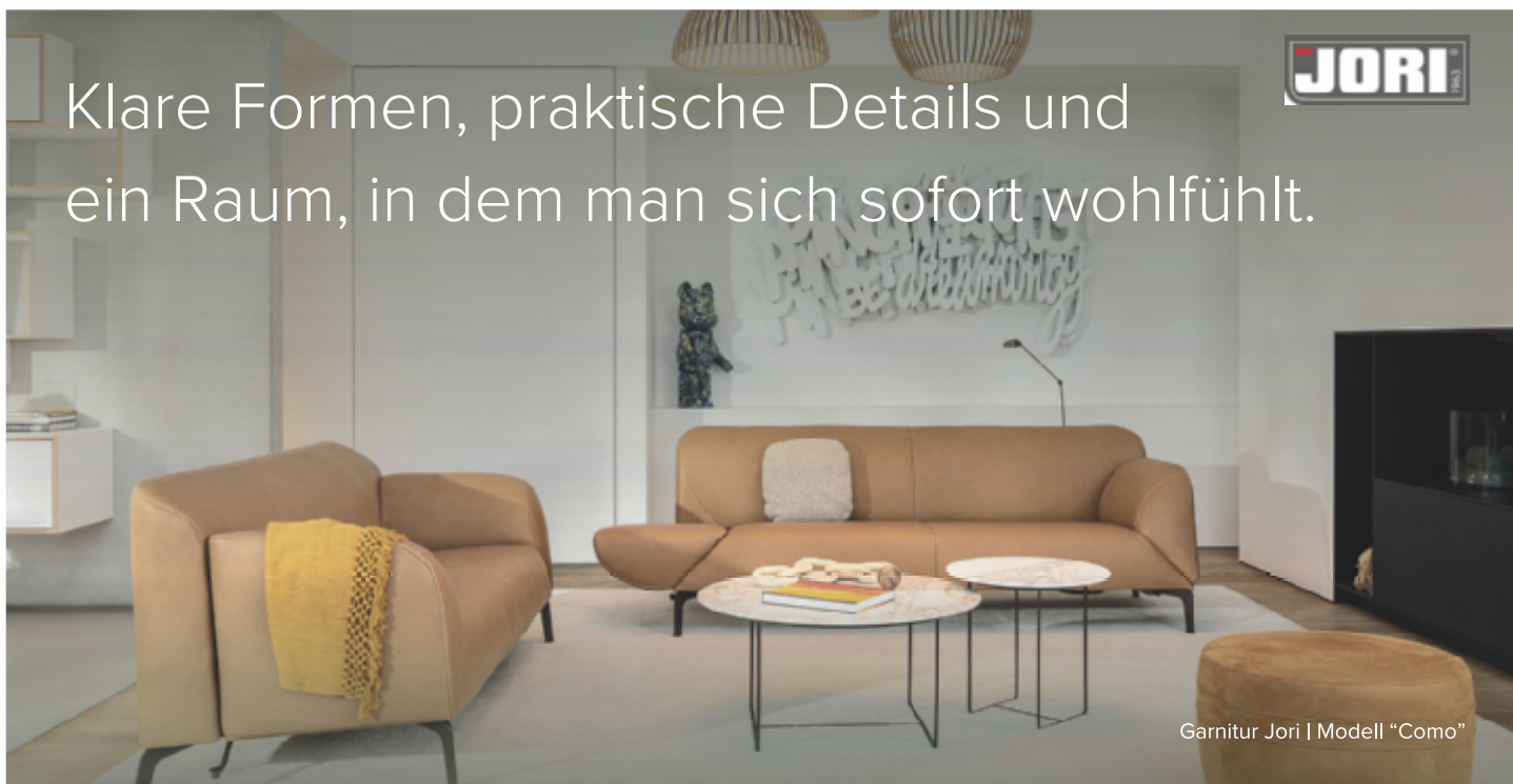
Garnitur Jori | Modell "Como"

Klare Formen, praktische Details und ein Raum, in dem man sich sofort wohlfühlt.