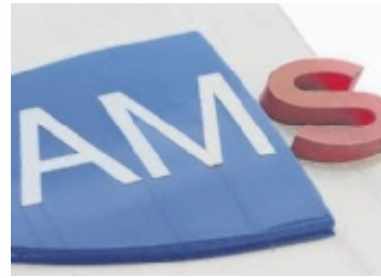
Die Arbeitsmarktzahlen für Mai liegen vor.

BEZIRK GRIESKIRCHEN/BEZIRK EFERDING. Bei 5,0 Prozent liegt die Arbeitslosenquote in Oberösterreich mit Mai. Die Bezirke Grieskirchen und Eferding halten sich nach wie vor auf Rang drei in OÖ-Vergleich mit einer Arbeitslosenquote von je 3,0 Prozent.