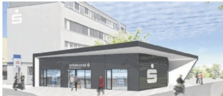
Eine Darstellung der zukünftigen Sparkassen-Filiale an der Grieskirchner Stadteinfahrt

Der Umbau des Gebäudes erfolgt in zwei Etappen. Im Juni wird zunächst der Zugang zu den Arztpraxen in den Obergeschossen adaptiert. Im zweiten Bauabschnitt will man das gesamte Erdgeschoss in ein modernes, Kompetenzzentrum für alle finanziellen Bedürfnisse verwandeln. Sämtliche Umbauarbeiten wer-