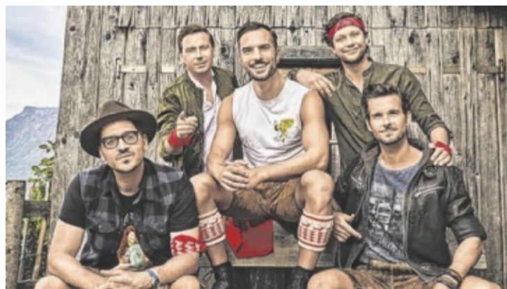
Die Mountain Crew tritt beim Feuerwehrfest in St. Marienkirchen auf.

Der Bezirksbewerb am Samstag, 28. Juni, startet um 11 Uhr am Sportplatz. Um 18 Uhr findet die Siegerehrung beim Feuerwehrhaus statt. Der Einlass zum Lederhosenevent mit DJ Paradox und der Mountain Crew beginnt um 20.30 Uhr. Die Mountain