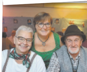
Anita aus Wels