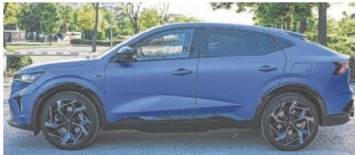
Der Renault Rafale Atelier Alpine E-Tech Plug-in-Hybrid 300 4x4

Zur vollständigen Glückseligkeit des Testwagens fehlen nur noch Harman-Kardon-Paket, Head-Up-Display, Panorama-Glasdach und die schon ziem-