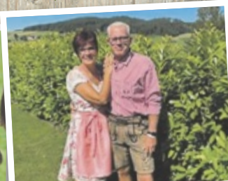
Günther aus Linz