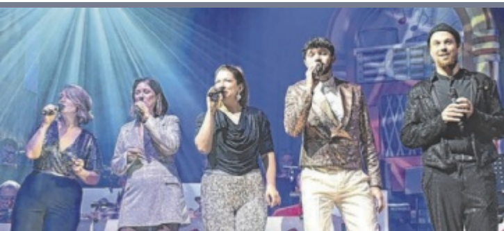
Gänsehautmomente Beim 6. Bad Haller Big-Band-Wurlitzer in der Jahnturnhalle wurden dem Publikum Gänsehautmomente beschert. Nachbericht, Fotos und Videolink auf www.tips.at/n/686036