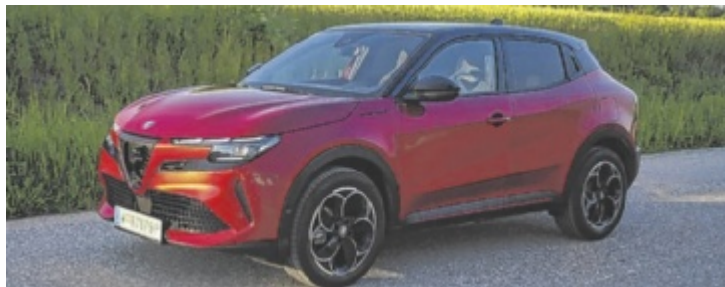
Der Alfa Romeo Junior Elettrica Speciale ist ab 41.900 Euro zu haben.

So wie der neue Einstiegs-Alfa aussieht, hätten sie ihn auch „Rübezahl“ nennen können. Sein Design ist einzigartig und fast frivol aufregend – da kommt kein Konkurrent mit. Essentiell, denn