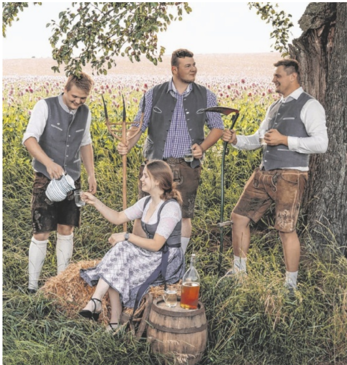
Mostkost Die besten Moste aus der Umgebung werden zu Pfingsten in Adlwang verkostet. Zudem wartet auf die Besucher am Sonntag, 8. Juni, beim Bauer in der Haid ein buntes Rahmenprogramm. Seite 20