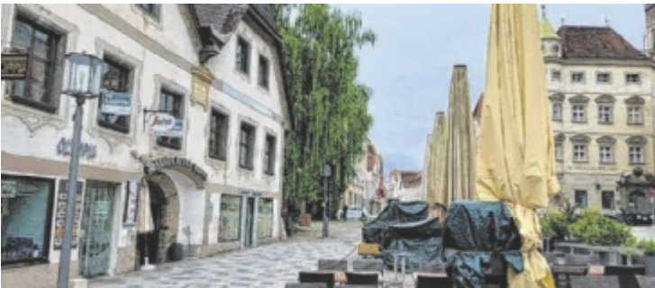
Aus dem ehemaligen Segafredo wird das neue Lokal „Domizil“.