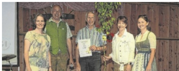
Die Landjugend Adlwang-Pfarrkirchen und die Bauernschaft freuen sich auf die Mostkost am Sonntag, 8. Juni.

Instrumente mitzubringen. Das OÖ. Heimatwerk verlost ein Dirndl bzw. eine Lederhose im Wert von rund 700 Euro. Vorverkauf: 20 Euro (Raiffeisenbank Sierning, Landhotel Forstthof), freie Platzwahl ■