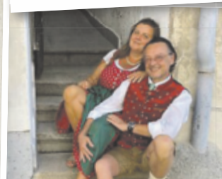
Isolde aus Steyr