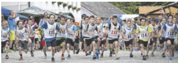
Der Großraminger Ortslauf mit Wicki-Cup findet am Samstag statt.