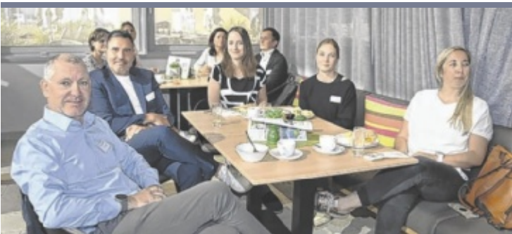
HR-Talk New Work, Generation Z und zukunftsorientierte Personalarbeit standen beim HR Talk im Hotel Harry's Home im Fokus. Eingeladen hatte die Zukunftsregion Steyr. Details: www.tips.at/n/686194

gearbeitet und wissen, dass es in Steyr eine große Community gibt, die sich solch ein Lokal wünscht“, wird Mayr in den OÖN zitiert. Der 27-Jährige hat sich österreichweit einen Namen als DJ Feybl gemacht. „Wir wollen mit einer coolen Location wieder Leben ins Stadtzentrum bringen.“ Als Namen für das Lokal wählte das Trio „Domizil“, geöffnet ist künftig von Mittwoch bis Sonntag. ■