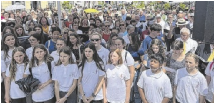
Beim Sänger-Sommer-Fest auf dem Stadtplatz wirken 300 Stimmen mit.

dort einen Flashmob, der auf ein besonderes Mitgliedsjubiläum Bezug nimmt. Das Fest endet mit einem gemeinsamen Singen aller Mitwirkenden. ■