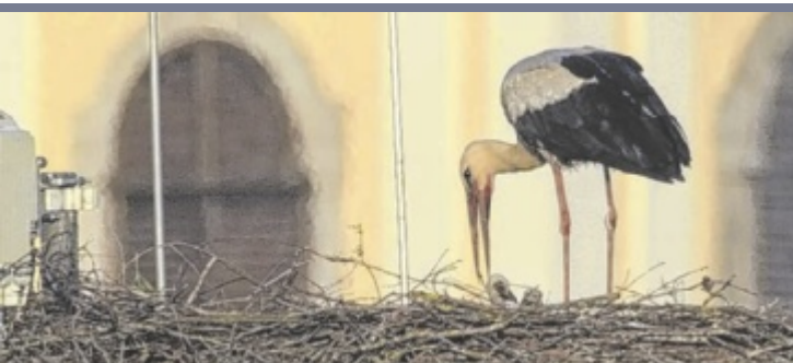
Drei Küken Mitte Mai schlüpften drei Weißstorchküken im Horst am Handymast bei der Firma Zorn in Pfarrkirchen. Bereits Anfang Juli werden sie flügge und auf ihre eigenen Beine bzw. Flügel angewiesen sein.

Steyrdorf) und war rasch vergriffen. Jetzt erfolgte die Neuauflage. Autorin Krisper (85) war mit Dunkl befreundet. Sie präsentiert das Buch im Rahmen der Literartage Steyr am Samstag, 7. Juni, um 10.30 Uhr im Dunklhof. ■