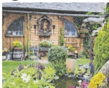
Margarete Schöfer aus Freistadt holte sich 2024 den Titel „Schönster Garten“.

Wer sicher ist, dass sein Garten der schönste Platz daheim in der Natur ist, sollte sich online unter www.tips.at/garten registrieren, ein Foto vom Garten hochladen, Daten eingeben, und schon ist man beim Voting mit dabei. Um mehr Stim-