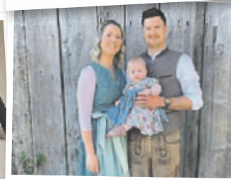
Silke aus Kirchdorf