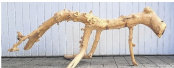
Heckosaurus Rex-iii von Hermann Eckerstorfer