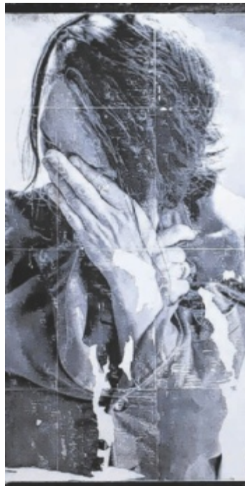
„Die verlorene Seele“ von Hannes Eilmsteiner

Die Vernissage findet am 6. Juni mit Country Blues von „The Reds & Blues“ statt. ■