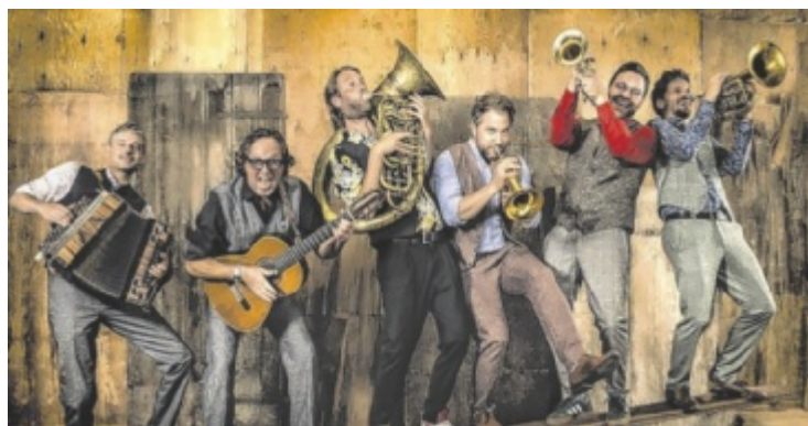
Die Kombo „Kapelle So&So“ mischt das Musiktheater Linz auf.

Mittwoch, 11. Juni , 19 Uhr Villa Sinnenreich, Rohrbach-Berg Die Ausstellung ist zu den Öffnungszeiten des Museums bis 20. September bei freiem Eintritt zu sehen. Tel. 07289 22458, www.villa-sinnenreich.at