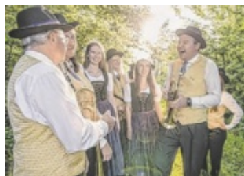
Jubiläum 165 Jahre Musikverein Kirchberg werden mit dem Bezirksmusikfest am 14. und 15. Juni gefeiert. Seite 7 / Foto: MV Kirchberg