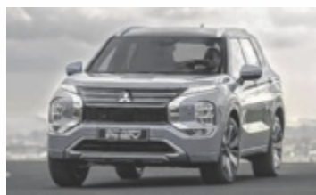
Der neue Mitsubishi Outlander

Mit der vierten Generation des Outlander feiert Mitsubishi ein starkes Comeback im SUV-Segment. Das neue Flaggschiff der Marke überzeugt mit modernster Plug-in-Hybrid-Technologie, elegantem Design und Ausstattung auf Oberklasse-Niveau.