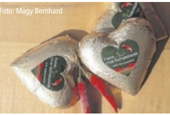
Chili-Schoko-Herz von Kurt Wöss