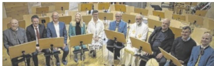
Das Probenlokal wurde mit viel Prominenz eröffnet.

Er fügte aber auch an, dass hier weit mehr als ein neuer Raum für Musikproben eröffnet wurde: „Wir feiern ein Stück gelebte Zukunftspolitik. Ein Projekt, das zeigt, dass wir als Gemeinde Weichen stellen, Chancen nutzen und Verantwortung übernehmen können.“ Gemeint ist damit der Ankauf der Räumlichkeiten im Dynacenter durch die Marktgemeinde. „Ohne diesen Input wäre das gesamte Dynacenter in dieser Form nicht realisierbar gewesen, denn unser Kauf