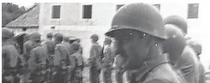
Erinnerungen werden in St. Stefan-Afiesl geteilt.

Das Projekt „Frühling 1945 – Kriegsende und Frieden in Sankt Stefan-Afiesl“ verbindet historische Fakten mit regionalen Quellen und den persönlichen Erinnerungen noch lebender Zeitzeugen aus St. Stefan und Afiesl. Ihre Geschichten sollen erhalten bleiben und künftigen Generationen