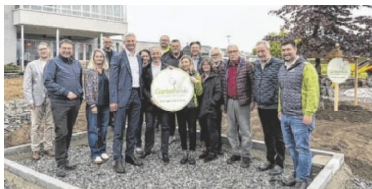
Die Arbeiten schreiten voran, drei große Bäume wurden gepflanzt.