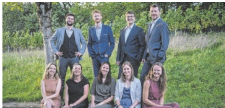
Neun Stimmen, die bewegen

Im A Capella-Programm „Verbundenheit – zwischen dieser Welt und der Ewigkeit“ beschäftigen sich die neun Mitglieder des Vokalensembles Calida mit Themen, die verbinden. Die Musik wird zum Träger von Emotionen und Erinnerungen, die einladen innezuhalten, zu fühlen und nachzudenken. Es geht um Geschichten von Liebe, Freundschaft und Geborgenheit, von den stürmischen Höhen der Leidenschaft bis zu Momenten der Sehnsucht, des Verlustes und der Verbindung zum nächsten Leben.