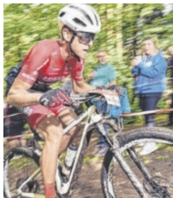
Granitmarathon Zu Pfingsten wird in Kleinzell beim Granitmarathon in die Pedale getreten. Seite 23