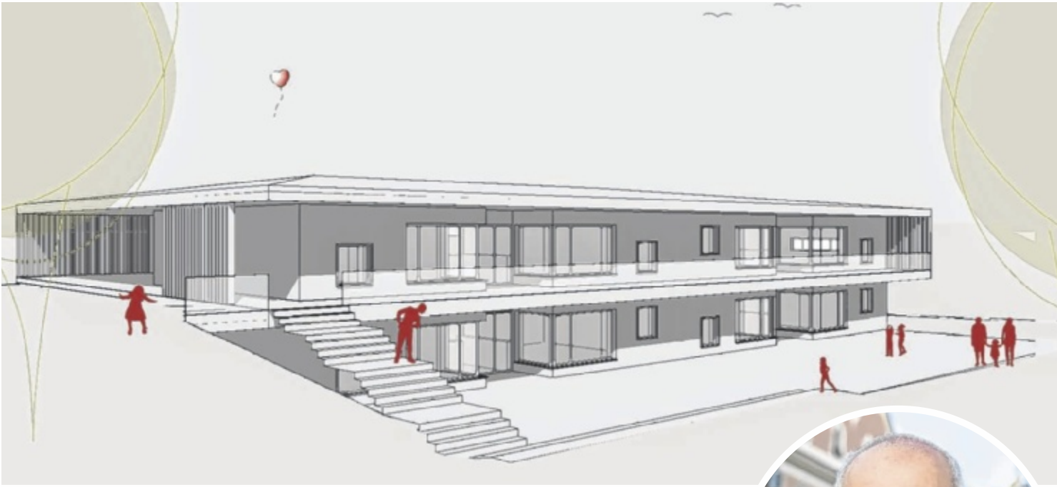
Das Architekturbüro „Two in a Box“ hat den neuen Kindergarten für Neufelden und Altenfelden geplant. Die Fertigstellung ist für Sommer 2027 geplant.

Bilder: Marktgemeinde Neufelden (Portrait)/ Two in a Box