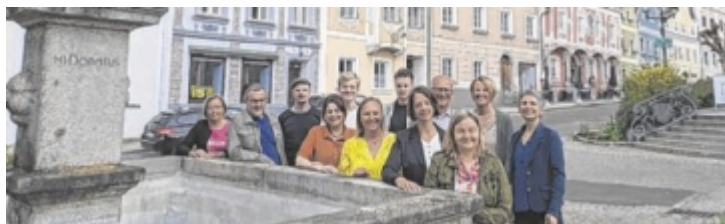
Das Agenda.Zukunft-Kernteam lädt zum Mitmachen ein.

So werden etwa vom Team „Nah versorgt, ohne Leerstand“ Ideen