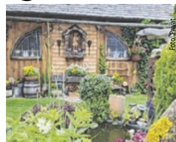
Margarete Schöfer aus Freistadt holte sich 2024 den Titel „Schönster Garten“.

Wer sicher ist, dass sein Garten der schönste Platz daheim in der Natur ist, sollte sich online unter www.tips.at/garten registrieren, ein Foto vom Garten hochladen, Daten eingeben, und schon ist man beim Voting mit dabei. Um mehr Stim-