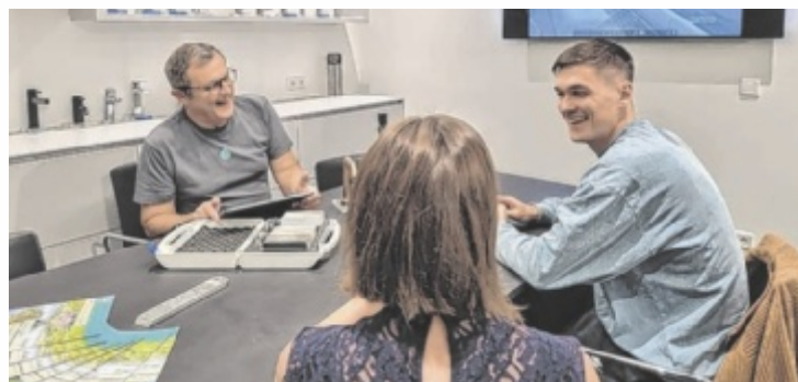
Das Team von Gahleitner in Neufelden berät Kunden individuell.

Großer Wert wird auf individuelle Beratung und nachhaltige Lösungen gelegt, die zum Kunden und seinem persönlichen Zuhause passen. Außerdem plant das Team von Gahleitner Schwer-