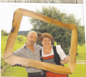
Roland aus Freistadt