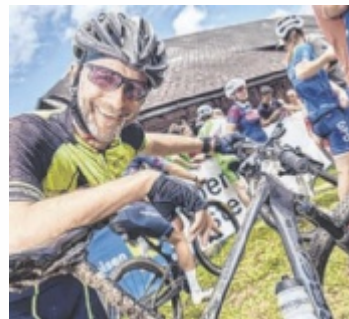
Entweder selber mitfahren oder anfeuern kommen!

Die beeindruckende Landschaft und die anspruchsvollen Strecken machen den „Raiffeisen Granitmarathon“ nicht nur für die Sportler zu einem Highlight – auch Zuschauer kommen voll auf ihre Kosten. Die mitreißende Atmosphäre entlang der Strecke zieht Jahr für Jahr tausende Be-