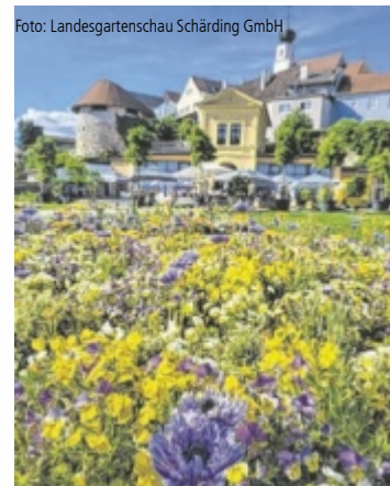
Am 12. Juli lädt Tips zum Besuch der Landesgartenschau ein.

SCHÄRDING. Noch bis 5. Oktober sind Teile Schärdings in unmittelbarer Nähe zur bayerischen Grenze blühende Oasen. Die Landesgartenschau „INNSgrün“ stellt nicht nur ein optimales Ausflugsziel dar, sondern bietet auch ein Paradies zum Entspannen und Entdecken. Vier unterschiedlich gestaltete, einzigartige Geländebereiche formen das elf Hektar große Gartenschau Gelände und geben Einblicke in die neuesten Gartentrends, zeigen liebevoll gestaltete Beete, bieten zahlreiche Ausstellungsbeiträge und Kunstobjekte sowie Spiel- und Erholungsflächen. Mehr dazu gibts online unter www.innsgruen.at . Tips verlost für den Tips-Tag am 12. Juli 70x2 Eintrittskarten. ■