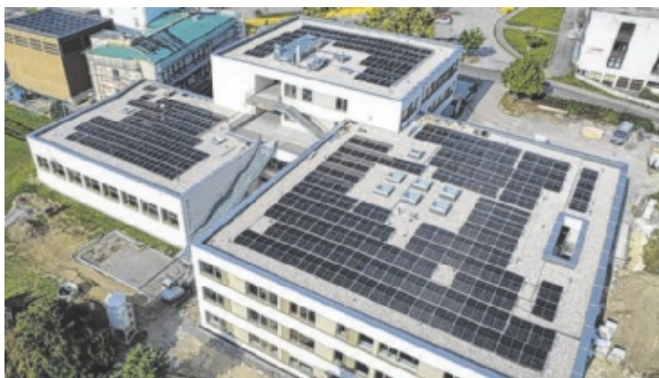
Rohrbach-Berg investiert weiterhin in klimafreundliche Energieversorgung – hier der Blick auf das Schulzentrum.