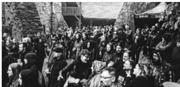
Die Teufeljagd auf Piberstein zieht Freunde der Szene magisch an.