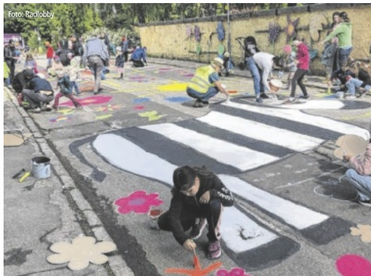
Nach der Rundfahrt sorgten die Kinder für bunte Straße vor dem Kindergarten.

Sie folgten damit der Einladung der Radlobby Oberes Mühlviertel und drehten auf Rädern, Laufrädern und Scootern – gesichert durch die Polizei – eine Runde durch die Bezirkshauptstadt. Die Fahrt endete vor dem Rohrbacher Kindergarten, wo im Anschluss die Straße mit bunten Bildern verschönert wurde. Unter Mithilfe von Elternvertreterin Ruth Haudum entstand auf dem von der Gemeinde gereinigten und abgesperrten Straßenstück ein farbenfroher Kosmos aus Blumen und