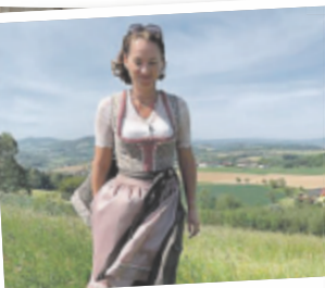
Birgit aus Urfahr-Umgebung