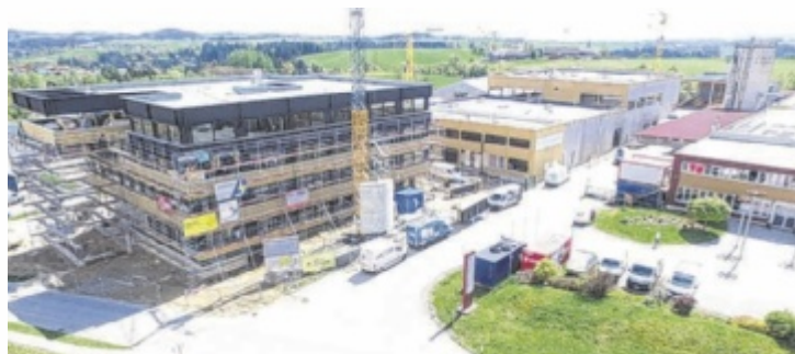
Die Tischlerei Scheschy erweitert ihren Standort in Neufelden.

Das Bürogebäude wird in unmittelbarer Nähe zum bestehenden Betrieb errichtet und bietet nicht nur dringend benötigten Platz für das wachsende Scheschy-Team, sondern auch für andere Unternehmen. So wird unter anderem LeitnerLeitner – eine der größten Steuerberatungsgesellschaften Österreichs – einen neuen Standort im Businesscenter eröffnen. Auch eine Filiale der Sparkasse findet in einem Teil des Gebäudes Platz. Da es im Ortskern kein adäquates Geschäftslokal mehr