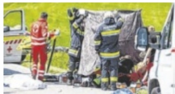
Motorrad und Pkw prallten zusammen.

Am Samstag kam es zu Mittag auf der Landesstraße in unmittelbarer Nähe zum Ortsgebiet von Lembach zu einem Zusammenstoß zwischen einem Motorrad und einem Pkw. Eine 19-jährige Autolenkerin aus dem Bezirk dürfte beim Abbiegen die entgegenkommende 40-jährige Motorradlenkerin übersehen haben, die in einiger Entfernung hinter ihrem Freund in Richtung Altenfelden unterwegs war. Die Bikerin wurde beim Zusammenprall rund 30 Meter weit weggeschleudert und erlitt schwere Verletzungen am rechten Bein. Sie kam mit dem Rettungshubschrauber ins Spital. Ein Verkehrsunfall mit drei Verletzten forderte die Einsatzkräfte am Sonntagvormittag. Zwei Autos