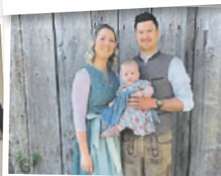
Silke aus Kirchdorf