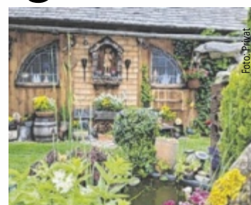
Margarete Schöfer aus Freistadt holte sich 2024 den Titel „Schönster Garten“.

OÖ/NÖ. Tips und Husqvarna Austria suchen das „schönste Gartenfoto“. Ob Garten, Balkon oder Terrasse, von 4. bis 27. Juni 2025 können Fotos eingereicht und online auf tips.at abgestimmt werden.