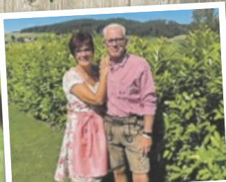
Günther aus Linz