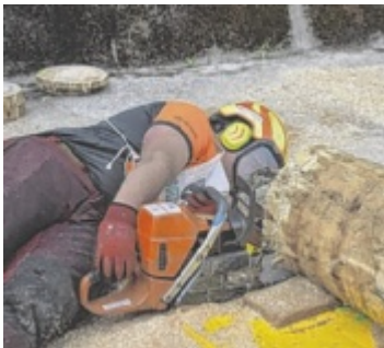
Schnitt für Schnitt zur Bestleistung: Konzentration und Technik entscheiden im Wettbewerb.

Bei strahlendem Sonnenschein stellten sich die Teilnehmer sieben anspruchsvollen Disziplinen: Kettenwechsel, Kombinationschnitt, Präzisionschnitt, Geschicklichkeitsbewerb, Durchhacken, Fallkerb und Entasten. Am Ende eines intensiven Wettbewerbstages standen die Sieger fest: Im Bezirk Kirchdorf holte sich