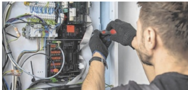
Die AK betont: Nur wer informiert ist und Angebote vergleicht, kann sich vor unerwartet hohen Handwerkerrechnungen schützen.

Die AK empfiehlt Konsumenten, vor Beauftragung eines Unternehmens mehrere Kostenvoranschläge einzuholen. Diese sollten detailliert aufgeschlüsselt sein – nach Arbeits-, Material- und sonstigen Kosten. Ein verbindlicher Kostenvoranschlag