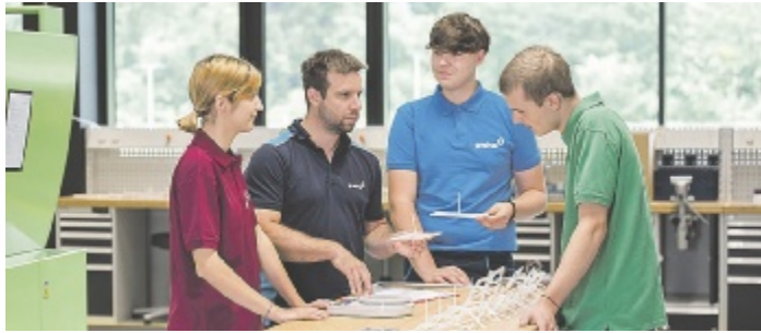
Schon während der Lehrzeit arbeiten die Lehrlinge mit nachhaltigen und recycelten Materialien.

In den Ausbildungsmodulen der Kunststofftechnologie werden die Jugendlichen beispielsweise mit der Zerkleinerung von