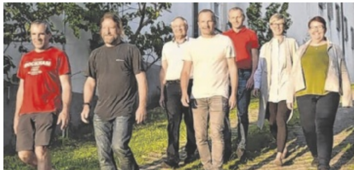
Die EEG lädt alle Interessierten zu zwei Infoabenden ein.

Das gemeinsame Ziel ist es, möglichst viele Menschen aus der Region aktiv an der Energiewende teilhaben zu lassen. Getreu dem Leitspruch „Alle in der Region bei der Energiewende mitzunehmen“ setzt die Gemeinschaft auf einfache Beteiligungsmöglichkeiten, faire Konditionen – ganz ohne Aufnahmegebühr oder laufenden Mitgliedsbeitrag. Durch die enge Zusammenarbeit mit der bestehenden „Erneuerbare Energiegemeinschaft Kremstal“ (ehemals EEG Wartberg an der