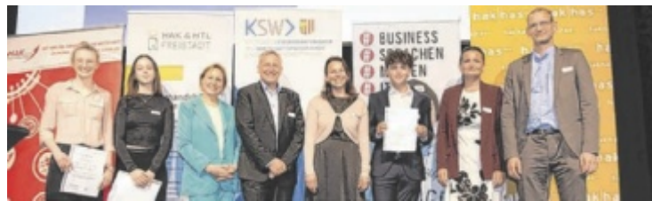
Zertifikatsverleihung an engagierte Schüler

WARTBERG. Auf der Pyhrnbahnstrecke bei Wartberg geriet ein mit Gleisbaumaschinen bestückter Zug in Brand. Ein am Zugende angehängter Oberbauwagen fing Feuer, das vom Lokführer rechtzeitig bemerkt wurde. Der Zug konnte gestoppt und die Feuerwehr alarmiert werden. Fünf Feuerwehren waren im Einsatz. Der Bahnverkehr war mehrere Stunden unterbrochen. Die Brandursache ist noch unklar, ein technischer Defekt wird vermutet. Ein Brandsachverständiger wurde zur Klärung hinzugezogen.