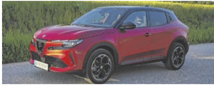
Der Alfa Romeo Junior Elettrica Speciale ist ab 41.900 Euro zu haben.

So wie der neue Einstiegs-Alfa aussieht, hätten sie ihn auch „Rübezahl“ nennen können. Sein Design ist einzigartig und fast frivol aufregend – da kommt kein Konkurrent mit. Essentiell, denn