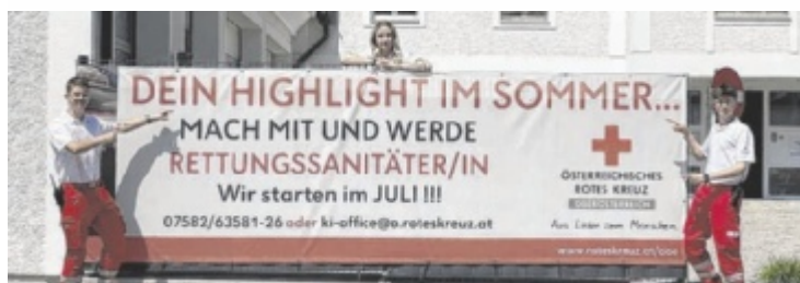
Im Juli findet die Ausbildung statt.

Zudem sei die Sehkraft unter Wasser entscheidend. Brillen oder Kontaktlinsen seien ungeeignet, da sie entweder die Tauchermaske undicht machen oder verloren gehen könnten. „Daher sollte man sich eine Tauchermaske mit entsprechender optischer Korrektur kaufen“, so der Mediziner. Bei chronischen Erkrankungen wie Diabetes oder Bluthochdruck bedeutet das nicht automatisch ein Tauchverbot, schränkt aber die Möglichkeiten ein. Eine Tauchtauglichkeit könne auch mit Auflagen erteilt werden, etwa hinsichtlich Tiefe oder Strömungsbedingungen. ■