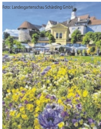
Am 12. Juli lädt Tips zum Besuch der Landesgartenschau ein.

SCHÄRDING. Noch bis 5. Oktober sind Teile Schärdings in unmittelbarer Nähe zur bayerischen Grenze blühende Oasen. Die Landesgartenschau „INNsgrün“ stellt nicht nur ein optimales Ausflugsziel dar, sondern bietet auch ein Paradies zum Entspannen und Entdecken. Vier unterschiedlich gestaltete, einzigartige Geländebereiche formen das elf Hektar große Gartenschau Gelände und geben Einblicke in die neuesten Gartentrends, zeigen liebevoll gestaltete Beete, bieten zahlreiche Ausstellungsbeiträge und Kunstobjekte sowie Spiel- und Erholungsflächen. Mehr dazu gibts online unter www.innsgruen.at . Tips verlost für den Tips-Tag am 12. Juli 70x2 Eintrittskarten. ■