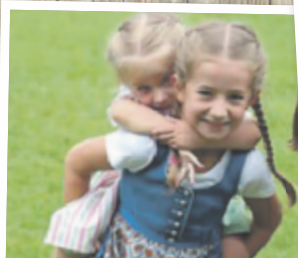
Astrid aus Steyr