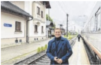
Landesrat Stefan Kaineder am Bahnhof Hinterstoder

HINTERSTODER/VORDERSTODER. Die Pyhrnstrecke wird weiter modernisiert: Der Abschnitt zwischen den Bahnhöfen Hinterstoder und Pießling-Vordersoder soll zweigleisig ausgebaut werden. Der entsprechende Umweltverträglichkeitsbescheid (UVP) wurde nun genehmigt.