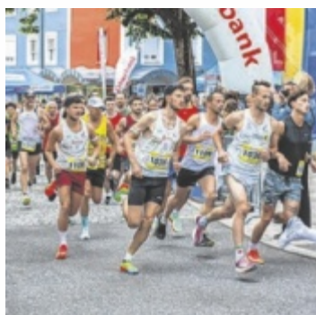
Start des Hauptlaufs

Trotz durchwachsener Wetterlage nahmen rund 300 Sportler am Kirchdorfer Stadtlauf und Über-Drüber Marathon teil, ausgerichtet von der Laufgemeinschaft Kirchdorf. Der Halbma-