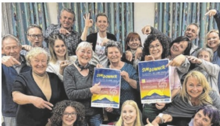
Singkreis lädt zu „Sundowner“ auf dem Rieder Ortsplatz