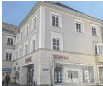
RE/MAX hat seinen Sitz in Braunau direkt am Stadtplatz

Ein besonderer Meilenstein: Jedes dritte Einfamilienhaus im Bezirk Braunau wird heute durch RE/MAX Innova vermittelt. Zudem findet an nahezu jedem Werktag ein Notartermin statt. Der Honorarumsatz stieg von 85.000 Euro im Gründungsjahr auf über zwei Millionen Euro im Jahr 2021 an. ■