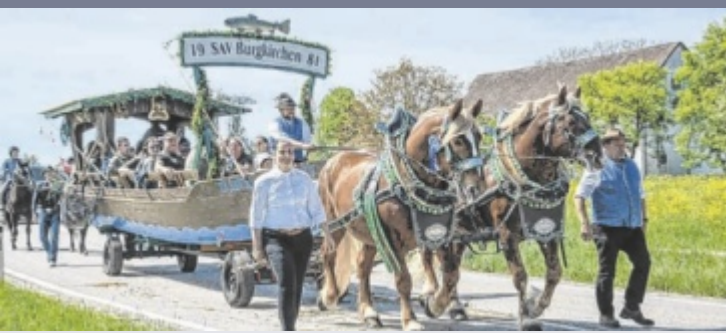
Große Beteiligung Über 40 Gespanne beteiligten sich beim 100. Jubiläums-Georgiritt in Burgkirchen. Darunter auch viele Pferdefreunde aus Bayern, u. a. Roßbach, Ruhstorf, Pleiskirchen, Offenbach/By und Hutthurm