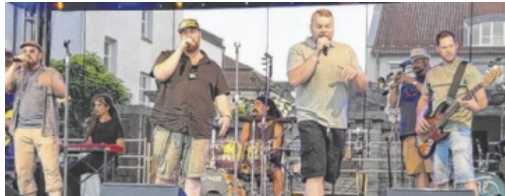
Bavaroots werden den Abschluss am Freitagabend bilden.

Drei bekannte und etablierte Bands sind ebenso mit dabei wie zwei Newcomer, die zeigen, was in ihnen steckt: Den Auftakt macht die Band des Tassilo-