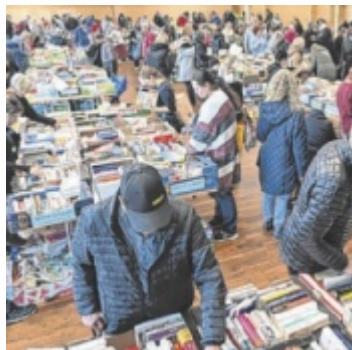
Seit 15 Jahren ist der Bücherflohmarkt beliebt bei Lesefreunden