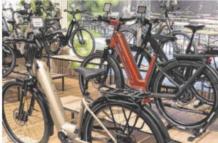
Über 400 Räder findet man in der Ausstellung, weitere 1.200 sind lagernd.

Auf diesen Trend setzt die Firmengruppe Weko und hat mit dem „Radlherz“ ein neues Zentrum für Fahrradbegeisterte geschaffen. Nach der Gründung 2022 in Hebertsfelden wurde das Konzept nun am Standort Pfarrkirchen ausgebaut: Im Möbelhaus entstand eine eigenständige Fahrradabteilung, die über die Verkaufsräume sowie einen separaten Eingang neben der Warenausgabe erreichbar ist. Seit dem 25. April präsentiert das „Radlherz“ auf einer großzügigen Fläche über 400 Fahrräder. Im Lager stehen weitere 1.200 Mo-