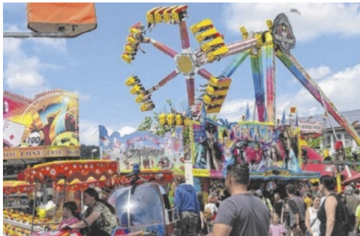
Viele Fahrgeschäfte sorgen für Nervenkitzel.

Die Jüngsten freuen sich erfahrungsgemäß auf das kunterbunte Kinderkarussell mit dem begehrten Feuerwehrauto oder Hubschrauber. Nicht minder besetzt sind die Autoscooter, die einfach immer noch beliebt sind. Vor allem die „wilden“ Geschäfte sind aber der Anziehungspunkt auf dem Vergnügungspark, z. B. der Polyp, bei dem so mancher die Orientierung verliert. Für Familien bietet sich eine Fahrt im Riesenrad an, ein Gang durch das Hindernis-Labyrinth vom Coco Bongo oder ganz neu: