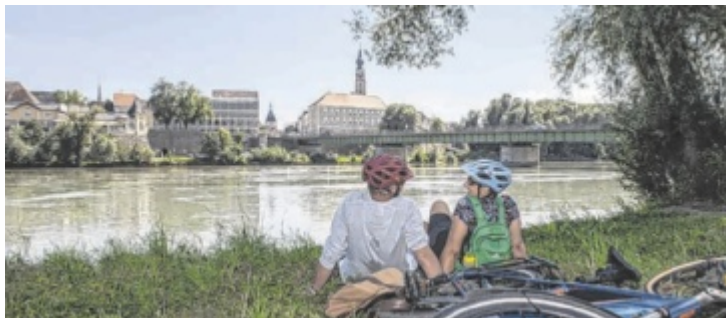
Abwechslungsreiche Touren erwarten die Radler mit der neuen Radkarte.

Entdecker-Radtour nennt sich die neue, 180 Kilometer lange Schleife, die man gemütlich in drei bis vier Tagen „erradeln“ kann. Sie ist eingebunden in die neue Radkarte, die man jederzeit kostenlos im Tourismusbüro in Braunau erhält. Ja, man kann auch direkt vor der Haustür eine mehrtägige Tour starten: Im Süden hat man die Wahl zwischen einer Seenvariante und einer Panoramaversion. Im Westen – entlang von Inn und Salzach – kann man entweder „drent“ oder