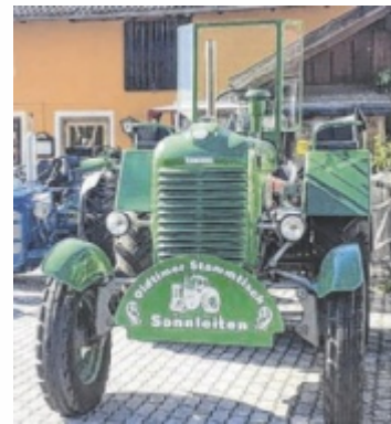
Erstmals: Traktortreffen

Ein echter Hingucker wird dieses Jahr das Oldtimer-Traktortreffen am Sonntag. In Zusammenarbeit mit dem Oldtimer Traktorstammtisch Utten-dorf/Sonnleiten wird es erstmals