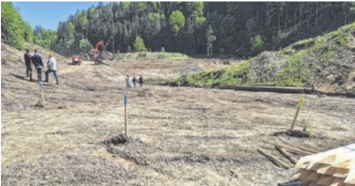
Die ersten Aushubarbeiten lassen die Dimension des Beckens erkennen.

Entstehen soll ein 119 Meter langer, 9,75 Meter hoher und fast 49 Meter breiter Damm mit einem