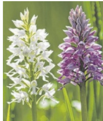
Pflanzen der Inndämme

Am Dienstag 17. Juni lautet das Thema „Wasser ist für alle da!“ Wie geht eine Gemeinde damit um, wenn plötzlich Wasserknappheit herrscht? In dem Planspiel beschäftigen sich Jugendliche in sieben verschiedene Interessensgruppen zum Thema Wasser. Am Ende vertritt jede Gruppe ihre spezifischen Interessen in einer „Bürgerversammlung“ und diskutiert mit ihrem gelernten Wissen das Thema „Wassermangel in der Gemeinde – wer bekommt das Wasser?“