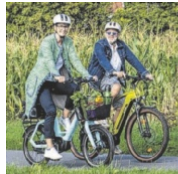
Von 21. Juni bis 11. Juli heißt es mit dem Radl Kilometer sammeln beim Stadtradeln.

Mitmachen kann jeder, ob als Einzelperson, in einer Gruppe, als Verein, Firma, Freundesgruppe oder auch Schulen bzw. Schul-