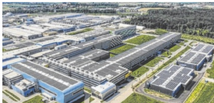
Die AMAG blickt auf ein erfolgreiches erstes Quartal zurück.

Der Gesamtabsatz in Q1/2025 wurde um rund sechs Prozent auf 110.800 Tonnen gesteigert. Der Gewinn nach Steuern stieg auf 16,2 Millionen Euro (+22 Prozent), der operative Gewinn (EBITDA) lag bei 46,1 Millionen Euro (+9 Prozent). Auch der Cashflow aus der laufenden Geschäftstätigkeit entwickelte sich mit 51,1 Millionen Euro sehr positiv und konnte damit einen