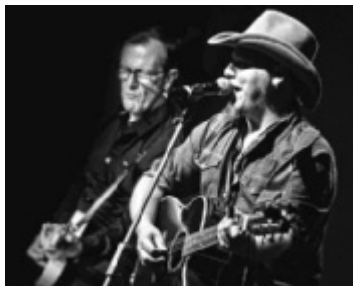
Erinnern an Johnny Cash: die Folsom Prison Band

Den Start macht am Mittwoch, 2. Juli, die Folsom Prison Band. Sie erinnert an den legendären Johnny Cash und setzt fort, was