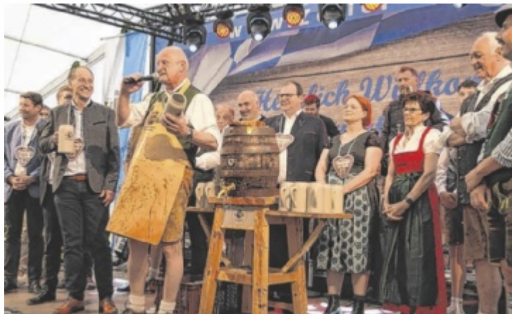
Am Donnerstag, 5. Juni, heißt es wieder „Azapft is“ im Zeiler-Festzelt auf der Simbacher Pfingstdult.

Die „Nacht der Tracht“ steht im Mittelpunkt am Samstag, 7. Juni. An diesem Tag geht es schon um 10 Uhr mit dem Weißwurstfrühschoppen und Biergartenbetrieb los, ab 13 Uhr läuft das große Simbacher Schafkopfturnier und abends wird in Tracht mit der Party-Coverband „Münchner Gschichten“ gefeiert.