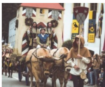
1200 Teilnehmer sind beim Festzug am Sonntag mit dabei

Ein Höhepunkt sind die Ritterturniere und der große Festzug. Weitere Infos: facebook und www.auf-heller-und-bar.de ■