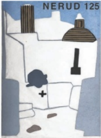
Sakrale Werke von Josef Karl Nerud werden in der Evangelischen Gnadenkirche zu sehen sein.

Die Vernissage findet am 31. Mai um 19 Uhr in der Gnadenkirche statt. Volker Ziegert gibt Einblicke in das Schaffen des Künstlers. Musikalisch gestaltet wird der Abend durch Vocalissimo. Weitere Vorträge schließen sich am 24. Juni um 19 Uhr und am 1. sowie 9. Juli um 19 Uhr jeweils in der Kirche an. Eine Bildpredigt erwartet die Besucher am 22. Juni um 10.30 Uhr beim Gottesdienst mit Pfarrer Christian Muschler. Einen besonderen Abend verspricht das Konzert mit Quadro Nuevo am 12. Juli um 19.30 Uhr in der Gnadenkirche – mit Eintritt. Schließlich runden am 10. August um 18.30 Uhr ein Serenadengottesdienst mit Bildpredigt und anschließendem Dämmer-schoppen sowie die Finissage am 13. August, dem Geburtstag des Künstlers, um 19 Uhr den Ausstellungsreigen ab. Das 60. Kirchweih-Jubiläum wird am 6. Juli um 10.30 Uhr mit