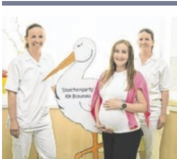
Viele Infos gibt es für werdende Mütter bei der Storchenparty