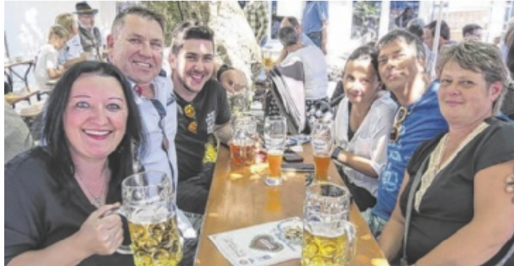
Der Biergarten lockt ins Bierhaus zu einer frischen Maß Augustiner.