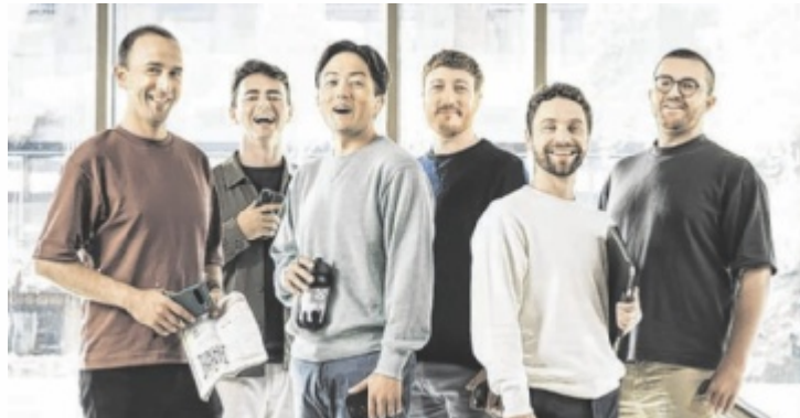
The King's Singers, eines der weltweit bekanntesten Vokal-Ensembles

Mit der Konzertreihe Greinburg vocal hat der Kulturverein Grein ein Format erschaffen, bei welchem seit 2023 jedes Jahr im Juni ein international renommierter Gesangs-Ensemble eingeladen wird. Heuer werden am 21. und 22. Juni die King's Singers aus London Grein besuchen. Die sechs Sänger repräsentieren den Goldstandard des A-cappella-Gesangs und zeigen ihre Herkunft aus der britischen Chortradition. Zwei Countertenöre, ein Tenor, zwei Baritone und ein Bass haben den unverwechsel-