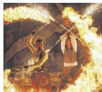
Flame Rain Theatre

Sie zaubern, jonglieren mit Keulen, Messern oder mit Feuer. Sie musizieren und sie tanzen. Sie bringen die Menschen zum Lachen und zum Staunen. Für ihre Kunst brauchen sie keine Bühne, denn ihre Bühne ist die Straße: Am 27. und 28. Juni zeigen Künstler aus aller Welt in der Freistädter Innenstadt ihre Talente. Die Artisten und Musiker kommen aus der ganzen Welt nach Freistadt, um den Besuchern ein Lächeln ins Gesicht zu zaubern. Zu den Highlights in diesem Jahr zählen „Sara Twister“ – Schlangenmensch und Bogenschützin, aber mit „Twist“.