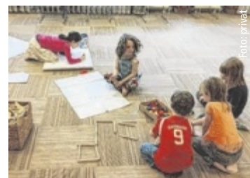
Kinder beim Erarbeiten der Ideen