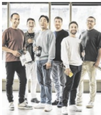
Königlich Die bekannten King's Singers gastieren auf Einladung des Kulturvereins Grein auf Schloss Greinburg. Seite 31/ F: Ealovega