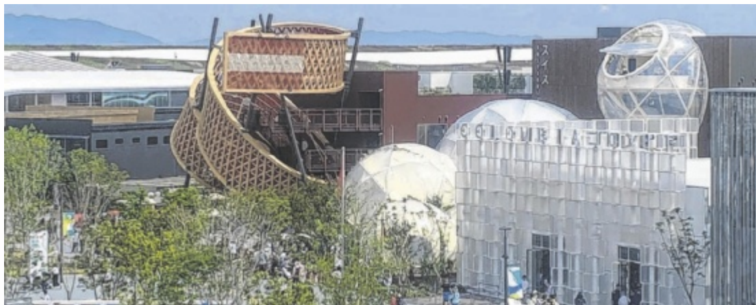
Mit einer 16 Meter hohen Holzschleife sticht der österreichische Pavillon auf der Weltausstellung Expo in Osaka, Japan, hervor. Das Motto „Die Zukunft komponieren“ lockt täglich Tausende Besucher an.