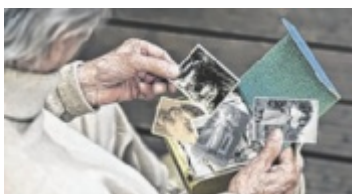
Demenz verstehen und handeln