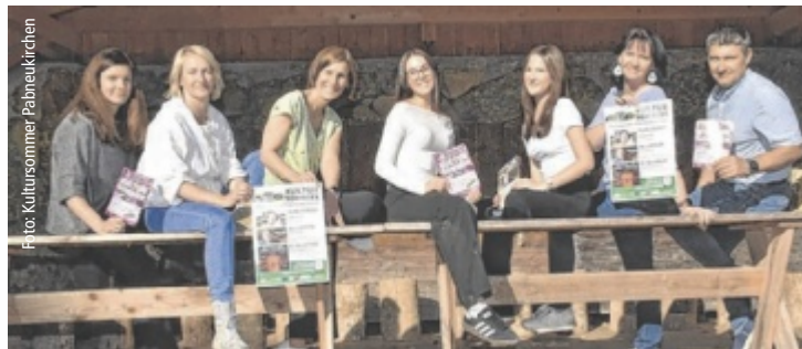
Das Organisationsteam freut sich auf rege Teilnahme an den Veranstaltungen.

Dem Organisationsteam ist es auch bei kulturellen Veranstaltungen ein Anliegen, Regionalität in den Fokus zu stellen. „Neben dem kulinarischen Angebot geben wir auch Künstlerinnen und Künstlern aus der Region - oder mit einem Bezug zu