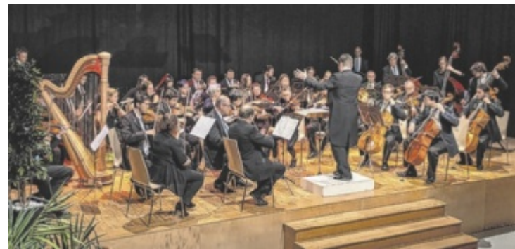
Das Kammerorchester Münzbach feiert sein 30-jähriges Bestehen und tritt am Pfingstwochenende drei Mal auf.

Anmeldung erforderlich beim Seniorenbund OÖ oder bei den jeweiligen Ortsgruppen. ■