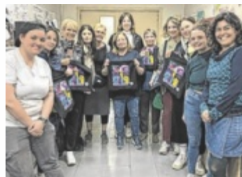
Die Gruppe erforscht das „spanische Modell“ der Bekämpfung geschlechterspezifischer Gewalt.