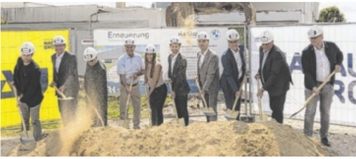
Der Spatenstich zum Umbau wurde am 21. Mai gesetzt.