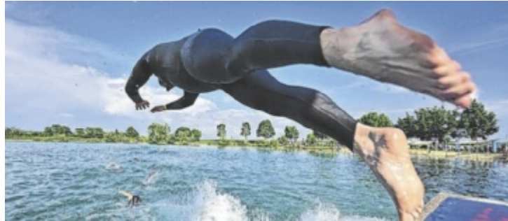
Der Keltenman wird am Badensee Mitterkirchen ausgetragen.

Der Sprinttriathlon mit einer komplett gesperrten flachen und schnellen Radstrecke und einzigartiger Schwimm- und Laufatmosphäre rund um den wunderschönen türkisen See lädt alle Einsteiger und Triathlonbegeisterte ein, nach Mitterkirchen zu kommen. Bereits in der dritten Auflage hat sich der Keltenman, mit 750 Meter Schwimmen, 18 Kilometer Rad fahren und 5 Kilometer Laufen, als absolutes Highlight im Triathlonkalender etabliert. Für den Nachwuchs gibt es den Sparefroh Kids Aqua-