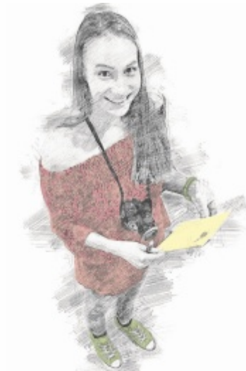
Die Teilnahme ist kostenlos.

Gelehrt werden Grundlagen des Journalismus in den Bereichen Print, aber auch Online, Social Media und Fernsehen. Zudem steht eine Führung durch das OÖN-Druckzentrum in Pasching am Programm und ein Blick hinter die Kulissen von TV1. Die Teilnehmer schreiben und gestalten gemeinsam die Sonderausgabe „Schul-Tips“, die an oberösterreichischen Schulen