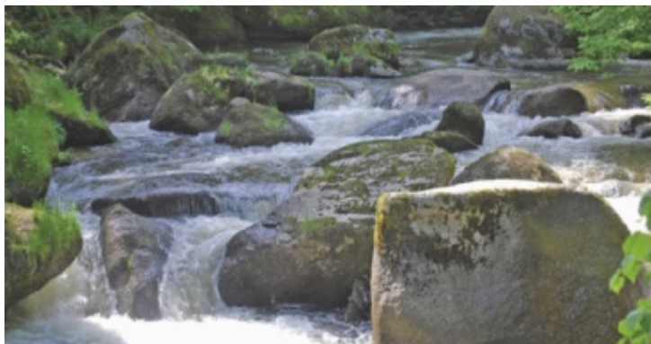
Eine der Lebensadern des Naturparks Mühlviertel: die Naarn

Das Jubiläumsfest „20 Jahre Naturpark Mühlviertel“ lädt ein, das 20-jährige Bestehen des Naturparks auf dem Gebiet der Gemeinden Rechberg, Bad Zell, Allerheiligen und St. Thomas am Blasenstein gebührend zu feiern. Die Besucher erwartet ein buntes Programm mit „Markt der Vielfalt“ der Naturpark-Spezialitätenbetriebe und Direktvermarkter aus den Naturparkgemeinden sowie Aktiv- und Forscherstationen für Kinder, gestaltet von den Naturvermittlern,