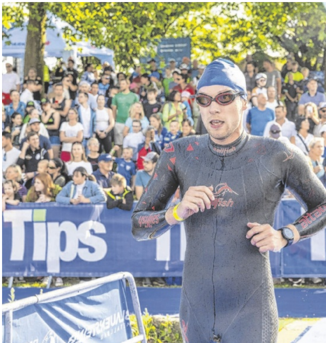
Keltenman Hunderte Athleten und Zuschauer werden am 31. Mai beim dritten Sprinttriathlon Keltenman den Badesee Mitterkirchen in einen Hexenkessel verwandeln.