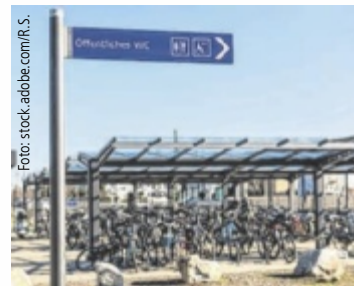
Bald möglich: WC-Besuch am Bahnhof

Einen genauen Termin für den Baustart bzw. die Eröffnung gibt es derzeit noch nicht. Ziel ist, mit der Umsetzung des gesamten Projekts noch heuer zu starten. „Betonen möchte ich, dass in Lungitz eine neue Park & Ride-Anlage für 112 PKWs samt Busumkehrschleife, überdachter Bushaltestelle sowie neuen Mofa- und Fahrradabstellplätzen mit Kosten in Höhe von rund 1,2 Millionen