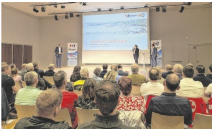
Um die Verkehrssicherheit langfristig zu gewährleisten, wird die Bestandsbrücke 2028 saniert – Workshops starten im Herbst 2025.