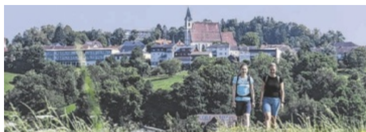
Bad Kreuzen ist Oberösterreichs erstes Wanderdorf.