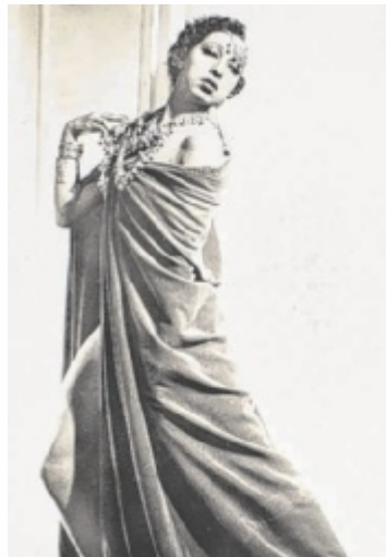
Baker fotografiert von Murray Norman.

Im Francisco Carolinum Linz läuft bis 7. September die Ausstellung „Josephine Baker. Idol Ikone Inspiration“. Sie widmet sich mit Kunstwerken, zeitgenössischen und popkulturellen Filmdokumenten sowie zahlreichen Originalfotografien und Objekten ihren frühen Auftritten in Wien, ihrem Weg zum ersten weiblichen Superstar mit afroamerikanischen Wurzeln, zur Kämpferin gegen Rassismus und schließlich