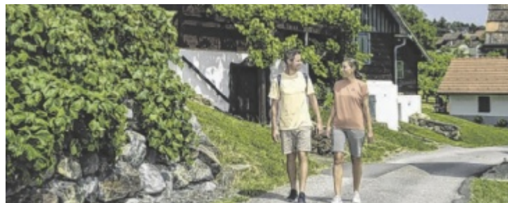
Wandern und Wein im sonnigen Burgenland

bühnenpflichtig. Ein Sechs-Stunden-Ticket kostet 6 Euro, 24 Stunden Parken kosten 9 Euro.