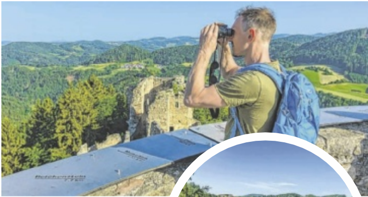
Für den 84 Kilometer langen Pilgerweg im Mühlviertel sollte man mehrere Tages-Etappen einplanen.

reiche Kraftplätze, fantastische Aussichtspunkte und fünf Gipfelkreuze mit grandiosen Rundblicken. Auch viele kleinere und größere spirituelle Einrichtungen wie Kirchen, Kapellen und Marterl befinden sich am Johannesweg. Ausgangspunkt ist die Gemeinde Pierbach. Es kann auch in jeder anderen Gemeinde entlang des Rundwegs losgewandert werden: von Schönau, St. Leonhard, Weitersfelden, Kaltenbach, Unterweißenbach und Königswiesen. Der Weg wird in drei, vier oder fünf Tages-Etappen bestritten, wobei empfohlen wird, sich mindestens vier Tage Zeit zu nehmen. Geführte Johannesweg-Touren gibt es von 4. bis 7. Juni und von 8. bis 11. Oktober. Nähere Infos: Tel. 050 7263-300, Mail: badzell@muehlviertel.at, www.johannesweg.at