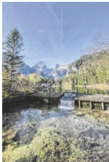
Der Schiederweiher ist ganzjährig frei zugänglich.

HINTERSTODER. Der zwischen 1897 und 1902 von k.u.k. Hofbaumeister Johann Schieder errichtete Stausee am Dorfende von Hinterstoder ist nicht nur Kraftort und beliebtes Ausflugsziel, sondern auch einer der schönsten Plätze Österreichs. Der Schiederweiher im Stodertal ging 2018 aus der ORF2-Liveshow „9 Plätze – 9 Schätze“ als klarer Österreich-Sieger hervor. Die Gegend rund um den Schiederweiher kann man auf mehreren leichten Wanderwegen erkunden. Seine idyllische Lage und die atemberaubende Aussicht auf die Spitzmauer (2.446 m) und den Großen Priel (2.515 m) macht den Schiederweiher zu einem der bekanntesten Ausflugsziele im Land. Der Weiher ist täglich frei zugänglich. Der Parkplatz ist ge-