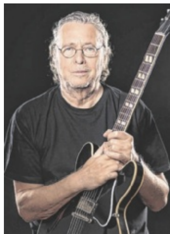
Peter Cornelius spielt am 26. Juli in Bad Schallerbach auf.