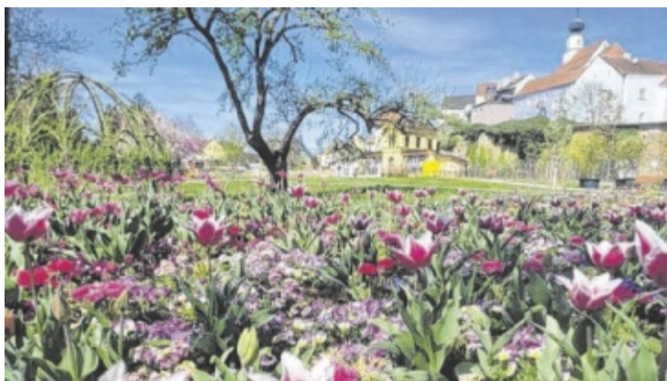
Es gibt insgesamt neun Themengärten.

zur französischen Nationalheldin. Nähere Informationen: www.oekultur.at