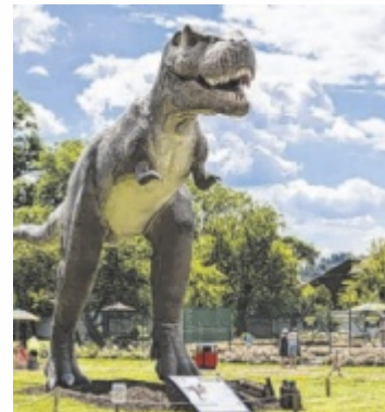
An die 100 Saurier sind ausgestellt.

Der Erlebnis-Park verfügt über vielfältige Mitmach-Programme wie Dino-Scooter, Dino-Reiten und eine Dino-Rallye. Im Forscher-camp können Kinder Fossilien freilegen und Schätze finden. Zusätzlich gibt es zahlreiche Kletter- und Krabbelanlagen, Riesenrutschen, ein Labyrinth, Balancierpfade und einen Flying Fox. Um auch an heißen Sommertagen den Gästen Abkühlung bieten zu können, wird im Dinoland demnächst eine große Wasserrutsche errichtet. Dort können sich die Kinder abkühlen. Auf einer angrenzenden Liegewiese können sich die Eltern entspan-