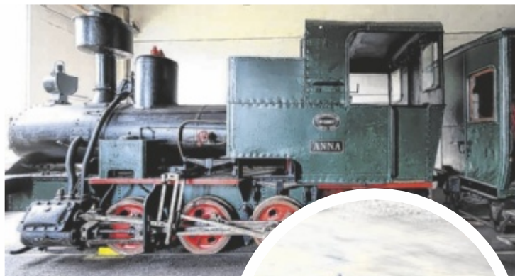
Im Lokpark in Ampflwang im Hausruckwald können über 100 Schienenfahrzeuge bestaunt werden.