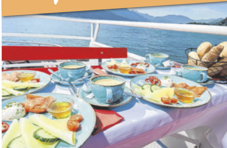
Genussfahrten am Rundkurs Süd am Attersee und am Altaussee See