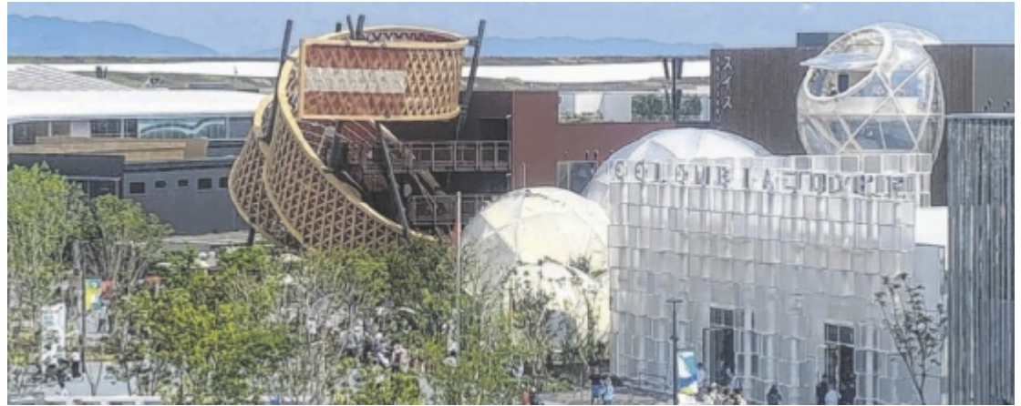
Mit einer 16 Meter hohen Holzschleife sticht der österreichische Pavillon auf der Weltausstellung Expo in Osaka, Japan, hervor. Das Motto „Die Zukunft komponieren“ lockt täglich Tausende Besucher an.