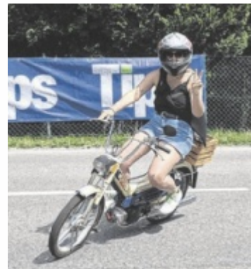
Legendäres Puch-Treffen

Am Samstag, 7. Juni, wird Gampern wieder zum Mekka für Liebhaber historischer Zweiräder: Die Puch-Freunde Gampern laden ab 8 Uhr zu ihrem beliebten Puch-Treffen beim Gasthof Muhr „Wirt z'Bierbaum“ ein. Höhepunkt des Tages ist die traditionelle Sternfahrt rund um den Attersee, die um 10 Uhr startet. Die Route führt über Seewalchen und Weyregg bis nach Steinbach – mit einem gemütlichen Boxenstopp bei den Fischgrillern in Weißenbach. Gut gestärkt geht es über Unterach und Nußdorf zurück nach Gampern.