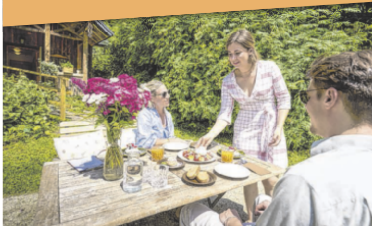
Sommerfrische für die ganze Familie im Ausseerland Salzkammergut