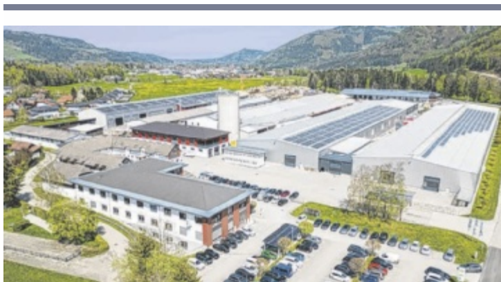
Wolf Systembau in Scharnstein lädt zum Unternehmerabend

St. Gilgen: Konzert unter dem Titel "Zeit für Frieden", Eintritt frei, Europakloster Gut Aich, 19.30, Anmeldungen: iris.feitzinger@euro-pakloster.com