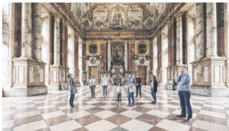
Immer einen Besuch wert: das Stift St. Florian

Eine Berg- und Talfahrt kostet für Erwachsene 56,50 Euro, für Kinder 17 Euro. Eine Berg- oder Talfahrt kostet für Erwachsene 39,80 Euro, für Kinder 11,90 Euro. Nähere Infos und Fahrpläne: www.5schaetze.at