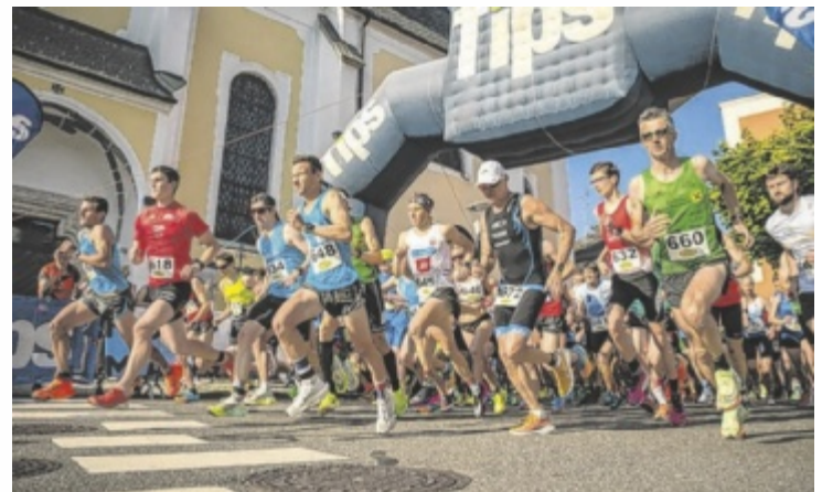
Stat zum Hauptlauf 2024

Das Epizentrum der Bewerbe ist das Gemeindeamt im Ortszentrum. Start, Ziel und auch Gastronomie sind dort vorhanden. Die Kinderläufe eröffnen den Veranstaltungstag um 16 Uhr. Die Erwachsenen sind auf einer 2.500 Meter Runde unterwegs. Beim Hobbylauf darf diese zweimal bewältigt werden. Der Hauptlauf, der auch zum Sparkasse Traunviertler Laufcup zählt, hat vier Runden im Angebot. Für die Zuschauer gibt es viele Möglichkeiten, die Teil-