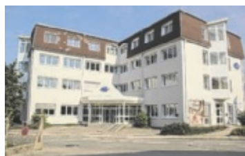
Diskussion für Firmen über „Schlüsselfaktor Fähigkeiten“.

erhörte.stimmen“, das literarische, musikalische und künstlerische Beiträge miteinander verbindet. Auch Literatur hat ihren Platz: Die Bücherei Ebensee organisiert Sagenspaziergänge rund um lokale Mythen. Regionale Künstler präsentieren ihre Werke bei Ausstellungen an verschiedenen Orten. ■