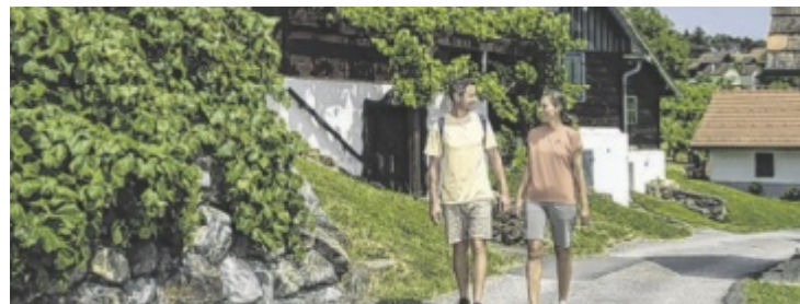
Wandern und Wein im sonnigen Burgenland

sche Winzerdörfer, am WeinStein Weg im Blaufränkischland zwischen Wald und Wein, oder auf dem Drei-Weinberge-Rundweg in der Weindylle Südburgenland – hier wird Wandern zum sinnlichen Genuss. Und das Beste: Mit der Burgenland Card sind viele Highlights wie Thermen, Badeseen und Ausflugsziele vergünstigt oder kostenlos – für unbeschwerte Sommertage im sonnigsten Land Österreichs. www.burgenland.info Anzeige