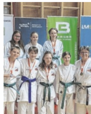
Die Karateka der Sportunion Altmünster bei der Bundesmeisterschaft in Wals.