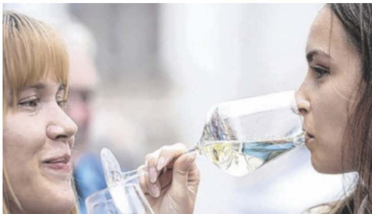
Weinfreunde sollten sich Samstag, 14. Juni, vormerken.