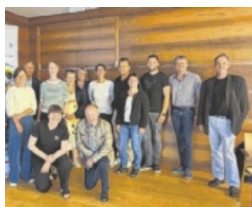
Teile des Projektauswahlgremiums der sechsten Sitzung.

wird deutlich, wie wichtig wohnortnahe Versorgung ist. Die Almtal Apotheke soll auch künftig ein verlässlicher Ankerpunkt im Gesundheitswesen bleiben – ein Ort, an dem fachliche Kompetenz, Menschlichkeit und persönliches Vertrauen im Mittelpunkt stehen. ■