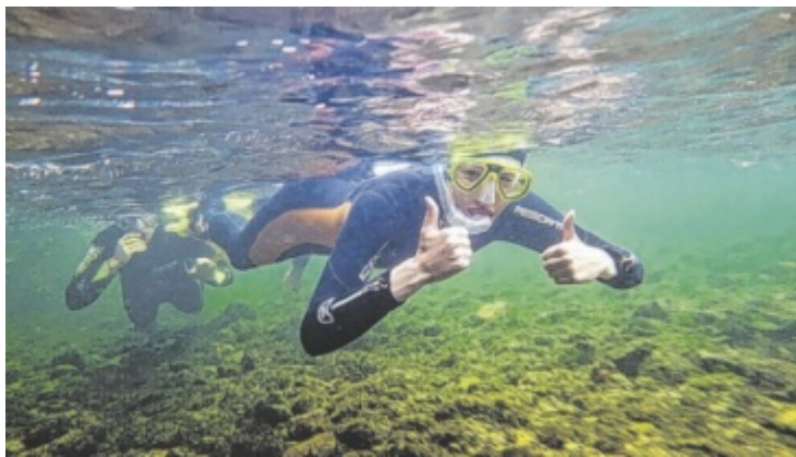
Tauchen und schnorcheln im kristallklaren Wasser