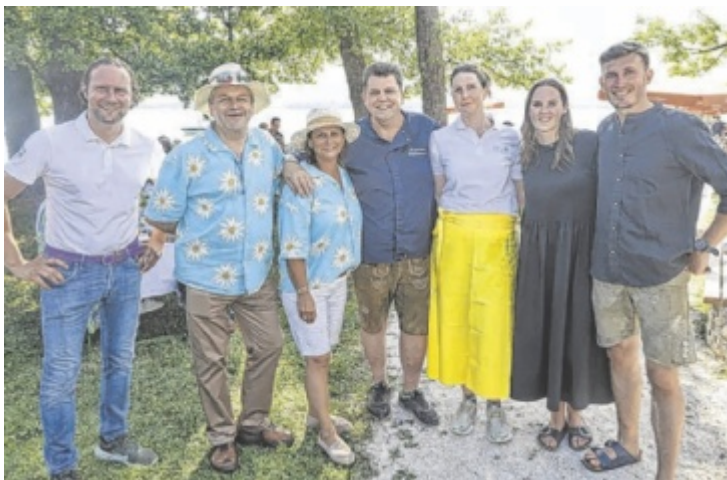
Die Kulinarium Attersee-Wirte laden zum Sommerfest.