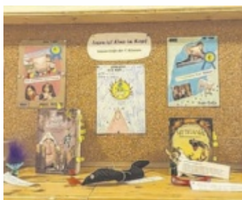
Leseprojekt unter dem Motto „Lesen ist Kino im Kopf“.