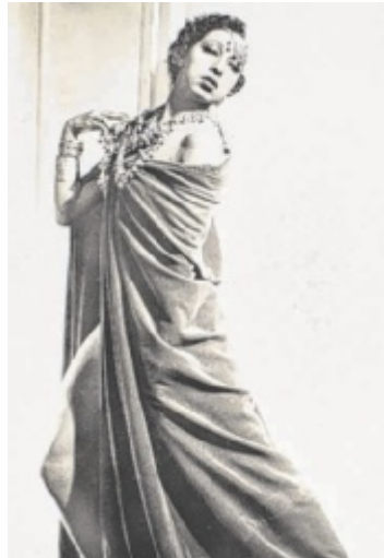
Baker

Im Francisco Carolinum Linz läuft bis 7. September die Ausstellung „Josephine Baker. Idol Ikone Inspiration“. Sie widmet sich mit Kunstwerken, zeitgenössischen und popkulturellen Filmdokumenten sowie zahlreichen Originalfotografien und Objekten ihren frühen Auftritten in Wien, ihrem Weg zum ersten weiblichen Superstar mit afroamerikanischen Wurzeln, zur Kämpferin gegen Rassismus und schließlich