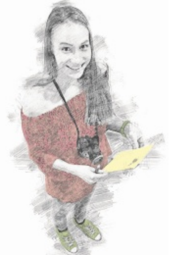
Die Teilnahme ist kostenlos.

Gelehrt werden Grundlagen des Journalismus in den Bereichen Print, aber auch Online, Social Media und Fernsehen. Zudem steht eine Führung durch das OÖN-Druckzentrum in Pasching am Programm und ein Blick hinter die Kulissen von TV1. Die Teilnehmer schreiben und gestalten gemeinsam die Sonderausgabe „Schul-Tips“, die an oberösterreichischen Schulen