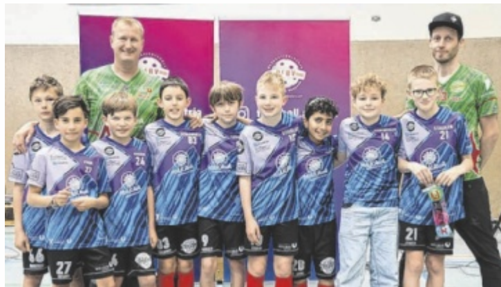
Die U-12 Mannschaft bei der Staatsmeisterschaft.

Die Bad Ischler trafen in der Gruppenphase auf zwei Wiener Teams, die Feldkirch Knights und den KAC. Die hohe Nervosität verhinderte einen gelungenen Start. Nach Niederlagen gegen den Wiener FV, Feldkirch und die Floorballbunnies blieb nur das Spiel um Platz neun. Am Sonntag gewann die Mannschaft klar mit 10:1 und 5:0 gegen den FBV Haag. Trotz Enttäuschung