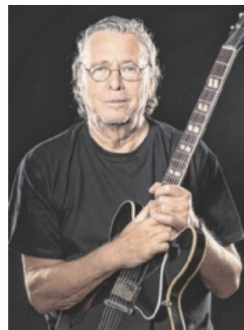
Peter Cornelius spielt am 26. Juli in Bad Schallerbach auf.