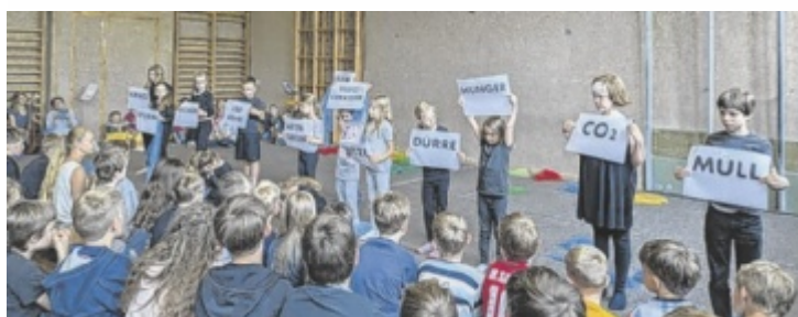
Kinder tragen mit Ideen zum Klimaschutz bei

– begleitet von Lehrer und Elternvertreter – in kleinen Gruppen zu Fuß. Das Fest bot ein abwechslungsreiches Programm mit Projektpräsentationen, Kuchenbuffet und einer Ausstellung. Viel Andrang herrschte bei Mitmach-Stationen wie Musikwerkstatt, Klimaquiz, Upcycling und dem Bau von Insektenhotels. Den Abschluss bildeten ein Klimatanz und ein Lied mit klarer Botschaft: „Wir beginnen jetzt, die Zukunft zu ändern.“ ■