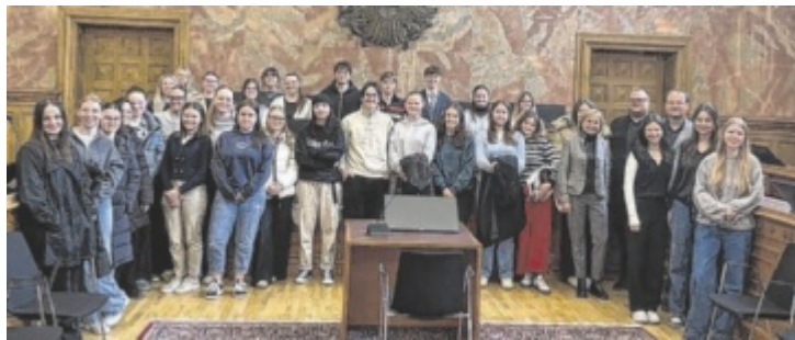
Schüler der HLW Wolfgangsee am Salzburger Landesgericht