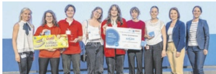
Freude über den dritten Platz beim Junior Company Wettbewerb.

BAD ISCHL. Die Junior Company „Papperlapop“ der Ecos HLW Bad Ischl erreichte beim Landeswettbewerb der Wirtschaftskammer Oberösterreich in Linz den dritten Platz. Mehr als 40 Teams nahmen an dem Wettbewerb für junge Unternehmer teil.