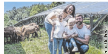
Family&Friends-Angebot von OurPower