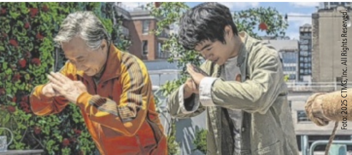
Jackie Chan (l.), Ben Wang (r.) und Ralph Macchio sind die Stars von Karate Kid.

Die Landessiegererhebung im Live-Stream: 4. Juni ab 19.00 auf facebook.com/tips.at