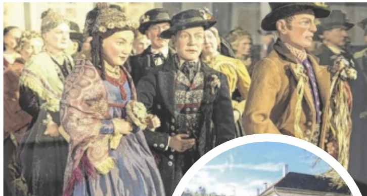
Die Sonderausstellungen „Hochzeit.Möbel“ und „Vogel.Hochzeit“ laufen bis 26. Oktober.

Geöffnet ist er Dienstag bis Sonntag sowie an Feiertagen von 10 bis 18 Uhr (im Oktober bis 16 Uhr). Infos: www.oookultur.at