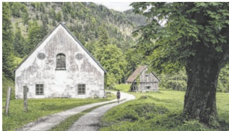
Der neue Pilgerpfad führt durch das Steyr- und Kremstal.