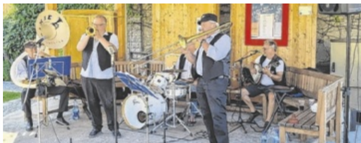
Die Dixie Urtypen spielen beim Trüföbänkerl.