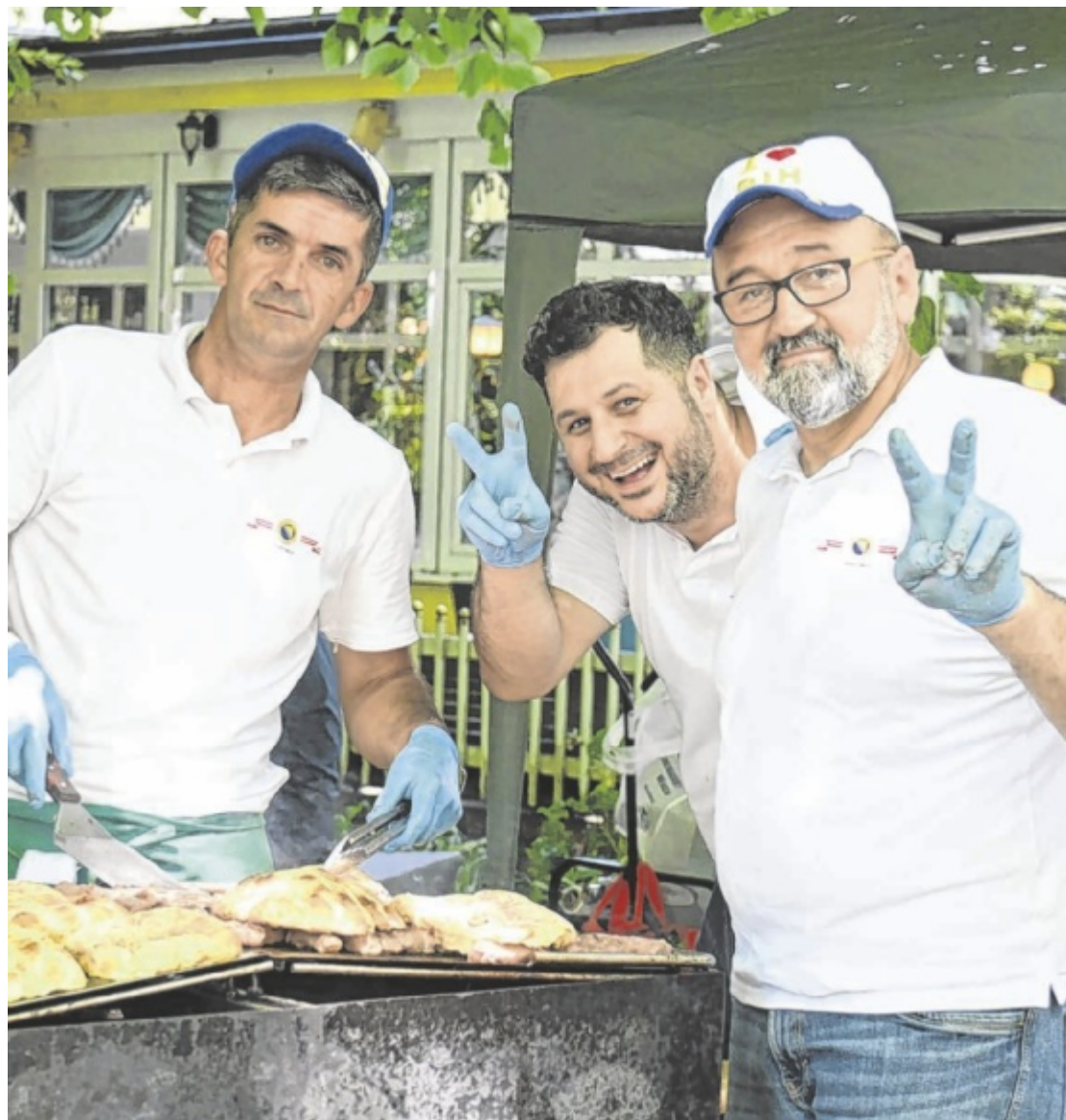
Vielfalt Miteinander und völkerverbindend gefeiert wird am Sonntag, 25. Mai, beim „Fest der Kulturen“ in Wels. Vorführungen und Speisen von Vereinen aus aller Herren Länder zeigen, wie bunt und vielfältig die Stadt ist. Seite 31 / Foto: VH ÖÖ