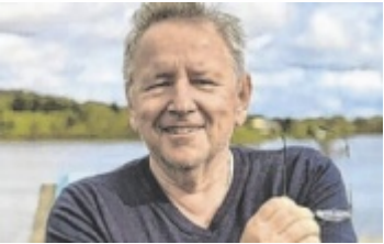
Eigletsberger liest wieder.