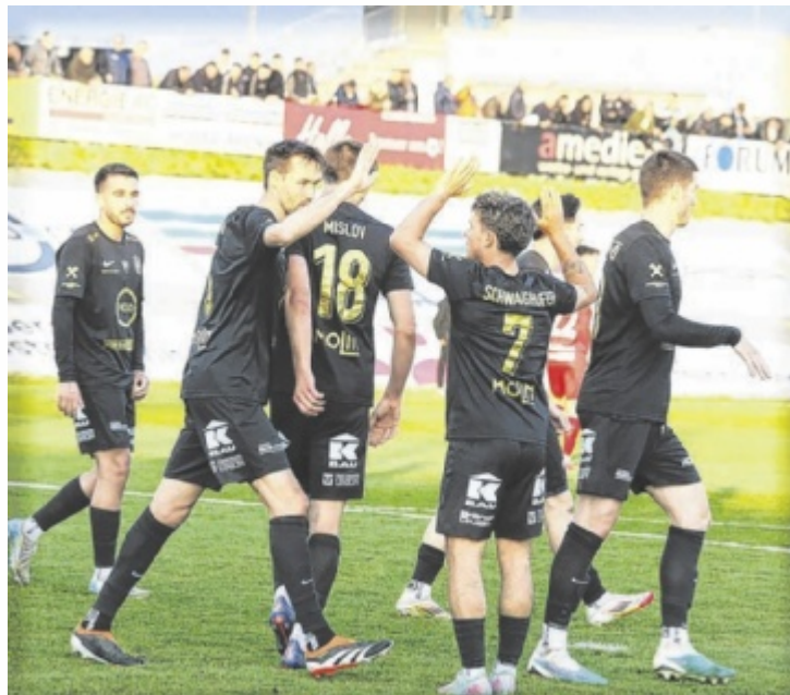
Jubel beim FC Hogo Hertha Wels

Es war keine einfache Partie im Innviertel. Die Hausherren hiel-