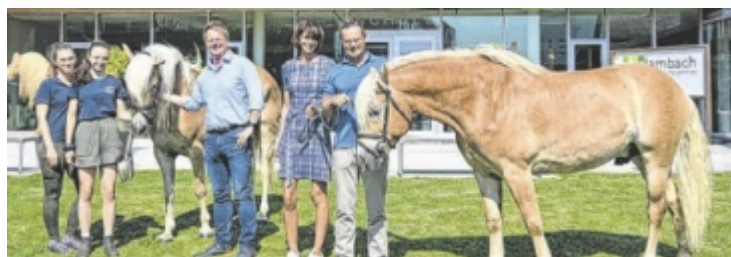
Schülerinnen, Direktor, Lehrerin und Mediziner sind alle begeistert.

Teilchen, aus denen unsere Welt aufgebaut ist, nachweist. Auch ein spannender Überblick über die Bedeutung österreichischer Forscher im internationalen Zusammenhang wird gegeben. Bei der Eröffnung am Mittwoch, 28. Mai, ab 18.30 Uhr erzählen Experten über den neuesten Stand der Forschung. ■