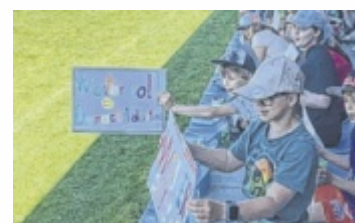
Die Fans feuerten kräftig an.

als auch ihre Lehrerinnen engagierten sich mit vollem Einsatz. Insgesamt liefen 152 Kinder in 25 Minuten beeindruckende 1327 Runden. Ihre Leistungen wurden von den Eltern sowie zahlreichen Sponsoren mit großzügigen Spenden belohnt. ■