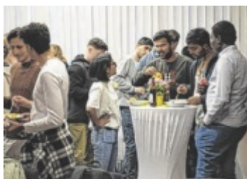
Job-Zukunft Zu den Career Talks kamen viele internationale Studenten der Fachhochschule Wels. Seite 2 / Foto: FH