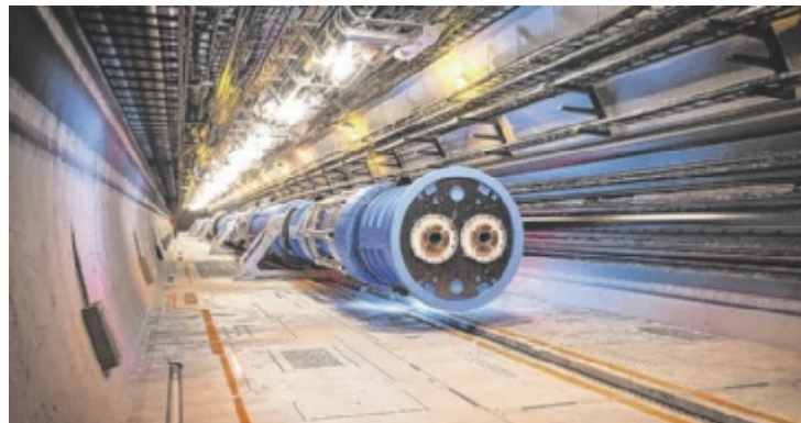
Einblicke am CERN

Die Sonderschau „Spurensuche“ wurde in Zusammenarbeit mit dem Institut für Hochenergiephysik der Akademie der Wissenschaften in Wien, die an Forschungen am CERN beteiligt ist, entwickelt. CERN, die Europäische Organisation für Kernforschung (Conseil Européen pour la Recherche Nucléaire), ist eines der größten und renommiertesten Zentren für physikalische Grundlagenforschung der Welt. „Mit der Ausstellung „Spurensuche – Die Bausteine des Universums“ wird das Thema Teil-