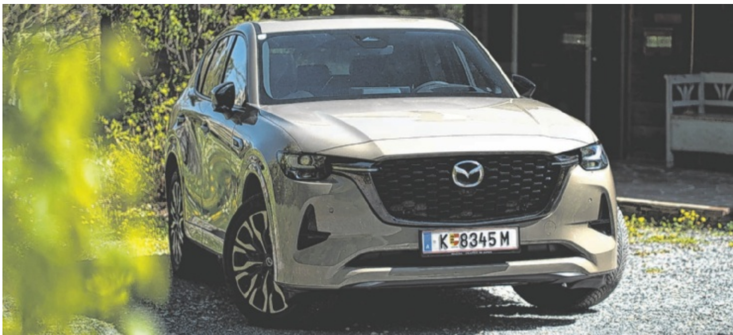
Der neue Mazda CX-60 3.3L e-Skyactiv D 254 PS Homura Plus ist ab 69.850 Euro zu haben.