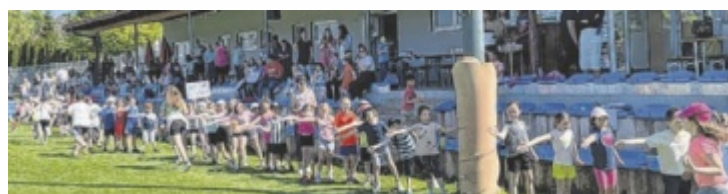
Beim Laufen einmal alle abklatschen bitte - das gehört natürlich auch dazu!

Tel: 0660 / 690 68 71 | Email: info@fassmacher.at | www.fassmacher.at