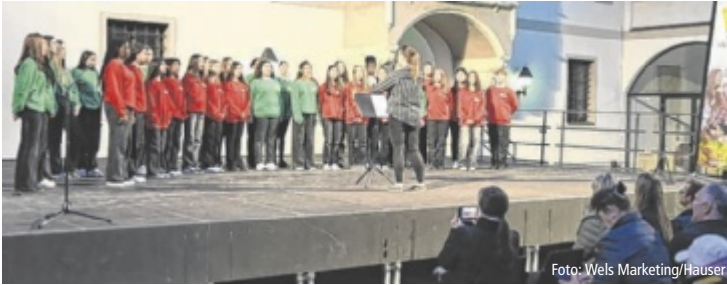
Die unterschiedlichsten Chöre treten bis 22 Uhr in der Innenstadt auf.

Seit vier Jahren ist der Abend vor Christi Himmelfahrt auch in Wels für das Singspektakel, das österreichweit stattfindet, reserviert. Gemeinsam mit dem Chorverband OÖ bringt die Wels Marketing und Touristik GmbH die unterschiedlichsten Chöre aus dem ganzen Land ins Stadtzentrum. Bereits um 18 Uhr treten die Meistersingerschulen in den Minoriten auf, bevor um 19 Uhr am Stadtplatz die Eröffnung stattfindet. Um 19.30 Uhr geht es dann