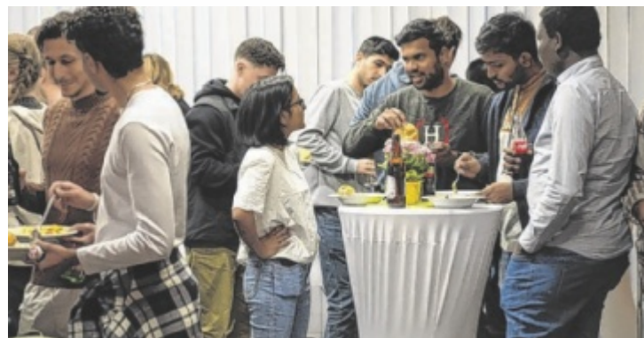
Die Teilnehmer nutzen die Möglichkeit zum Austausch am Buffet.

Die Diskussteilnehmer räumten ein, dass das Erlernen der deutschen Sprache keine leichte Aufgabe ist und sich nicht von selbst ergibt, waren sich aber einig, dass es die Mühe wert ist. Es gibt in Österreich Unternehmen, in denen Englisch die Arbeitssprache ist, und immer mehr multinationale Teams, aber „es macht das Leben so viel einfacher“, wie es einer der Redner ausdrückte. ■