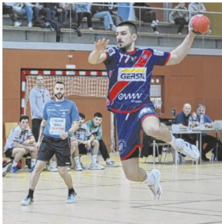
Spiders im Anflug

Damit beenden die Welser Handballer die Meisterschaft in der HLA Challenge Nord/West Abstiegsrunde auf dem dritten Platz. Die einzige Niederlage in dieser Staffel holten sich die Spiders eben in Bregenz, die ohne Niederlage diese Runde beendeten. Die Welser wurden Dritte. Im Hintergrund laufen schon die Vorbereitungen für die kommende Saison. Der Kader wird zusammengestellt und das Ziel ist es an die Top Zwei in der HLA Challenge näher heranzukommen. ■