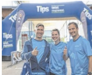
Im Team am Start

WELS. Vier Wochen vor dem Tag X haben sich schon mehr als 1.000 Aktive für den 14. Welser trodat trotec Businessrun presented by Intersport angemeldet. Am Mittwoch, 18. Juni, ist es dann so weit. Fünf Kilometer sind laufend oder walkend zu absolvieren.