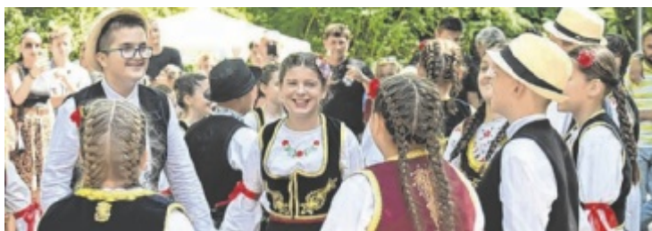
Viele Vereine und Organisationen aus Wels machen mit.