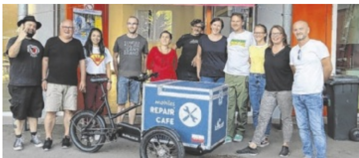
Mit vereinten Kräften wird erneuert, umgestaltet und verschönert.