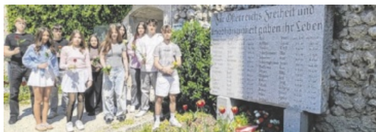
Schüler der zweiten Klassen legen am Gedenkstein Rosen nieder.

sind, wurde den Schülern der 2BHK und 2DHK bewusst gemacht, wie wichtig es ist, wachsam zu bleiben und Verantwortung zu übernehmen. Im Unterricht wurde über die Bedeutung des Widerstands damals und die Herausforderungen heute diskutiert und schließlich legten die Jugendlichen am Gedenkort für die Welser Widerstandsgruppe eine Rose nieder – in stillem Dank und Respekt für die insgesamt 42 Menschen, die ihr Leben im Kampf gegen Unterdrückung und Gewalt verloren. ■