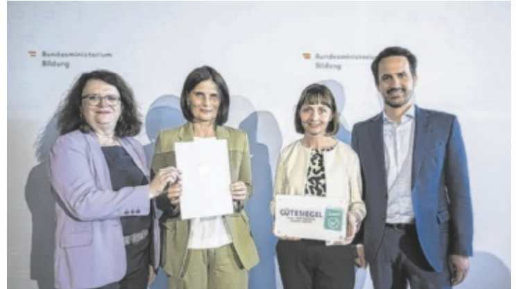
Bundesminister Christoph Wiederkehr (Neos, re.) und die Offenhausener Delegation.

Das Lesegütesiegel wurde vom Bundesministerium mit den Bildungsdirektionen entwickelt und nun erstmals verliehen. Die ausgezeichneten Schulen konnten dokumentieren, wie Leseförderung auf hohem Niveau gestaltet und im Schulalltag verankert werden kann. Sie überzeugten die Fachjury durch ihre diagnosebasierten und vielfältigen Maßnahmen zur Förderung der Lesekompetenz und Lesemotivation ihrer Schüler. In den