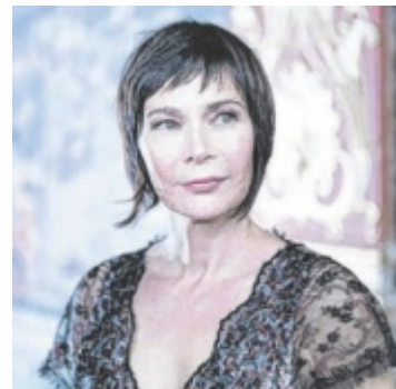
Star-Sopranistin Sandrine Piau gibt ihr Brucknerhaus-Debüt.