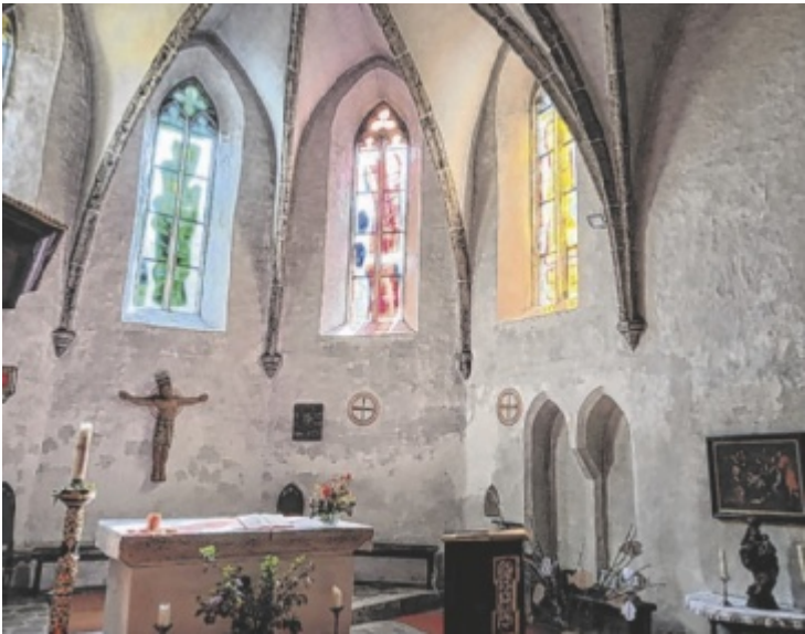
Die Pfarre Thalheim bietet in St. Ägyd ein Programm mit Konzert an.

Die Zeit zwischen 16.30 Uhr und 18.30 Uhr steht unter dem Motto „Begegnungen mit Jesus für Jung und Alt“. Bei verschiedenen Stationen können Geschichten aus der Bibel mit allen Sinnen erlebt werden. Es besteht die Möglichkeit, nach Belieben zu kommen und zu gehen, mitzumachen oder zuzuschauen oder einfach den Kirchen-