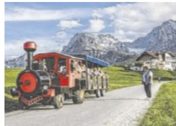
Neu mit dabei: Der Bummelzug in Windischgarsten