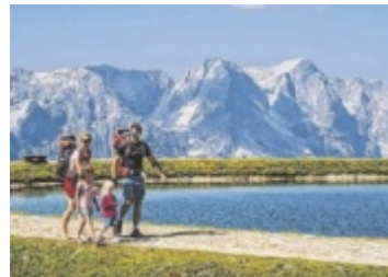
Sommerliche Bergkulisse in Hinterstoder