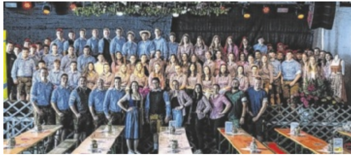
Die Landjugend lädt zu zwei Veranstaltungen ein.

Am Christi Himmelfahrtstag lädt die Landjugend zur traditionellen Mostkost auf den Lichtenhof in Fierling 9, 4532 Rohr ein. Musikalisch sorgen der Musikverein Kremsmünster, das Freche Blech, die Unbrassbaren sowie eine Showeinlage der Wartberger Plattlermädel für abwechslungsreiche Unterhaltung. Abends übernimmt DJ Seyli das musikalische Zepter in der Partyzone. Kulinarisch wird ein vielfältiges Angebot geboten. Für Familien gibt es ein eigenes Kinderprogramm mit abwechslungsreicher Betreuung – so ist auch für die