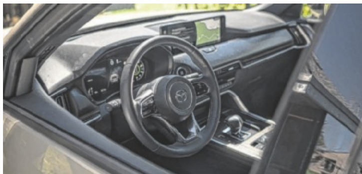
Reduktion auf das Wesentliche – auch im Interieur

Tatsächlich kommt der neue Jahrgang 1:1 daher wie der alte. Immerhin ist die Farbe des Test-CX-60 neu, entgegen ersten Ideen heißt sie nicht „Gatsch“-Metallic, sondern „Zircon Sand“. Kein großer Eyecatcher im Vergleich zum sonst eminenten „Soul Crystal“-Red, zum ruhigen und ausgeglichenen Wesen des CX-60 passt sie aber ganz wunderbar. Unterm Strich ist der Japaner ein Gesamtkunstwerk. Und das in seiner Ganzheit, spricht, da zählt auch das Interieur dazu. Mazda hat die Reduzierung auf das Wesentliche zum „state of the art“ deklariert, kongenial ausstaffiert mit edlen Materialien und hervorragender Verarbeitung. Leder ist der Stoff der Stunde, das Interieur ist quasi voll davon. Weitere Gründe: elektrisch verstellbare Lenksäule, klimatisierte und elektrische