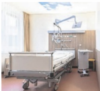
Neuer Glanz für die Sonderklasse und Palliativeinheit im PEK Kirchdorf

Nach rund sieben Monaten Umbauzeit wurde die Sonderklassesstation im sechsten Stock des Pyhrn-Eisenwurzen Klinikums Kirchdorf wieder in Betrieb genommen. Die modernisierte Station umfasst 14 Einbett- und drei Doppelzimmer sowie Aufenthalts- und Lounge-Bereiche, die funktional und gestalterisch aufeinander abgestimmt sind. Auch