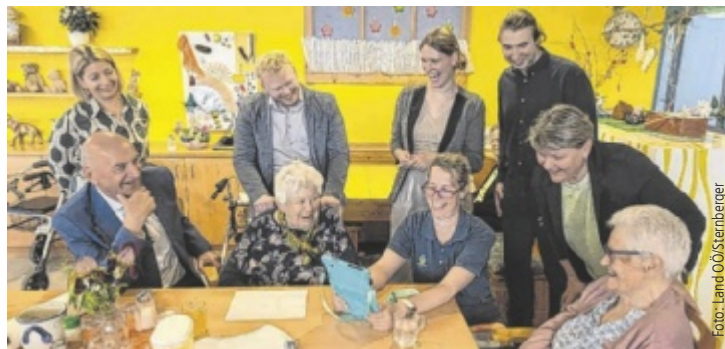
Im Beisein von Soziallandesrat Christian Dörfel (ÖVP, sitzend links) wurde im Bezirksalten- und Pflegeheim Micheldorf die neue Plattform „PflegeZeit“ vorgestellt.

Angesichts des demografischen Wandels steht das Pflegesystem vor großen Herausforderungen. Studien zeigen, dass 60 Prozent der Pflegekräfte unter Burnout-Symptomen leiden, während 80 Prozent der Heimbewohner an Demenz erkrankt sind. Sprachbarrieren erschweren zudem die Integration von Pflegepersonal mit Migrationshintergrund. Hier setzt „PflegeZeit“ mit praktischen digitalen Lösungen an. „Es geht darum, An-