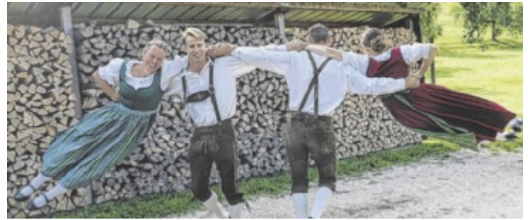
VTG Micheldorf feiert halbes Jahrhundert Tradition und Gemeinschaft.

Das Festprogramm verspricht zwei Tage, an denen Tradition und Feierlaune Hand in Hand gehen. Der Startschuss fällt am Samstag, 31. Mai, mit einer zünftigen Auftaktparty. Ab 19.30 Uhr heizen die Pankrazer Musikannten und die Unbrassbaren dem Publikum ein. Die Steyrtaler Plattler und die Volkstanzgruppe Micheldorf zeigen mit Einlagen, wie vielseitig der Volkstanz in der Region ist. Am Sonntag, 1. Juni, geht es mit einem Frühschoppen weiter. Mit dabei sind die Tanzgruppe Sandl, die Volkstanz-