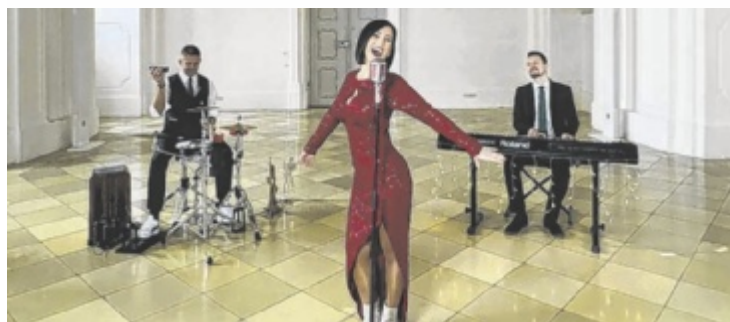
Das Trio Lounge Lane tritt im Theaterhaus auf.

KIRCHDORF. Das Mobile Hospiz des Roten Kreuzes Kirchdorf bietet am Freitag, 6. Juni, von 15 bis 17 Uhr in der Bezirksstelle Kirchdorf mit dem Trauercafé ein kostenloses Gesprächsangebot für Menschen, die Angehörige verloren haben. Dadurch wird ein Austausch mit anderen Betroffenen ermöglicht. Die Teilnahme ist kostenlos, Anmeldung erforderlich unter 07582 63581-25 oder 0650 6422110 oder per E-Mail an ki-hospiz@o.rotekreuz.at .