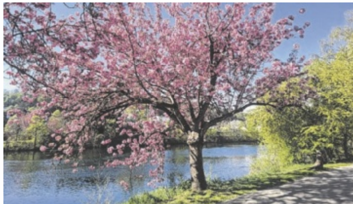
Traumhafte Blütenpracht beim Spaziergang entlang der Traun

Von der Innenstadt kommend, geht man bis zum Traunuferweg unterhalb der Alten Traunbrücke. Dort wird man von der „Sonne“ be-