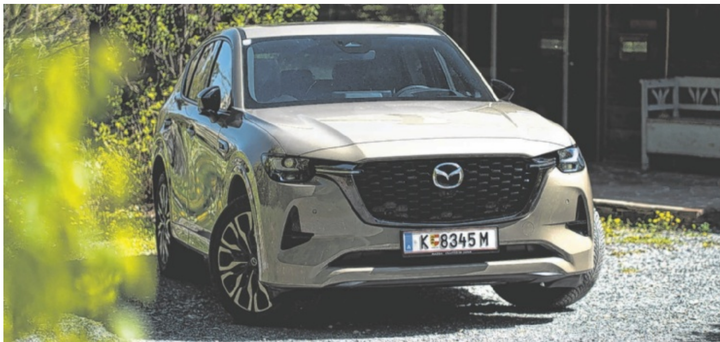
Der neue Mazda CX-60 3.3L e-Skyactiv D 254 PS Homura Plus