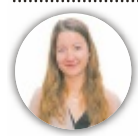
von SOPHIE KEPPLINGER

RIED IM TRAUNKREIS/OÖ. Aus einer kleinen Chili mit intensiver Fruchtnote ist in Oberösterreich ein kulinarisches Gemeinschaftsprojekt entstanden: Unter dem Namen „Alpenfeuer“ bringen drei Unternehmer eine Serie von Chilisaucen auf den Markt.