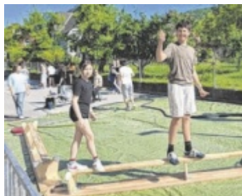
Jonglieren, Judo und mehr – Kirchdorfer Schüler präsentierten sich sportlich aktiv.

Der gesamte Außenbereich der Schule, der Stadtpark und die Frohsinnwiese verwandelten sich in ein großes Bewegungsareal mit insgesamt 25 Stationen. Ob beim Gleichgewichtsparcours, Seilziehen, Sprint, Basketball, Fußballgolf oder Dosenwerfen – für alle war etwas dabei. Besonders bereichert wurde der Tag durch die Kooperation mit vier Kirchdorfer Sportvereinen: der Faustballverein des ÖTB Kirchdorf, die Sport-