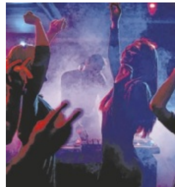
Die Jugenddisco richtet sich an zehn- bis 14-Jährige.

Bei der Fotobox können die Party-Momente mit den Freunden festgehalten werden und wer zwischendurch etwas Ruhe will,