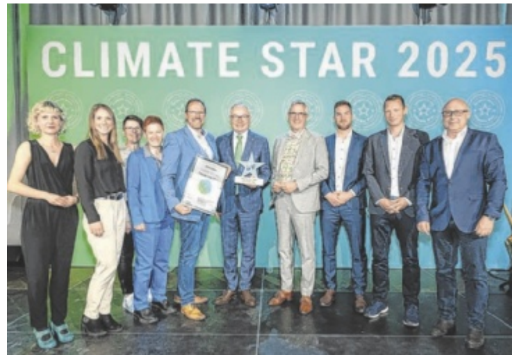
Die Stadtgemeinde Amstetten freut sich über die Auszeichnung.

Zum elften Mal wurde der europäische Klimaschutz-Award in Niederösterreich vergeben. Mit dem Climate Star werden die besten Klimaschutz-Projekte aus dem über 2.000 Mitglieder umfassenden Klimabündnis-Netzwerk in 27 Ländern Europas vor den Vorhang geholt.