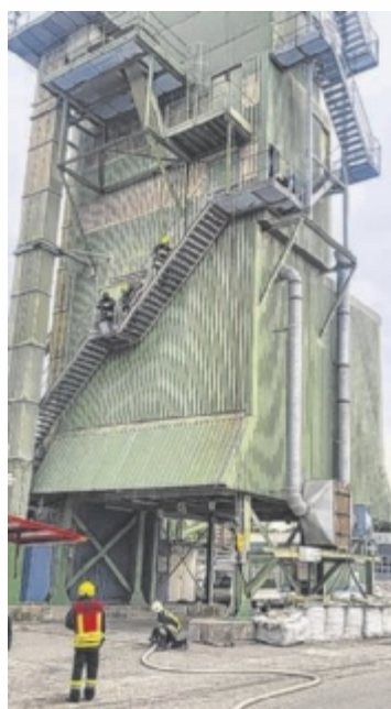
Eine herausfordernde Übung der Feuerwehren