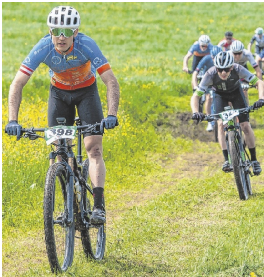
Radsport-Highlight Das Wochenende von 23. bis 25. Mai steht in Kürnberg im Zeichen des Radelns. Die Sportunion Kürnberg organisiert unter anderem wieder die österreichweit beliebte „Mosttour“. Seite 16