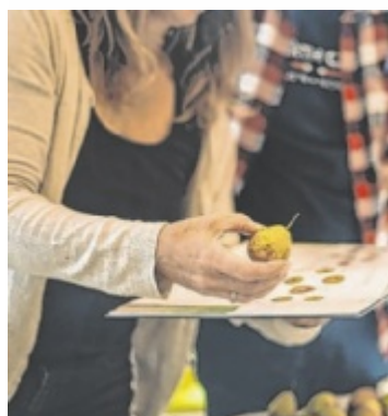
Sortenbestimmung mittels des beliebten Sortenbuchs

Das Projekt wird gefördert durch das Leader-Programm und knüpft an die jahrelange Vorarbeit der Leader-Region Moststraße an, in der bereits eine genetische Referenzdatenbank aufgebaut und zahlreiche Sorten analysiert wurden.