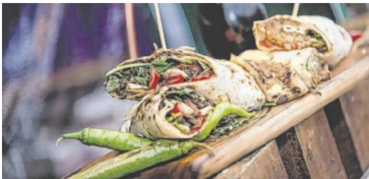
Street Food-Flair vom 29. Mai bis 1. Juni in Amstetten