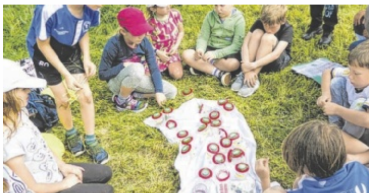
Streuobstwiese im Klassenzimmer: Ein zentrales Anliegen des neuen Projekts ist die Bewusstseinsbildung bei Kindern.