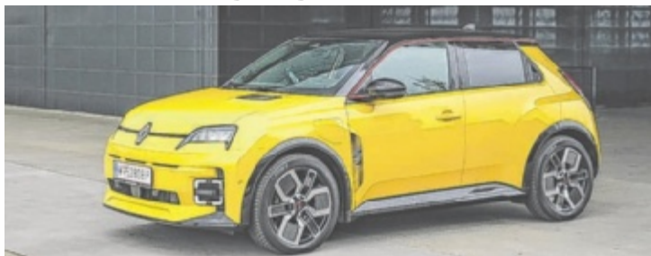
Der neue Renault 5 Electric Iconic Comfort Range

Zumindest lassen das die Reaktionen auf den Testwagen vermuten. Da drehen sich mehr Köpfe um, als man meinen mag, an Ladestationen ist der R5 der