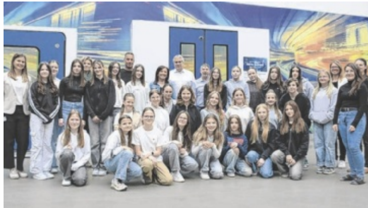
Die Besucherinnen hatten die Gelegenheit, in die Welt der Entwicklung, Produktion und Fertigung von elektrisch angetriebenen Schiebe- und Schwenkschiebetüren für Schienenfahrzeuge einzutauchen.

Der Tag begann mit einer Unternehmenspräsentation, gefolgt von einem Vortrag über den Produktentstehungsprozess im Unternehmen, der an einem von Lehrlingen realisierten Projekt erklärt wurde. Die Teilnehmerinnen wurden anschließend in Gruppen aufgeteilt, um an einem