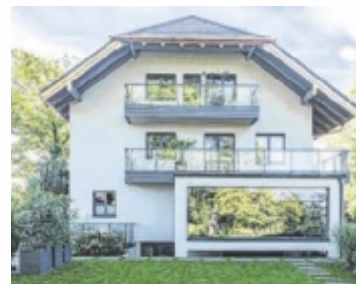
Balkone von Leeb

ÖÖ. Als Europas führender Hersteller bietet Leeb über 200 Designmodelle, die individuell in Aluminium, Glas oder täuschend echter Holzoptik gestaltet werden können. Egal, ob modern, klassisch oder rustikal – die Designvielfalt lässt keine Wünsche offen. Es ist definitiv für jeden Haustyp das passende Modell dabei.