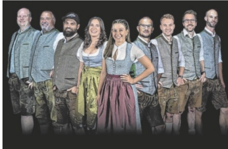
Am Samstag werden Haagston Brass aufspielen.

Am Samstag, dem 17. Mai, werden ab 13 Uhr die Feuerwehr-Abschnittsbewerbe am örtlichen Fußballplatz durchgeführt, anschließend wird ab 18.30 Uhr zum Dämmerchoppen mit der Stadtkapelle St. Valentin geladen, ehe um 21.30 Uhr Haagston