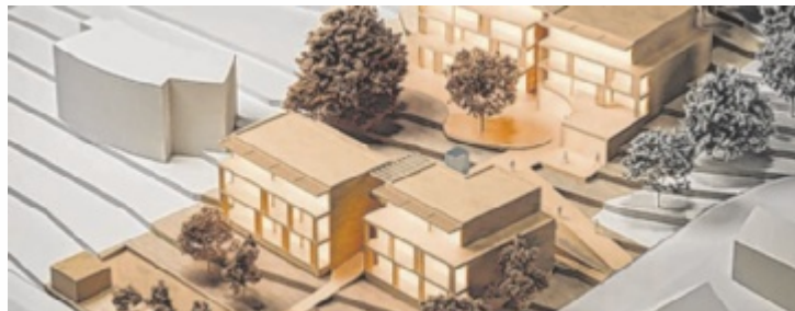
Modell des geplanten „Vorgartenhofs“ in Waidhofen/Ybbs

WAIDHOFEN/YBBS. Auf einem Grundstück im Ortsteil Zell soll in den nächsten Jahren das Wohnprojekt „Vorgartenhof“ entstehen. Interessierte können sich beim Infoabend am 14. Juni um 18 Uhr im Drei:Raum in Waidhofen über das Projekt informieren und in Austausch mit der Planungsgruppe treten.