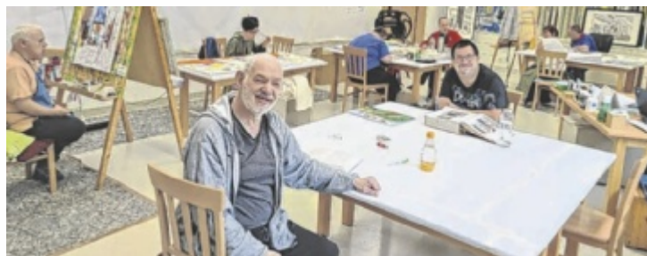
Atelier „MostArt“ am Kunsthof Seidenberg in Aschbach

Begleitet werden die Werke von talentierten Musikschaftern der Gruppe „Musiksalat“, die mit ihren