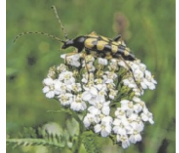
Blickfang: ein Bockkäfer auf einer Schafgarbe

Wildpflanzen begleiten uns Menschen schon jahrtausendlang. Durch verschiedenste Eingriffe des Menschen ist die Vielfalt vor allem in den letzten Jahrzehnten aber stark zurückgegangen. Anlässlich der „Woche der Artenvielfalt“ stellt „Natur im Garten“ bei einem Spaziergang durch Gärten und Parks viele Pflanzen vor, die, wenn man es zulässt, auch in Gärten vorkom-