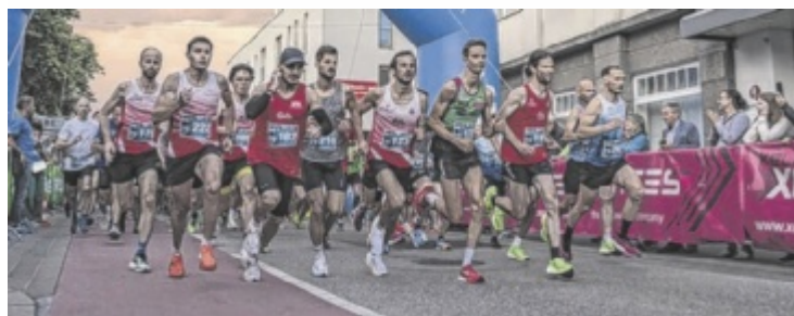
Mit Highspeed geht es durch die Amstettner Innenstadt.