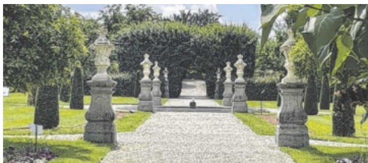
Immer wieder einen Besuch wert: der Hofgarten des Stiftes Seitenstetten