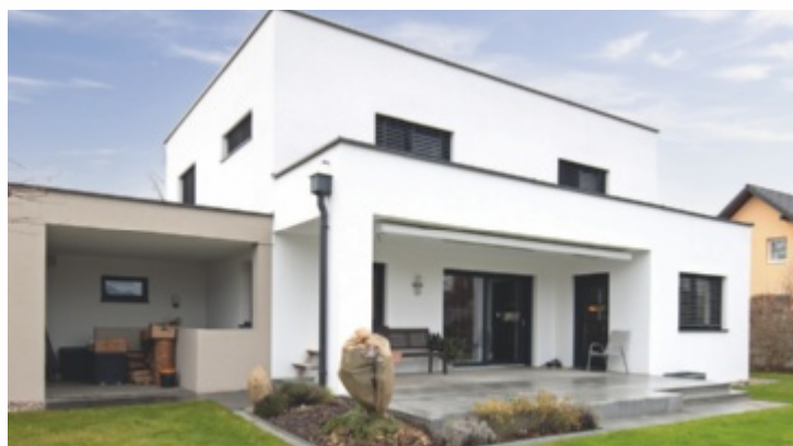
Eine sanierte Fassade kann wieder wie neu glänzen!

Die Förderung machen die Fassadensanierung besonders attraktiv.