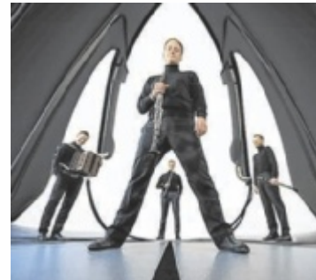
Ensemble „Faltenradio“

Um seinem Bildungsauftrag zu genügen, geht der Sender zeitgemäßen Fragen nach: „Wie ist das mit der Stille, wer holt uns da ein?“ oder „Wieso lassen wir uns mit Gleichmut und Begeisterung belügen?“ „Überschall“, das „liebevollste Faltenradio Programm aller Zeiten“, hört Töne zwischen den Noten und zeigt sich dann, wenn sich