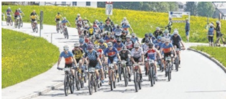
Ein Wochenende im Zeichen des Radsports in Kürnberg

Am Freitag, 23. Mai findet das Einzelzeitfahren von Steyr nach Kürnberg ab 13.30 Uhr statt. Das Sportevent beinhaltet auch die OÖ. Polizeilandesmeisterschaften beziehungsweise die Österreichischen Meisterschaften der Justizwache. Am Samstag, 24. Mai, findet die 20. Jubiläumsauflage der bekannten „Mosttour“ statt. Hier werden wieder viele Starter aus dem ganzen Land erwartet, da es sich bereits herumgesprochen hat, dass die „Mosttour“ für eine tolle Strecke, viele Zuschauer und eine Top-Organisation steht. Start ist