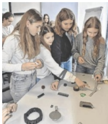
Girls' Day Anlässlich des bundesweiten Girls' Day öffnete die Knorr-Bremse GmbH – IFE Doors ihre Türen für Schülerinnen. Seite 11