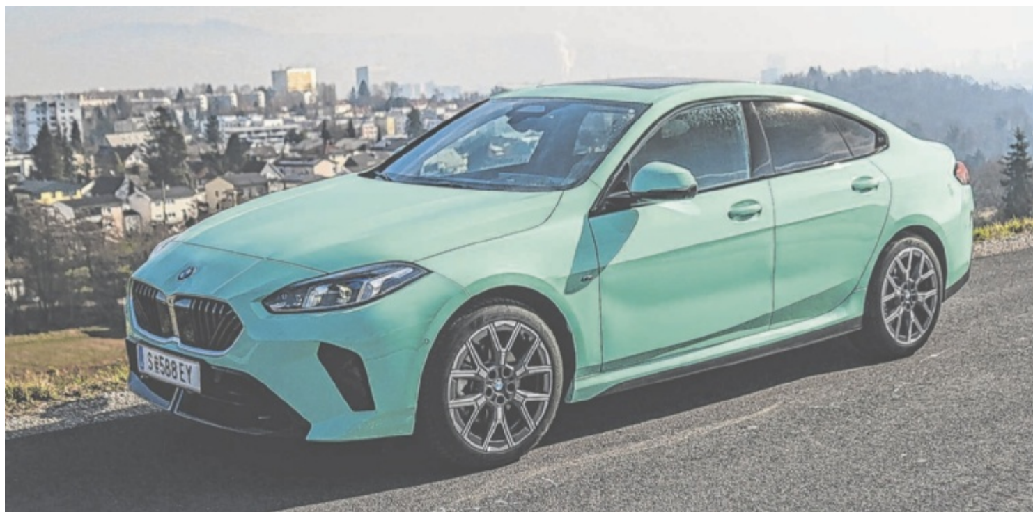
Der BMW 220d Gran Coupé ist ab 44.401,60 Euro zu haben.