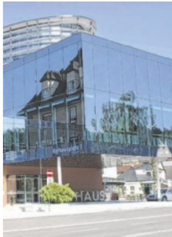
Nachhaltiges Haushaltsgleichgewicht in Laakirchen.