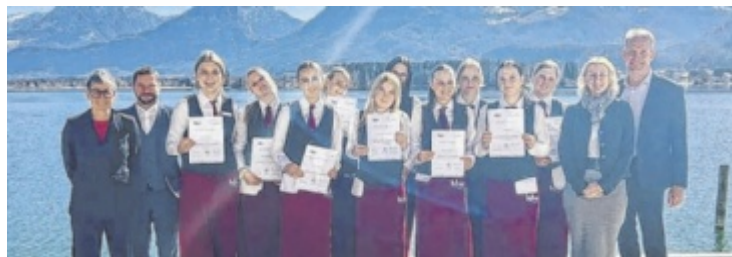
Die diplomierten Käsekenner der HLW Wolfgangsee