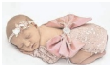
GEBURT: Arbesa & Kushtrim Shabanaj: Klea