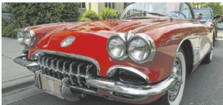
Zahlreiche Oldtimer Corvettes kommen zum Treffen.