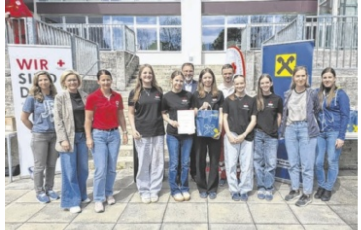
Das BRG Schloss Traunsee freute sich sehr über den Sieg.

Beim Bewerb mussten die Teilnehmer ihr Wissen in theoretischen Fragen und ihr praktisches Geschick bei verschiedenen Notfallszenarien wie starker Blutung, Helmabnahme und Reanimation unter Beweis stellen. Neben dem siegreichen Notfallteam qualifizierten sich auch die beiden weiteren Teams des BRG Schloss Traunsee für den Landesbewerb.