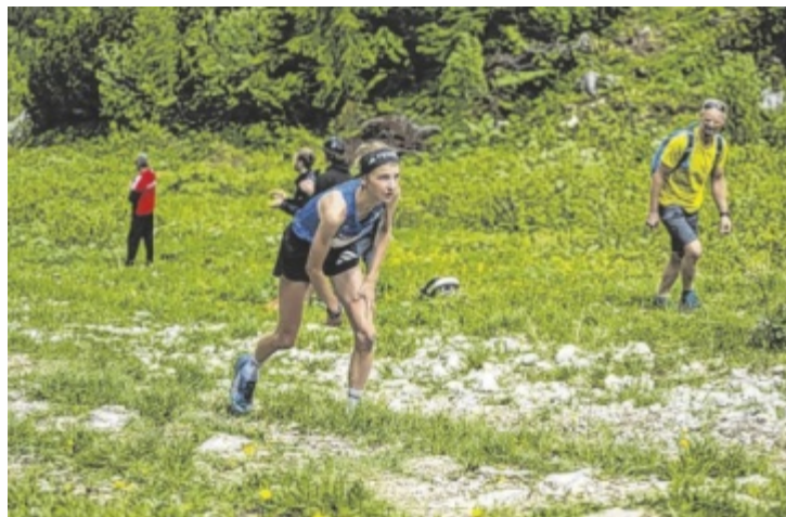
Tolle Preise winken denjenigen, die es ins Ziel schaffen.

Gestartet wird beim Kaiser-Jagdstandbild auf 472 Metern Seehöhe. Von dort verläuft die Strecke über rund 4.400 Meter entlang der steilen ehemaligen Skitrasse bis zur Katrin-Seilbahn-Bergstation auf 1.415 Metern. Insgesamt sind 943 Höhenmeter zu überwinden. Die Strecke stellt hohe Anforderungen an Kraft und Ausdauer, bietet aber auch eindrucksvolle Ausblicke