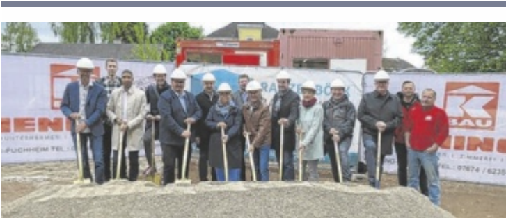
Bis 2026 sollen die Bauarbeiten abgeschlossen sein.