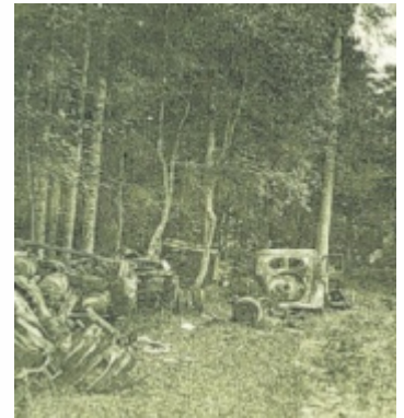
Angriff am Pötschen 1945