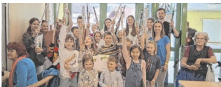
Schüler der LMS Bad Goisern spielten im evangelischen Altersheim.

rationen durch Musik. Das Repertoire reichte von bekannten klassischen Stücken bis zu traditionellen Volksliedern. Besonderes Augenmerk wurde auf frühlingshafte Musik gelegt, die passend zur Jahreszeit für eine freundliche Stimmung im Saal sorgte. Die Schüler zeigten dabei nicht nur ihr musikalisches Können, sondern schafften es auch, den Bewohnern eine willkommene Abwechslung und Freude zu bereiten. ■