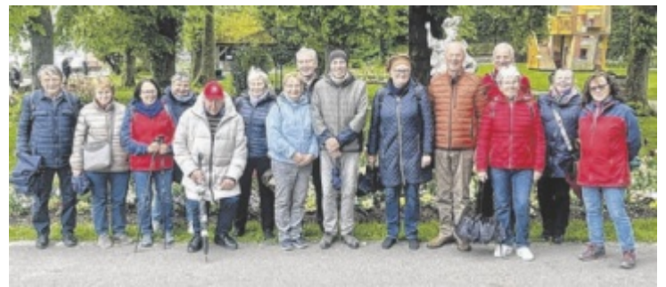
Die Reisegruppe aus Gschwandt besuchte die Gartenschau.