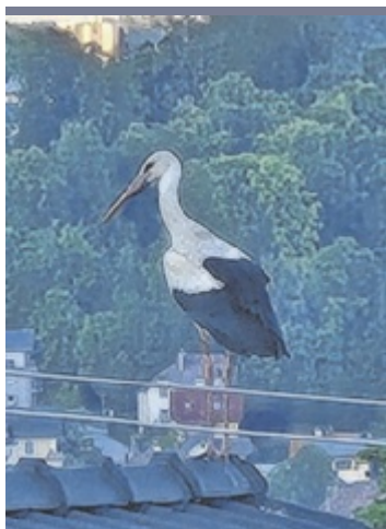
Störche Rita Pfeifer hat Tips dieses Leserfoto geschickt. Sie konnte einige Störche über den Dächern von Altmünster fotografieren.

Spendenkonto von Sei So Frei: IBAN: AT30 5400 0000 0069 1733, BIC: OBLAAT2L Spenden sind steuerlich absetzbar. https://www.seisofrei-ooe.at/