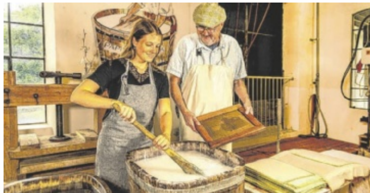
Papier schöpfen im Papiermachermuseum in Laakirchen.

In Bad Ischl bieten die Lehárvilla und das Museum im Hotel