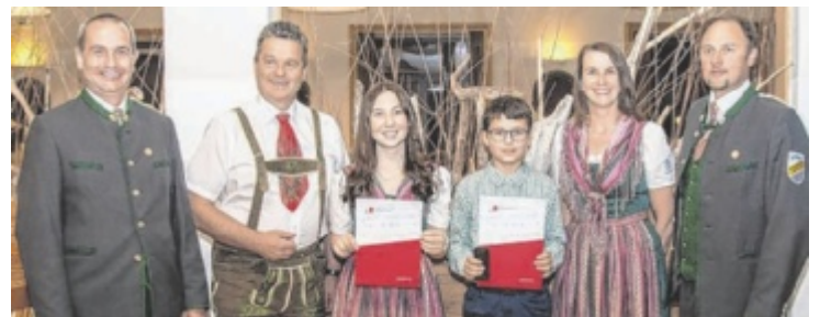
Ehrungen beim Frühlingskonzert

genussvoll verspeist. Am Nachmittag ging es weiter zur Landesgartenschau „Inn's Grün“ in Schärding. Trotz gelegentlichem Regen begeisterten die farbenprächtigen Blumenbeete, Schaugärten und die Floristikausstellung entlang des Inns. Der Schlosspark mit Orangerie rundete das Gartenerlebnis ab, ehe der gelungene Tag bei einer gemeinsamen Stärkung im Festzelt ausklang. ■