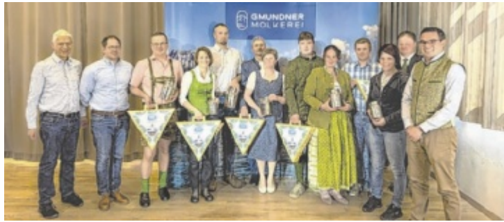
Auszeichnung der qualitätsbesten Milchlieferanten.