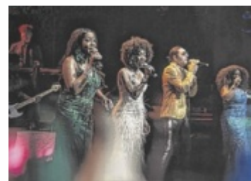
Die Disco-Legenden Boney M. spielen in Gmunden.

Mitspielen bis 30.05.2025/08:00 Uhr www.tips.at/g/24864 oder SMS an 0676 8002525 Text: „24864 Vorname Nachname“