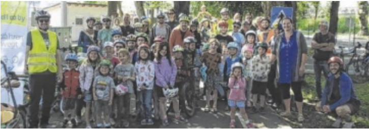
Treffpunkt beim Verkehrserziehungspark in der Jahnstraße