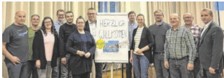
Gemeinsam für die Zukunft der Großgemeinde

Seit Frühjahr 2024 läuft ein breit angelegter Beteiligungsprozess. Nach vier Zuhörtouren durch die Katastralgemeinden und einer Umfrage in Form eines Fragebogens, durch den zentrale Anliegen der Bevölkerung gesammelt wurden, sind nun die einzelnen Punkte in strategische Ziele und konkrete Projekte übersetzt worden. Die Themenpalette reicht von Spielplätzen, Blühflächen, Ortsbild- und Ortsteilverschönerungsideen, Sicherstellung und Ausbau