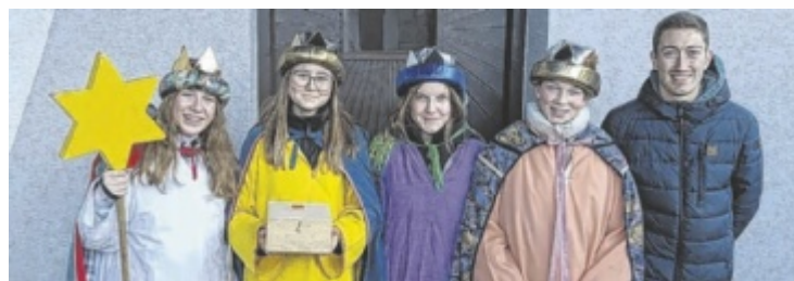
Freude bei den Sternsängern Ybbsitz über das tolle Ergebnis