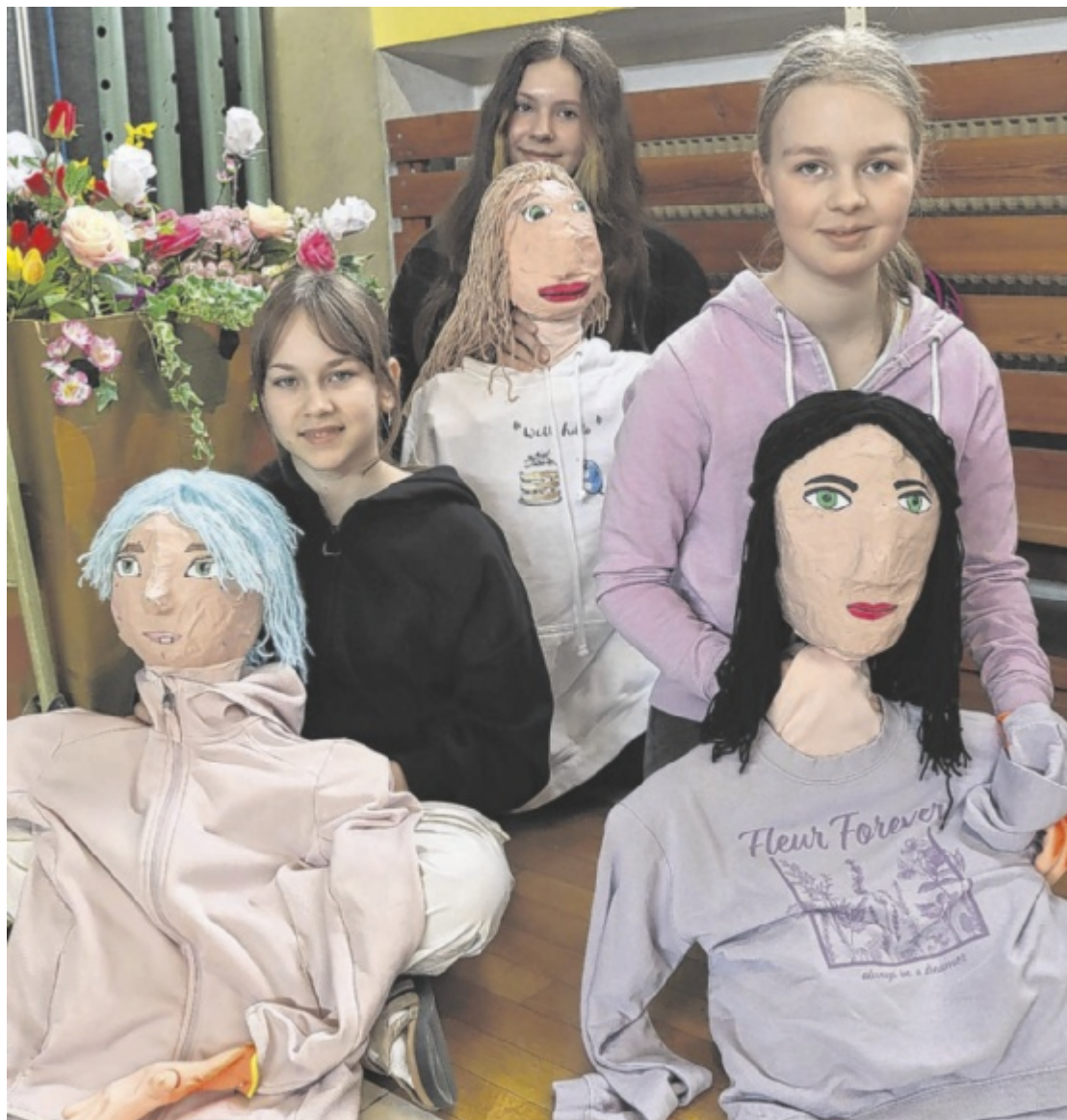
„Reden wir darüber“ Das Gymnasium Amstetten nimmt mit dem Projekt „Reden wir darüber ... in der Pause“ am Viertelfestival teil. Präsentation des Figurentheaters mit Filmszenen und Musik ist am 22. Mai. Seite 5