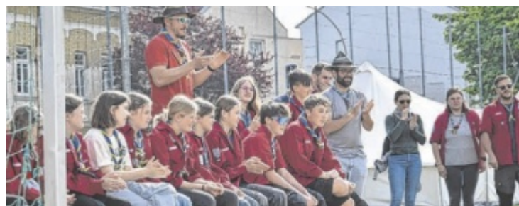
Die Kinder und Jugendlichen waren mit Begeisterung bei der Sache.

Weitere Informationen sind für Interessierte auf amstetten.bergrettung-nw.at zu finden. Die Bergrettung Amstetten freut sich auf zahlreiche Besucher. ■