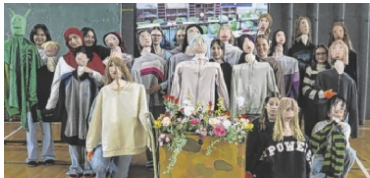
Die Schüler der Gruppe Sprache Kreativ proben das Figurentheater.