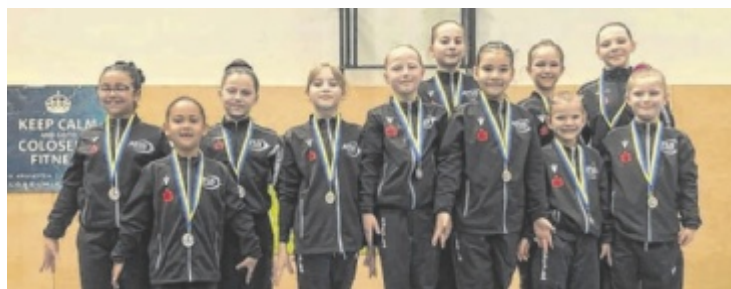
Sportakrobatikwettkampf in der Neuen Mittelschule in Amstetten