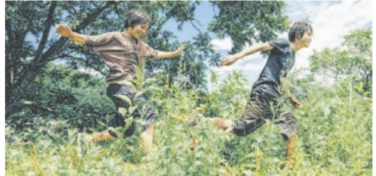
Freundschaftsbeziehung zwischen zwei Buben

Der zwölfjährige Minato bereitet seiner alleinerziehenden Mutter Saori Sorgen. Einmal kommt er mit nur einem Schuh von der Schule nach Hause, ein anderes Mal mit Verletzungen, und irgendwann kommt er überhaupt nicht heim. Offensichtlich stimmt etwas nicht mit ihm. Minato selbst denkt, er sei gar kein Mensch, weil ihm sein Lehrer Herr Hori angeblich erzählt hat, man hätte ihm ein Schweinehirn implantiert. Saori glaubt, dass Herr Hori ihren Sohn misshandelt;