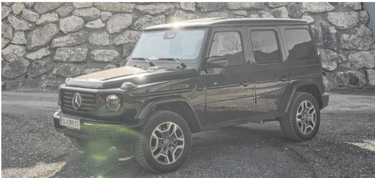
Der Mercedes Benz G 450 d ist ab 165.090 Euro zu haben.