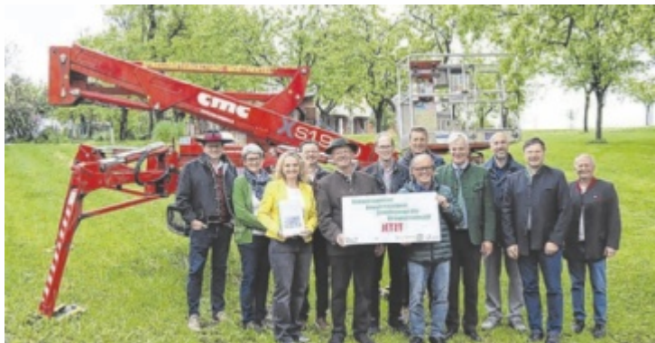
Die Projektverantwortlichen vor der Raupenarbeitsbühne

Alte Streuobstbäume sind ein kostbares Erbe, doch ihre Pflege ist eine Herausforderung: Ihre enorme Höhe und oft schwer zugängliche Lage machen konventionelle Schnittmaßnahmen nahezu unmöglich. Um dem entgegenzuwirken, wurde moderne Technik angeschafft – allen voran eine geländegängige Raupenarbeitsbühne mit einer Arbeitshöhe von bis zu 19 Metern. Ergänzt wird diese durch speziell entwickeltes Schnittwerkzeug. Danach wurden in Zusammenarbeit mit Projektpartnern zwei