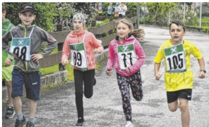
Benefiz-Friedenslauf am 6. Mai in Seitenstetten