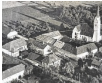
In Alkoven findet eine öffentliche Festsetzung des Gemeinderats anlässlich 80 Jahre Kriegsende statt.