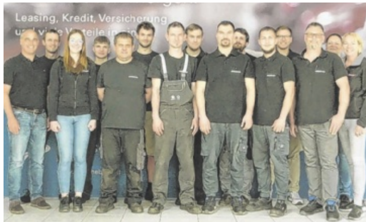
Das Team vom Autohaus Kneidinger in Eferding

Kneidinger ist damit ein fixer Player in der Region Eferding und hat sich als Servicepartner für die Marken Seat, Škoda und Cupra etabliert. „Exklusiv für Ihren Škoda ab vier Jahre bieten wir die Škoda Vorteilspakete für Bremsen, Starterbatterien, ... und sorgen so dafür, dass Ihr Auto ohne Sorgen altern darf. Profitieren Sie jetzt von günstigen Service- und Wartungsangeboten. Bedenken Sie: Speziell nach dem Winter sollte die Klimaanlage gereinigt werden, fragen Sie unser Team nach unseren Fixpreisangeboten.“