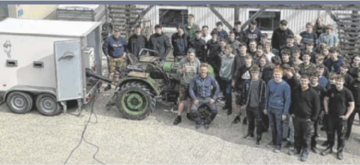
Traktorparade Viele Schüler der dritten Jahrgänge der landwirtschaftlichen Berufs- und Fachschule Waizenkirchen kommen nach ihren Abschlussprüfungen mit Traktoren zur Schule und veranstalten eine Traktorparade.

Für die Landl-Rallye anmelden kann man sich unter welcome@landl-rallye.at . Mehr Infos: www.landl-rallye.at ■