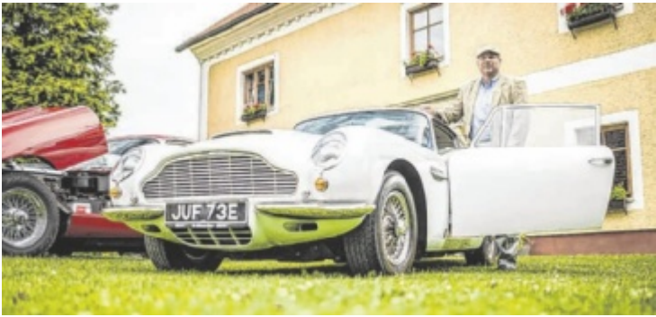
Die legendäre Landl-Rallye in Meggenhofen ist ein Fixpunkt für Oldtimer-Liebhaber.

Die Landl-Rallye, die sich als Fixpunkt im Kalender von Oldtimer-Enthusiasten etabliert hat, präsentiert heuer von 22. bis 24. August eine Auswahl an Legenden der Mobilitätsgeschichte. Vom frühen Motorrad bis hin zu revolutionären Automobilklassikern – bei der Oldtimerschau, das ganze Wochenende über am Gelände des Pfarrhofes Meggenhofen, erwartet die Besucher eine Zeitreise durch technische Innovationen und Design-Ikonen. Am Samstag, 23. August, startet um 9.31 Uhr die Rallye beim Pfarrhof Meggenhofen. Die 110