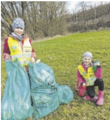
So wie in Taufkirchen haben in sehr vielen Orten Flurreinigungssaktionen stattgefunden.

Bereits seit 2006 wird die Flurreinigungssaktion vom Bezirks-