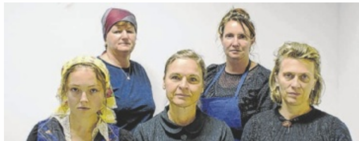
Fünf Schauspielerinnen präsentieren in Neukirchen das Stück „Pfeift“.