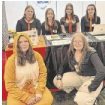
Eferdinger Schüler bei internationaler Übungsfirmenmesse

EFERDING. 21 Schüler der dritten Klasse der Handelsschule (HAS) Eferding reiste zur internationalen Übungsfirmenmesse in Barcelona. Damit nahmen sie als einzige Schule aus Oberösterreich (OÖ) an diesem Ereignis teil. Dort hatten die Schüler Gelegenheit, ihre unternehmerischen Fähigkeiten in einem internationalen Umfeld zu testen und Kontakte zu zahlreichen Übungsfirmen aus verschiedenen Ländern, darunter Spanien, Slowenien, Italien und Brasilien, zu knüpfen. Ermöglicht wurde die Reise durch die finanzielle