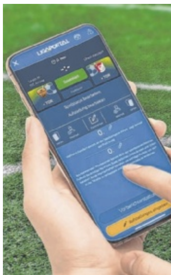
Bis zu 1.200 Fußballspiele pro Runde lassen sich in der Ligaportal-App live verfolgen.

Live-Ticker-Reporter sind hautnah dabei und erleben die Atmosphäre im Stadion oder am Fußballplatz unmittelbar mit. Sie sind die Augen und Ohren der Fans, die es nicht ins Stadion geschafft haben. Mit nur wenigen Klicks können sie in Echtzeit von entscheidenden Spielsituationen berichten und ihre Eindrücke mit tausenden anderen Fußballbegeisterten teilen.