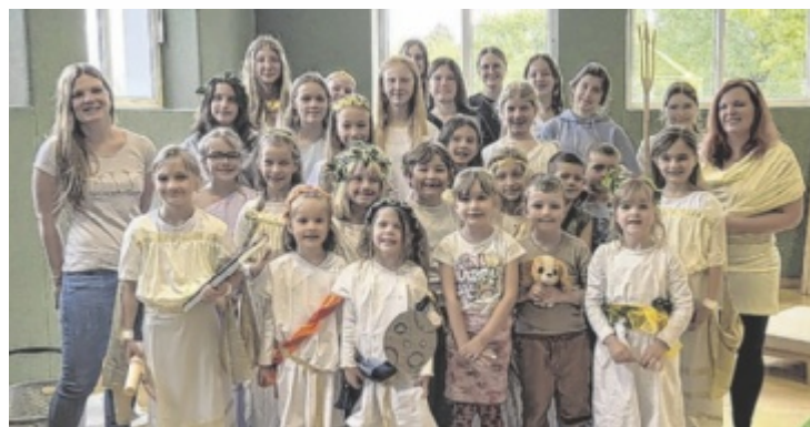
Beim Musical entführt der Michaelnbacher ChorALARM das Publikum mit den griechischen Göttern ins antike Griechenland und auf den Olymp.

olympiade“ frei nach dem Werk von Cäcilia und Johannes Overbeck auf. Die Kinder schlüpfen in die Rollen aus der griechischen Mythologie und präsentieren musikalisch einen Wettkampf der Götter. Der Eintritt ist frei. ■