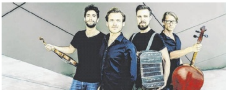
Das Cuarteto SolTango gastiert im Brucknerhaus.