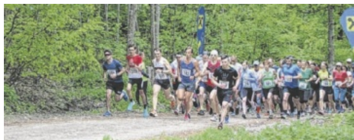
Durch die Natur geht es bei der Hausruck-Challenge und der Light Challenge mit Start in Geboltskirchen.