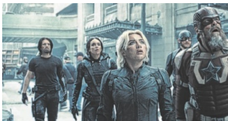
Bucky Barnes, Ghost, Yelena Belova, John Walker und Red Guardian/Alexei Shostakov müssen sich ihrer Vergangenheit stellen.