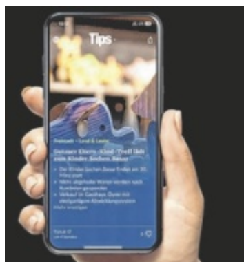
Personalisiertes Nachrichtenangebot dank smartem Algorithmus

*Quelle: ARGE Media Analysen MA 24, CMR Tips/tips.at; max. Schwankungsbreite +/-2,0 %. Onlinereichweite: Justierung an den Werten der Österreichischen Webanalyse.