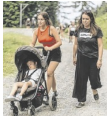
Mitmachen und Spenden für Kinder mit MPS sammeln

MPS Austria ist eine Gesellschaft mit Sitz in Scharthen, die Kinder mit MukoPolySaccharidosen (MPS) unterstützt. Bei der Bewegungschallenge sammeln die Teilnehmer von 1. bis 31. Mai 6.815 Bewegungsminuten und gleichzeitig Spenden für an MPS erkrankte Kinder. Die Bewegungsminuten können allein oder im Team, zu Fuß oder mit dem Rollstuhl zurückgelegt werden. Ein Starter-Paket kostet 35 Euro und dieser Unkostenbeitrag