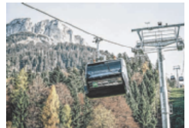
Mit der Panoramabahn auf 1.600 Meter Seehöhe

SALZKAMMERGUT. Die neue Panoramabahn auf den Loser mit 76 barrierefreien 10er-Kabinen bietet ganzjährig bequemen Zugang zur Bergwelt – ideal für Skifahrer, Wanderer, Rodler und Paragleiter. Auch Kinderwagen, Hunde und Bikes sind willkommen. Öffi-Anbindung und Top-Aussicht inklusive. Infos unter www.loser.at