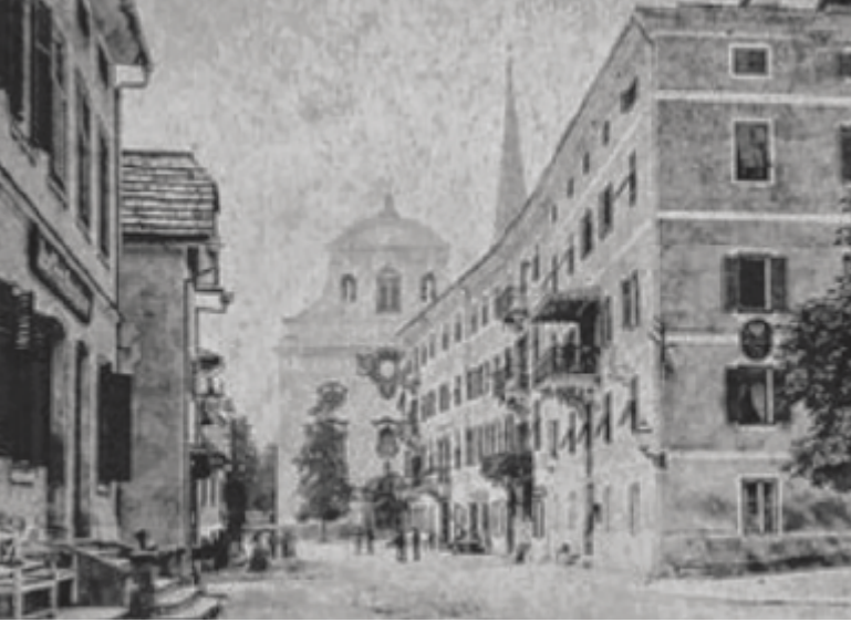
Bad Ischler Haus- und Familiengeschichten von anno dazumal.