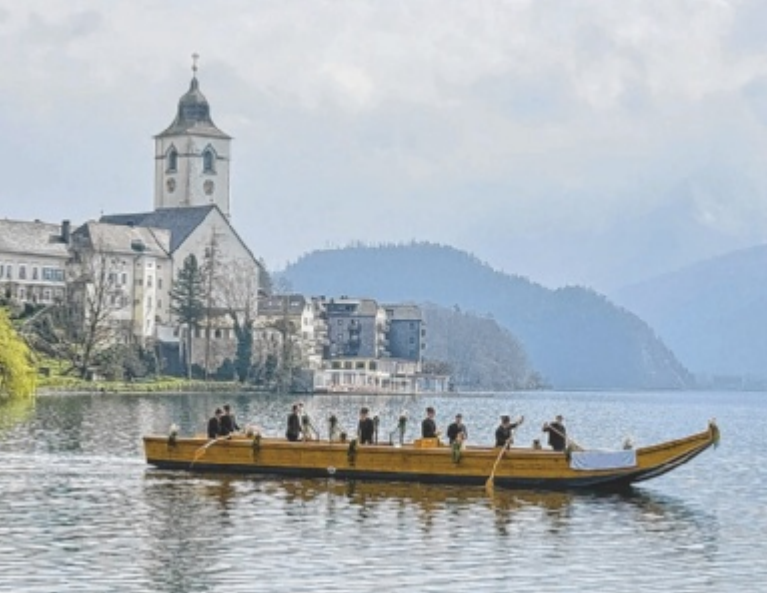
Das neue Traunerl vom Wolfgangsee wurde feierlich getauft.