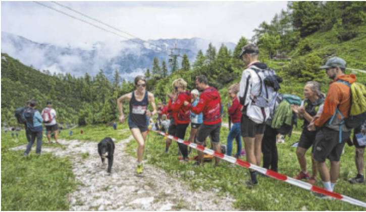
Athleten dürfen sich auf die bevorstehenden Lauf-Events freuen.