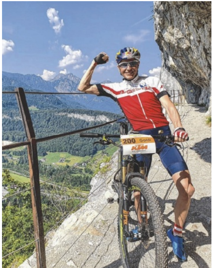
Auch Andreas Goldberger ist wieder mit dabei.