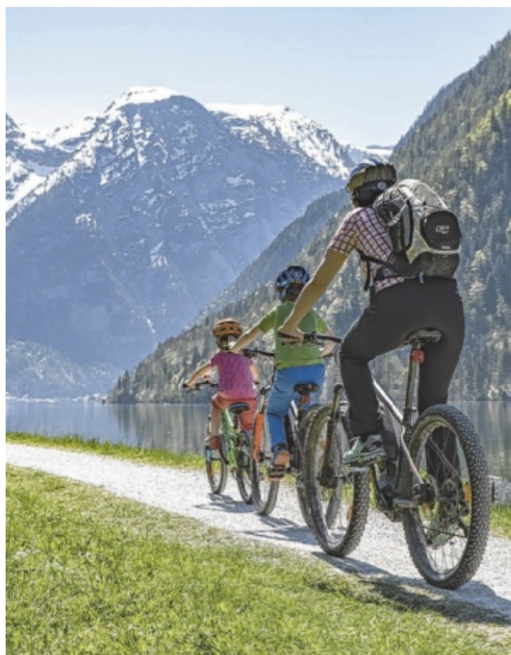
Familienfreundliches Erlebnis auf zwei Rädern

Die Inhalte werden über die kostenlose HUBLZ App bereitgestellt, die Texte, Audios und Spiele automatisch an den jeweiligen Stationen freischaltet. Die Route ist großteils eben, gut ausgebaut und ganzjährig nutzbar – perfekt für Familien, Schulklassen und Kulturfans. Alle Details auf www.dachstein-salzkammergut.at