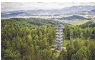
Aussichtsturm am Lichtenberg im Attergau

ATTERGAU. Der Attergauer Aussichtsturm am Lichtenberg bietet nach 208 Stufen einen traumhaften Rundblick über Attersee, Dachstein und Co – ein Highlight für Wanderer und Ausflügler.