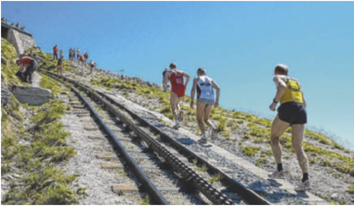
Jubiläum mit Panorama beim 25. Schafberglauf am Wolfgangsee