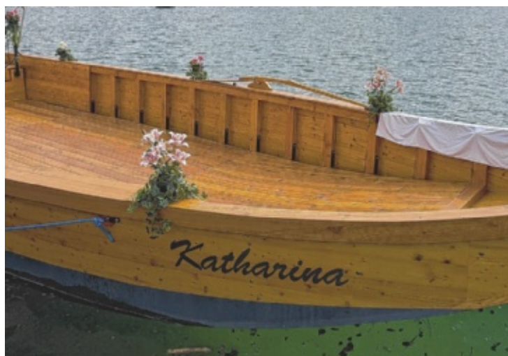
Der Name „Katharina“ soll an die kaiserliche Muse erinnern.