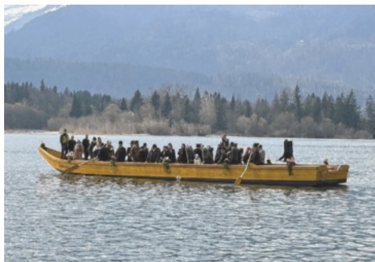
Bis zu 50 Personen finden auf dem traditionellen Holzboot Platz.