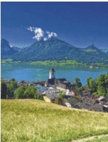
Blick auf die Pfarrkirche von St. Wolfgang und den See

ST. WOLFGANG. Der Bezirksjägertag in St. Wolfgang stand ganz im Zeichen der Verantwortung für Wild, Wald und Lebensraum. Mehr als 400 Jäger versammelten sich im Michael-Pacher-Haus, um über