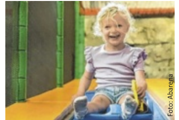
Geburtstag in der Abarena

Egal ob Sonnenschein oder Regen – hier gibt es indoor und outdoor unzählige Möglichkeiten, den besonderen Tag zu feiern. An warmen Tagen sorgen der Mini-Wolfgangsee, der Power Paddle Parcours, die Riesenröhrenrutsche und der Wasserspielplatz mit Staubecken für erfrischenden Spaß. Kletterabenteuer in der Westernstadt oder auf dem 14 Meter hohen Aussichtsturm sowie eine Runde auf der Go-Kart-Bahn garantieren unvergessliche Erlebnisse. Auch bei schlechtem Wetter gibt es auf zwei Ebenen viele Highlights: Spielestadt, Kleinkinderbereich, Kletterparcours, Carrera-Bahn und vieles mehr! Anzeige