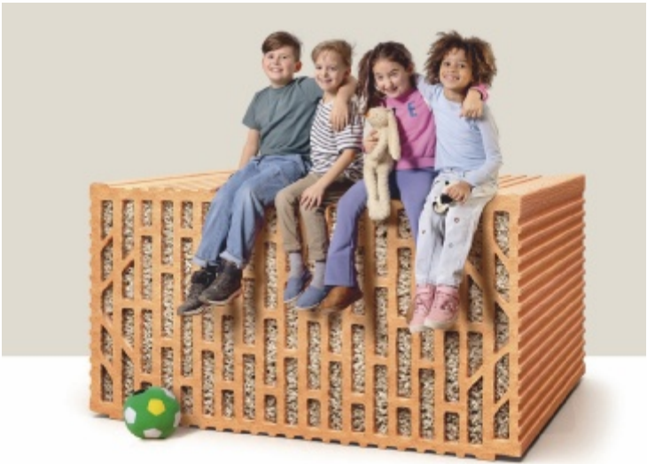
Der Grundstein für mehr Platz: Mit einem 38 Zentimeter Mauerwerk gewinnt man rund sechs bis zehn Quadratmeter Wohnfläche.

Ziegel bieten das ganze Jahr hindurch ein angenehmes Raumklima: Ganz natürlich und ohne jede künstliche Zusatzdämmung halten sie aufgrund ihrer hohen Speichermasse Innenräume im Winter heimelig warm und im Sommer angenehm kühl. Für alle die am neuesten Stand der Technik, mit hohem Schallkomfort und sehr guten Dämmwerten bauen möchten, empfehlen die Bauprofis von EDER Vollwertziegel: Sie sind