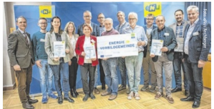
Vertreter der ausgezeichneten Gemeinden mit einem Taferl und Urkunden

Grundlage für den Erhalt der Auszeichnung war ein umfassender Energiebericht, der von der eNu überprüft und verifiziert wurde. Im Bericht enthalten sind neben den Energieverbräuchen der Gemeindegebäude und An-