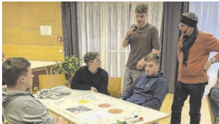
Bei der Projektbesprechung zum Thema „Essbare Schule“

ST. FLORIAN. Unter der Leitung von drei Betreuungslehrkräften arbeiten 50 Schüler des 3. Jahrgangs der HLBLA St. Florian klassenübergreifend im Projektmanagement-Unterricht am Thema: „Essbare Schule – Essbare Landschaft – Essbare Gemeinde“. In 17 Kleingruppen überlegten sich die Schüler, wie das Schulareal in eine „Essbare Schule“ verwandelt werden kann. Einige Arbeitsgruppen kooperieren mit der Stadt Enns. ■