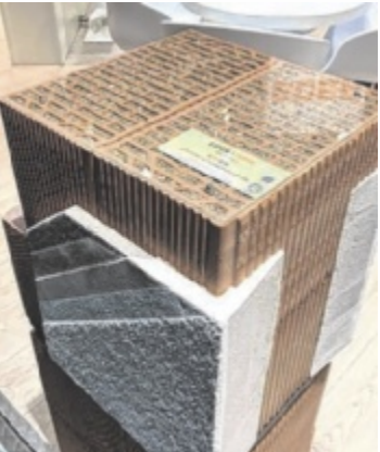
Kompakt und rein mineralisch, die Wand mit dem V38W Ziegel

Heizkosten und bei der Klimatisierung. Außerdem gewinnt man mit den 38 Zentimetern Wandstärke Wohnfläche. Bei einem durchschnittlichen Einfamilienhaus sind das sechs bis zehn Quadratmeter. Ohne Mehrkosten, dafür mit ausgezeichneten U-Werten. ■ Anzeige