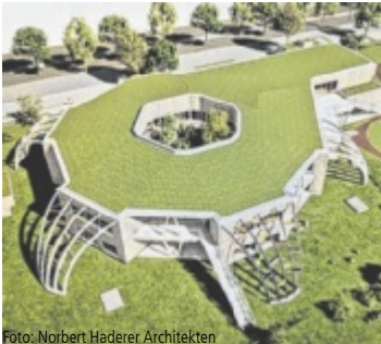
Foto: Norbert Haderer Architekten So soll das neue Kinderhaus aussehen.

Die Gesamtkosten für das Bauprojekt belaufen sich auf circa elf Millionen Euro, vom Land Oberösterreich gibt es Förderungen in Höhe von drei Millionen Euro. Der Bauzeitplan werde eingehalten, aktuell werde der Holzbau, beziehungsweise der Rohbau fertiggestellt. „Der Bau umfasst ein Erd- und ein Obergeschoß und bietet Platz für sieben Kindergartengruppen, fünf Krabbelstubengruppen und eine ‚multifunktionale Gruppe‘“, informiert Sandra Kiesel-