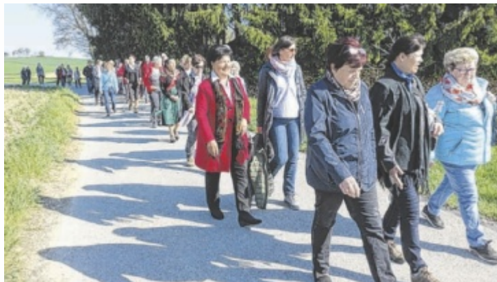
Beim Emmausgang nach Kanning