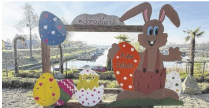
Ostern feiern beim donAu-Stand'l in Au.

Zwischen blühenden Bäumen, duftenden Blumenwiesen und dem sanften Rauschen der Donau spürt man: Der Frühling ist da! Die Natur erwacht und macht Lust auf Bewegung an der frischen Luft – sei es bei einer Radtour entlang des Donauradwegs oder bei einem Spaziergang durch das Naherholungsgebiet rund ums donAu-Stand'l.