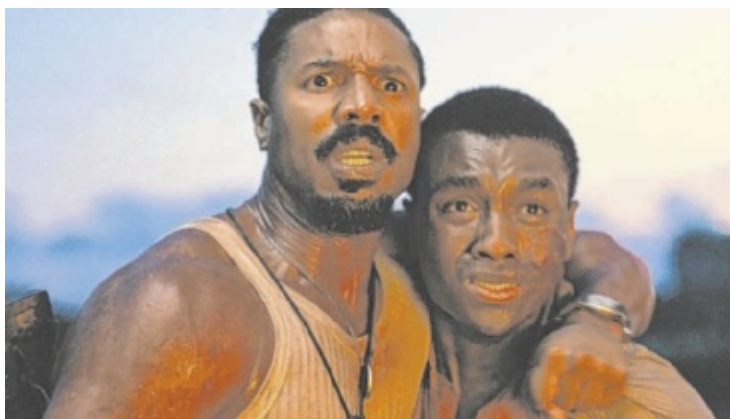
Blutiger Vampir-Horror mit Michael B. Jordan in einer Doppelrolle.