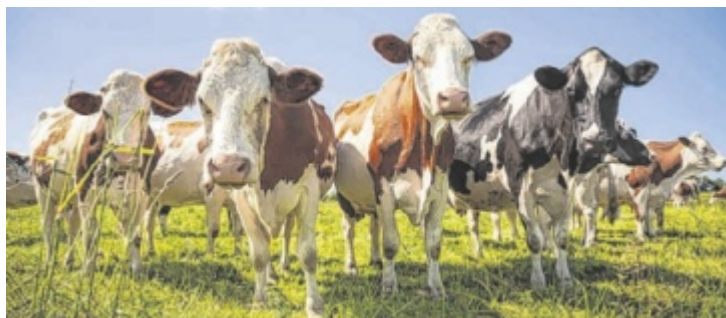
Derzeit (Stand Redaktionsschluss: 14. April, 16 Uhr) ist die Maul- und Klauenseuche noch bei keinem Betrieb in Österreich aufgetreten.