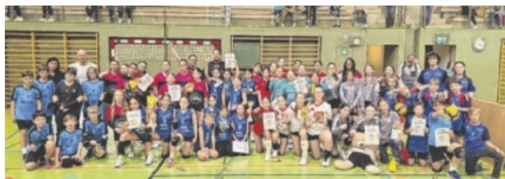
Rund 120 Kinder und 50 Erwachsene nahmen am Turniertag teil.