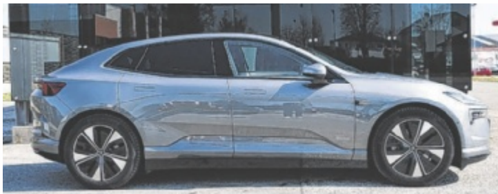
Der neue Polestar 4 Long Range Dual Motor

Überhaupt setzt Polestar auf ein Maximum an Digitalisierung, Analoges scheint der edlen Volvo-Tochter zuwider. Es gibt de facto keine Tasten, folglich erfolgt die Bedienung abseits der