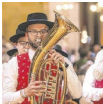
Bezirkssieger stehen fest

Welcher der Musikvereine die Bezirkswahl für sich entscheiden konnte und ins Landesfinale einzieht, wird bei der Siegerehrung am Dienstag, 22. April im Landesstudio des ORF OÖ bekanntgegeben. Ab 23. April ist das Ergebnis auf tips.at/sympathicus abrufbar. Alle Bezirkssieger starten anschließend in die Landeswahl – die Stimmen werden dafür auf null gesetzt. Gewählt wird weiterhin mit den Tips-Stimmzetteln (nur noch Landeswahl-Stimmzettel gültig)