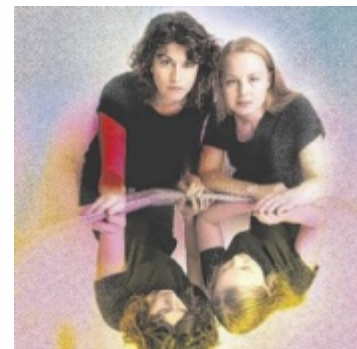
Verdoppelungen in Shakespeares Komödie der Irrungen

Für das Bühnenbild zeichnet Isabella Reder verantwortlich, für die Kostüme Natascha Wöss – beide gemeinsam mit Intendant