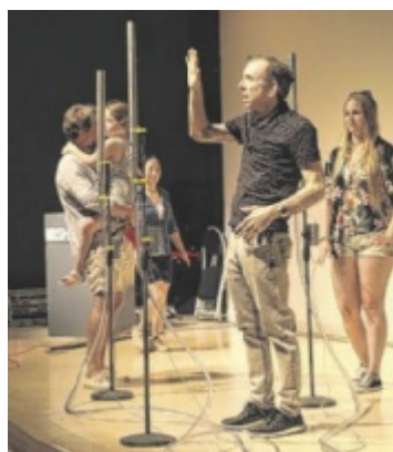
„close/distant“ Die interaktive Installation „close/distant“ gastiert erstmals im Gasthaus Rahofer in Kronstorf. Seite 31