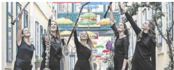
Klarinetten-Ensemble nimmt mit auf eine Klangreise.

STEYR. Am Vorplatz des Altenheimes am Tabor (Gottfried-Koller-Straße 2) steigt am Freitag, 11. April, von 13 bis 18 Uhr und am Samstag, 12. April, von 9 bis 13 Uhr wieder der Bücher-Flohmarkt von Vita Mobile. Infos unter www.vitamobile.at oder Tel. 07252 86999