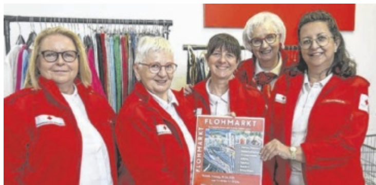
Freiwillige RK-Mitarbeiterinnen freuen sich über viele Flohmarkt-Besucher

nen dreimal pro Woche gemeinsam essen und plaudern. Freiwillige geben die Speisen aus, die Geselligkeit tut den Gästen gut. Um das Projekt zu finanzieren, hofft das Steyrer Rote Kreuz auf viele Besucher beim Flohmarkt. Es gibt Damen-, Herren-, Baby- und Kinderkleidung, Trachtenmode, Bettwäsche, Schuhe, Taschen, Tücher, Geschirr, Spielzeug, Schmuck und mehr. ■