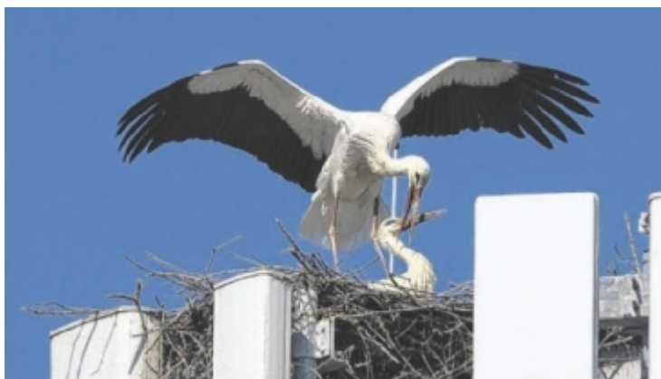
Storchennest im Pfarrkirchner Ortsteil Feyregg