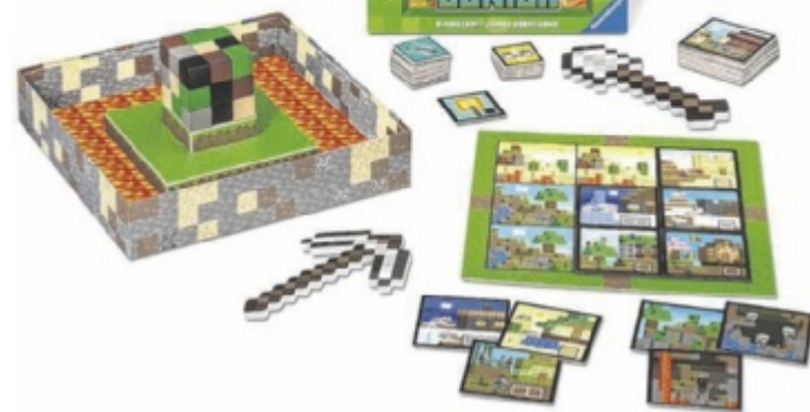
Ravensburger hat ein neues Minecraft-Kinderspiel herausgebracht.

Spitzhacke und Schaufel gilt es, die Blöcke abzubauen. Wer hat sich gemerkt, hinter welchen die Monster stecken? Für zwei bis vier Spieler ab fünf Jahren für 29,99 Euro (UVP) im Handel erhältlich. ■ Anzeige