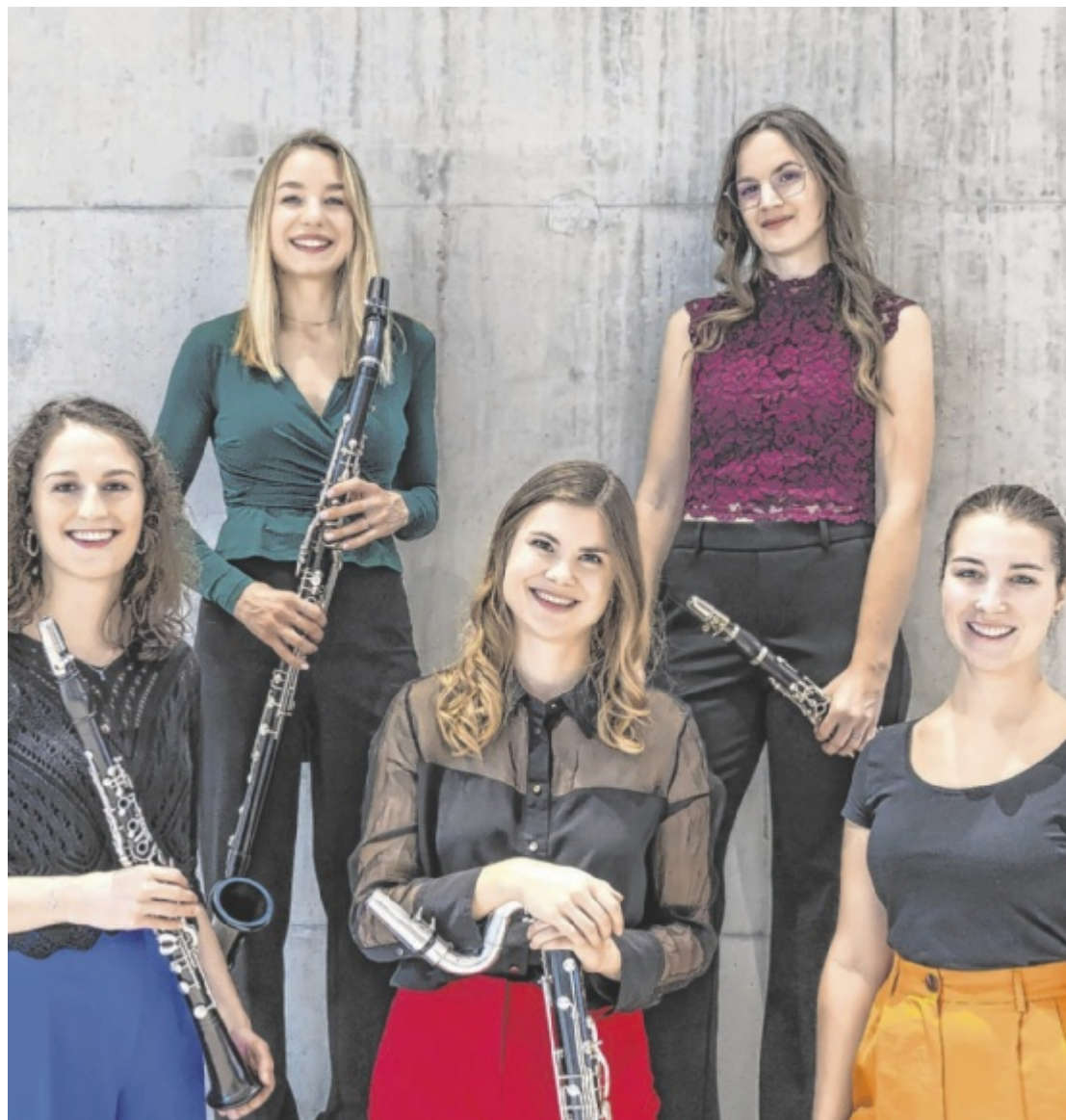
Klarinette in bunten Facetten Ein Konzert voller Klangfarben erwartet das Publikum am Samstag, 26. April, beim jungen Quintett „Farbenspiel“ in der Waldneukirchner Turnhalle.

Seite 26