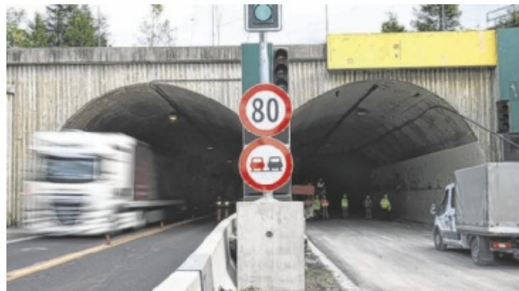
Bis 2027 investiert die Asfinag 41 Millionen Euro in die Erneuerung der Infrastruktur auf der A9.

Die erste Bauphase ist somit im November 2025 abgeschlossen, im gleichen Zeitplan wird dann ab März 2026 die Richtungsfahrbahn Voralpenkreuz bis November 2026 saniert. Nach Fertigstellung der Bauarbeiten auf der Richtungsfahrbahn Voralpen-