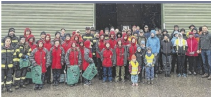
Gemeinsam geputzt Trotz schlechtem Wetter sammelten 150 Volksschüler und 80 weitere freiwillige Helfer bei der Aktion „Hui statt Pfui“ Müll von Straßenrändern, Wald und Wiesen im Gemeindegebiet von Wolforn.