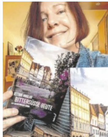
„Das Cover zeigt den Steyrer Stadt- platz, da ein Teil der Geschichte in Steyr, ein weiterer Teil in Ternberg spielt“, erzählt Astrid Miglar.

Ein typischer Krimi, in dem es Rechtsprechung seitens der Jus-