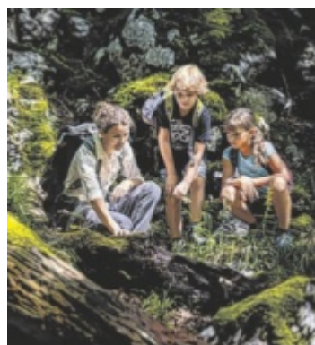
Die geheime Welt der Tiere fasziniert auch die Kinder.

nach und entschlüsseln ihre Geheimnisse. Gemeinsam erlernen Interessierte außerdem das Feiltmachen und Brotbacken und mit einem Spezial-Teleskop lassen sich Sonnen-Eruptionen beobachten. Begrenzte Plätze, Anmeldung bis jeweils 9 Uhr am vorherigen Werktag; www.steyr-nationalpark.at/erlebnis-shop ■