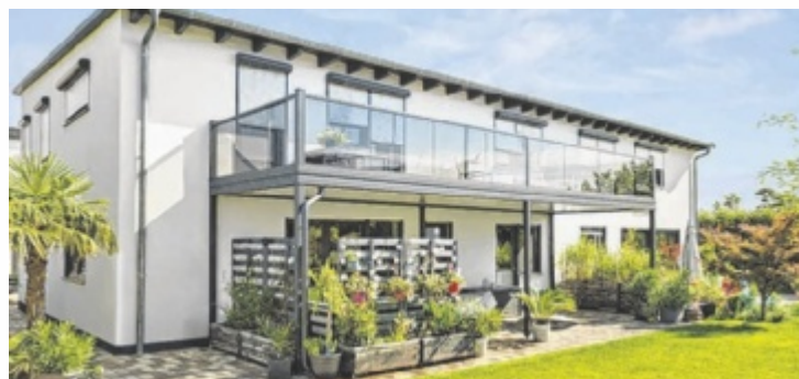
Ein nachträglich installierter Balkon von Leeb

Mit durchdachten Systemen und einem Design, das höchsten Ansprüchen genügt, passt sich Leeb jeder Architektur harmonisch und stilvoll an.