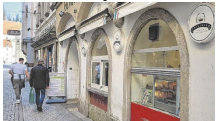
Die letzte Zellinger-Filiale in Steyr schließt am 17. Mai.

2019 stieg das Unternehmen Gourmetfein aus Michaelnbad (Bezirk Grieskirchen) bei Zellinger ein und hält seither 75 Prozent der Anteile. In Steyr verblieb letztlich nur noch die Zellinger-Filiale in der Enge, die nun bald Geschichte sein wird. „Die Frequenz in der Enge lässt einfach zu wünschen übrig. Die Filiale rechnet sich nicht“, erklärt