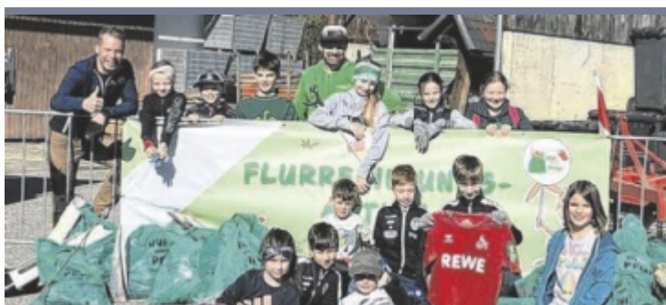
Flurreinigung Mit großer Unterstützung der örtlichen Vereine wurde bei bestem Wetter in Großraming die Flurreinigungsaktion durchgeführt. Als Dank gab es für alle Helfer eine Stärkung im Bauhof.