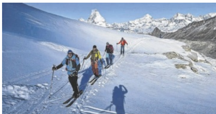
Die Gruppe aus Weyer war sechs Tage lang unterwegs.

Die Impfungen sind in bar zu bezahlen; Impfkarten mitnehmen.