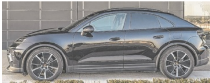
Der Porsche Macan 4 ist ab 86.761 Euro zu haben.

Doch statt von Gleichstrom und Ladepausen zu erzählen, wollen