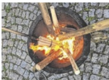
Die Tradition der Scheitlweihe (Oster-nacht) soll wieder aufleben.