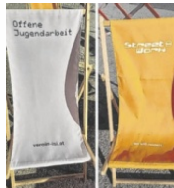
Die Steyrer Streetworker sind am Resthof (Werner-von-Siemensstraße 15) und im Stadtzentrum (Bahnhofstraße 1-3) zu finden.

Die Hilfe passt sich den jeweiligen Bedürfnissen an, sei es bei der Suche nach Verpflegung, einer Unterkunft oder in emotional be-