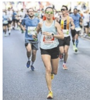
Der Linz Marathon lockt auch heuer wieder zahlreiche Profi-Athleten und Hobbyläufer an.