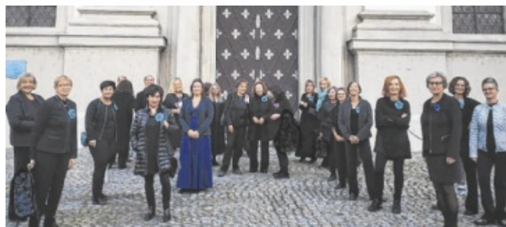
Women4voices singen für Friede, Hoffnung und Nächstenliebe.