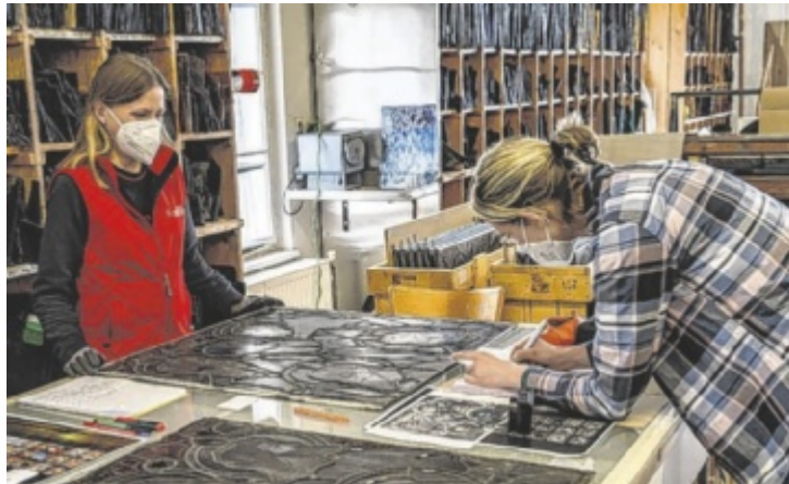
Die Restaurierung findet in Schlierbach statt.

Die Restaurierung des Gemäldefensters „Steyr“ wird in Zusammenarbeit mit der Glasmalerei Stift Schlierbach und unter fachlicher Begleitung des Bundes-