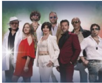
Bekannte Italo-Hits am 15. Mai im Stadttheater Steyr

La Banda Italiana, italienische Profimusiker und Stars der Pop-, Musical- und Opernwelt, präsentieren ein musikalisches Feuerwerk der Superlative. Hits von Zucchero, Laura Pausini, Al Bano & Romina Power, Andrea Bocelli, Eros Ramazzotti und vielen mehr versetzen die Zuschauer in Urlaubsstimmung. Einzigartige Stimmen und eine umwerfende Band werden Besucher mit ausgewählten Solo-, Duett- und Ensemblenummern ins Italienfieber singen. Bekannte Songs wie Gente Di Mare, Sempre Sempre, Felicità oder Buona Domenica animieren zum Mitsingen und Mittan-