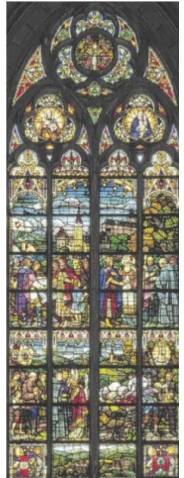
Gemäldefenster Steyr

und Querhauses – in diesem Bereich liegt auch das Fenster „Steyr“ – stellen die umfangreichste und berühmteste Fenstergruppe des Mariendoms dar. Sie wurden im Zeitraum zwischen 1910 und 1924 geschaffen. Das Gemäldefenster „Steyr“ schildert im oberen Bereich die Gründung der Benediktinerklöster Garsten und Gleink. Die gotische Burg Steyr bildet den Hintergrund der Szene. Im unteren Bild wird die Legende von der Entstehung des Wallfahrtsortes Frauenstein erzählt. Das untere Feld zeigt den Wallfahrtsort Maria Neustift mit der Kirche „Maria Heil der Kranken“. ■