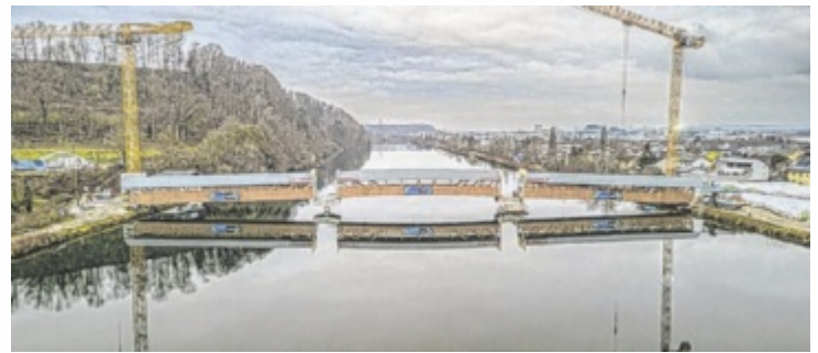
Die Brückenteile sind montiert. Die Aussichtsplattformen fehlen noch.

Die rund 400 Kubikmeter Holz entfallen zu rund drei Vierteln auf die Tragkonstruktion, den Belag und das Dach. Das restliche Viertel fand für die Schalung, das Geländer und die Fassade Verwendung. Weiters verbauten die Arbeiter rund 65 Tonnen Stahlteile und Verbindungsmittel. Die Dacheindeckung besteht aus 270