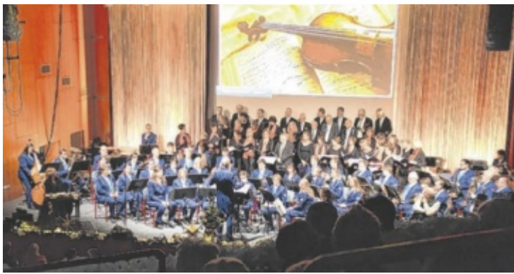
Immer wieder schön: Das Weihnachtskonzert mit und für die Lebenshilfe.