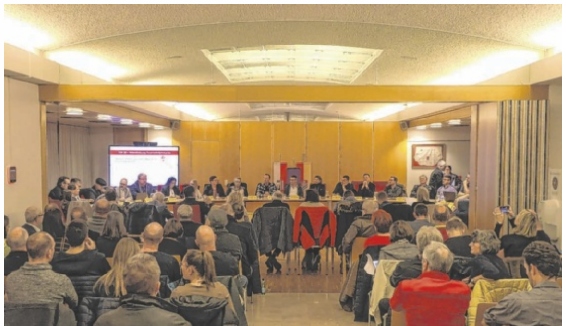
Viele Zuhörer bei der Sitzung des Marchtrenker Gemeinderates

Die Freiheitlichen kritisieren den fehlenden Sparwillen: „Wir heften