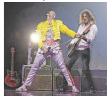
Die Sänger erwecken Freddie Mercury und Queen zum Leben.

„A Tribute to Freddie Mercury“ bietet eine extravagante Bühnenshow mit Lederoutfits, barocken Kostümen und Fantasieuniformen ergänzt durch Videoprojektionen, Tanz und internationale Top-Sängerinnen. Eine der besten Queen-Tribute-Bands der Welt erweckt den Künstler, Sänger und Menschen „Freddie Mercury“ zum Le-