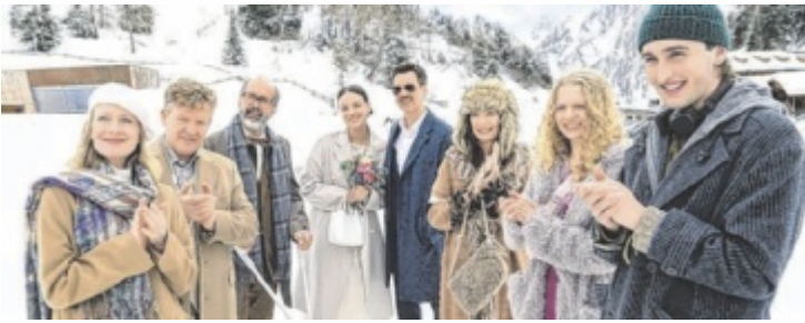
Deutsche Komödie mit Starbesetzung