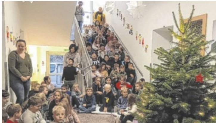
Gemeinsam werden die Briefe und Pakete geöffnet.

So lernen die Kinder den Kontinent und die kulturellen Unterschiede und Ähnlichkeiten besser