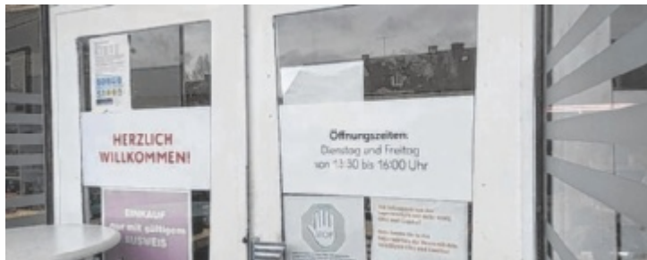
Einsng zum Rot Kreuz Marchtrenk.

Die Tips-Leser können im Rahmen der Aktion Tips Glücksstern mit einer Spende helfen, um so vielen Familien wie möglich