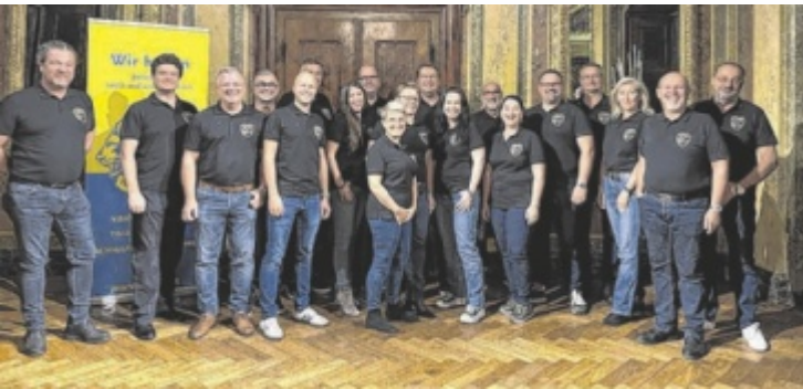
Das Team des Lions Club Puchberg

sentierten eine Vielfalt an weihnachtlichen Dekorationen, handgefertigten Geschenken und köstlichen Keksen. Viele Besucher nutzten die Gelegenheit, die ersten Weihnachtsgeschenke zu kaufen und dabei auch mit Freunden und Nachbarn ins Gespräch zu kommen. ■