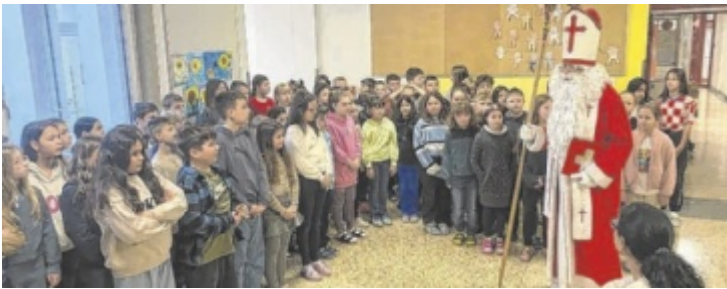
Die Kinder hörten die Nikolaus zu und sangen auch für ihn.