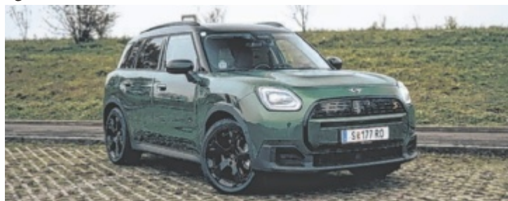
Der MINI Countryman SE All 4 ist ab 49.500 Euro zu haben.

Als „SE All 4“ bringt der Countryman erwähnte 306 PS samt 494 Newtonmeter enorm druckvoll auf die Straße. Bei einem Sprint von null auf 100 km/h in 5,6 Sekunden muss sich selbst das sportliche Top-Modell JCW warm anziehen. Ob man das in einem E-SUV jetzt unbedingt haben muss, steht wieder auf einem anderen Blatt Papier. Dort stehen auch die maximale Reichweite von 432 Kilometern, maximal 130 kW Ladeleistung und ein Verbrauch von 17,4 kWh auf 100 Kilometer. Das volle Potential sollte man nur wohlbedacht ausreizen. Wer sich die Kräfte aber gut einteilt, vielleicht mal in