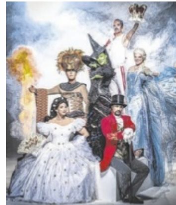
Die Nacht der Musicals

WELS. Diese Show ist von Europas Bühnen nicht mehr wegzudenken. Abwechslungsreich, vielfältig und einzigartig. Seit mehr als 20 Jahren gastiert die erfolgreichste Musicalgala in mehr als 150 Städten in ganz Deutschland und Österreich. Weit über zwei Millionen Besucher haben die Show bereits mehrfach gesehen. Und so tourt „Die Nacht der Musicals“ auch 2025 durch Österreich und kommt am 6. Jänner 2025 um 19.30 Uhr in das Stadttheater Wels.