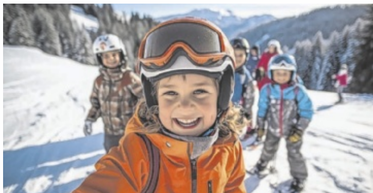
Leistbares Skivergnügen für die ganze Familie gibt's am Kasberg.

Im Skigebiet Kasberg geht es freundschaftlicher, familiärer und gemütlicher zu als in den anonymen Massen-Skigebieten Westösterreichs. Der Retro-Charme inmitten intakter Natur mit ausgedehnten Wäldern weckt längst vergessene Gefühle aus einer Zeit, in der das Skifahren noch für Entspannung in winterlichen Landschaften stand. Statt sich mit zigtausenden Skifahrern über die Hänge zu „wälzen“, erleben Groß und Klein am Kasberg 23 bestens