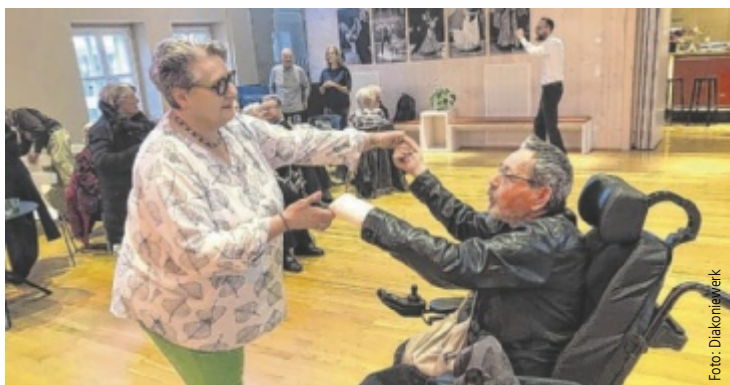
Bewohner aus dem Haus für Senioren machten einen Ausflug in die Tanzschule.