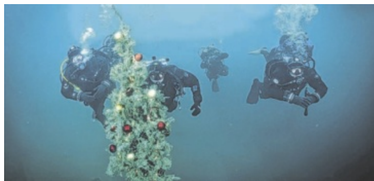
Der schön geschmückt Christbaum wird am Traundgrund verankert.

Mitspielen bis 06.02.2025/08:00 Uhr www.tips.at/g/24359 oder SMS an 0676 8002525 Text: „24359 Vorname Nachname“