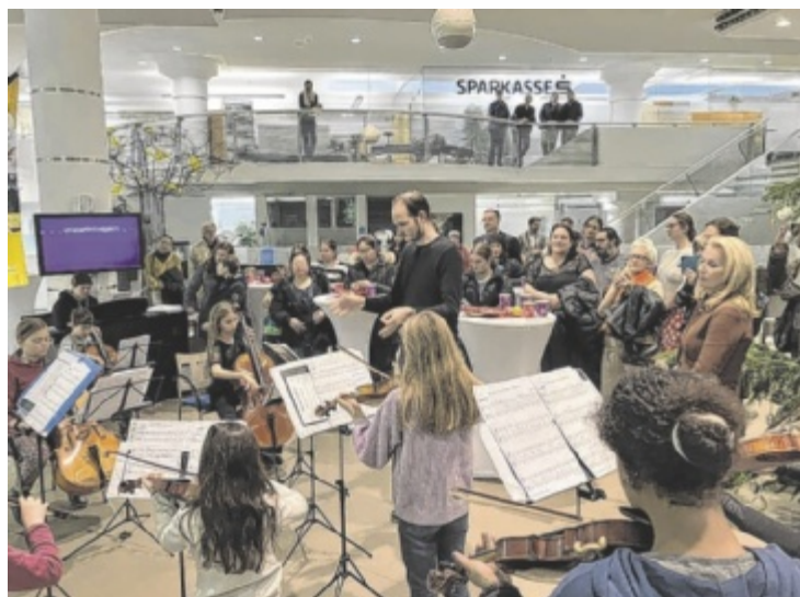
Aufgespielt bei der Sparkasse Oberösterreich in Wels

Eines wird den Kindern mit dem Projekt auf jeden Fall klar: Egal, welche Sprache die Kinder sprechen, ob sie auf das Christkind, den Weihnachtsmann, Pere Noel oder die Hexe Befana warten – was sie alle verbindet, ist: Sie alle freuen sich auf Weihnachten, das Fest des Friedens. ■