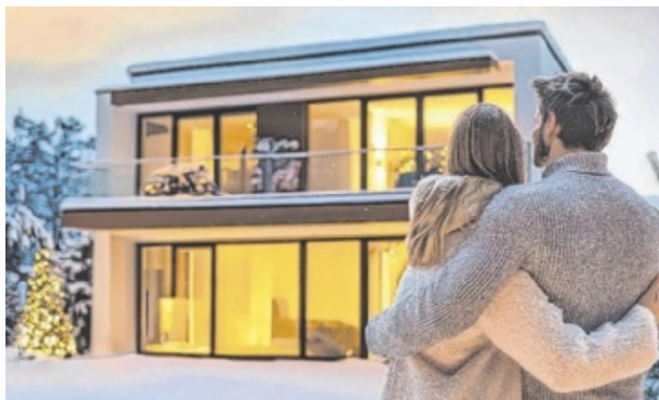
Jetzt starten und Weihnachten 2025 im eigenen Haus feiern!

Schluss mit Warten! Weihnachten 2025 kann ein ganz besonderes Weihnachten werden, das erste Weihnachten im neuen, eigenen Haus. Für unzählige Familien macht WIMBERGER diesen Traum wahr und schafft damit die unvergesslichen Momente mit Duft von frisch gebackenen Keksen, einem festlich geschmückten Baum und dem Lächeln ihrer Liebsten. Als verlässlicher Partner bietet WIMBERGER nicht nur individuelle Lösungen, die perfekt auf die Kundenwünsche abgestimmt sind, sondern stellt auch Expertenwissen für die Finanzierung des neuen Eigenheimes zur Verfügung. Mit der Fixpreisgarantie ist das Budget für jedes Bauprojekt zudem von Anfang an unter Kontrolle.