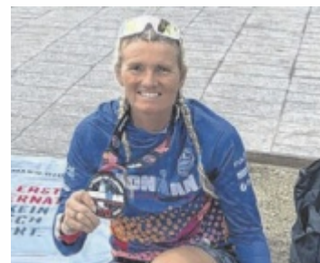
Die Finisher-Medaille musste sich die Mühlviertlerin hart erkämpfen.

ritten Ironman 2024. Nach einer Erholungsphase stehen 2025 zwei weitere Ironman auf dem Plan – am Weg zum großen Ziel, dem Ironman Hawaii. Unterstützt wird sie dabei von ihren Töchtern und ihrem Mann, der bei den Wettkämpfen immer mit dabei ist. ■