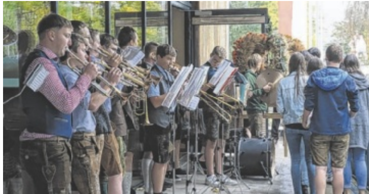
Beim Erntedankfest am Sonntag feierte die Bioschule Schlägl auch pädagogischen Erntedank.