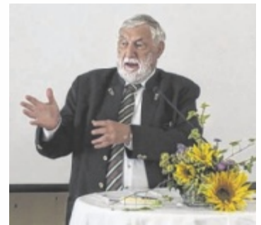
Franz Fischler sprach über die Zukunft der Landwirtschaft.

aber nicht auf sich alleine gestellt sein – wichtig ist auch, an die Veredelungskette zu denken“, betonte Fischler. „Was der Bauer an Qualität hineinsteckt, darf später nicht kaputt gemacht werden. Die Produktion von Lebensmitteln oder agrarischen Rohstoffen muss eingebettet sein in gesellschaftliche Vorgänge und Vorgänge der Natur.“ Und er ergänzte: „Es müsste uns gelingen, dass alle miteinander Modelle entwickeln, die jungen Landwirten und Hofübernehmern eine gute Zukunft bieten.“ ■