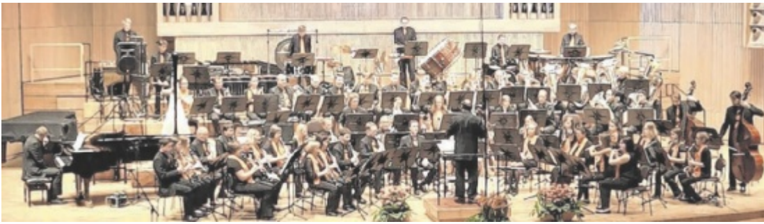
Das Sinfonische Blorchester Ried hat sich zu einem führenden internationalen Klangkörper entwickelt.