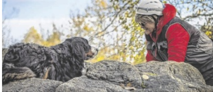
Hundesport in verschiedensten Disziplinen wird gezeigt.

Über die vergangenen Jahrzehnte hat sich der SVÖ einen Namen als kompetenter Veranstalter von Großereignissen gemacht und als solcher will sich der Hundeverein jetzt erneut beweisen. Gestartet wird von 24. bis 27. Oktober: Dann findet die IHF (Internationale Hovawart-Föderation) Dreifach-WM in Wandschaml statt. Die besten Hundesportler aus den Disziplinen IGP (Internationale Gebrauchs-