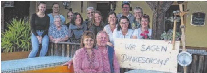
Im März 2025 ist endgültig Schluss im Straßhäusl.