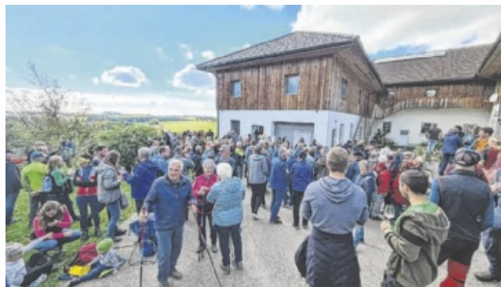
Großartiger Erfolg für die erste Niederwaldkirchner Genussroas

Genuss für Gaumen und Seele gab es auch bei der ersten Niederwaldkirchner Genussroas, an der bei strahlendem Herbstwetter mehr als 300 Genusswanderer teilgenommen haben. Live-musik, erfrischender Most, frischgepresster Apfelsaft, vor