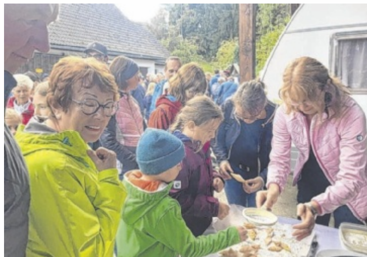
Die Polsterzipf fanden reißenden Anklang – Rezept dazu im Infostöckerl

Mehl mit den übrigen Zutaten auf dem Brett zu einem glatten Teig verarbeiten und eine halbe Stunde kühl rasten lassen. Den Teig dünn auswalken, nach Belieben in Drei- oder Vierecke ausradeln und in heißem Butterschmalz schwimmend herausbacken. Nach dem Überkühlen überzuckern.