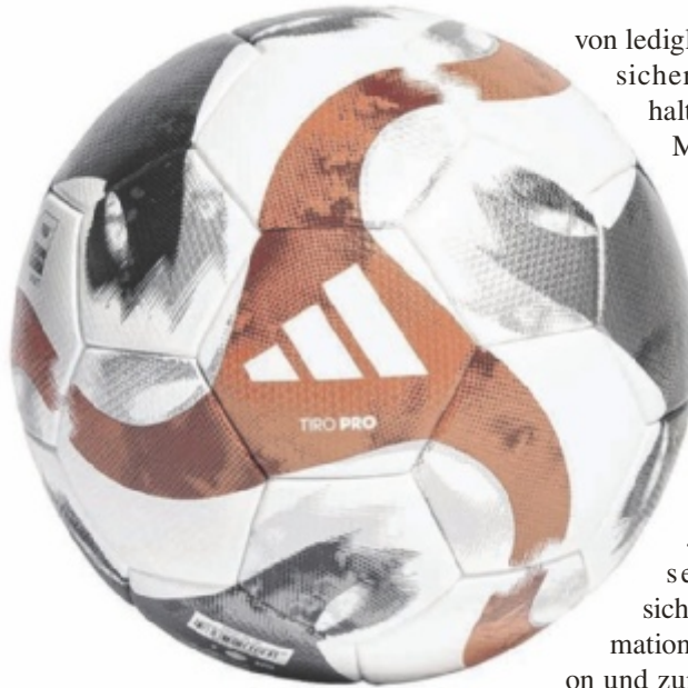
adidas Tiro PRO 23 Matchball um nur 10 Euro

Dieses exklusive Angebot wird in Kooperation mit einem Partner-Unternehmen abgewickelt. Alle Neukunden sind für eine Teilnahme berechtigt, es werden exakt 100 Matchbälle zur Verfügung gestellt. Eine einfache Registrierung und eine Zahlung