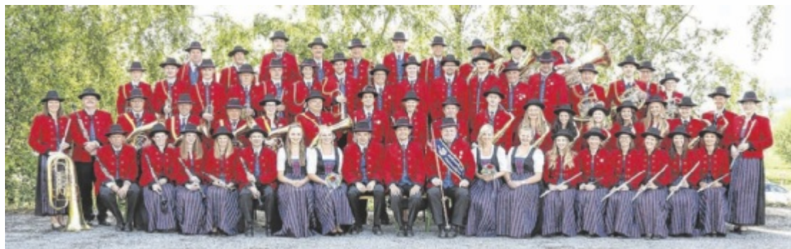
Für den Musikverein Niederwaldkirchen steht wieder ein großer Auftritt im Ausland bevor.