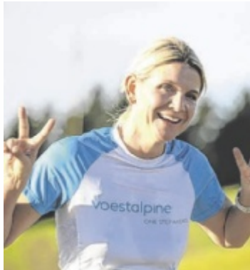
Laufend geht's am 2. November durchs Pesenbachtal.

Am Vormittag, ab 9.30 Uhr, starten in Lacken die jüngsten Teilnehmer beim Wirt in Pesenbach Kinderlauf. Die Streckenlänge beim Kinderlauf beträgt zwischen 50 und 1.350 Meter. Alle Kinder werden mit einem Finishersackerl belohnt. Nach jeder Altersklasse erfolgt sofort die Siegerehrung in der Asphaltstockhalle in Lacken. Die Mitglieder der Freiwilligen Feuerwehren können beim Pesen-