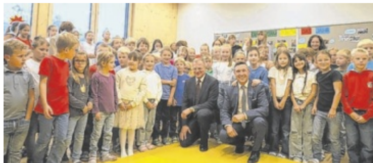
Bürgermeister Harald Haselmayr und Landeshauptmann Thomas Stelzer feierten mit den Kindern die Eröffnung der neuen Volksschule.

Knapp eine Woche werden die Musiker unterwegs sein. Rechtzeitig zum Allerheiligen-Fest sind sie aber wieder daheim, um dieses festlich zu gestalten. ■