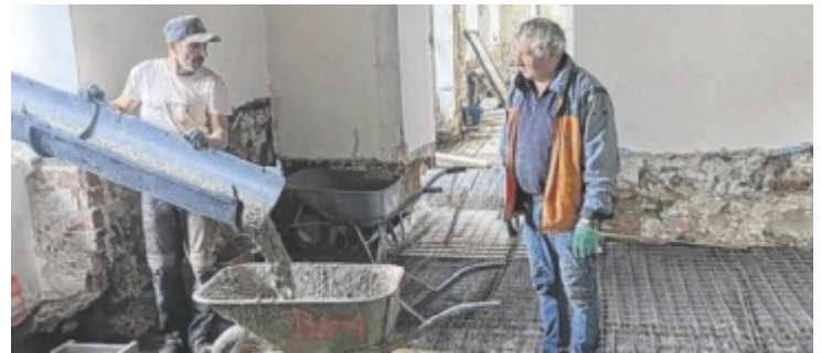
Auf der Baustelle läuft es wie geschmiert.