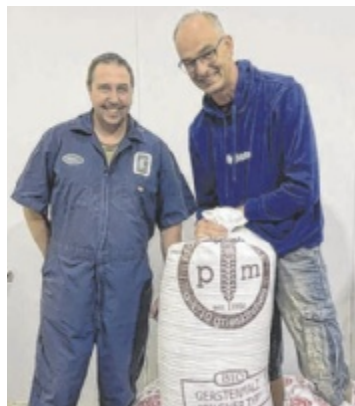
Heines-Haisa-Malz aus dem Mühlviertel