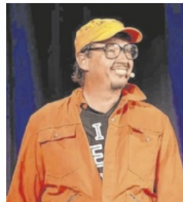
Kultfigur Sepp Bumsinger

Die Zuschauer lachen Tränen und sind am Schluss sicher: Zeit ist zu kostbar, um sich darum zu scheeren, was andere über einen denken. Der bessere Weg zum Glück