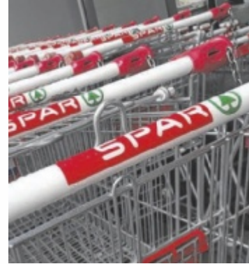
Helfenberg droht einen wichtigen Nahversorger zu verlieren.

Thema Nahversorgung ein Kernthema einer Gemeindefrastruktur ist. Gott sei Dank haben wir ein tolles Gasthaus und wieder eine super Bäckerei am Ortsplatz, die aber auch nicht alles auffangen und ersetzen können.“ Die Gemeinde werde sich selbstverständlich einbringen und sich bemühen, wieder eine Versorgung auf die Beine zu stellen. „Es wird abermals eine große Herausforderung werden“, so Hintenberger. ■