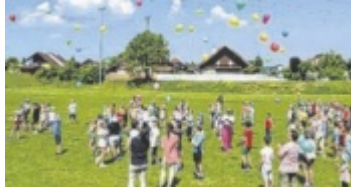
Die VS Rüstorf sicherte sich im Vorjahr Platz eins in der Kategorie „Bewegung in der Schule“.

OÖ. Tips sucht gemeinsam mit der Sparkasse OÖ und dem Land OÖ wieder die Spitzenschulen Oberösterreichs. Jetzt gleich Projekte einreichen.