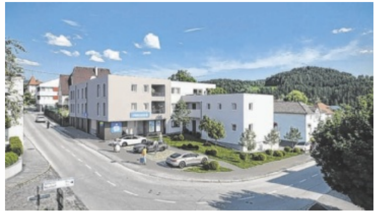
So soll die neue SMW-Filiale samt Wohnhaus aussehen.

Bewohner wünschen sich, dass die Grünfläche im Ortszentrum erhalten bleibt.