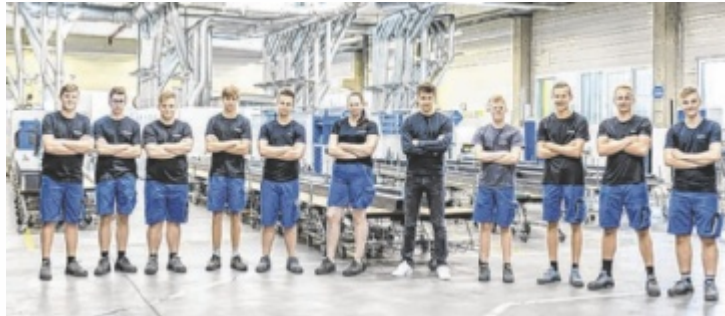
Die Fachkräfte von morgen bei Röchling Industrial Oepping

Die Firma Oberaigner Powertrain mit Sitz in Nebelberg ist in der Fahrzeugtechnik, im Besonderen mit Allradantriebssystemen, tätig. Auch Komponenten für die E-Mobilität werden entwickelt und produziert. Im Werk Nebelberg werden diese in der mechanischen Fertigung hergestellt, und in der eigenen Montage zu den Aggregaten zusammgebaut. Der hohe Qualitätsstandard begleitet den Betrieb in allen Bereichen, so auch in der Lehrlingsausbildung. Jedes Jahr werden vier junge Menschen neu im Lehrberuf Metalltechnik/Zerspanungstechnik aufgenommen. Die Lehrlinge beginnen mit einer soliden Grundausbildung in der Metalltechnik im hauseigenen Bereich mit eigenen Lehrlingsmaschinen und werden mit dem Qualitätswesen des Betriebes vertraut. Die Einbindung