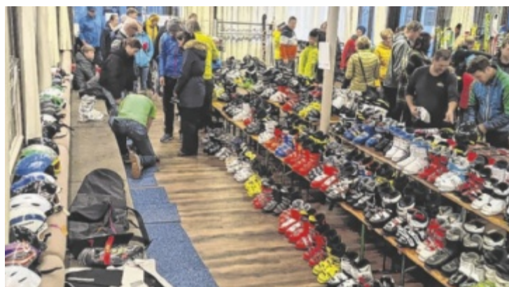
Geplant für heuer: noch mehr Angebote und Auswahl

Eine Anlieferung der Ware ist am Freitag, 18. Oktober 2024 zwischen 15 und 20 Uhr möglich. Der Verkauf erfolgt am 19. Oktober 2024 in der Zeit von 8 bis 15 Uhr. Die Abrechnung und Abholung der nicht verkauften Artikel ist zwischen