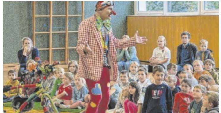
Der Klimaclown kam zum Projektauftritt in die VS Altenfelden.