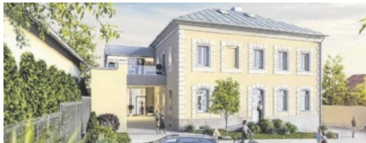
Aus dem ehemaligen Gerichts- und Gefängnisgebäude wird ein modernes Büro- und Kompetenzzentrum mit Shared Office-Konzept.

ROHRBACH-BERG. Das ehemalige Gerichts- und Gefängnisgebäude im Zentrum von Rohrbach-Berg bekommt eine neue Nutzung: Nach fast drei Jahren Planung und Entwicklung, entsteht in dem denkmalgeschützten Gebäude das Gerichtsquartier, in dem Notariat, flexible Arbeitsplätze und Büros sowie ein Future-Lab Platz finden.