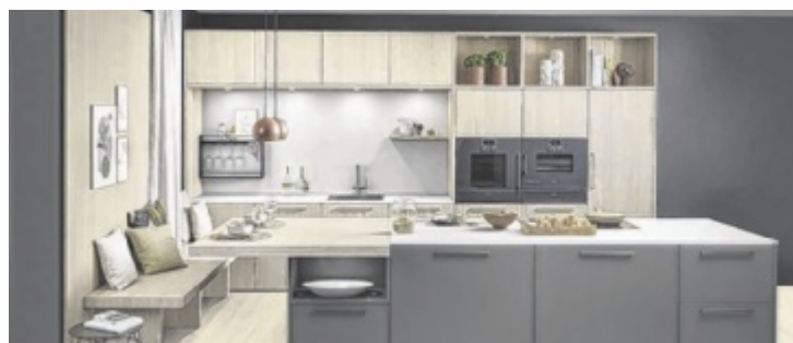
Hannerer plant attraktive Küchen, flexibel angepasst.

Individuelle Wohnideen werden bei Hannerer in der Tischlerei gefertigt und von Fachleuten montiert. Dank der renommierten