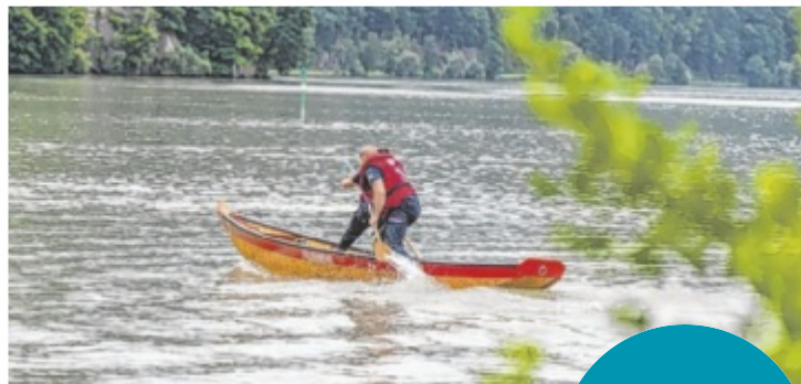
Die FF Neuhaus-Untermühl wird als Wasserstützpunkt bestehen bleiben und auch die Zillenbewerbe weiterhin veranstalten.

Im Sommer gab es eine Mitgliederversammlung mit Abstimmung. „95 Prozent der Kameraden – Aktive ebenso wie Reservisten – werden übertreten und Teil der FF Plöcking werden“, freut sich Bürgermeister Manfred Lanzersdorfer über den Erfolg nach den Gesprächen, Klausuren und Arbeitsgruppen-Treffen. Das Feuerwehr-Haus in Untermühl wird Stützpunkt für die Wasserwehr bleiben. Den Rest des