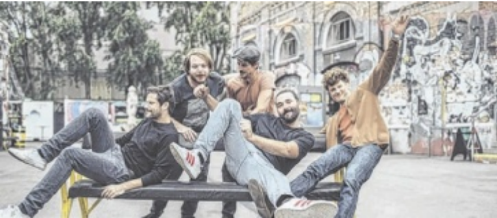
Granada sorgen im Posthof für gute Laune.