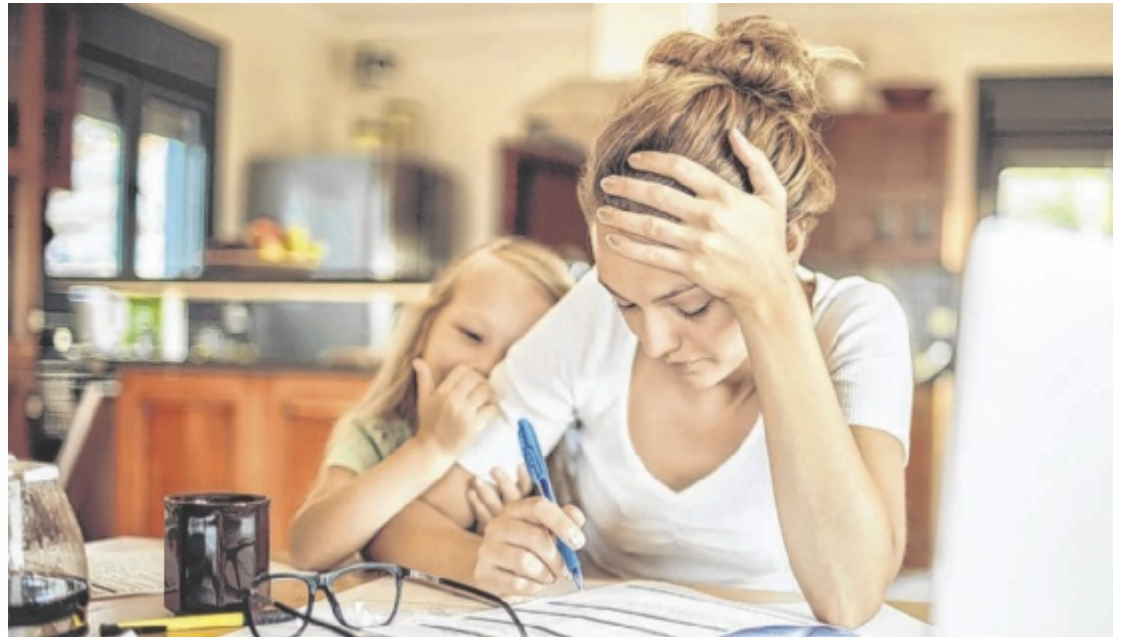
Finanzielle Unabhängigkeit und Kostenklarheit schützen vor unangenehmen Überraschungen.

Familienentscheidungen haben oft finanzielle Konsequenzen, meist zum Nachteil der Frauen. Sie sollten daher mit Blick auf die Altersvorsorge beider Elternteile getroffen werden. Wie Fami-