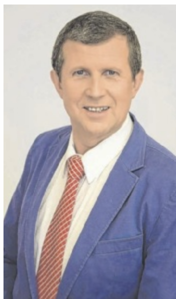
AWZ ist der Ansprechpartner, wenn es um Immobilien geht.

Wer ein Haus, eine Wohnung oder ein Grundstück sucht oder eine Immobilie veräußern möchte, der ist bei AWZ Immobilien genau richtig. Auch Erbengemeinschaften und Immobilien aus Scheidungsfällen sind für AWZ von besonderem Interesse. Für Pensionisten bietet das Unternehmen zudem eine attraktive Möglichkeit: Man kann seine Immobilie verkaufen und dennoch darin wohnen bleiben. „Wenn Sie ein Haus, eine Wohnung oder ein größeres Grundstück zu verkaufen haben, freue