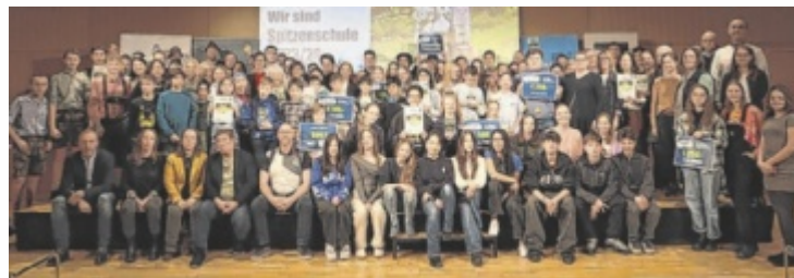
Die prämierten Schulen werden angemessen bei der Siegerehrung gefeiert.

Im Vorjahr wurden 74 Projekte eingereicht. Die VS Rüstorf, Tourismusschule Bad Ischl, Bioschule Schlägl und die Volksschule Kirchham sicherten sich jeweils den ersten Platz in einer der vier Rubriken. Über den Publikumspreis entschieden 26.053 Leserstimmen via Online-Voting und Stimmzettel. Gewonnen hat diesen die Höhere Technische Lehranstalt Braunau mit insgesamt 5.429 Stimmen.