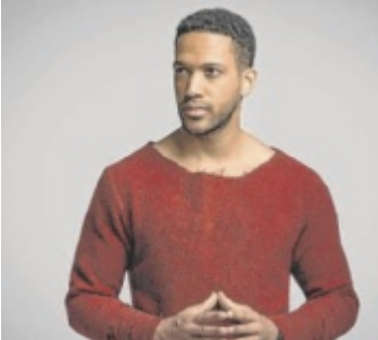
Mit dabei ist beim Ball auch Sänger Cesar Sampson.