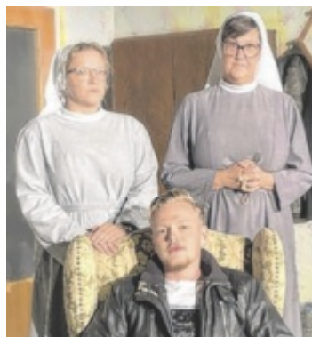
Die Theatergruppe Alberndorf spielt die Kriminalkomödie „Leg doch mal die Nonne um“.

um das Haus schleicht und auch noch ein Koffer voller Geld gefunden wird, werden die unschuldigen Schwestern in ein Verbrechen gezogen, welches die eine belebt und die andere zur Verzweiflung bringt. Karten und alle Termine gibt's unter www.theater-alberndorf.at ■