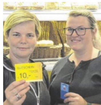
Das hilfsbereite ENI-Team

Die hohe Waschanlage mit dem preiswerten 10-er Blockangebot und Unterbodenwäsche, die beliebten Freiwaschplätze, der gut sortierte Fair-Preis-Shop, der Spitzen-Coffee to go, das helle Buffet für den Zwischenstopp, das saubere Tankstellen-Areal, die verlässliche Tankstelle werden täglich gebraucht. Um einen reibungslosen Ablauf bemüht sich Iris Jäger und ihre seriösen und fleißigen Mitarbeitenden. Für Weihnachten offeriert das Eni-Team wieder die gefragten Zehn-Euro-Geschenkgutscheine zum Einlösen beim