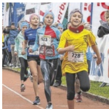
Der Ottensheimer Donaulauf war ein Lauffest für Groß und Klein.

Zehn-Kilometer-Lauf, Fünf-Kilometer-Lauf und beim Paarbewerb an. „Trotz des durchwachsenen Wetters war die Stimmung hervorragend. Der Spaß und die Freude am gemeinsamen Laufen stehen beim Donaulauf im Vordergrund“, so Steiner. ■