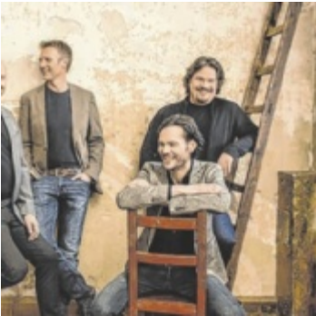
Vokalquintett amarcord