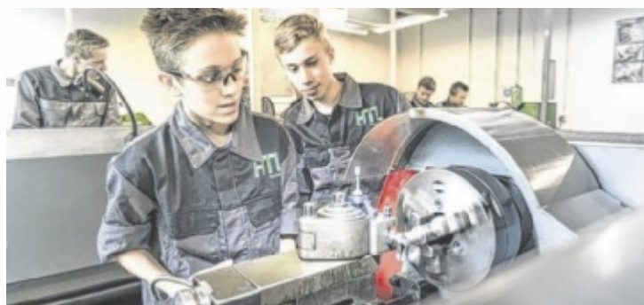
Wer sich für Technik interessiert, ist an der HTL in Neufelden richtig.

Dabei können Interessierte und Neugierige die Gelegenheit nutzen, die Schule und die Ausbildungsangebote kennenzulernen. Die Schüler der HTL begleiten die Gäste bei einem Schulrundgang, der Einblicke in die verschiedenen Labors und Werkstätten bietet. Sie berichten ebenfalls vom Schulalltag in Neufelden. Für technikbegeisterte Mädchen stehen Schülerinnen der HTL bereit, um von ihren Erfahrungen sowie besonderen Aktivitäten von und mit den Mädels an der HTL zu erzählen.