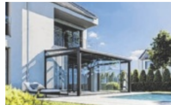
Neue Überdachung AMALFI, Leeb Balkone GmbH

Mit klaren Linien, einer aufgeräumten Optik und intelligenten technischen Details wird Amalfi jeden Außenbereich aufwerten und zum stilvollen Mittelpunkt des Zuhauses machen. Amalfi besticht durch ihre nahtlose Eleganz: Alle Befestigungen sind im Inneren verborgen, wodurch die Konstruktion eine moderne und klare Erscheinung erhält. Die integrierte Regenrinne und das dezente Fallrohr sorgen dafür, dass man geschützt vor Regen und Sonne entspannen kann – ohne störende Elemente, die das Gesamtbild beeinträchtigen. Diese Überdachung fügt sich harmonisch in jede Umgebung ein und unterstreicht die Architek-