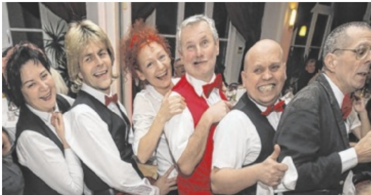
Die Sensationskellner von ProntoPronto zu Gast in Feldkirchen

Mitspielen bis 15.10.2024/09:00 Uhr www.tips.at/g/24036 oder SMS an 0676 8002525 Text: „24036 Vorname Nachname“