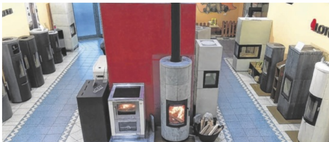
Von 11. bis 13. Oktober gibt es wieder Wissenswertes rund um Öfen und Herde.

Auf einer Fläche von insgesamt 200 Quadratmetern werden 70 verschiedene Heizgeräte präsentiert. Beheizte Geräte von