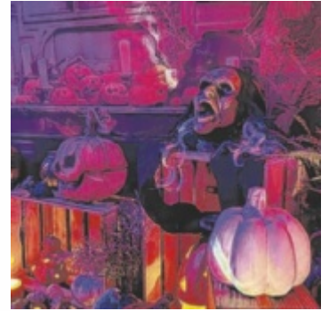
Am 13. Oktober öffnet die Geisterbahn.

Pferdeeisenbahn-Wanderweg. Viele Leute, die vorbeigingen, haben gefragt, ob sie die Deko fotografieren dürfen“, sagt Harsch. Die Geisterbahn ist in zwei Zelten mit einer Gesamtfläche von 33 Quadratmetern im Garten der Harschs untergebracht. Mittels Bewegungs- und Geräuschmeldern lösen die Besucher selbst manche Aktionen der über 50 Figuren aus.