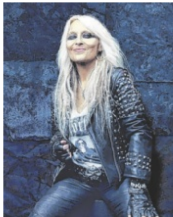
Metalqueen Doro heizt am Samstag in der Tabakfabrik ein.

Dazu kommen die musikalischen Highlights die die Tabakfabrik am Samstag, 19. Oktober