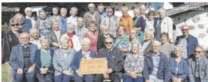
Die ehemaligen Volksschüler der VS Alberndorf trafen sich nach 70 Jahren.