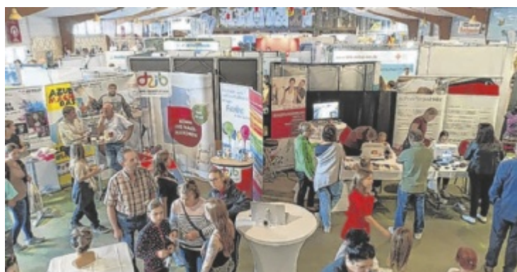
Viele Aktionen erwarten die Besucher

Es werden zwei iPads und viele hochwertige Sachpreise verlost. Die Gewinner werden nach der Messe ermittelt. ■