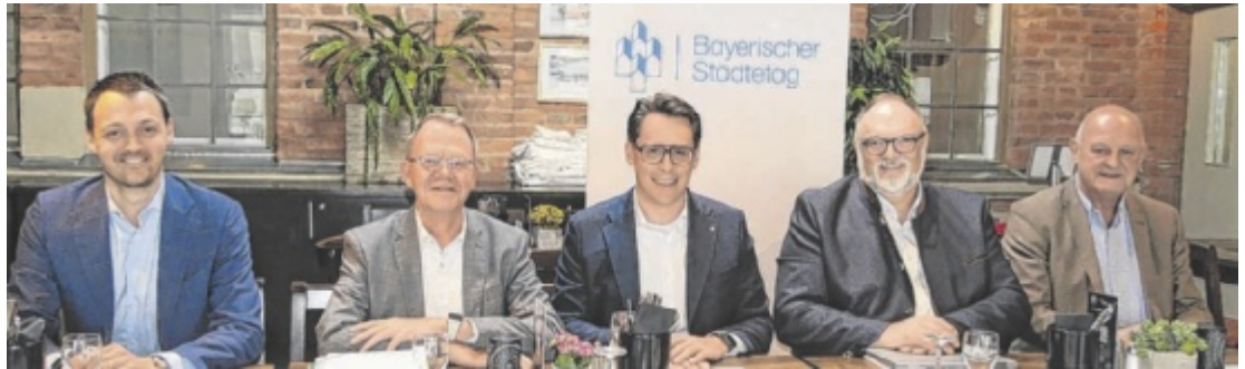
Die Bürgermeister des Bezirks Niederbayern trafen sich in Simbach zum Erfahrungsaustausch.