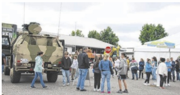
Auch im Außenbereich wird neben Halle und Zelt Interessantes geboten.

Alle Infos und Pläne: www.berufswahl-rottal-inn.de