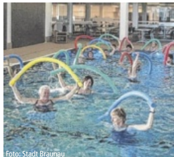
Es gibt Wassersport für Jung und Alt.

arten für Badespaß. Erweiterte Öffnungszeiten gibt es in den Herbstferien (27. bis 31. Oktober), wo das Hallenbad ab 9 Uhr geöffnet ist. Auch die Saunawelt lädt wieder zum Schwitzen ein. Die beliebte Mondschein-Sauna mit langen Öffnungszeiten und speziellen Aufgüssen startet am 15. November. ■