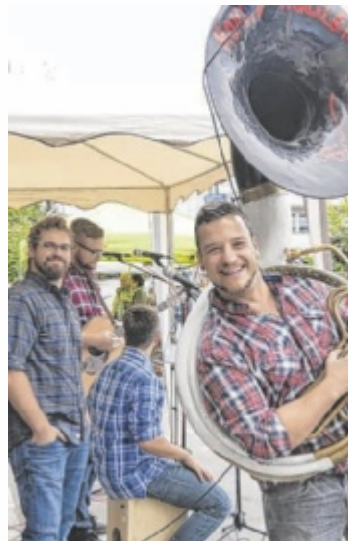
Maruin 5 sind wieder mit dabei.

Den ganzen Nachmittag ist Unterhaltung in der Innenstadt geboten. Verschiedene Verpflegungsstände haben Herzhaftes und Süßes für den Hunger zwischendurch parat. Die Gastronomiebetriebe der Kolpingstraße laden zum Verweilen ein und für die Kinder sorgt der Zirkus Mai für ein Karussell und Süßigkeiten. Mehrere Infostände präsentieren sich auf dem Kirchenplatz. Längere Zeit sah es danach aus, dass sich die Werbegemein-