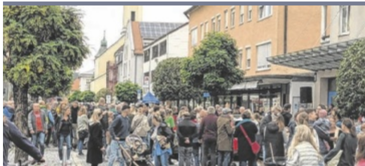
Einkaufsbummel Um gefahrlos in der Maximilianstraße und der Innstraße bummeln zu können, werden beide Straßen gesperrt. Die Innstraße nur zwischen Ampelkreuzung und Heimatmuseum.