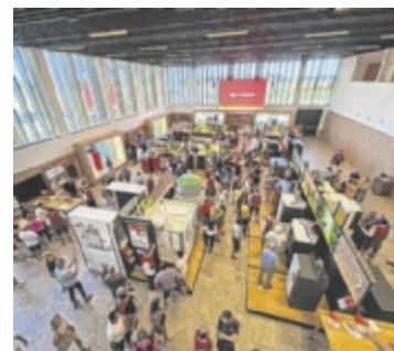
Über 11.000 Gäste bei der Hausmesse