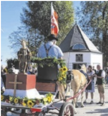
Der Heilige Leonhard vor der Leonhardikapelle