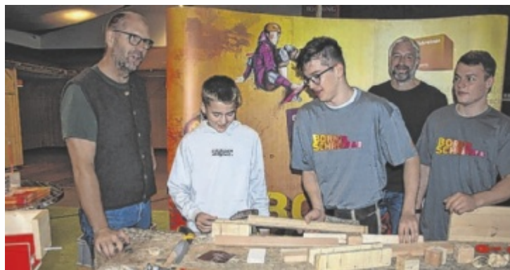
Die „Handwerksstraße“ lädt zum Ausprobieren und Mitmachen ein.

Mit über 140 Ausstellern erreicht die Messe in diesem Jahr einen neuen Rekord, was die hohe Bedeutung dieser Veranstaltung für die heimische Wirtschaft unterstreicht. Der große Zuspruch der Aussteller zeigt, wie wichtig es für Unternehmen ist, sich frühzeitig um qualifizierte Nachwuchskräfte zu bemühen. Besonders interessant: Nur Unternehmen, die im Landkreis Rottal-Inn ausbilden, dür-