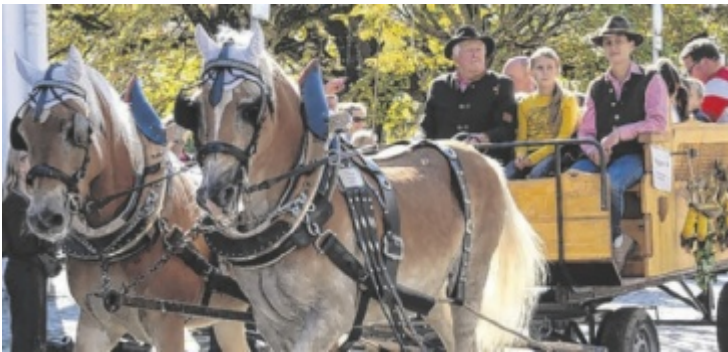
20 Gespanne haben sich schon angemeldet.