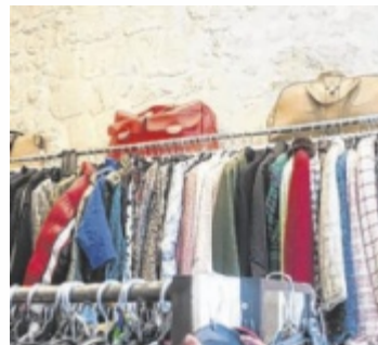
Kleidung günstig zu ergattern

Der Tanz-Workshop findet von 1. Oktober bis 19. November an acht Abenden, jeden Dienstag, von 18.30 bis 19.30 Uhr statt. Vorkenntnisse sind nicht erforderlich, die Freude an Bewegung steht im Vordergrund. Am 16. Oktober von 17 bis 19 Uhr lädt das ZIMT außerdem zum Kleiderflohmarkt ein. Dort gibt es hochwertige Secondhand-