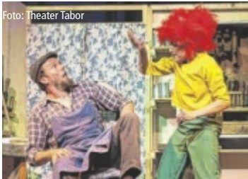
Meister Eder und der Pumuckl

Der Auftakt markiert den Start in die neue Saison des Kindertheaters. In diesem Stück hält Pumuckl mit seinen frechen Streichen seine Umwelt auf Trab, doch niemand kann ihm wirklich böse sein. Die Freundschaft zwischen ihm und Meister Eder wird jedoch auf eine harte Probe ge-