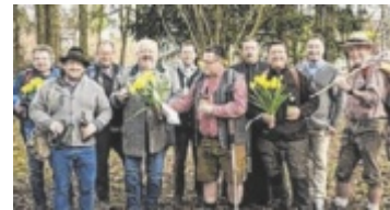
Brauer auf Wanderschaft