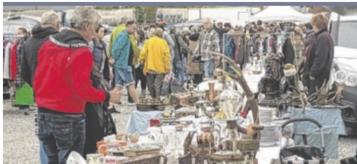
Flohmarkt In Zusammenhang mit dem verkaufsoffenen Sonntag findet auf dem Volksfestparkplatz auch wieder ein Flohmarkt statt. Allerlei Raritäten erwarten die Besucher an den Ständen.