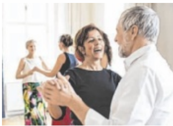
Spaß an der Bewegung