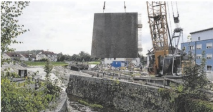
Die ersten Teile der Hochwasserschutzmauer werden gesetzt

die Abzweigung der Bachstraße erst auf der Kreuzberger Weg Brücke möglich sein. Sind diese Bauarbeiten abgeschlossen, geht es mit Bauabschnitt 05 weiter, d.h. die Rialtobrücke und die Forster Brücke werden abgerissen und der Bereich bis zur Brücke Passauer Straße in Angriff genommen. Dies geht alles Hand in Hand um die Verkehrsführung möglichst wenig zu beeinträchtigen. Als Ersatz für die Rialtobrücke ist ein Geh- und Radweg geplant, für die Forsterbrücke gibt es keinen Ersatz. Verbleiben noch der Neubau der Brücke Passauer Straße und der Bereich Schacherbauer Wiese. Bis 2030 wird es noch dauern. ■