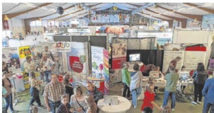
Reges Messetreiben im zusätzlich aufgebauten Messezelt.