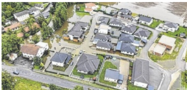
Feuerwehren machten sich per Drohne ein Lagebild aus der Luft.

Die insgesamt 36 Zimmer müssen renoviert werden und bieten nun modernen Komfort, außerdem stehen Gästen ein großer Speisesaal, ein Konferenzraum sowie ein idyllischer Gastgarten zur Verfügung. Auf 135 Sitzplätzen im Innen- und 40 im Außenbereich kann österreichische Küche genossen werden – auch sonntags. Auch ein Frühstückangebot wird geboten. ■