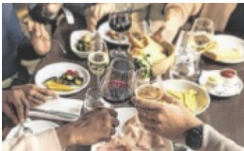
Weine verkosten

BRAUNAU.SIMBACH.INN. Die Region Braunau.Simbach.Inn lädt am Samstag, 12. Oktober, ab 17 Uhr wieder zur grenzübergreifenden Weinverkostung „Spaß im Glas“ ein. Zahlreiche Gastronomen der Region bieten Weinliebhabern eine kulinarische Tour mit einer großen Auswahl an Weinen, die von Weinbauern und -händlern präsentiert werden. Ob in gemütlichen Gastgärten oder stilvollen Lokalen – passend zu den Weinen gibt es kulinarische Köstlichkeiten sowie ein Rahmenprogramm. ■