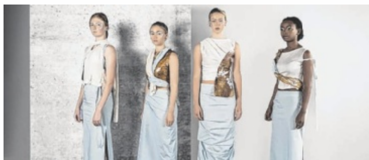
Nachhaltige Mode ästhetisch kreiert

wirken. Ihre Kollektion kombiniert Biomaterialien, upgecycelte Strickkleidung und ein von ihr selbst hergestelltes Leder, das durch die Fermentation einer symbiotischen Kultur von Bakterien und Hefe hergestellt wurde. Weitere modische Akzente in Sachen Nachhaltigkeit unter www.modeschule-hallein.at . ■