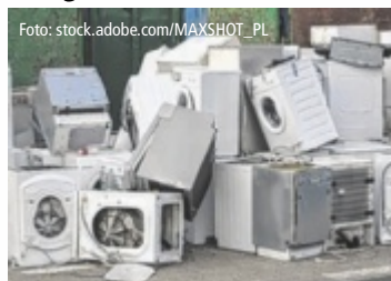
Altgeräte sind wertvoll, da sie viele recycelbare Materialien enthalten.

Das Sammeln und Recycling von Elektroaltgeräten ist ein zentraler Bestandteil einer nachhaltigen Abfallwirtschaft und trägt zur Ressourcenschonung bei. In Oberösterreich stehen zahlreiche Sammelstellen zur Verfügung, um alte und defekte Elektrogeräte fachgerecht zu entsorgen.