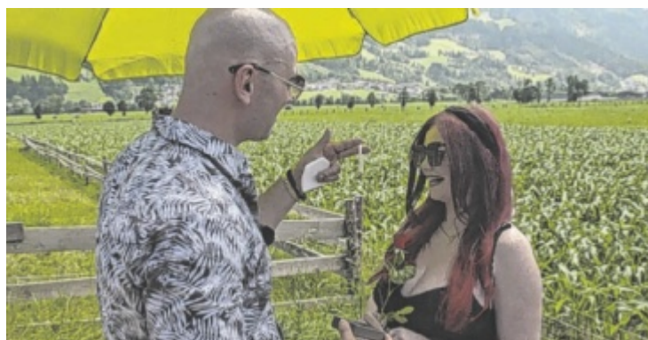
Der Tiroler Bauer überreichte seiner Besucherin ein Armband als Gastgeschenk.

Die Ankunft der anderen Hofdamen ist in der zweiten Hofwochenfolge am Mittwoch, 18. September, zu sehen. Die Folgen können immer eine Woche vor Ausstrahlung im TV kostenlos auf JOYN gestreamt werden und sind dort auch im Nachhinein noch verfügbar. ■