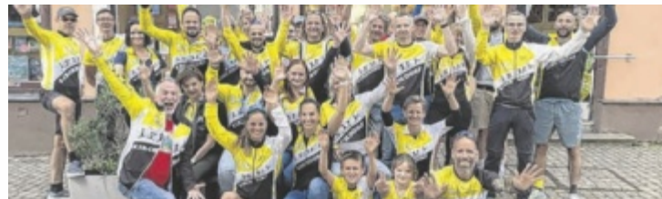
Die Läufer der Laufgemeinschaft Kirchdorf freuen sich auf die gemeinsame Bewegung für den guten Zweck.

noch eine Vereinszugehörigkeit zur Laufgemeinschaft Kirchdorf ist nötig. Eine Gruppe läuft und eine Gruppe geht (mit oder ohne Stöcke) in gemütlichem Tempo. Nach 90 Minuten findet der Abschluss beim Startpunkt um 10.30 Uhr mit einem Weißwurstbrunch inklusive Getränken statt. ■