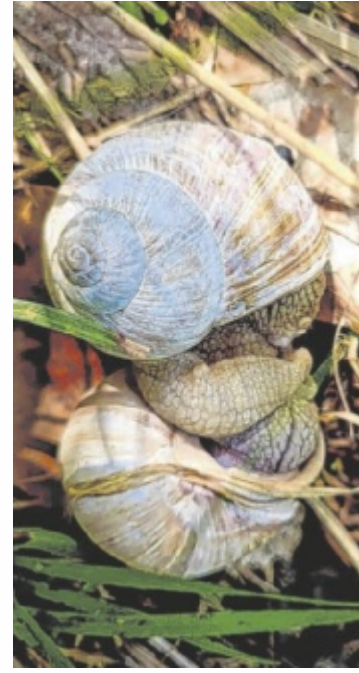
Auf dem Weg zum Hohen Nock hat Gabriela Rettenbacher diese Weinbergsschnecken entdeckt.