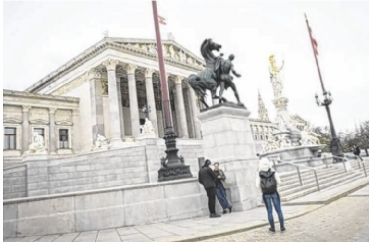
Am 29. September wählt Österreich ein neues Parlament

Mit Spannung wird die Wahl des Nationalrats am 29. September erwartet. Im Wahlkreis Traunviertel, zu dem der Bezirk Kirchdorf zählt, stehen elf Parteien zur Auswahl: ÖVP, SPÖ, FPÖ, Grüne, NEOS, die Bierpartei, MFG, KPÖ, Liste Madeleine Petrovic, Liste GAZA und Keine von denen. Wer am Wahltag verhindert ist, kann seine Stimme über Briefwahl oder Wahlkarte abgeben. Schriftlich kann die Wahlkarte bis zum 25. September be-