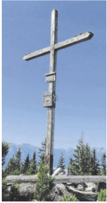
Helmut Garstener unternahm eine 3-Gipfeltour zum Brandleck, Mayrwipfel (Foto) und Steyreck.