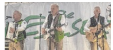
Die Edlseer sorgten für Stimmung.

HONS Energiesysteme GmbH Koaserbauerstraße 16, Gmunden www.honsheizt.at