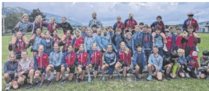
Der Ankick ins neue Schuljahr ist gelungen.

In 45 Wochenstunden erhalten die Schüler in der Ski-Mittelschule sowohl schulisch als auch sportlich eine sehr gute Ausbildung. Am Freitag, 15. Novem-