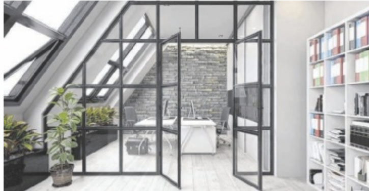
Glaswand im Loftstyle als dekorativer Raumtrenner

In Sachen Wärme- und Schallschutz kann der Glasbautechniker besonders innovative Lösungen liefern, wie zum Beispiel eine Glaswand als Raumteiler.