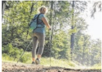
Damit die Funktion der Venen nicht eingeschränkt wird, kann man selbst etwas tun: Bewegung.

KLAUS/STEYRLING. Venen transportieren verbrauchtes Blut zurück zum Herzen und ermöglichen so den wichtigen Sauerstofftransfer im Blut. Inwiefern Bewegung den Blutfluss unterstützt und welchen Schaden Bewegungsmangel verursachen kann, erklärt Allgemeinmedizinerin und Hautärztin Angelika Reitböck aus Steyrling.