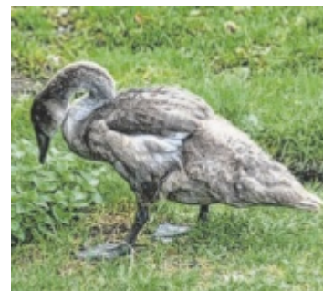
Schwan Winifred ist im Tierparadies eingezogen.

Das verwaiste Tier wurde Anfang September am Attersee von einem Tierliebhaber aufgefunden und daraufhin nach Steinbach am Ziehberg gebracht. „Dieses Ereignis verdeutlicht einmal mehr die dramatische Lage, in der sich viele Wildtiere befinden – auch Schwäne“, sagt Harald Hofner vom Tierparadies Schabenreith: „Schwäne sind in den vergangenen Jahren vermehrt Ziel von Jagdaktivitäten geworden. Diese Entwicklung ist erschütternd und besorgniserregend.“ ■