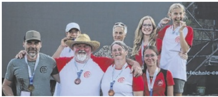
Die Schützen des BSV-Kremstal aus Nußbach waren bei der Weltmeisterschaft im Bogenschießen sehr erfolgreich.