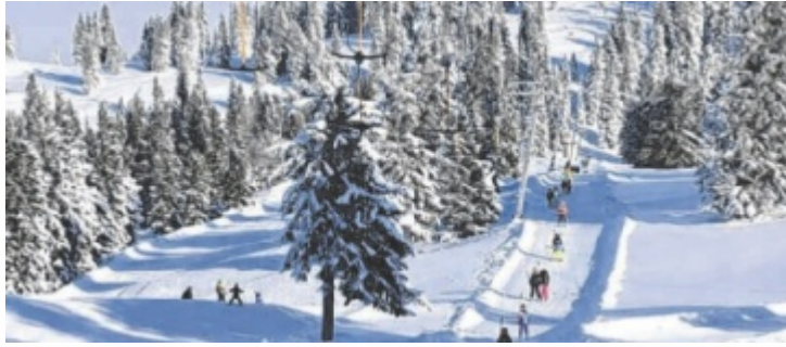
Das Skigebiet Kasberg bietet heuer vollen Skibetrieb.