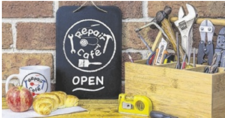
In Pettenbach findet monatlich ein Repair-Café statt.

Der Titel „Repair-Café“ oder auf Deutsch „Reparatur-Café“ kann verwirrend sein – es handelt sich dabei nicht um ein Kaffeehaus. Aber um die Wartezeit zu versüßen, werden von der FF Pettenbach und freiwilligen Helfern