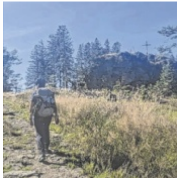
Traumhafte Mehrtages-Tour durch die Böhmerwald-Region

Willkommen am Weg der Entschleunigung. Gibt ein Tag in den herbstlichen Bergen schon gute Energie, kann man bei einer Mehrtages-Tour so richtig auf-tanken für das meist stressige letzte Quartal des Jahres. Als Idee für ein verlängertes Wochenende hier eine abwechslungsreiche Vier-Tages-Wanderung. Mit 71 Weg-Kilometern ist diese Rund-tour mit Start und Ende in Aigen-