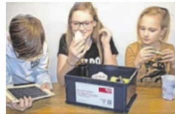
Die kostenlose Lehrmittelbox vermittelt Kindern wertvolles Wissen über Kunststoff.

Ob ein 3D-gedrucktes Kniegelenk, bunte Ameisen oder ein Trinkbecher – anhand von Produktbeispielen werden die vielfältigen Einsatzmöglichkeiten von Kunststoffen dargestellt. Ein modular aufgebautes didaktisches Begleitmaterial steht Lehrkräften zusätzlich zur