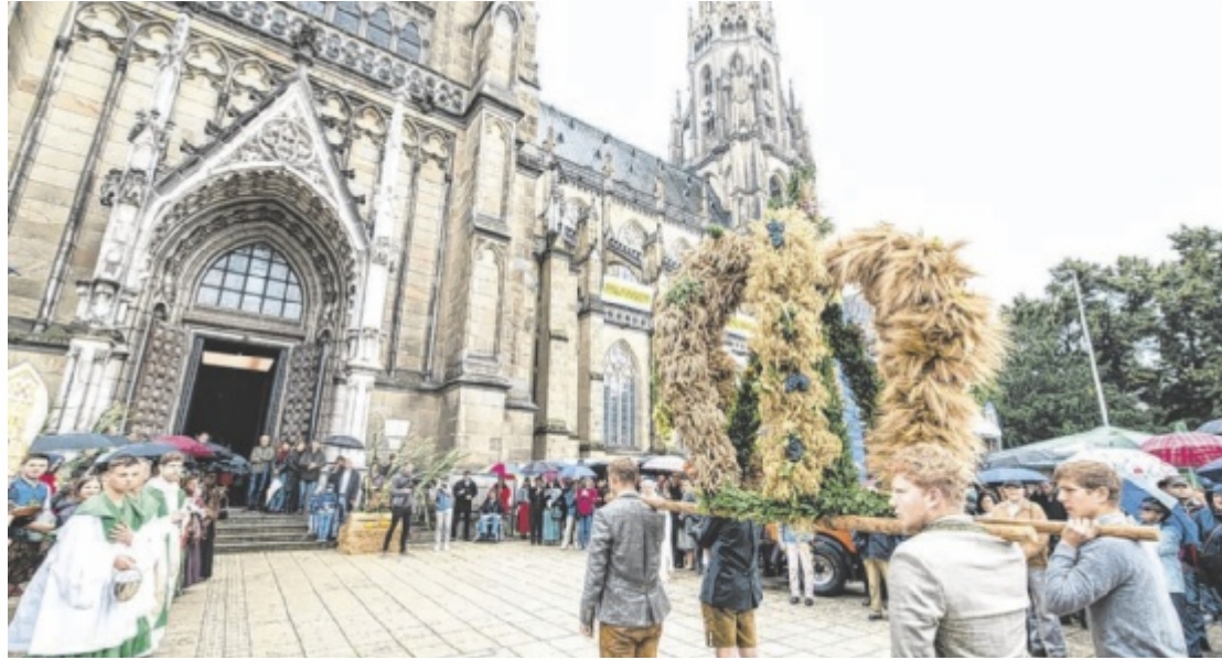
Das Erntedankfest 2024 findet am 22. September ab 10 Uhr im Linzer Mariendom statt.

Die Messe wird musikalisch von einem Chor der Bäuerinnen des Bezirkes Linz-Land umrahmt. Es werden fünf Erntekronen gesegnet, je eine pro Viertel und eine aus der Dompfarre, die den besonderen Einzug anführt. Im Anschluss werden von 11 bis 15 Uhr, im Rahmen eines Schmankerlmarktes, Produkte aus ganz Oberösterreich zum Verkosten, Genießen und Einkaufen angeboten. Beim Stand der Seminarbäuerinnen kann man Obst und Gemüse mit allen Sinnen erle-