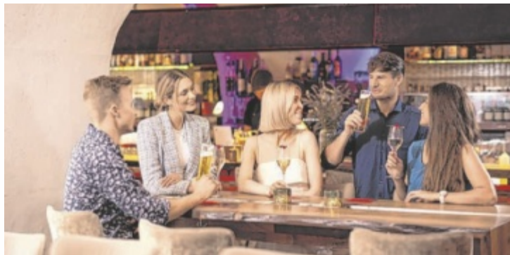
Kulinarische Highlights in Wels sind „Voi Guad“.

22 Gastronomiebetriebe in Wels und Kremsmünster und der Tourismusregion Wels bieten regionale, saisonale Gerichte an. Die Initiative vom Tourismusverband Region Wels betont Regionalität, Nachhaltigkeit und Gastfreundschaft, wobei frische Zutaten im Mittelpunkt stehen. Jeder Gastronomiebetrieb bietet mindestens zwei Voi Guad Gerichte an, die charakteristisch für den je-