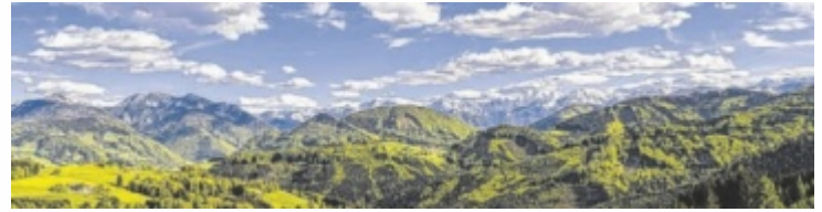
Mit Projektideen die Region aktiv mitgestalten

Der Kleinprojekte-Fonds ermöglicht es Menschen aus der Region, eine Förderung für die Umsetzung ihrer Kleinprojekte zu beantragen. Der Fonds ist 2024 mit 15.000 Euro dotiert und bietet eine unkomplizierte