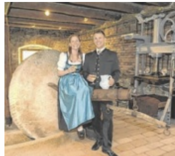
Zum Abschluss des Rundgangs im Mostmuseum gibt es für die Besucher eine Kostprobe.

Das Mostmachen hat in St. Marienkirchen eine besondere Bedeutung: Schon im Gemeindegewappen der sogenannten Mosthauptstadt gibt es eine Spindel- und ein Mostmuseum befindet sich in den im Originalzustand erhaltenen Räumlichkeiten des rund 300 Jahre alten ehemaligen Getreidespeichers der Pfarre. Dort können Besucher sehen, wie der Most früher im Presshaus gewonnen wurde und Obstmühlen, Pressen, Fässer oder „Roßwalzel“ aus