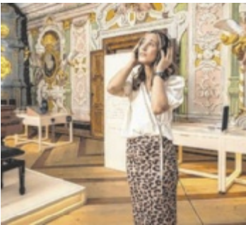
Individuell oder geführt: noch bis 27. Oktober im Stift St. Florian auf den Spuren Bruckners wandeln.

In der abwechslungsreichen Schau „Wie alles begann. Bruckners Visionen“ der OÖ KulturEXPO werden biografische Details und neuentdeckte Dokumente präsentiert. Den Geheimnissen dahinter können Besucher im Rahmen von individuell buchbaren Vermittlungsangeboten für alle Altersgruppen nachspüren. Im Stiftshof nehmen drei multimediale Erlebnisräume Bezug auf Bruckners Träume und Visionen, in weltweit einzigartigen interaktiven Bruckner-Höräumen. Das Kulturvermittlungsteam bietet personelle Führungen, für all jene, die lieber individuell