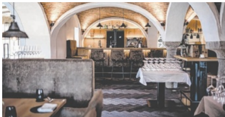
Das Restaurant kammer5 in Ort im Innkreis

Im Drei-Hauben-Lokal kammer5 widmet man sich im Herbst ganz dem Thema Wild und Wald – und zwar mit regionalen Zutaten und einem Menü, bei dem man den Wald schon beim Lesen riechen kann. Und lesen kann man es schon – auf der Website und den Social Media Kanälen des kammer5 gibt es den ersten Vorgeschmack auf „Wildfang nach Rehzept“ im kammer5.