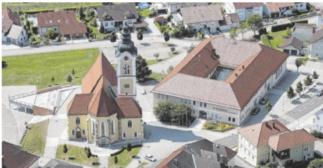
Die Marktgemeinde St. Marienkirchen an der Polsenz hat eine gute Infrastruktur und eine gute Lage.