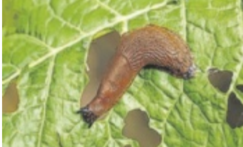
Nacktschnecken plagen heuer zahlreiche Gärtner.

„Heuer habe ich mein Saatgut umsonst gekauft, weil fast alles die Schnecken gefressen haben“, ärgert sich eine Tips-Leserin – und mit ihr viele Gartenfreunde. Schon jetzt sollte man der nächstjährigen Schneckenplage den Kampf ansagen.