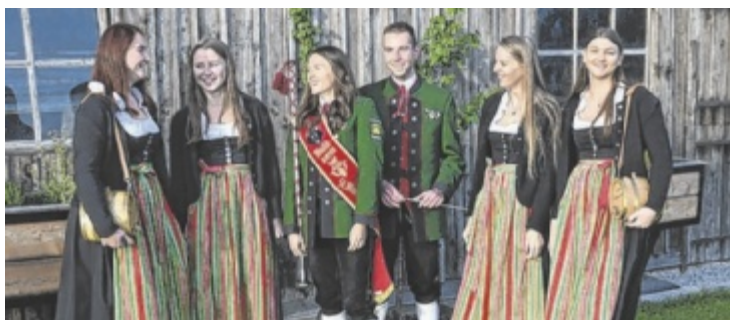
Bei den Samareiner Musikern steht die Gemeinschaft an erster Stelle.