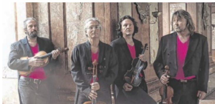
Das Spring String Quartett ist kein klassisches Streichquartett.