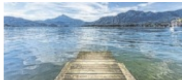
Der Mondsee