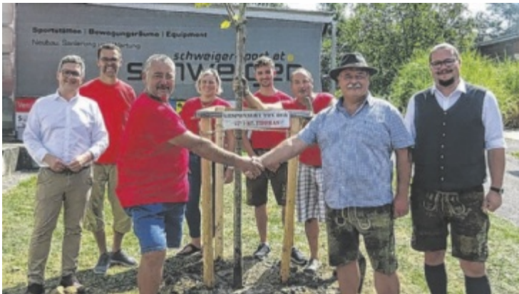
Die SPÖ-Ortsgruppe spendierte der Gemeinde eine Dorflinde.