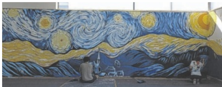
Das sogenannte AudiDax wurde von Schülern neu gestaltet.