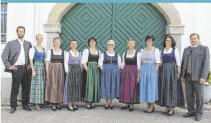
Jubiläum Die Samareiner Goldhauben- und Trachtengruppe feiert 2026 ihr 50-jähriges Bestehen. Sie unternimmt viele gemeinsame Aktivitäten, wie beispielsweise das Fest der Jubelpaare oder die Bewirtung bei der Weberbartl-Wanderung. Besonders stolz ist die Gruppe auf ihre eigene Gemeindetracht, die die Samareiner Bäuerinnen 2004 verwirklicht haben. Die Farben für Festtracht und Dirndl sind frei wählbar. Bei Ausrückungen wird dazu gerne ein schwarzer Samareiner Hut getragen.