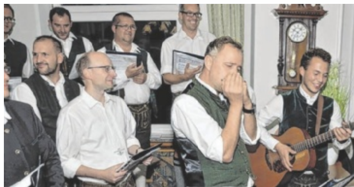
Die Chöre wandern von Wirtshaus zu Wirtshaus.

Eine verbindliche Anmeldung mit einer kurzen Begründung, warum man gerne dabei sein möchte, ist bis spätestens 25. September auf www.tips.at/wandertag möglich. Mit etwas Glück kann man einen Platz für zwei Personen ergattern. Viel Glück! ■