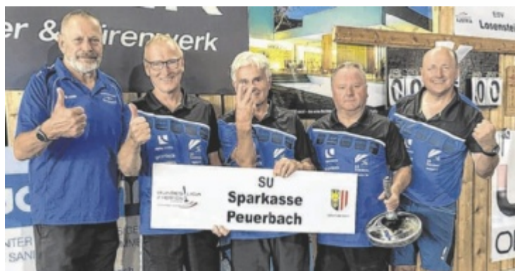
Die Peuerbacher spielen nun in der ersten Bundesliga.

die eigene Stärke. In der Gruppenphase setzte sich Peuerbach mit elf Punkten durch und qualifizierte sich damit für das Aufstiegsduell gegen den ESV Loosenstein. Die Peuerbacher beendeten das Spiel mit einem 6:2-Sieg, der den Aufstieg besiegelte. ■