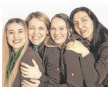
Die Mitarbeiterinnen schätzen ihren Arbeitsplatz in der Region.

Durch Zufall begann die Kauffrau im Alter von 20 Jahren im elterlichen Geschäft zu arbeiten. Zunächst aus hilfswiese. Daraus wurde eine bemerkenswerte Laufbahn. Heute führt die Gewinnerin der goldenen Tanne 2016 die beiden Spar-Märkte in Pichl und Grieskirchen mit insgesamt knapp 60 Mitarbeitern, darunter sechs Lehrlinge. Barba-