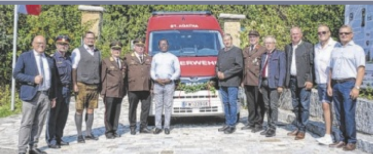
Fahrzeugsegnung Das neue Kommandofahrzeug der Freiwilligen Feuerwehr (FF) St. Agatha wurde mit einer Segnungsfeier im Rahmen einer Feldmesse eingeweiht. Das MAN-Allradfahrzeug dient als mobile Einsatzzentrale. Finanziert wurde es vom Land OÖ, der Gemeinde St. Agatha und der FF St. Agatha.

pädie, Ergotherapie und Psychotherapie, um das Leistungsangebot abzurunden, falls sich noch jemand einmieten möchte“, sagt Linzner. Infos zum Baufortschritt und zu den Räumlichkeiten für Therapeuten gibt es unter www.gesundheitszentrum.or.at . ■