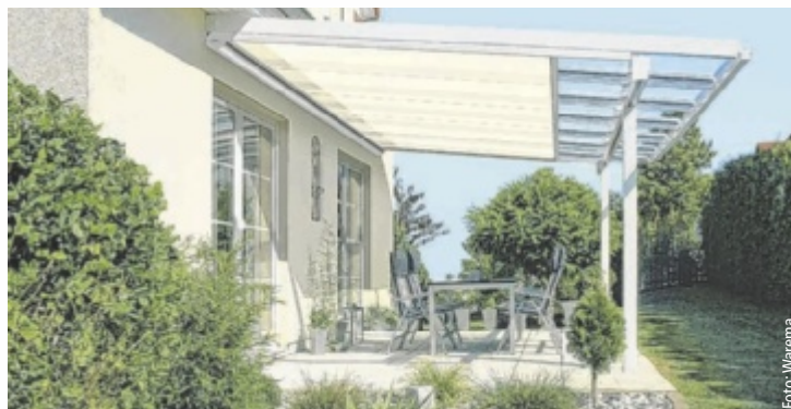
Schutz & Schatten lädt zu den Tagen der offenen Tür von 13. bis 15. September.

Angesichts der intensiven Sonneneinstrahlung und der damit einhergehenden, fast unerträglichen Hitze wurde deutlich, dass ein schattiges Plätzchen unter einer Terrassenbeschattung, kombiniert mit einem erfrischenden Kaltgetränk, eine wahre Oase der Erholung darstellen kann. Doch nicht nur die Sonne, sondern auch Insekten, insbesondere Wespen und Gelsen, haben in diesem Sommer zu einer nicht zu unterschätzenden Belastung geführt. Lösungen