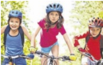
Die Modellregion Mostlandl Hausruck bietet Radfahrkurse in mehreren Volksschulen an.

BEZIRK. Im Mittelpunkt der Europäischen Mobilitätswoche von 16. bis 22. September stehen Klimaschutz und nachhaltige Mobilität. In der Klima- und Energie-Modellregion (KEM) Mostlandl Hausruck gibt es zu diesem Anlass einen Zeichenwettbewerb und Radfahrkurse.