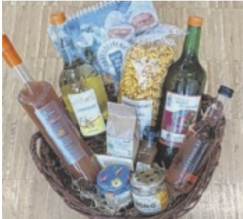
Geschenkkorb aus dem Obst-Hügel-Land gewinnen

ST. MARIENKIRCHEN. Im Rahmen der Ortsreportage verlost Tips einen Geschenkkorb aus dem Naturpark Obst-Hügel-Land mit Produkten von Partnerbetrieben und der „Jahreszeitenküche“. ■