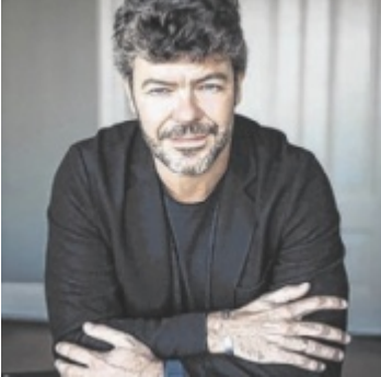
Dirigent Pablo Heras-Casado

Kombiniert wird diese Sinfonie im Brucknerfest-Konzert mit zwei Kompositionen Wagners: der „Faust-Ouvertüre“ und den „Wendendonck-Liedern“. Zu hören sind die Sopranistin Christiane Karg,