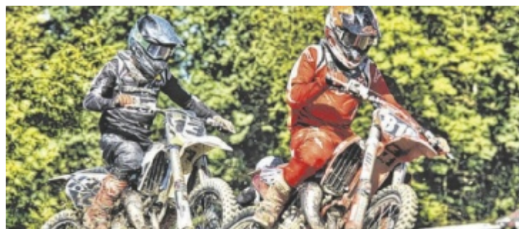
Beim OÖ Motocross Cup gibt es nur ein Gas: Vollgas.