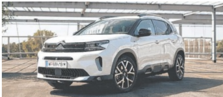
Citroën C5 Aircross MAX Plug-in-Hybrid

Citroën hat schon seit längerem sich und seinen Modellen die Bezeichnung auf alte Stärken verschrieben. Davon gab es zwar mehrere, keine aber war derart ausgeprägt wie jene im Komfortbereich. Die Franzosen sind in ihrer Kernkompetenz mittlerweile schon so gut, dass man vor lauter Huldigung beinahe auf die vielen anderen Talente des jeweiligen Modells vergessen könnte. Nehmen wir nur den C5 Aircross MAX Plug-in-Hybrid: Cooles Design, kreatives Interieur, großzügige Platzverhältnisse, Top-Antrieb. Das ist so einiges, was sich im beinahe übermächtigen