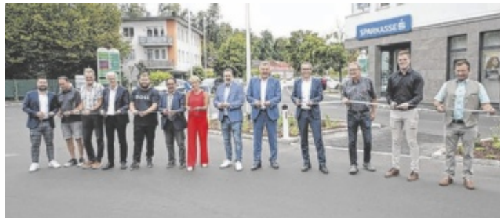
Eröffnung der neugestalteten Kreuzung

Mit der Eröffnung der umgebauten Kreuzung geht auch eine wesentliche Neugestaltung des neuralgischen Knotens der L569 Pleschinger Landesstraße und der L1463 Gusentalstraße einher. Hier wird die Bevorrangung des Verkehrs aus Linz ins Gusental und umgekehrt vom Gusental Richtung Linz dauerhaft beibehalten. „Diese Maßnahme sorgt für einen kontinuierlichen Verkehrsfluss in beiden Richtungen“, heißt es aus dem Büro von Infrastruktur-Landesrat Günther Steinkellner (FPÖ). Eine weitere bedeutende Neuerung ist