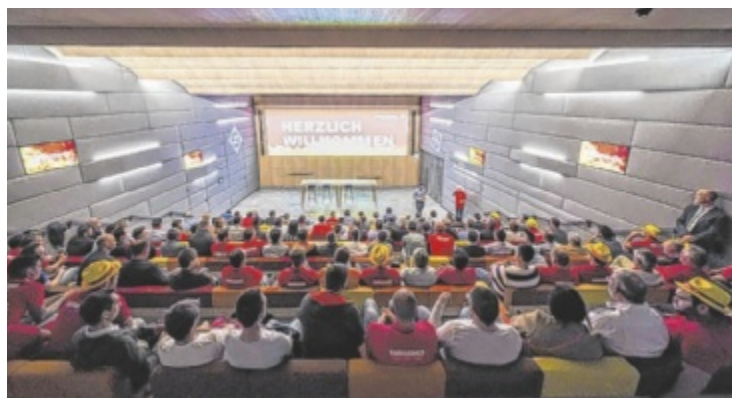
Zahlreiche Fachvorträge werden auf der Hausmesse geboten.