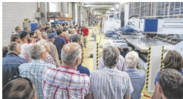
Firmenrundgänge und vieles mehr erwartet die Besucher.