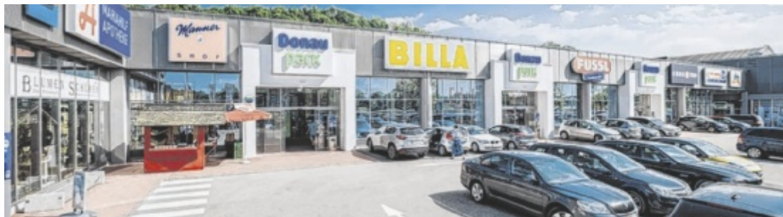
Auf kurzen Wegen alltägliche und besondere Besorgungen im Donaupark Mauthausen erledigen.

Der Donaupark bietet eine vielfältige Auswahl an Geschäften, die keine Wünsche offenlassen. Hier findet man alles, was das Herz begehrt, von Mode über Elektronik bis hin zu kulinarischen Köstlichkeiten. Apropos Kulinarik: In diesem Bereich gibt es bald einige Neuigkeiten für alle, die ihre Mahlzeiten gerne auswärts genießen. Auch Sportfans und Outdoor-Enthusiasten werden vielleicht in Zukunft öfter mal im Donaupark vorbeischaun.