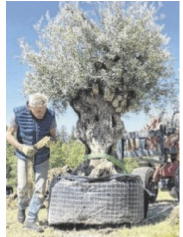
Die ersten 28 Bäume wurden schon im vergangenen Herbst eingesetzt, im Mai folgten weitere 200 Olivenbäume.