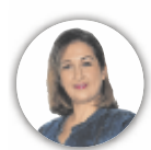
von OLIVIA LENTSCHIG

Olivenbäume zählen zu den ältesten Kulturpflanzen der Welt, stehen als Symbol für Friede und Treue – und wachsen auch im österreichischen Norden auf 600 Metern Seehöhe: Am Vedahof in Gramastetten, inmitten der sanften Hügel des Mühlviertels,