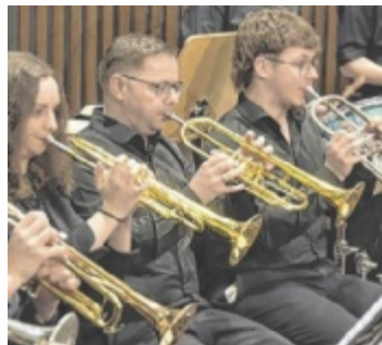
Das Bezirksjugendorchester lädt zum Best-of-Konzert auf Burg Kreuzen ein.

Unter der Leitung von Stefan Huber, dem stellvertretenden Bezirksjugendreferenten, präsentieren 80 junge Musikerinnen und Musiker aus dem gesamten Bezirk ein abwechslungsreiches Programm, das die besten Stücke vergangener Konzerte vereint. Das Konzert bietet nicht nur musikalische Höhepunkte, sondern auch ein einzigartiges Ambiente. Die historische Burg Kreuzen verleiht dem Abend eine ganz besondere Atmosphäre, die sowohl Musikliebhaber als auch Freunde außergewöhnlicher Konzertszenen begeistern wird. Tickets (VVK: 12 Euro, AK: 14 Euro, Eintritt frei bis zwölf Jahre) sind bei allen Mitgliedern des BJO sowie an der Abendkasse erhältlich. ■