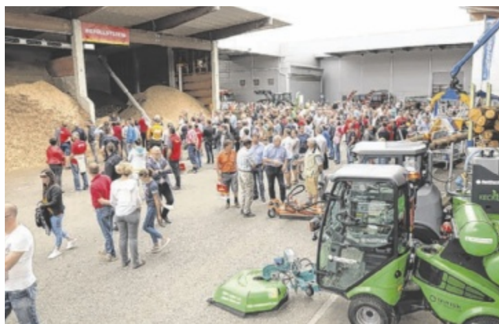
Mehrere tausend Besucher werden zur großen Hausmesse erwartet.

zahlreiche Fachvorträge zur Waldwirtschaft, zu Förderungen und zum Kesseltausch, Firmenrundgänge und vieles mehr warten auf die Besucher. Es kann die komplette Produktpalette inklusive Zubehör ent-