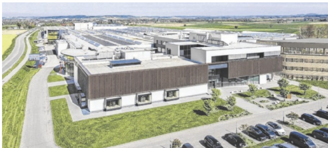
Hargassner lädt am Samstag, 7. und Sonntag, 8. September zu einer großen Hausmesse in Weng/Innkreis.

Das Highlight des Jubiläumsjahrs wird schon am 7. und 8. stattfinden, wenn zur großen Hargassner Hausmesse mehrere Tausend Gäste kommen sollen. Live-Vorfürungen von Forstgeräten bis zur Pellet-Befüllung,