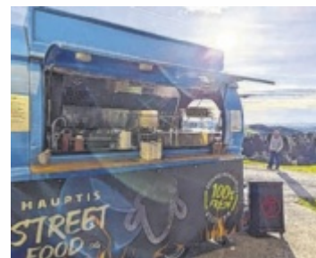
Streetfood aus der Region

Ziel sei es, mit dem Foodtruck verschiedene Stationen in ganz Oberösterreich anzufahren und dort auf den Wert heimischer Lebensmittel aus bäuerlicher Produktion hinzuweisen. Dieser ergebe sich durch die hohen Standards und Auflagen, die in Österreich gelten. Damit dieser