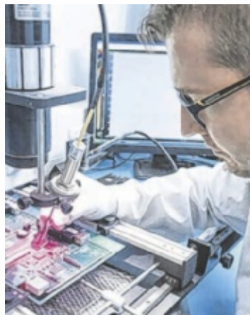
technosert sucht Personal an den Standorten Wartberg und Tragwein.

Heuer wurde am Firmensitz in Wartberg ob der Aist auch das Projekt „Logistik 2024“ abgeschlossen. Die Umsetzung reicht vom Ausbau der Parkmöglich-