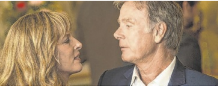
Beide beginnen eine Affäre, doch gibt es auch eine Scheidung?

Nach 30 Ehejahren ist Diane in ihrer Ehe mit dem Pianisten Alain gelangweilt und fühlt sich in ihrem Job als Redakteurin aufs Abstellgleis geschoben. Sie denkt darüber nach auszubrechen – aber Alain kommt ihr zuvor! Obwohl er Diane liebt, verlässt er sie Hals über Kopf, weil er sie verdächtigt, eine Affäre mit ihrem Vorgesetzten Stéphane zu haben. Nun ist Diane plötzlich frei! Und macht mutig Ernst mit der neu gewonnenen Freiheit: Sie beginnt tatsächlich