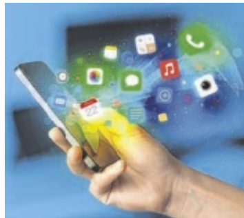
Gar keine Hexerei: der Umgang mit dem Handy

Diese Kurse sollen insbesondere dazu beitragen, digitale Kompe-