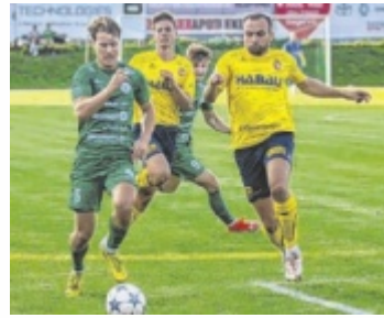
Die Perger mussten eine Auswärtsniederlage einstecken.

Für das Team von Jürgen Prandstätter verlief der Abend im Kremstal bitter. Zweimal lagen die Perger in Führung (21. Minute nach Elfmeter, 36. Minute). Micheldorf schoss in der 71. Minute den 2:2-Ausgleich und legte in der 78. Minute zum Endstand nach. Am 7. September wollen die Per-