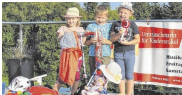
Guterhaltenes abgeben und ebensolches kaufen, heißt es beim Basar.