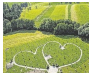
Auf einem in Herzform angelegten Weg können Besucher den Olivenhain durchwandern.

Der historische Bestand des Mühlviertler Dreiseithofes wurde mit großem Bedacht auf die Ursprünglichkeit des Gebäudes und mit natürlichen Baustoffen wie Lehm, Schilf und Holz renoviert. Der Obstgarten mit Panoramablick auf die Alpen, die Premakirche (Kirche der fünf Weltreligionen) und die romantische Liebesinsel schaffen einen stimmungsvollen Außenbereich, der nun um den ersten Olivenhain des Mühlviertels ergänzt wird. ■