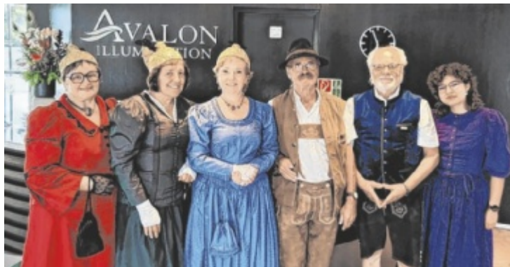
Das Imageteam von Mauthausen Tourismus an Bord