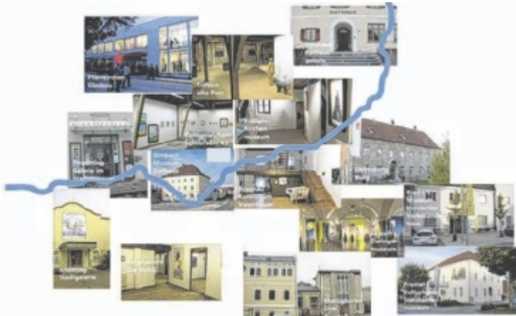
15 Orte am Inn zeigen die Kunst- und Kulturvielfalt.

Gefördert durch LEADER, wird das Projekt nun auf fünf Regionen ausgeweitet und von April 2025 bis Oktober 2026 Malerei, Grafik, Skulpturen, Keramik und Mixed Media zum Inhalt haben. Die gemeinsame Themenstellung wird dabei in den Ausstellungstiteln deutlich, die jeweils mit der Vorsilbe „INN“ beginnen, z. B. INN Bewegung, INN Austausch, INN Konflikt usw. Die Einzelthemen werden durch (kultur)historische Impulserzählungen hinterlegt, die mit den ausgestellten Kunstwerken und künstlerisch-kreativen Gestaltungen in Austausch treten. Besonders erfreut sind die Beteiligten über die Zusage der Förderung durch LEADER, die auch für kleinere Projekte noch offen steht. Der Eintritt zu den Ausstellungen wird frei sein. ■