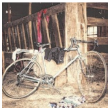
Rennrad von Sigi Denk