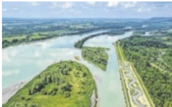
Luftaufnahme des Inn

Am 31. August um 14 Uhr führt Dagmar Simböck unter dem Titel „Der Inn: Drent und Herent“ entlang des Inns und erzählt spannende Geschichten über den Gebirgsfluss. Jeden Sonntag im September um 10 Uhr begleitet Beate Brunner die Teilnehmer bei der Vogelbeobachtung an den Stauseen des Unteren Inn. Hier lässt sich die Vielfalt der Zugvögel erleben. Am 14. September von 9 bis 12 Uhr können Groß und Klein im Workshop „Vogelfutter-Station