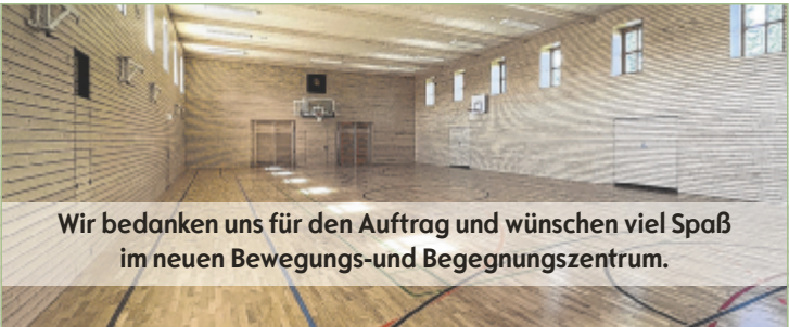
Wir bedanken uns für den Auftrag und wünschen viel Spaß im neuen Bewegungs- und Begegnungszentrum.