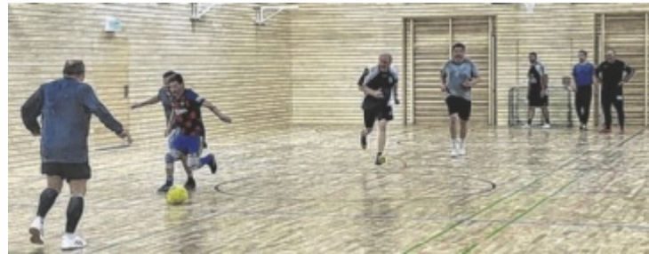
Die AH-Sportler in Aktion