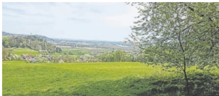
Acht Gemeinden arbeiten gemeinsam an Projekten.

Eine eigene Homepage wird zur Zeit erstellt und ermöglicht eine intensivere Information über Projekte, welche die Region weiter voranbringen sollen. ■