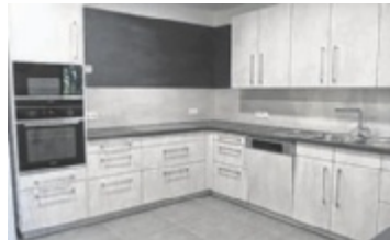
Die funktionelle Küche

Um das Projekt finanzieren zu können, wurde circa die Hälfte des