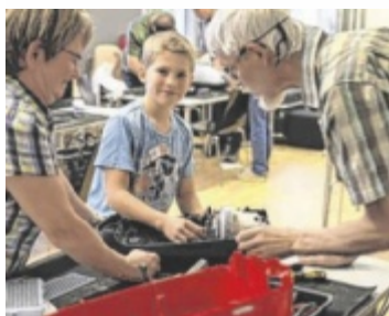
Picken, löten, schrauben