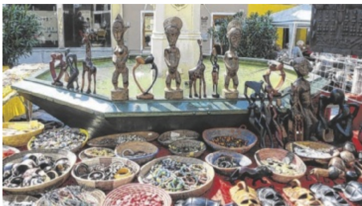
Viele Besonderheiten sind beim Kunstmarkt Tann zu finden.