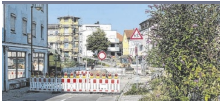
Gesperrt Die Passauer Straße ist zwischen Stachus und Einmündung Bachstraße voraussichtlich noch bis 6. September gesperrt. Hier werden Kanalarbeiten als Vorarbeiten für den Hochwasserschutz durchgeführt.

Rund 15.000 Euro hat der Bau gekostet. Das Grundstück wurde unentgeltlich zur Verfügung gestellt, der Kies stammt aus der stadteigenen Deponie und wurde günstig von der Firma Pinzl verbaut. Auf so viel Bürgernähe hofft man auch die nächsten Jahre beim Bau des Hochwasserschutzes, der noch viele Baustellen bringen wird. ■