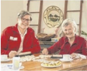
Gemeinsam spielen, plaudern und genießen

Das nächste „Bleib aktiv“-Frühstück findet am 5. September ab 8 Uhr in Altheim statt. Immer am zweiten Montag im Monat wird in Altheim nachmittags gemeinsam Kaffee getrunken, Kuchen gegessen und geplaudert. Zum nächsten Begegnungskaffee wird am 9. September ab 14 Uhr geladen. Ab sofort gibt es auch ein monatliches Begegnungskaffee in Roßbach, das immer am dritten Donnerstag im Monat veranstaltet wird. ■