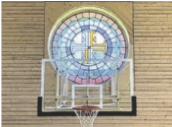
Historisches Rundfenster erhalten

wände erhalten. Sie wird schon fleißig von den verschiedenen Abteilungen des TSV genutzt. Dem Hauptgebäude schließt sich ein neuer Flachbau aus Holz an, der im Osten einen weiteren Bewegungsraum erhalten hat. Dieser eignet sich vor allem für kleinere Sportgruppen, z. B. Yoga,