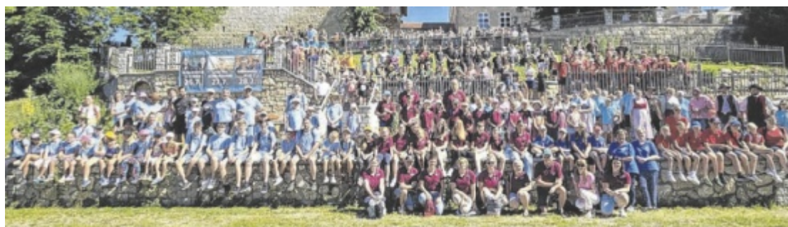
Über 300 junge Trachtler trafen sich zum Gruppenfoto in Frauenstein

Alle waren sich einig, dass es ein kurzweiliger und erlebnisreicher Tag war und jeder trat die Heimreise als „Naturexperte Unterer Inn“ an. ■