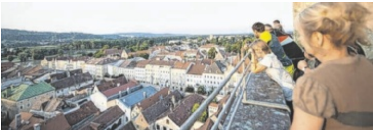
Blick vom Kirchturm über die Dächer von Braunau

Den Start macht die öffentliche Stadtführung am Donnerstag, 22. August, um 16 Uhr. Die etwa 1,5-stündige Tour führt durch bedeutende Orte wie den Stadtplatz, die Altstadt, die Linzerstraße und die Salzburger Vorstadt bis hin zu „Am Berg“. Dabei werden nicht nur architektonische Glanzlich-