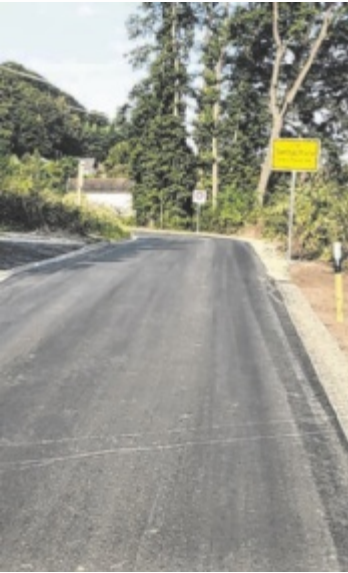
Straße erneuert