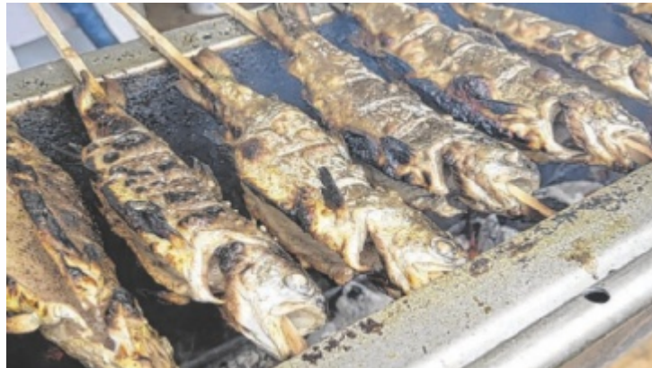
Rund 1.400 Forellen und Makrelen landen beim Fischerfest auf dem Grill.

700 Forellen werden gegrillt oder geräuchert, dazu noch 750 Makrelen, die als Steckerlfisch auf dem Tisch landen. Bei den Seefischen landen 650 Stück Dorsch sowie 60 Zander gewürzt und paniert in der Fritteuse und werden als Backfisch saftig und frisch kredenzt. Ebenso wie die Lachs- und Fischsemmeln werden diese beliebten Schmankerl zugekauft. Aber es wurde auch schon fleißig