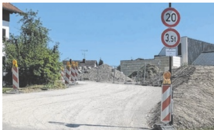
Die „Straße auf Zeit“ verbindet Kreuzberger Siedlung mit Zentrum