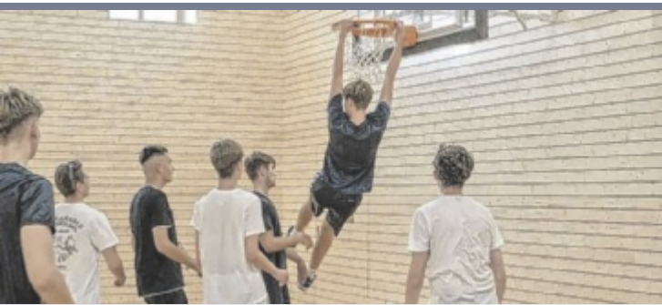
Basketball Die jüngste Sparte des TSV sind die Basketballer. Sie sind laufend auf der Suche nach jungen Spielern und freuen sich in diesem Jahr auf die erste Saison sowie eine starke Unterstützung bei den Heimspielen.