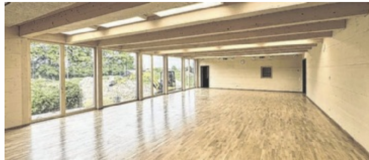
Kleinere Gruppen fühlen sich im neuen Bewegungsraum wohl.