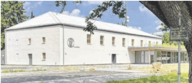
Aus der Jahnturnhalle wurde das Bewegungs- und Begegnungszentrum.