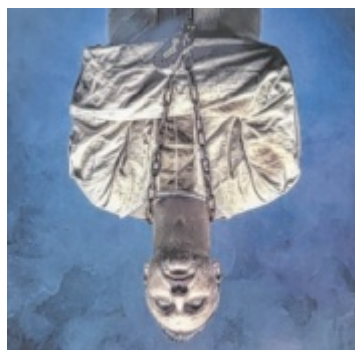
Illusion oder Realität?