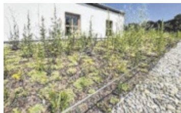
Das Flachdach wurde begrünt.