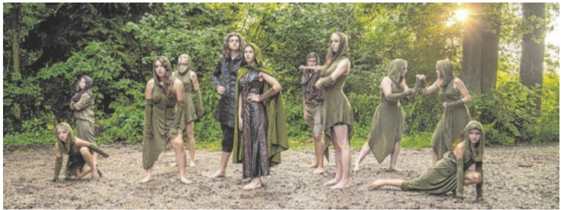
Mit der Eigenproduktion „Robin Hood – Eine Heldinnengeschichte“ startet das Gugg in die Herbstsaison.

BRAUNAU. Es ist wieder so weit: Das Gugg meldet sich aus seiner wohlverdienten Sommerpause zurück – und das mit vielen Neuigkeiten. Neben einem prall gefüllten Programm voller kultureller Highlights erwartet die Besucher eine rundum erneuerte Website und ein neu gestalteter Ticket-Online-shop. Nach fast drei Jahren Arbeit erstrahlt das Gugg ab dem 23. August in neuem Glanz.