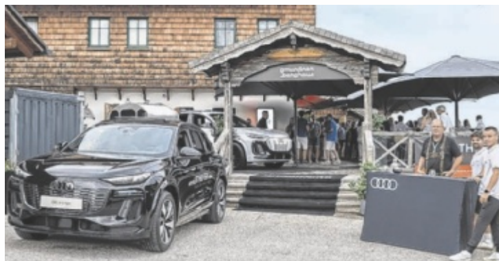
Die Firma Esthofer lud zur Präsentation des neuen Audi Q6 e-tron.