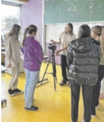
Bei der Arbeit am Film „Die Klimakonferenz“

Schwanenstadt. Sie wurden für ihr Filmprojekt „Die Klimakonferenz“, entstanden mit dem Medien Kultur Haus Wels, beim Prix Ars Electronica in der Kategorie „Young Professionals“ mit einem Anerkennungspreis ausgezeichnet. Kreativ und humorvoll wird ein ernstes Thema behandelt. Dazu nutzten die Schülerinnen einen animierten Fisch, der die Politik über die Konsequenzen der Klimakrise warnt. „Was unser Filmprojekt besonders macht, ist die vollständige schülerinnengesteuerte Ausrichtung. Alle Aspekte des Films – vom Drehbuch über Regie, Film, Ton, Animationen, Musik bis hin zum Schauspiel – haben wir uns selbst ausgedacht und um-