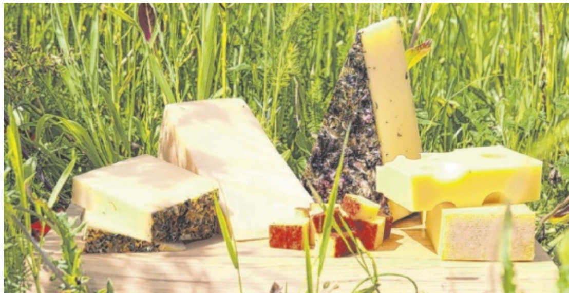
Die Vöcklakäserei stellt verschiedene Käsesorten her – so ist für jeden Geschmack etwas dabei.

Ob Hartkäse wie Bergkäse in verschiedenen Reifegraden mit und ohne Bergblumen und Emmentaler oder Schnittkäse wie der beliebte Vöcklataler oder Gouda in verschiedenen Kreationen. Hier findet jeder seinen