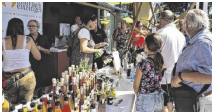
Bei der Genussroas kommen alle auf ihre Kosten.

Bei der Genussroas flaniert man von Stand zu Stand und genießt kulinarische Köstlichkeiten und regionale Schmankerl wie Wildgerichte, Steckerlfisch, Gulasch aus der Gulaschkanone, Backhendl, Käsespezialitäten, Aufstrichbrote, Burger, Weidegans- und Imkerprodukte, Pofesen, Eis und vieles mehr. Für Erfrischungsgetränke sorgen die Firma Starzinger und die Firma