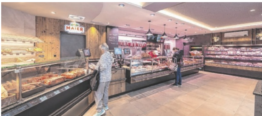
Das neue, moderne Geschäftslokal