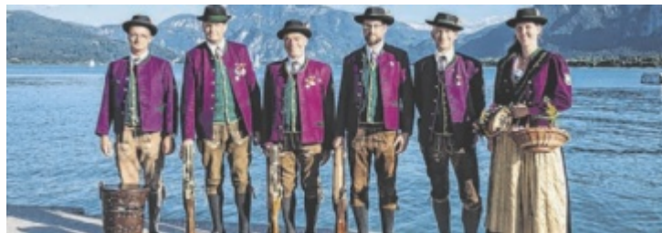
Die Mondseer Prangerschützen vor dem Mondsee

Neben dem Wettbewerb um die europäische Königswürde steht beim Europäischen Schützen-treffen das gemeinsame Erlebnis aller Schützen in Europa im Mittelpunkt: Wettbewerbe im Schießen, im Trommeln und im Fahنشwenken stärken die Gemeinschaft. „Das Europäische Schützen-treffen ist eine große Ehre für uns und für die Region. Außerdem möchten wir das Wesen der Schützen in der Bevölkerung bekannt machen