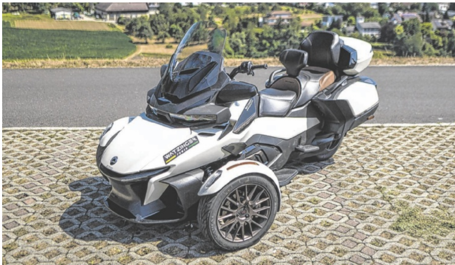
Der Can-Am Spyder „Seat o Sky“ ist ab 44.199 Euro zu haben.