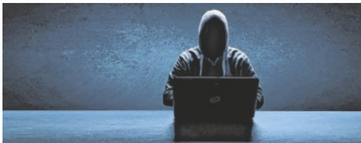
Die Täter entwickeln immer neue, betrügerische Methoden.

Weltweit steigen die Fälle von Cybercrime, auch Österreich ist davon betroffen. Die Angriffsszenarien werden technisch immer raffinierter. Der Fortschritt verändert auch permanent die Art und Qualität der eingesetzten Tatmittel. Darüber hinaus begünstigen die Möglichkeiten der Anonymisierung, der Verschlüsselung und die unbegrenzte Verfügbarkeit des Internet die Verbreitung von Cybercrime massiv. Das Darknet hat die Entstehung krimineller Dienstleister in Form von „Cybercrime as a Service“ begünstigt und