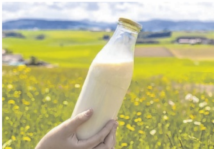
Käseherstellung aus bester Milch aus der Region.

Lieblingskäse. Der Käse steht nicht nur für ausgezeichneten Geschmack, sondern auch ausgezeichnete Qualität. Zu den Zertifizierungen zählen Heumilch, das AMA Bio und Bio Austria Siegel, IFS Food Standards, AMA Gütesiegel, ohne Gentechnik hergestellt, Halal und Kosher.