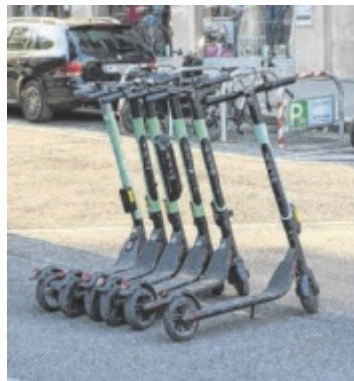
Wissenswertes übers E-Scooter fahren in Österreich

Alle E-Scooter, die schneller als 25 km/h fahren oder über mehr als