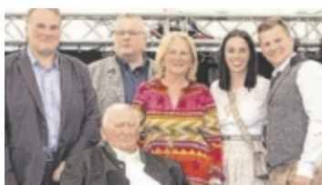
Die Familien Maier und Ostermann führen den Betrieb.