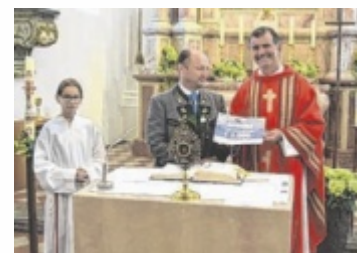
Pfarrer übernimmt Spende.

Trachtenverein D'Stoawandla überreichte ihm eine Spende in Höhe von 2.000 Euro. Dieser Betrag ist für die dringend benötigte Renovierung des Dachs der Basilika in Mondsee bestimmt. ■