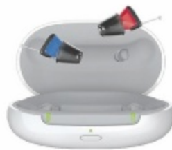
Signia Silk Charge&Go IX

mit den klobigen Hörhilfen von früher zu tun. Längst sind sie zu wahren Wunderwerken in Miniaturform geworden. Eines der kleinsten auf dem Markt ist das Silk von Signia. Jetzt bringt der Erlanger Hörgerätehersteller eine neue Generation des Silk heraus, die noch näher an dem