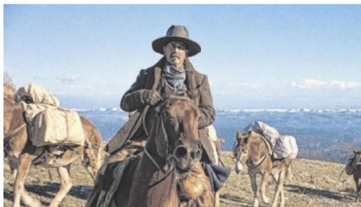
Kevin Costner spielt in „Horizon“ die Hauptrolle.