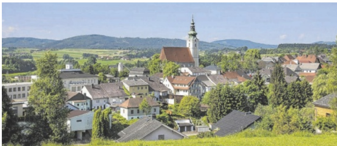
Die Gemeinde Frankenmarkt kann das Alten- und Pflegeheim nicht auslasten, weil Pflegekräfte fehlen.