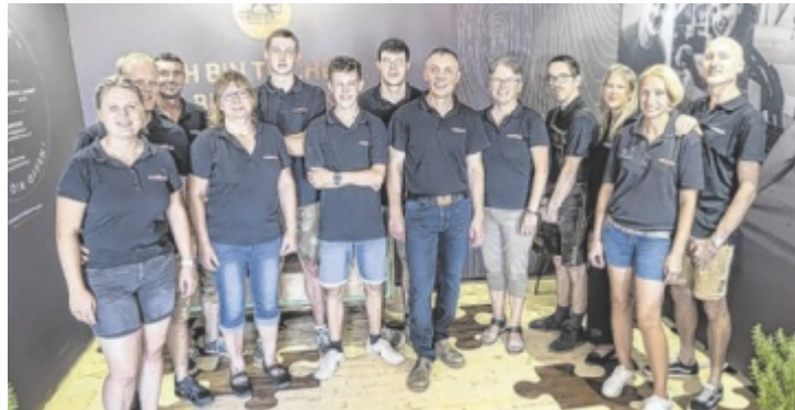
Ein Teil des Teams der Tischlerei Schmölzer

Tischlerei Schmölzer steht für überliefertes Tischlerhandwerk mit Leidenschaft und Liebe zur Perfektion. Der Betrieb zeichnet sich aus durch die Verarbeitung von regionalen Rohstoffen, moderne Fertigungstechniken verbunden mit handwerklichen Fähigkeiten und einem wertschätzenden Umgang miteinander. Beim Tag der offenen Tür am Sonntag, 11. August, konnten sich Besucher davon selbst überzeugen. Schmölzer, der Küchenspezialist, Möbeltischlerei und Bautischlerei in einem ist, lud in eine Art „Handwerkerhaus“ und präsentierte so Einblicke ins eigene Gewerbe und in jenes der Maler, Tapezierer und Polsterer. Sägewerk, Laservermessung, Floristik und mehr waren ebenfalls anwesend.