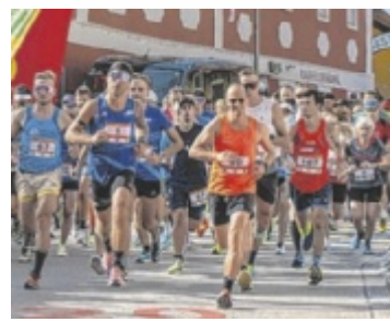
Sickinger Rundlauf