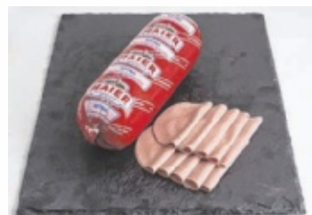
Wurstspezialitäten aus Meisterhand

Die Metzgerei Maier ist der Nahversorger mit 100 Prozent Fleisch aus Österreich! Regionalität und Nachhaltigkeit sind nicht nur Schlagwörter sondern gelebte Unternehmensphilosophie. Geschlachtet, zerlegt