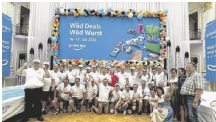
Gebührend gefeiert wurde der Titel für die längste Wurstkette von Amazon und der Metzgerei Maier in den Wiener Sofiensälen.