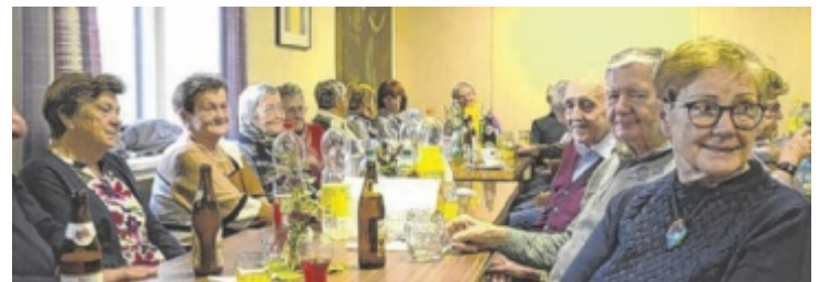
Nächstes Treffen ist am 9. September um 19.30 Uhr im Gasthof Karl.

frohe Ergebnis dieses tollen Projektes, an dem man sich lange erfreuen wird. Die Kinder der 4. Klasse erlebten vor den Ferien drei Projektstage im Lammertal. Am Programm standen Klettern im Hochseilgarten, Wanderungen, Baden, Spielen und ein gemeinsames Lagerfeuer. ■