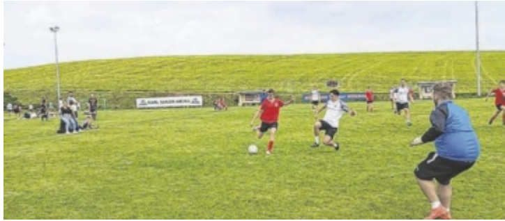
Am Rasen wurde hart gekämpft, man schenkte einander nichts.

Bei bestem Fußballwetter wurden 27 Spiele ausgetragen und zu guter Letzt errang schließlich die