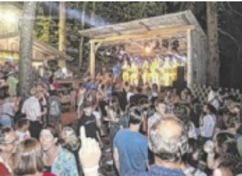
Weyregger Waldfest