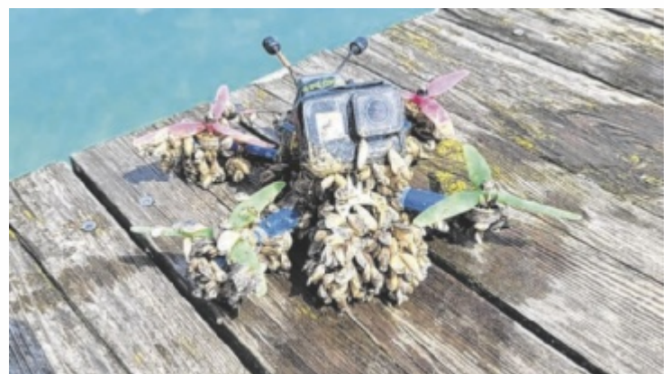
Die „gefangene“ Drohne war bereits mit Muscheln besiedelt.