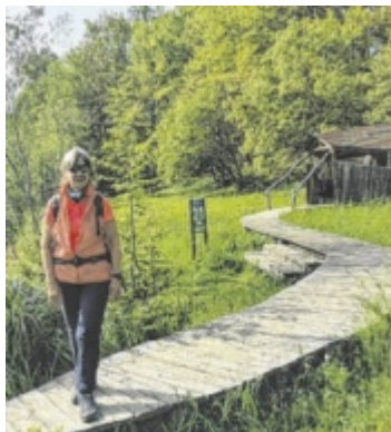
Der liebevoll angelegte Schlangenkopf-Steg zum Biotop

Pregarten ist für Öffi- als auch Autofahrer perfekt. Vom Bahnhof kommend, steigt man den schmalen Pfad ab und folgt dem Wegweiser „Obere Feldaist“. Imposant ist das riesige Viadukt der Eisenbahn zu Beginn.