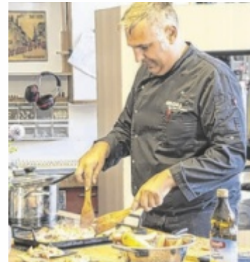
Kochen mit Bora: praktisch und gut

Dazu kam unter anderem die Präsentation eines Lehrlingsstückes, CNC Schauffräsen und weitere Einblicke in das Planungs- und Umsetzungsprozedere, denn bei Schmölzer gibt es alles aus einer Hand: vom Entwurf bis zur Dekoration. Daneben zeichnet sich der Betrieb auch durch Nachhaltigkeit und regionale Wertschöpfung aus: So steht als nächstes Projekt der Bau der Lufttrockenhalle, um die edlen österreichischen Hölzer schonend vorzutrocknen, auf dem Plan. „Damit halten wir unser Versprechen, einzigartige Möbelstücke zu erschaffen“, so Konrad Schmölzer. ■ Anzeige