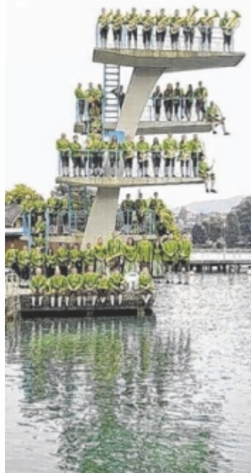
Aktuelle Inhaber des Pokals: die Musikkapelle Seewalchen

Die Veranstaltung beginnt um 16.30 Uhr mit der offiziellen Begrüßung der Kapellen. Ab 17 Uhr starten die Wertungsspiele. Gegen 20 Uhr sorgt die Musikkapelle aus Obernberg am Brenner mit einem Konzert für musikalische Highlights. Anschließend lädt „Atteranka“ mit einem abwechslungsreichen Abendprogramm zur Unterhal-