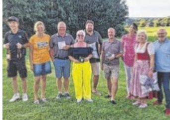
Die Gemeindemeister