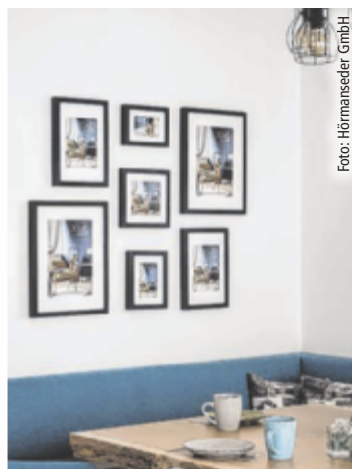
Lagernde Rahmen können nach Belieben zu Sets kombiniert werden.