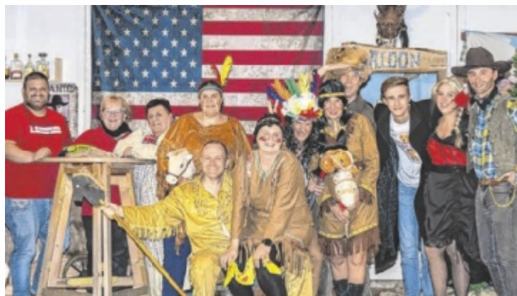
Mitglieder der Theatergruppe Frankenmarkt bei der Aufführung 2023 „Ruhestand - ... und plötzlich war die Ruhe weg!“