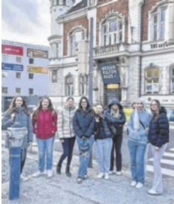
Die Schülerinnen der COM-Gruppe an der PTS Schwanenstadt

Auch in diesem Jahr lädt das „Fest im Festival“, „Create your world“, zum Experimentieren und Ausprobieren ein. In der Postcity können in offenen Laboren, neue Technologien, besondere Ideen und mehr ausprobiert und weiterentwickelt werden. Verschiedene Künstler, Vereine und Unternehmen sind Teil dieses Spielplatzes der Welt von morgen. Teil von „Create your world“ sind auch die Schülerinnen der COM-Gruppe an der PTS