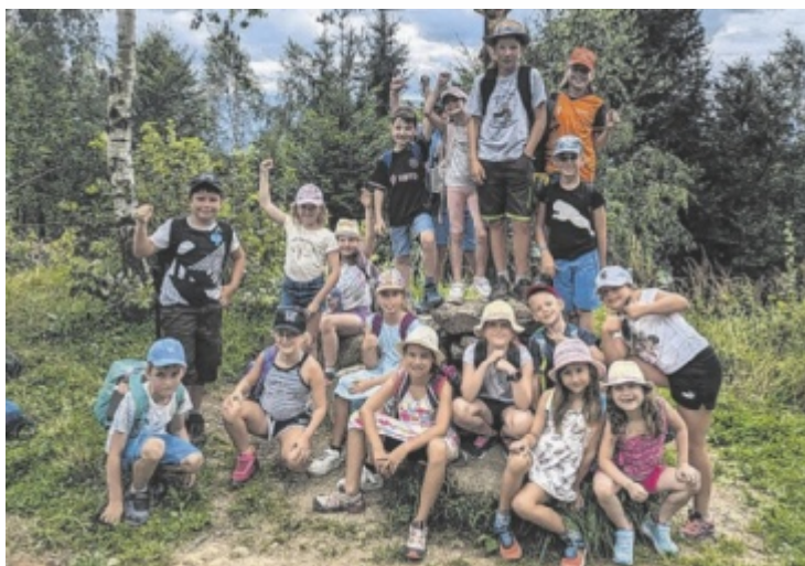
Wanderung zum Gipfelkreuz