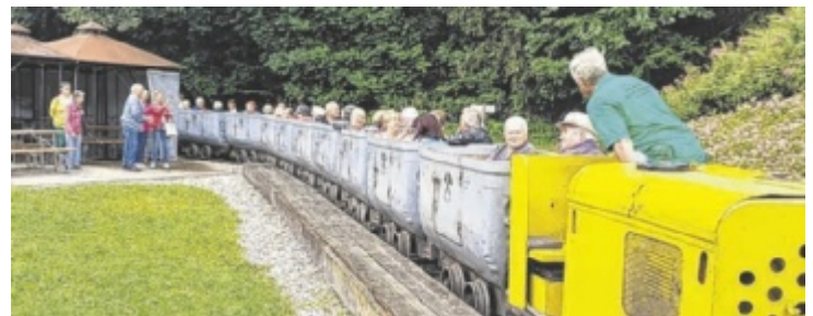
In Grubenhunten ging es in den Schautollen.

bognerbad® Bäder traumhaft sanieren ★★★★★