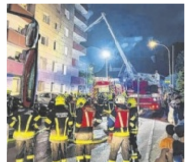
Feuerwehr-Großaufgebot bei Brand

dern“, so der Bürgermeister zu den beiden Lebensrettern vom Abend des 7. Juli 2024. ■