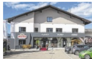
Die Metzgerei Maier in Pöndorf