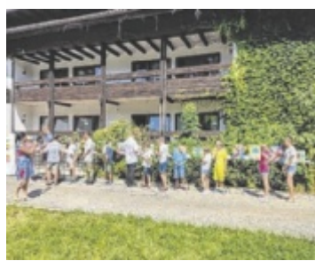
Präsentation der Kunstwerke

anstaltet der Stöttenchor bereits Konzerte zugunsten der Schmetterlingskinder, in Gampern konnte der beachtliche Betrag von 7.500 Euro Reinerlös für die Schmetterlingskinder gesammelt werden. Auch im Jubiläumsjahr 2025 wird der Verein Debra Austria mit weiteren Benefizkonzerten unterstützt. ■