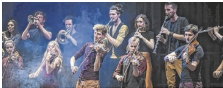
Das Stegreif Orchester gastiert beim Brucknerfest 2024.

HELLMONSÖDT. Mit einer Kinderdisco, Saftbar, Kaffee und Kuchen eröffnet der Spiegel-Treffpunkt die neu gestalteten Räumlichkeiten im Pfarrheim Hellmonsödt. Termin: Samstag, 28. September, ab 14 Uhr.