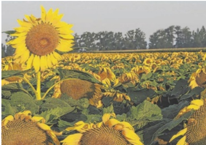
„Neugierig reckt eine Sonnenblume auf einem Biofeld in der Ortschaft Purwörth, Walding, ihren Blütenkorb und lässt sich von der aufgehenden Sonne verwöhnen“, so Gerhard Rammerstorfer aus Goldwörth zu seiner Aufnahme.

URFAHR-UMGEBUNG. Jeden Tag treffen traumhaft schöne Bilder aus dem Bezirk Urfahr-Umgebung ein. Wer auch gern sein Lieblingsfoto hier an dieser Stelle mit der Tips-Leserschaft teilen möchte, kann seine schönste Aufnahme (mindestens 350 kB) unter dem Betreff „Leserfoto“ samt einer kurzen Beschreibung dazu, was es zeigt und wo es aufgenommen wurde, per E-Mail an j.stitz@tips.at senden. Mit etwas Glück ist es vielleicht auch in einer der kommenden Tips-Ausgaben zu sehen. ■