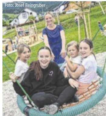
Die Reichenauer Kinder nahmen ihr neues Reich gleich in Besitz.