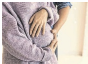
Frühe Hilfen OÖ hilft durch turbulente Zeiten.

gang mit ihrem Kind unsicher oder überfordert fühlen, Ängste oder Belastungen drücken oder jemand Unterstützung bei Behördenwegen braucht. Auch bei körperlicher oder psychischer Erkrankung eines Elternteils oder einfach bei Fragen zur Pflege und Versorgung des Kindes stehen die Familienbegleiterinnen der Frühen Hilfen zur Seite. Die Frühen Hilfen sind kostenfrei und freiwillig. Sie unterstützen dabei, die passenden Angebote zu finden, damit sich die Kleinsten gut entwickeln können.“ ■