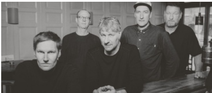
Kettcar haben als Geburtstagsgeschenk ihr neues Album mit dabei.