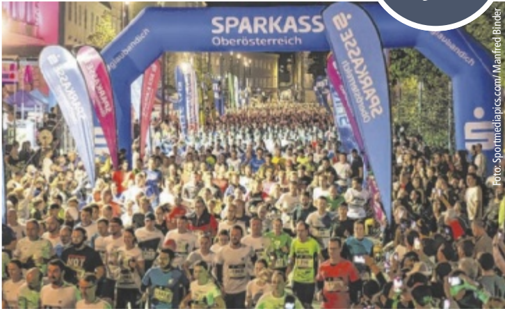
Der Startschuss für den City Night Run fällt um 20.30 Uhr auf der Promenade.

LINZ. Am Donnerstag, 26. September, fällt um 20.30 Uhr der Startschuss zum 13. Sparkasse City Night Run. Der 5,2-Kilometer-Lauf lockt auch heuer wieder Hobby- wie Profiläufer zu später Stunde in die Linzer Innenstadt.