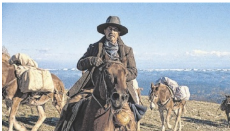
Kevin Costner spielt in „Horizon“ die Hauptrolle.