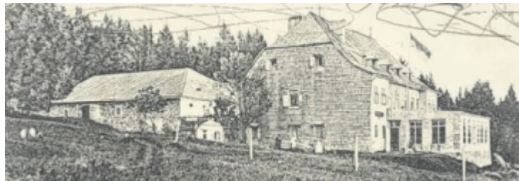
Das Badhaus in Kirchschlag um 1903

Von seiner Sommerfrische im „modernen Badeort“ Kirch-