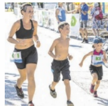
Die Familienstaffel Ecker aus St. Thomas war auch dabei.

HARTKIRCHEN. 255 Sportler – 126 in den Einzelwertungen und 129 in den Dreier-Staffeln – waren beim 18. Hartkirchner Jedermann-Triathlon bei 32 Grad dabei.