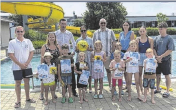
Schwimmkursabschluss Das Spiegelteam vom Treffpunkt Waizenkirchen organisierte in diesem Jahr zwei Schwimmkurse für die Kinder aus der Umgebung. Unterstützt wurden sie dabei von der Gemeinde und der Raiffeisenbank Waizenkirchen. So konnten circa 110 Kinder schwimmen lernen, 20 absolvierten sogar Prüfungen für ein Schwimmabzeichen.