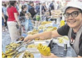
Köstlichkeiten aus Italien am italienischen Marktfest

Es duftet nicht nur nach Pizza und Pasta, nach köstlichen Weinen und nach mediterranen Gewürzen. Die berühmten italienischen Käse kennt jeder, die „Formaggi“ in unzähligen Variationen: Der Mozzarella, frisch aus Italien, würziger Pecorino aus Sardinien, aus der Toscana Caciocavallo und Parmigiano, immer frisch aus dem Laib geschnitten, und nicht zu vergessen, Gorgonzola, auf den Punkt gereift. Dazu ein Glas Vino, das kann schon ein Höhepunkt lukullischen Genusses sein. Wie bei unseren schönsten Urlaubsträumen bieten italienische Marktleute und Weinbauern ihre typischen Spezialitäten aus dem beliebten südlichen Nachbarland.