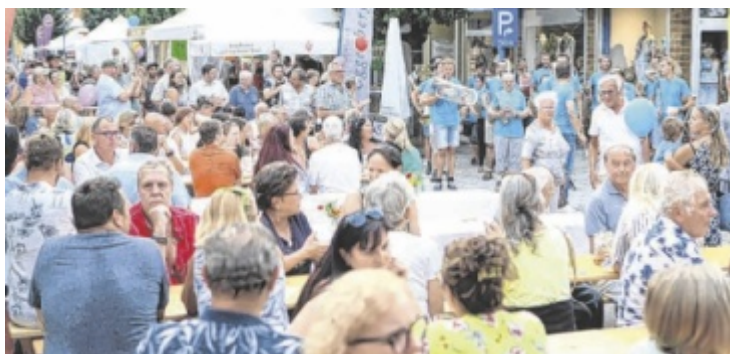
Auch heuer fanden sich wieder zahlreiche Festbesucher ein.