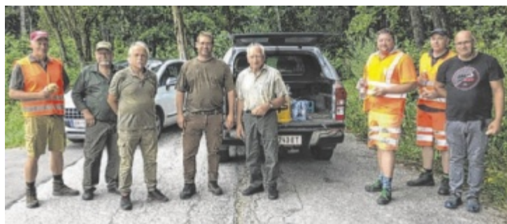
Die Neukirchner Jägerschaft und die Straßenmeisterei Peuerbach haben an den Straßen Wildwarngeräte aufgestellt.

NATTENBACH/NEUKIRCHEN/ESCHENAU. Zu einem Informationsnachmittag über den großflächigen Ausbau der Glasfaser-Infrastruktur lädt die BBOÖ Breitband Oberösterreich GmbH. Am Freitag, 30. August, ab 13 Uhr können Besucher im Gasthaus Reifinger in Natternbach die Internet-Provider kennenlernen und sich über deren Dienstleistungen informieren. In den Gemeinden Natternbach, Neukirchen und Eschenau werden 885 Haushalte die Möglichkeit erhalten, sich an die Glasfaser-Infrastruktur der BBOÖ anzuschließen. Der Bau hat im März 2024 gestartet und schon im Juli konnten die ersten Kunden angeschlossen werden. Interessenten können auf bbooe.at die Verfügbarkeit an ihren Adressen überprüfen und den Anschluss bestellen. ■