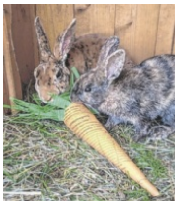
Zeigs Zeignis Die Preisträger des Foto-Wettbewerbes aus den Bezirken Eferding und Grieskirchen stehen fest. Seite 13