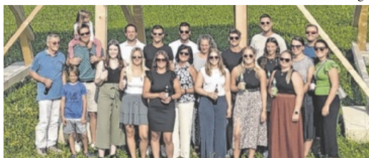
Teil des Teams werden: Nähere Infos zu den aktuellen Stellenangeboten unter www.lehner-lifttechnik.at/de/Unternehmen/Karriere