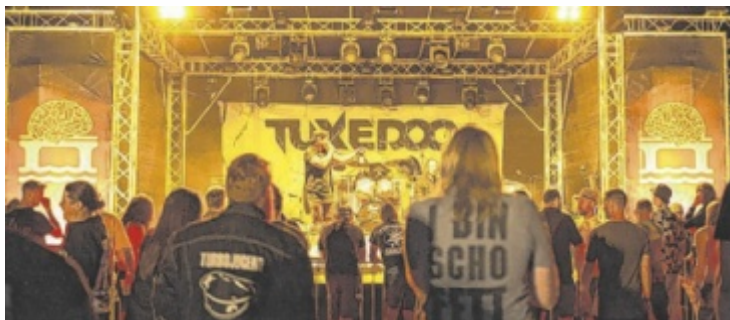
Viel coole Musik gabs beim Brainbridge Festival.