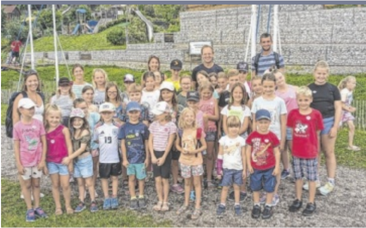
Mit dem Bürgermeister im Kinderland Im Rahmen der Prambachkirchner Ferienpassaktion besuchte Bürgermeister Herbert Holzinger (ÖVP) mit 35 Kindern das OBRA Kinderland. Dort konnten die Kinder die verschiedenen Stationen ausprobieren: Klettertürme, Floßfahrten, Wasserrutsche, Schaukelpark, Heustadt und vieles mehr. Zum Abschluss spendierte Holzinger den Kindern ein Eis.