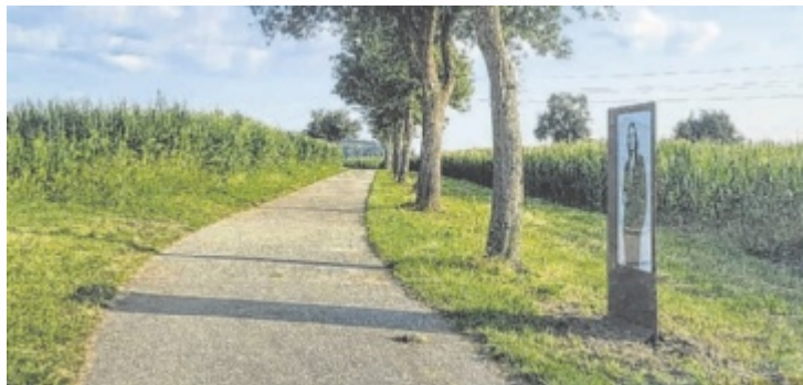
„Frauen am Weg“ nennt sich das Projekt des Soroptimist Club Grieskirchen.

Entstanden sind vier Kunstobjekte (Bilder) auf Stehern. Am Wanderweg zwischen Grieskirchen und Tollet kann man diese bestaunen. Mittels einem QR-Code werden auch nähere Infor-