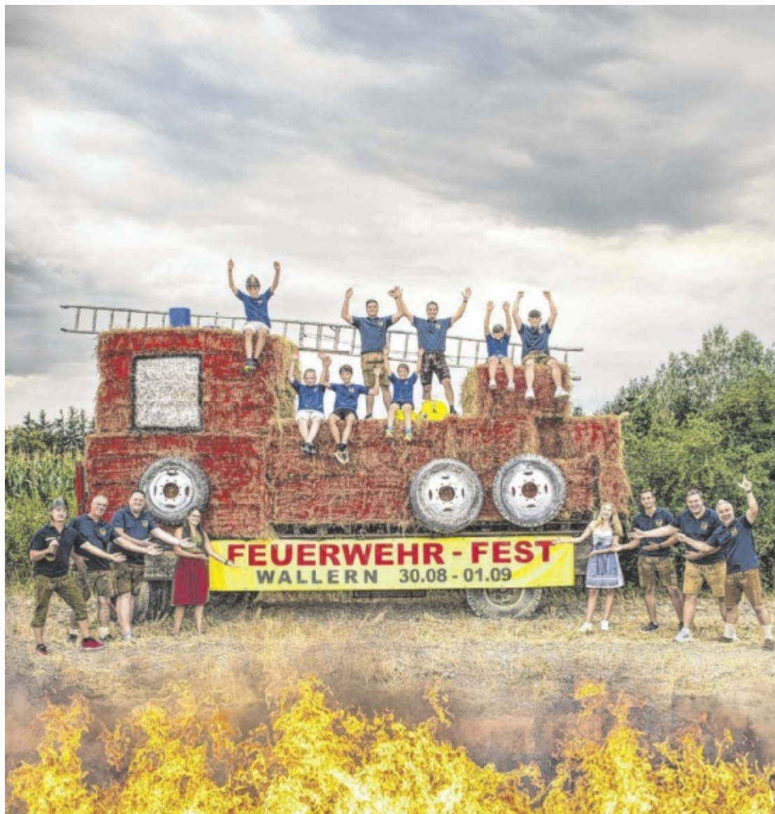
Jubiläum Zum 135-Jährigen lädt die Wallerner Feuerwehr per Festakt ein: Drei Tage lang versorgen die Florianis ab Freitag, 30. August, ihre Gäste mit Live-Musik, kulinarischen Schmankerln und Kabaretteinlage. Seite 21