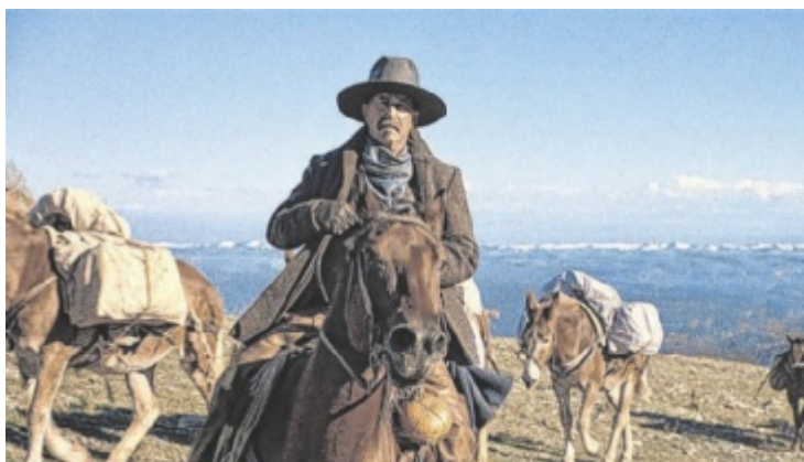
Kevin Costner spielt in „Horizon“ die Hauptrolle.