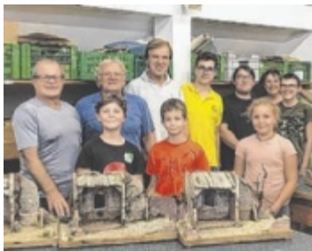
Die Krippenfreunde Hausruck-Geboltskirchen laden zum Krippenbau-workshop ein.

GASPOLTSHOFEN/GEBOLTS-KIRCHEN. Das OÖ Forum Volkskultur lädt zu verschiedenen Workshops. Dort können junge Generationen alte Traditionen neu entdecken: Das OÖ Volksliedwerk veranstaltet am Freitag, 23. August, ab 14 Uhr einen kostenlosen musikalischen Kindernachmittag im Pfarrheim Gaspoltshofen. Anmeldung unter 0676 5084960 oder buero@ooe-volksliedwerk.at Mit den Krippenfreunden Hausruck in Geboltskirchen können Kinder von Montag, 26. bis Freitag, 30. August (9 bis 13 Uhr) in der Landeskrippenbauschule Geboltskirchen ihre eigenen Weihnachtsskrippen bauen und mit nach Hause nehmen. Anmeldung und Infos: 0664 5371053 oder franz.witzmann@gmx.net ■