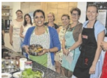
Als Beispiel: der Workshop „Kulinari-sche Fernreise“