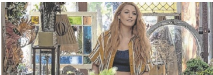
Blake Lively verliebt sich in ihrer neuen Romanze.