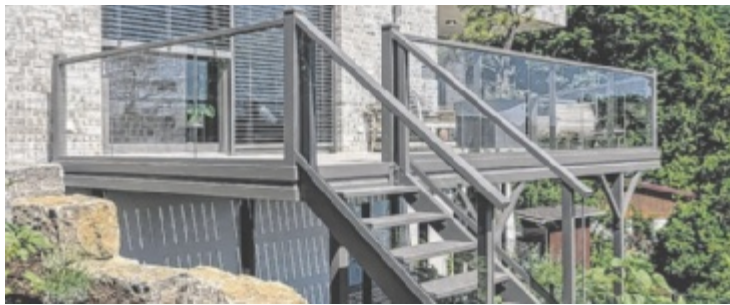
Anbaubalkone von Leeb für jedes Gebäude