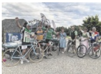
Retro-Radrennen In Bad Wimsbach wird bei der „L'Historica“ wieder mit viel Spaß um die Wette gefahren. Seite 20