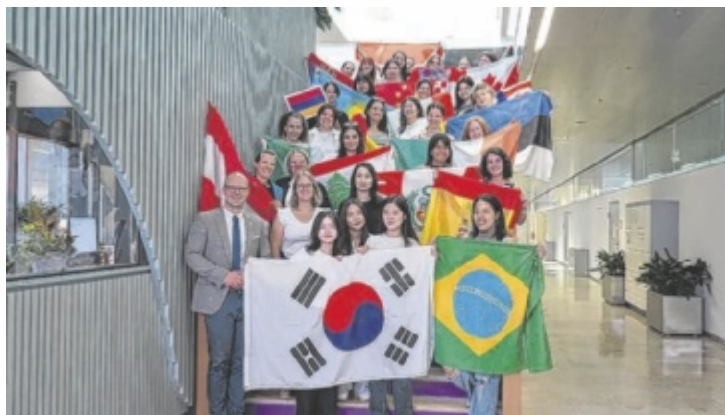
28 Studentinnen aus 19 verschiedenen Ländern waren am Fachhochschul-Campus Wels bei der 10. „International Summer Academy in Engineering for Women“ zu Gast.

Die Academy behandelt Themenbereiche wie Nachhaltigkeit, Künstliche Intelligenz, Medizintechnik, Bauingenieurwesen oder auch Lebensmitteltechnologie und Energie, mit dem Ziel speziell weibliche Studierende für ein MINT-Studium zu motivieren, oder in einem solchen zu halten. Erstmals konnten auch Absolventinnen frühe-