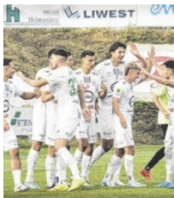
Heimsieg Zuerst trennte sich der FC Hertha Wels von Trainer Emin Sulimani, dann gab es ein 3:2 gegen Weiz. Seite 18 / Foto: Erhardt