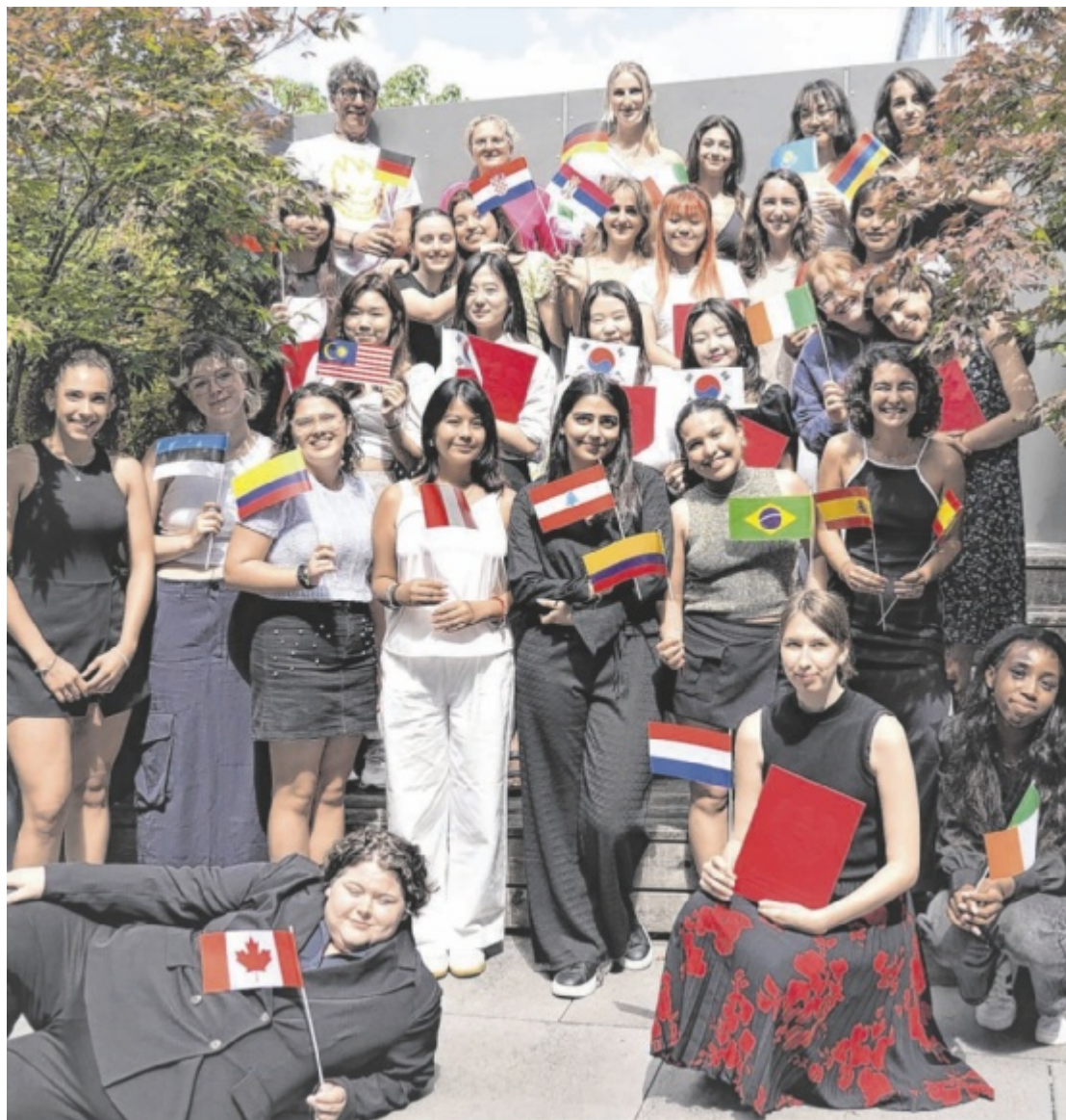
Sommerakademie 28 Studentinnen aus 19 Ländern kamen an der Fachhochschule Wels für zwei Wochen zusammen, um gemeinsam an den unterschiedlichsten Projekten zu forschen und Workshops zu besuchen. Seite 10