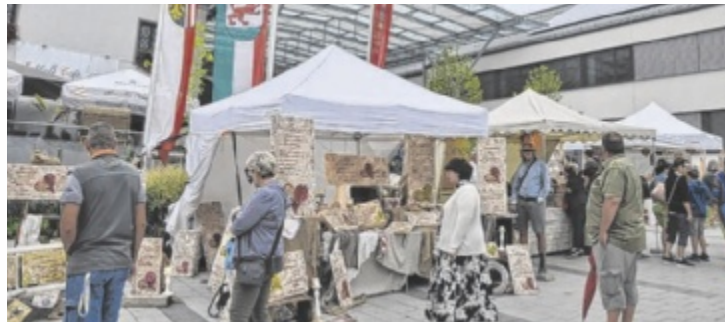
16. Sommermarkt des Kunsthandwerks in Sierning

SIERNING. Am 24. und 25. August findet der beliebte Kunsthandwerksmarkt rund um das Renaissanceschloss im Zentrum des 10.000-Einwohner-Ortes Sierning im Steyrtal statt. Zwei Tage lang stehen das Schloss, der Schlosshof und der angrenzende Kirchenplatz ganz im Zeichen von Kunst, Design und Kunsthandwerk.