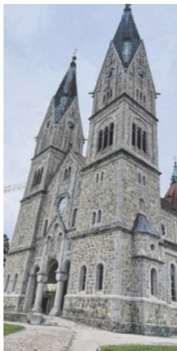
Pfarrkirche Herz Jesu