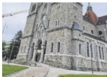
Flohmarkt Die Pfarre Wels Herz Jesu nimmt ab 19. August wieder Waren für den traditionellen Flohmarkt an. Seite 13

In Wels gehen einige Allgemeinmediziner in Pension. Immer wieder gibt es Informationen und Gerüchte über ein Primärversorgungszentrum (PVZ) in der Mesestadt. Im Tips-Exklusivinterview möchte SP-Vizebürgermeister Klaus Schininger keine falschen Hoffnungen wecken. Es kann sich in den nächsten Wochen was tun, muss aber nicht. Seite 4