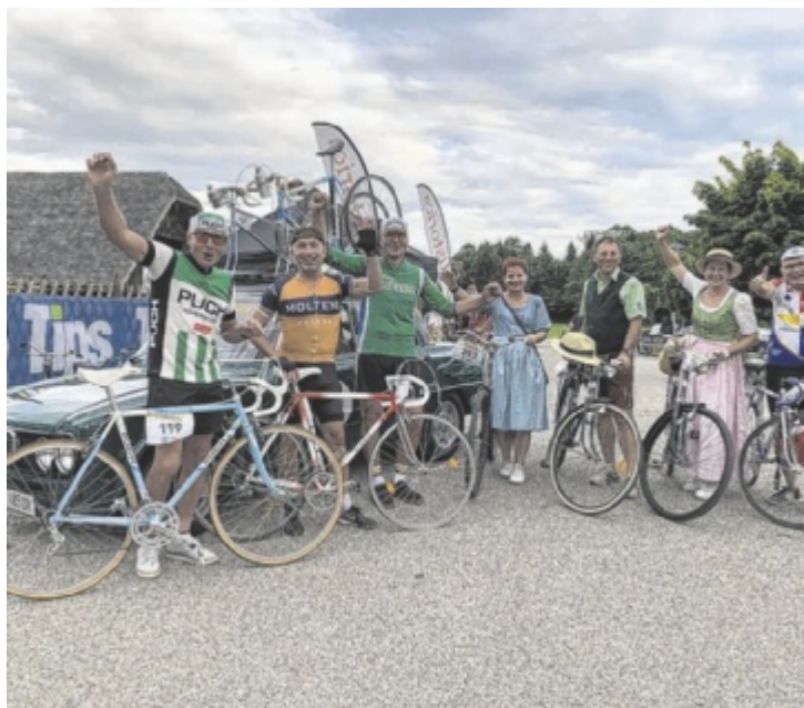
Es wartet viel Spaß auf die Teilnehmer.

Start ist am Samstag, 31. August um 13 Uhr vor dem historischen Troadkasten unweit des Moorbad (OptimaMed Gesundheitsresort). Bei der Anmeldung, die online auf www.lhistorica.at oder direkt vor Ort zwischen 11 und 12.30 Uhr möglich ist, kann man aus den Kategorien „Traditionell: Waffenradler im Dirndl oder Lederhose“, „Vintage – Old School Tweed Style“ (Waffenrad und Hochrad) und „Rennrad-