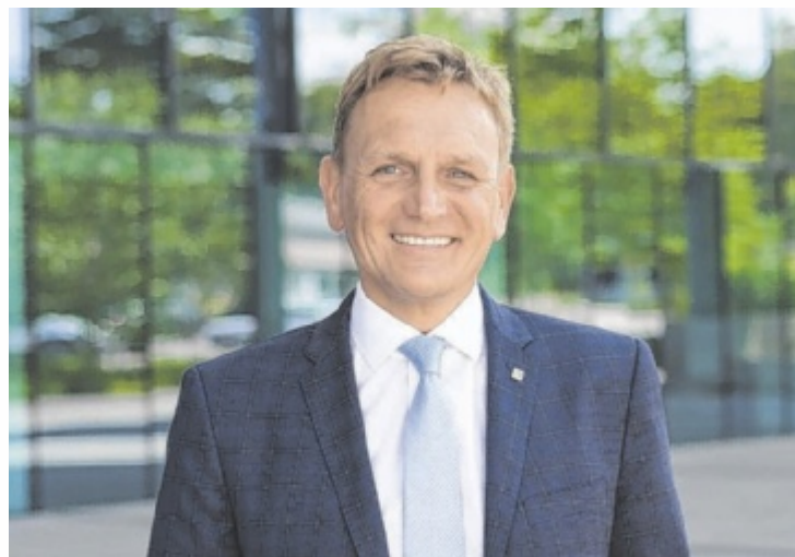
SP-Vizebürgermeister Klaus Schinninger spricht über die kommenden Herausforderungen im Gesundheitsbereich und auch ein mögliches Primärversorgungszentrum.

Tips: Wie schwierig ist es allgemein die Kassenstellen zu besetzen?