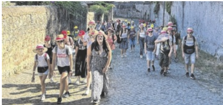
55 Kinder und Jugendliche aus dem Dekanat Perg waren auf Rom-Reise.

BEZIRK/ROM. Auch 55 Kinder und Jugendliche und 15 Begleitpersonen aus dem Dekanat Perg waren Teil der großen Internationalen Ministranten-Wallfahrt zu Papst Franziskus nach Rom.