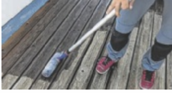
Pflege für die Terrasse

Strapazierte Holzterrassen sollte man ab und zu – am besten im Frühjahr oder Spätsommer – aufpäppeln.