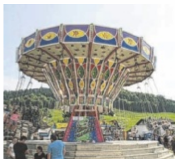
Auf geht's bei der Strudengauer Messe 2024.

Am Freitagabend ab 22 Uhr wird dann die „Party Mafia“ im Festzelt für Stimmung sorgen. Am Samstag wartet um 12 Uhr die Eröffnung mit Bieranstich, musikalisch umrahmt von den „Donautalern“, die ab 11 Uhr zum Frischschoppen laden. Um 14 Uhr startet das schon zur Tradition gewordene Treffen von Pensionisten, Senioren und Mitgliedern des Seniorenrings. Für musikalische Stimmung sorgen wird am Samstagabend die Gruppe „Zwirn“. Mit Messe (9 Uhr) und Frischschoppen wartet der Messesonntag auf. Unterhaltung bietet der GMV Krenstetten, ab 14 Uhr