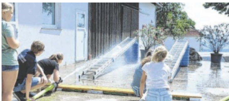
Bei verschiedenen Stationen hatten die Kinder großen Spaß.