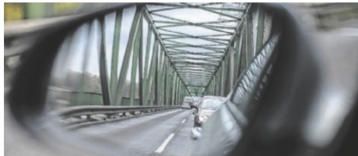
Donaubrücke Mauthausen: Tragende Bauteile werden verstärkt, an der Unterseite finden zudem Wartungsarbeiten statt.

An sechs Nächten, seit 12. August und je nach Witterung bis 6. September, wird gearbeitet, außerhalb der Hauptverkehrszeiten zwischen 19.30 und 5 Uhr. Während dieser Zeit kann es zu kurzfristigen und kurzzeitigen Verkehrsstopps und Wartezeiten kommen, da für die Arbeiten eine schwingungsfreie Brücke notwendig ist. Mit einer erheblichen Fahrzeitverlängerung sei nicht zu rechnen, teilt das Land OÖ mit. Zusätzlich zu den nächtlichen Schweißarbeiten sind von 19. August bis 6. September zwi-