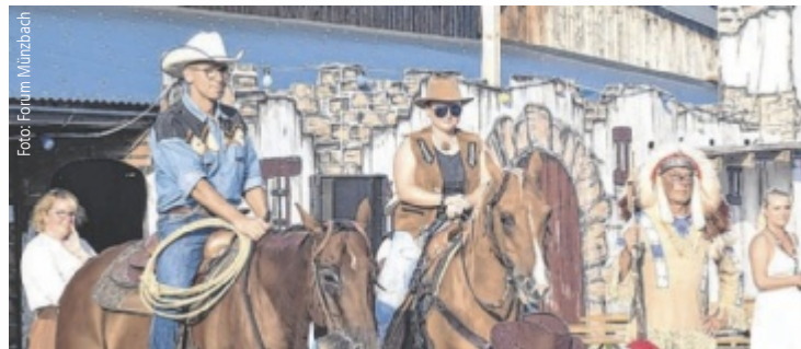
Cowboys und Cowgirls kommen beim Country Festival voll auf ihre Kosten.

Wie gewohnt werden sowohl in der Country Hall als auch im Musikcorner im überdachten Freibereich viele Richtungen der Country-Musik vertreten sein. Los geht's um 17 Uhr mit dem Kinderprogramm unter dem Motto „Abenteuer im Wilden Westen“. Ab 19 Uhr gibt es Livemusik vom Feinsten mit einer Mischung internationaler und nationaler Top-Country-Bands. Crooks & Straights, Rob Ryan Roadshow,