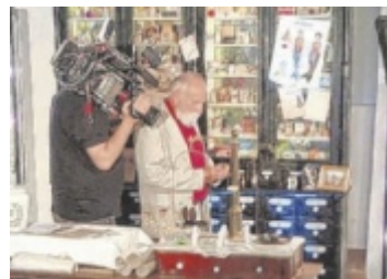
Dreharbeiten Das Apothekenmuseum in Mauthausen war Schauplatz für Dreharbeiten für eine TV-Doku. Seite 6 / Foto: Hubert Voigt

Die Landjugend Klam organisierte bei Clam-Konzerten eine erfolgreiche Stammzellentypisierungsaktion. >> Seite 16