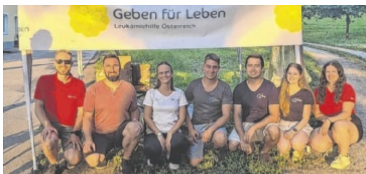
Die Landjugend Klam organisierte eine Stammzellen-Typisierungsaktion.