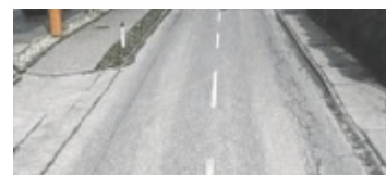
Zustand der Pleschinger Straße