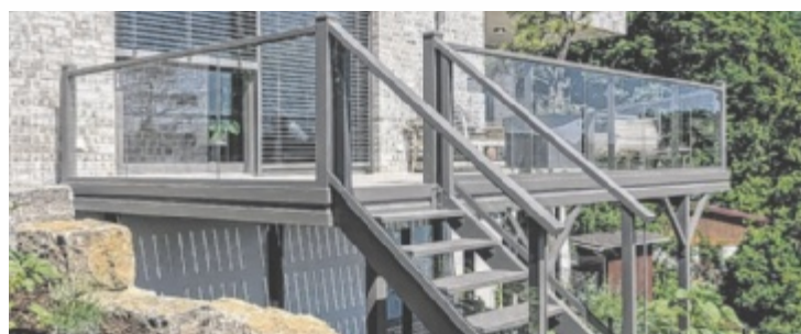
Anbaubalkone von Leeb für jedes Gebäude