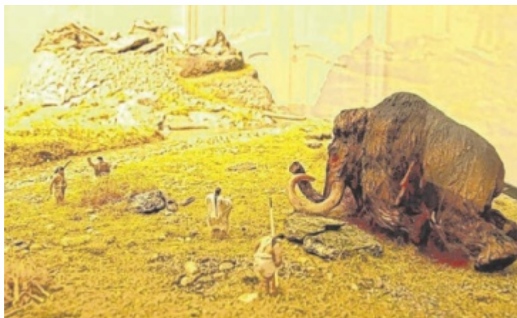
Nachbildung des Langensteiner Fundortes im Landesmuseum

Als das Oberösterreichische Landesmuseum am 22. April 1964 telefonisch von der Gemeinde Langenstein über Grabfunde auf der so genannten Berglitzl informiert wurde, ahnten die Experten nicht, dass sich der unscheinbare Hügel als eine der größten Fundstätten prähistorischer und frühmittelalterlicher Relikte des gesamten Donaumaums entpuppen sollte. Doch der Reihe nach. Bevor sich die Gemeinde an das Land wandte, hatte sich der Grundeigentümer beim Ortschef gemeldet und