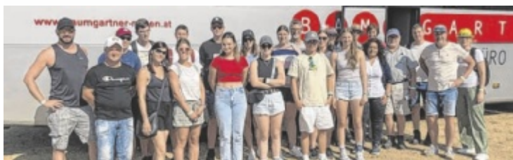
Mitglieder von Dimbacher Vereinen bei der Trial-EM in Tschechien

Getränke und Eis war natürlich ein wichtiger Part an diesem sehr warmen Nachmittag. Der Abschluss fand bei der FF Obernstraß mit einer Jause statt. Das Kommando beider Feuerwehren staunten über das Wissen der Kinder und freuten sich mit allen Helfern über den gelungenen Tag. ■