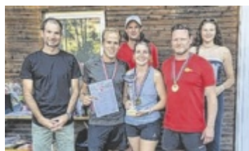
Der Sieg im Hobby-Bewerb ging an „Schlechschmetterfront“.