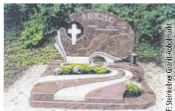
Stein ist zeitlos und nahezu unvergänglich.

Stein ist ein ganz besonderes Material: zeitlos, wertbeständig und nahezu unvergänglich. Steinkellner Granit-Abholmarkt und Grabanlagen direkt an der Greiner Donaubrücke arbeitet vorwiegend mit den Materialien Granit, Marmor, Schiefer und Quarzit. Mit fachlicher Kompetenz, Geschick, langjähriger Erfahrung und einem Blick fürs