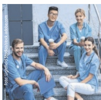
Den Traumjob im Blick mit einem Studium an der FH Gesundheitsberufe OÖ, www.fh-gesundheitsberufe.at

Bis 15. August für den Bachelor Studiengang Biomedizinische Analytik, Radiologietechnologie, Gesundheits- und Krankenpflege, Logopädie oder einen Hochschullehrgang bewerben. ■ Anzeige