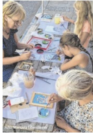
Kinder lernen beim Workshop in Freistadt die Hinterglasmalerei kennen.

In Freistadt tauchen die jungen Teilnehmer beim Workshop am Mittwoch, 21. August, von 14 bis 18 Uhr gemeinsam in die Geschichte der Hinterglasmalerei ein. Nach einer Erkundung der mittelalterlichen Stadt wird ein Riss (Vorlage) entworfen, der dann auf Glas gemalt wird. Der Workshop findet in der Waaggasse 27 statt, Infos und Anmeldung bei Manuela Eibensteiner, Tel. 0650 5426076. Der Blasmusikverein Leopoldschlag lädt am Freitag, 30. August, von 15 bis 17.30 Uhr zu einer musikalischen Entdeckungsreise