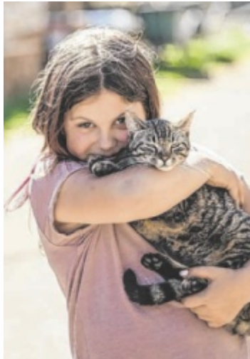
Das Tierheim Freistadt lädt am 24. August ein. Viele Tiere hoffen auf ein neues Zuhause.

Los geht es beim Tag der offenen Tür im Tierheim in der Schwandtnerstraße 28 um 13.30 Uhr mit der offiziellen Eröffnung und Ansprachen der Ehren Gäste und der Tierheimleitung. Die Besucher können das Tierheim besichtigen, und die Tierheimhunde werden ihnen bei der Gelegenheit vorgestellt. Eine Hüpfburg, ein Schießstand, eine Schnitzeljagd, Bierkistenklettern und Basteln lassen keine Langeweile aufkommen. Außerdem ist eine Tombola geplant und DJ Mühlh legt auf. Für