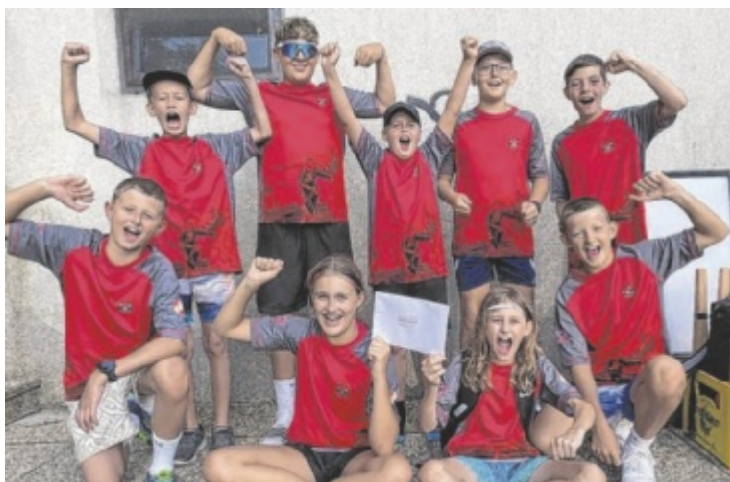
Jubel bei den Gewinnern der Team-Challenge, FF Rainbach 2