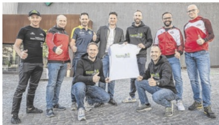
Das Organisationsteam der Wiesen Challenge am 17. August