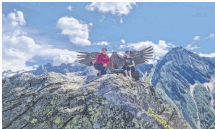
Die zehn Sommerbergbahnen bringen Besucher dem Gipfel näher. Für die Gäste vom Garberwirt gibt es kostenlos geführte Wanderungen im Naturpark.

In den Tag wird mit einem großzügigen Frühstücksbuffet gestartet. Während die Besucher