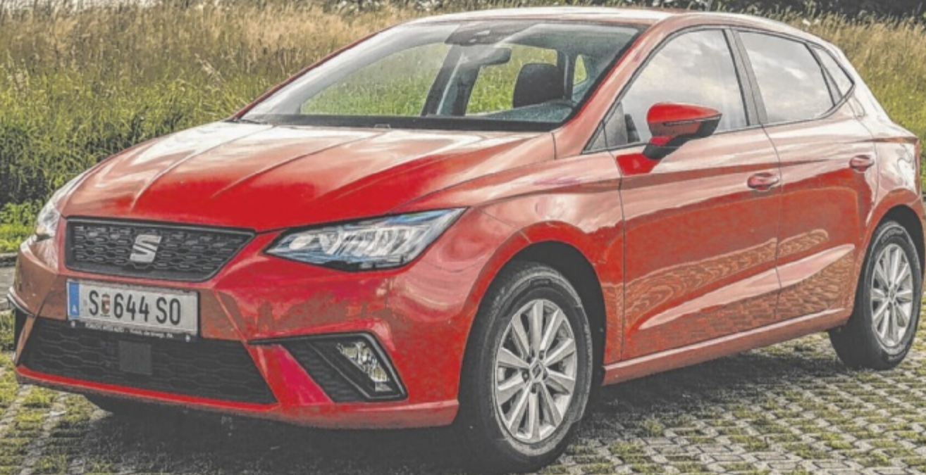
Der Seat Ibiza 1.0 Reference ist ab 17.640 Euro zu haben.