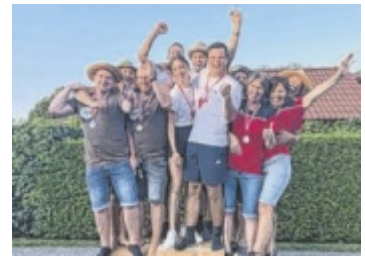
Jubel bei den Siegerteams

den Hackbrettschläger komplett neu, das war ein echter Glücksfall.“ Die ersten Soundschläger sind mittlerweile verkauft, es wird fleißig geprobt und gespielt damit. Ein Onlinekurs entsteht und an vielen weiteren Ideen wird gearbeitet. Ende August wird es einen Schnupperkurs geben. ■