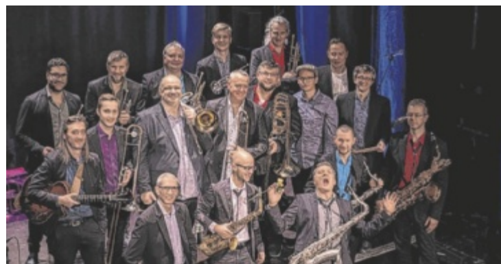
Das Upper Austrian Jazz Orchestra tritt in Kefermarkt auf.