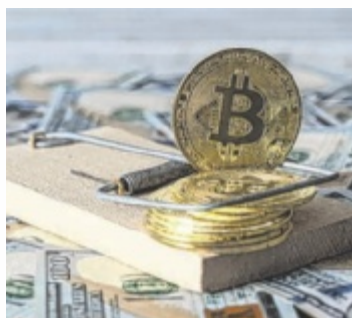
Vorsicht, Falle!

Schon im Jahr 2022 erstattete der Pensionist Anzeige, als er einen versprochenen Gewinn nach einer Bitcoin-Investition nicht ausbezahlt bekommen hatte. Nach rund einem Jahr kontaktierten die unbekannten Täter den Mann erneut und teilten mit, er solle Transaktionsgebühren überweisen, der Betrag aus der Investition habe sich stark erhöht. Das Opfer erstattete erneut Betrugsanzeige. Am 5. August kam der Mann neuerlich zur Polizei. Man habe ihm mitgeteilt, dass der Geldbetrag durch