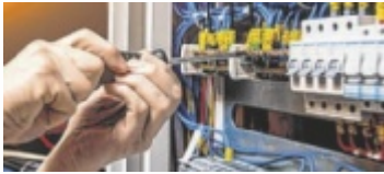
Für die Arbeit von Handwerkern gibt's Geld zurück.

Mit dem Handwerkerbonus erhalten Privatpersonen eine Förderung für durchgeführte Arbeitsleistungen rund um den privaten Wohn- und Lebensbereich. Der Handwerkerbonus bietet die Möglichkeit, 20 Prozent der Arbeitskosten bis zu einer Förderhöhe von heuer 2.000 Euro (2025: 1.500 Euro) pro Person und Wohnadresse (Haupt- oder Nebenwohnsitz) zurück-erstattet zu bekommen. Pro Person und Kalenderjahr kann nur ein Antrag (gegebenenfalls mit mehreren Rechnungen) gestellt