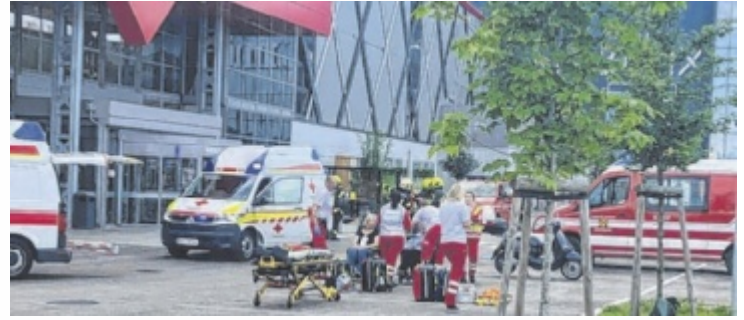
Alle Einsatzkräfte arbeiteten Hand in Hand zusammen.

WELS. In einer großangelegten Brandschutzübung am XXXLutz Standort in Wels, wurden sämtliche sicherheitsrelevanten Szenarien geprobt und durchgespielt. Simuliert wurde ein Brand auf dem Dach des Gebäudes, mehrere vermisste und verletzte Personen mussten gefunden, geborgen und erstversorgt werden.