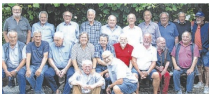
Vor über 60 Jahren haben sie gemeinsam die Schulbank gedrückt.

4600 Wels, Vogelweiderstraße 5 Mo bis Do: 9 bis 12 Uhr Tel.: 0664 6007215924 jugendservice-rohrbach@ooe.gv.at www.jugendservice.at