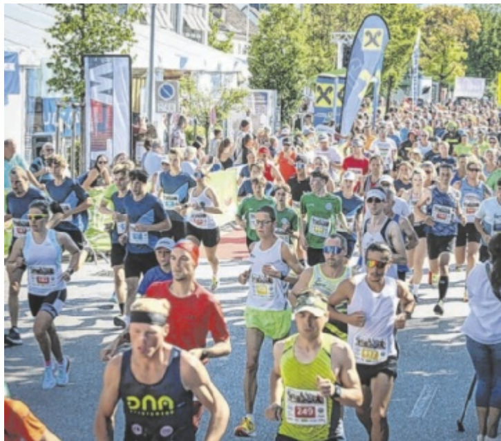
Und die Läufer machen sich wieder auf die Meilenjagd.

Um 12 Uhr fällt der Startschuss zum „young and fun“-Lauf für Kinder und Jugendliche bis 14 Jahre. Die Teilnahme ist kostenlos und die Anmeldung bis kurz