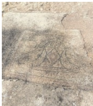
Gefunden Archäologen legten am Reinberg ein römisches Bodenmosaik frei. Weitere Arbeiten folgen. Seite 3 / Foto: Nowak