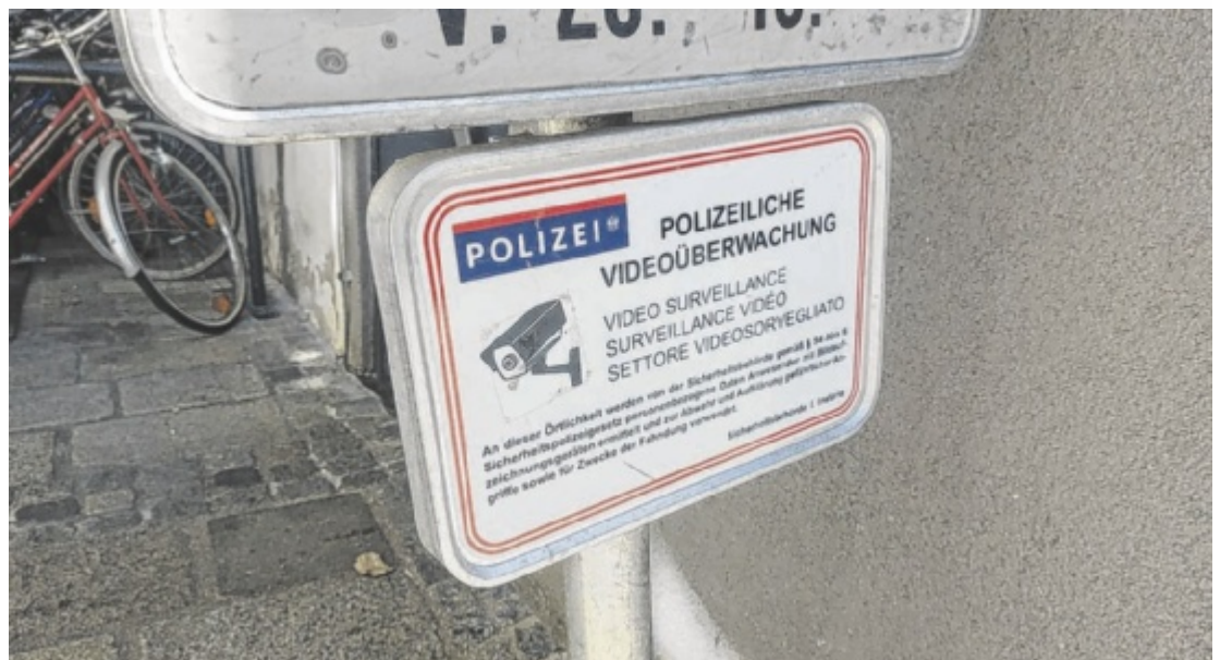
Ankündigung der Videoüberwachung in der Welser Innenstadt