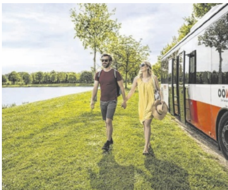
Mit Bus und Bahn zum See – Öffi-Fahrende ersparen sich Stau, Parkplatzsuche und Parkgebühren.

Rund um Linz bieten sich Pichlingersee und Oedter See für eine Ab-