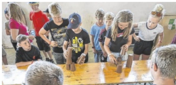
Geschicklichkeitsspiel bei der Lagerolympiade

Kraftwerk Traunleiten und einiges mehr. Der Samstag stand im Zeichen der Lagerolympiade und am Abend der beliebten Mini-Playback Show. Die Neukirchner setzten sich mit der EAV und „Heißen Nächte in Palermo“ durch. Danach feierten die Teilnehmer noch einmal. Der Sonntag startete mit der Feldmesse und endete mit dem wichtigen Zusammenräumen. ■