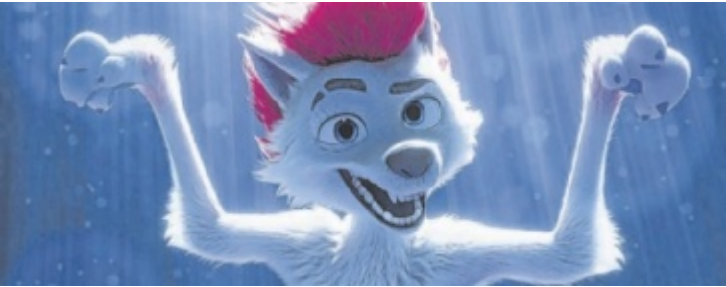
Pudel Freddy Lupin verwandelt sich plötzlich in einen Werwolf.

Ein Stempelpass mit Gewinnspiel, für Konsumation bei verschiedenen Vereinen, lässt die angebotenen Speisen und Getränke gleich noch einmal besser schmecken. Für den musikalischen Rahmen sorgt ab 18 Uhr der Musikverein Schleißheim. Um 21 Uhr treten dann The Legends auf. ■