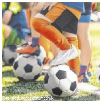
Bis 31. August kann man ab sofort für seinen Favoriten abstimmen.

Mit dem Ehrenamtspreis „Danke schön“ möchte das Sportland OÖ gemeinsam mit Tips, den OÖ Nachrichten, Life Radio und TV1 den vielen Ehrenamtlichen, die sich in Oberösterreich in den Sportvereinen mit viel Herzblut engagieren, Danke sagen. Während die Sportler selbst für ihre Leistungen im Vordergrund stehen, sind es die Funktionäre und Trainer, die hinter den Kulissen den Betrieb am Laufen halten.