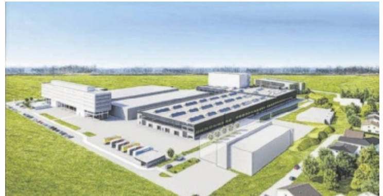
Rendering für die TGW Erweiterung

Man hat sich die Investition genau überlegt. „Von unseren weltweit 4.400 Mitarbeiter:innen arbeitet mehr als die Hälfte