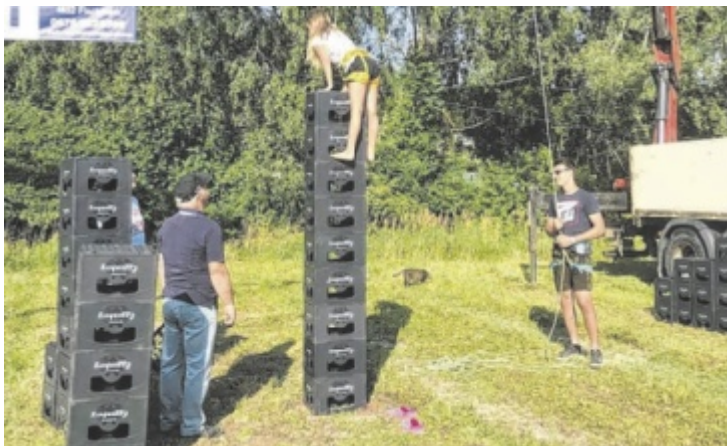
Wer möchte, kann sich im Bierkisten-Klettern versuchen.