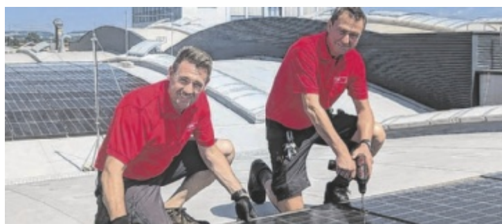
Die Hoval-Monteur haben die PV-Anlage in Eigenregie errichtet.

FP-Frauenreferentin Vizebürgermeisterin Christa Raggl-Mühlberger über den speziellen Tag: „Die österreichweiten Aktionen zum Equal Pension Day dienen zur Bewusstseinsbildung und sollen darauf aufmerksam machen, dass es auch bei den Pensionen noch große Differenzen zwischen den Geschlechtern gibt.“ ■