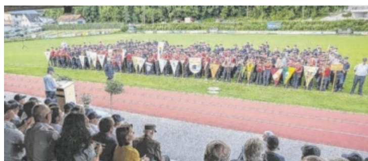
Aufstellung für die Eröffnung