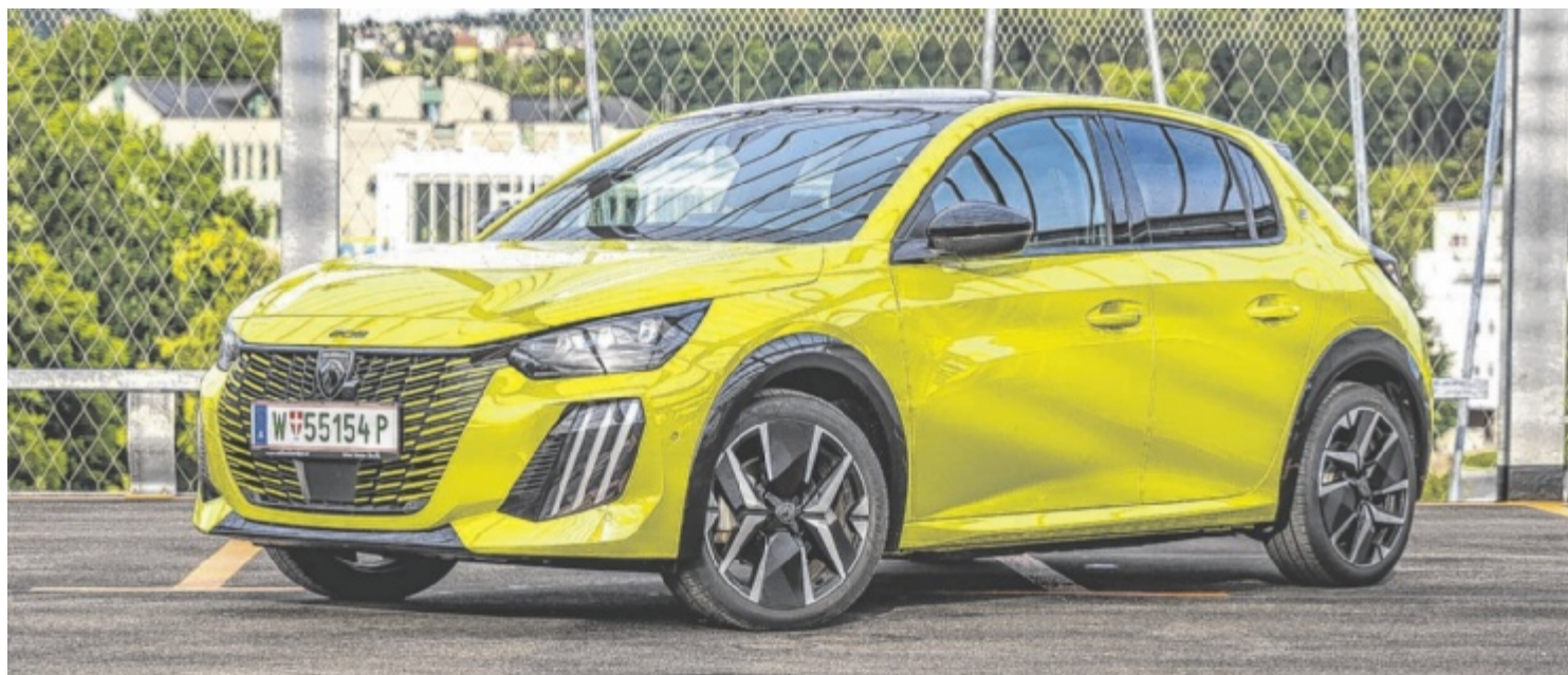
Der Peugeot e-208 GT ist ab 41.670 Euro zu haben.