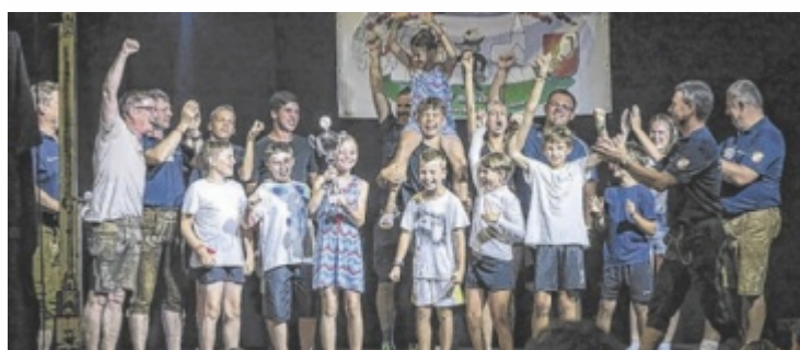
Neukirchen gewann die Mini-Playback-Show.