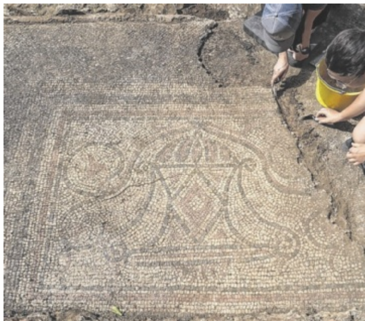
Akribisch wird am Mosaik gearbeitet.

Die Experten sprechen von einem Sensationsfund. Es ist das dritte Bodenmosaik, das in Oberösterreich entdeckt wurde. Es ist sehr gut erhalten und das konnten auch die Besucher beim Tag der offenen Grabung in Thalheim nebst Römerfest entdecken. Der Boden, den ein großes Gefäß innerhalb einer mehrfachen Um-