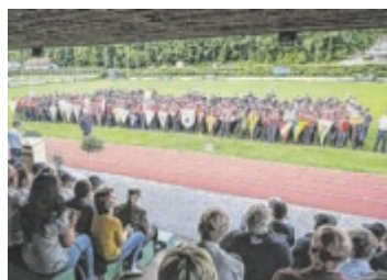
Lager Die Feuerwehrjugend der Region verbrachte vier erlebnisreiche und spannende Tage in Steinerkirchen. Seite 4

Es wird wieder diskutiert über die Welser Videoüberwachung. Die Freiheitlichen jubeln über Erfolge in der Verbrechensaufklärung und fordern weitere Autonomie vom Bund für die Aufstellung weiterer Kameras. Die Grünen sehen abenteuerliche Zusammenhänge, die hier konstruiert werden. Auch die SPÖ spart nicht mit Kritik an den Freiheitlichen. Seite 2