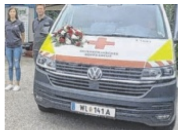
Gefeiert Zum 50-Jahr-Jubiläum bekam die Rot-Kreuz-Ortsstelle Marchtrenk ein neues Einsatzfahrzeug. Seite 4 / Foto: privat