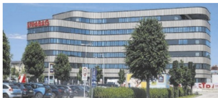
Das neue Konzernhaus der STRABAG in Linz gilt als Vorbild für das Bauen der Zukunft.