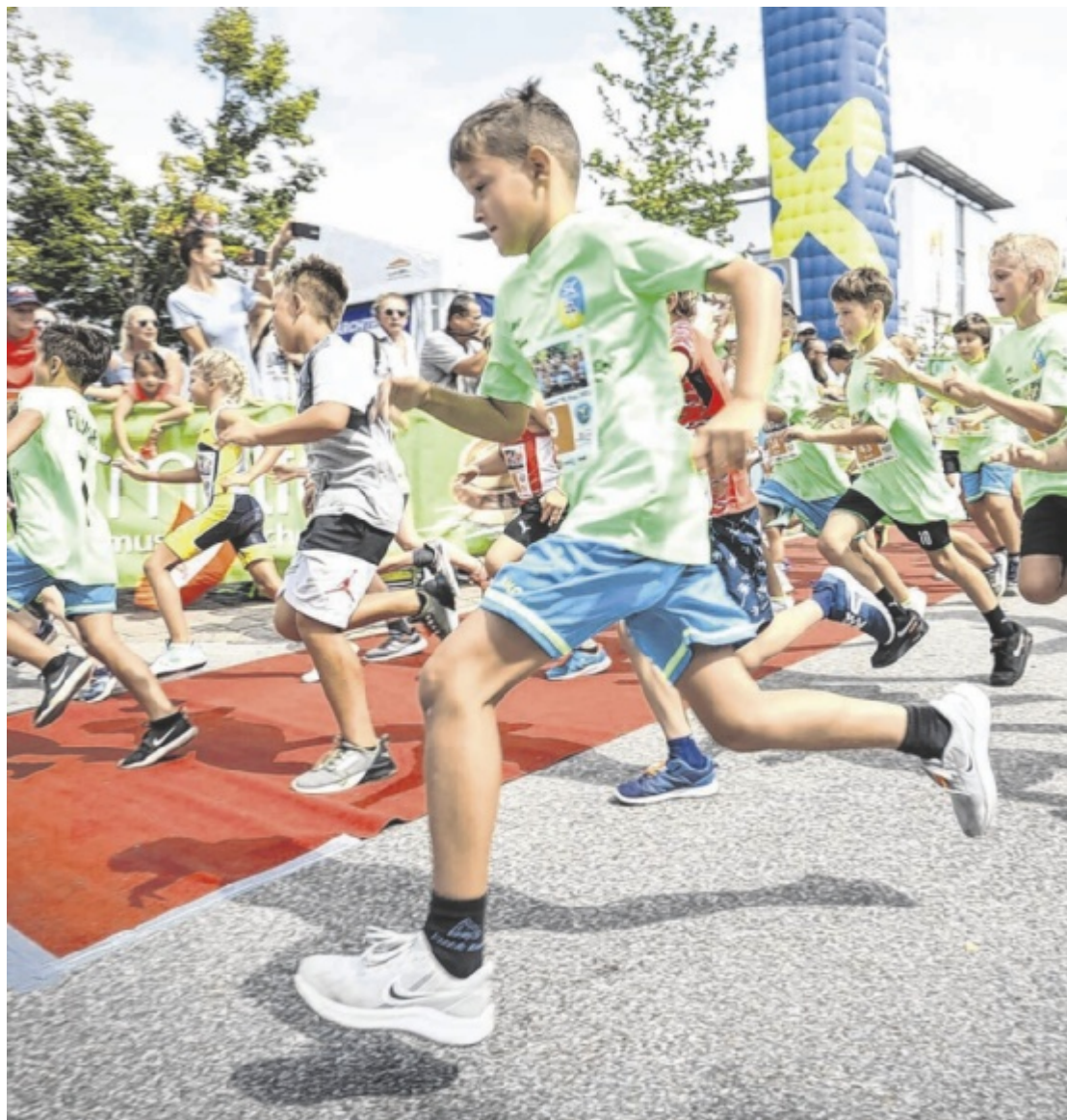
Laufsport Tips ist als Medienpartner am Donnerstag, 15. August, beim Marchtrenker Stadtgrandprix mit dabei. Nicht nur der Nachwuchs ist mit vollstem Einsatz unterwegs. Seite 16