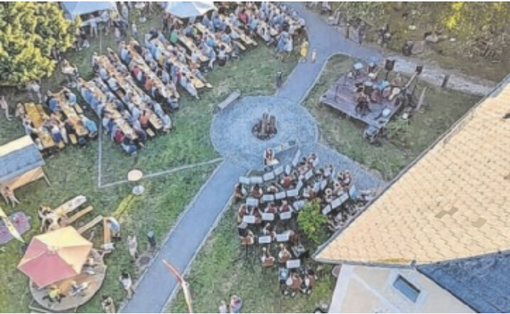
Auch das Fahrrad-Ringelspiel (vorne links) dreht wieder seine Runden.