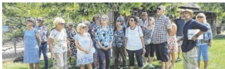
Der Pensionistenverband aus der Pernaubus erlebte einen tollen Ausflug.