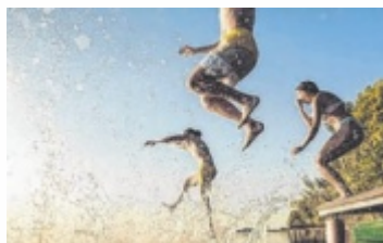
An heißen Sommertagen gilt: rein ins kühle Nass.

Seit dem Sommer 2009 ergänzt das Naturbad Woody's die Freizeitlandschaft in Neukirchen am Walde. Das Bad verfügt über eine Liegewiese sowie auch über Möglichkeiten zur Freizeitgestaltung abseits des kühlen Nass. Für kleine