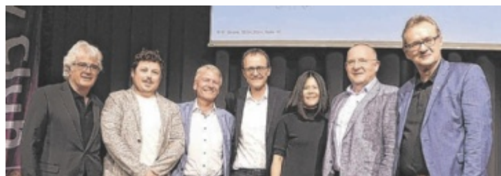
Der Rotary Club lud zum Diskussionsabend zum Thema KI.