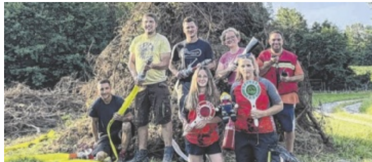
Die FF Affnang bereitet sich schon auf das heurige Waldfest vor.