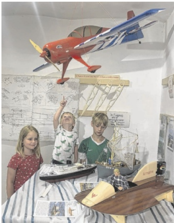
Im Museum im Schloss Starhemberg in Haag faszinieren die Miniaturen und Modellfahrzeuge vor allem die Kinder.

Eine Anlage des MBC Grieskirchen kann bespielt werden, was die Ausstellung vor allem für die Kinder besonders interessant macht.