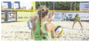
Der ASV St. Marienkirchen lädt zum Mostfassl-Cup ein.

ST. MARIENKIRCHEN. Bereits zum 17. Mal findet das Hobby-Beachvolleyballturnier am Freitag, 26., und Samstag, 27. Juli, am Samariner Center Court statt. Los geht es am Freitag um 15 Uhr mit dem flotten Dreier, also drei gegen drei. Am Samstag findet ab 9.30 Uhr der „4 gegen 4 Mixed“-Hauptbewerb statt. Abends nach den Finalrunden gibt es die Open-Air-Party samt Bar-Betrieb. Für das leibliche Wohl sorgen die ASV St.Marienkirchen Volleyballer. ■