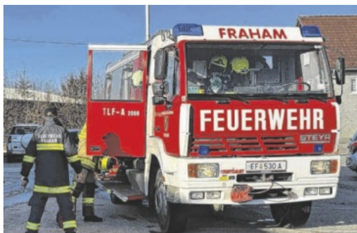
Im nächsten Jahr feiert die FF Fraham ihr 130-jähriges Jubiläum.