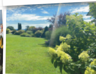
Andrea aus Vöcklabruck