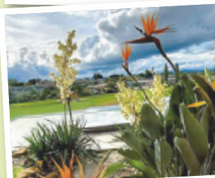
Lisa aus Vöcklabruck