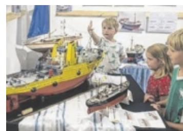
Kleine Welt Im Schloss Starhemberg in Haag sind Modelle von Schiffen, Bahnen und Flugzeugen zu sehen. Seite 10

In der Furthmühle in Pram sind es diesmal zwei Fotografen, die sich bei ihrer Arbeit über die Schulter schauen lassen. >> Seite 27