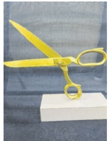
Mit der Trophäe wurde Markus Stadler für seinen Einsatz geehrt.

Im Jahr 2025 gibt es bei der FF Fraham gleich mehrere Gründe zu feiern. Das 130-jährige Jubiläum der Feuerwehr steht an. Passend dazu wird von 13. bis 15. Juni 2025 ein großes, dreitägiges Fest gefeiert. Zudem wird das neue Feuerwehrzeughaus eingeweiht, das unter anderem viel Platz für das neu angeschaffte Tanklöschfahrzeug bietet. ■