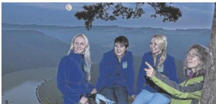
Im Sommer kann man im Mondschein wandern.