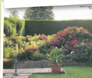
Erika aus Grieskirchen