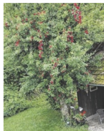
Riki Meyr aus Scharten genießt den Sommer unterm Rosenbirnbaum.