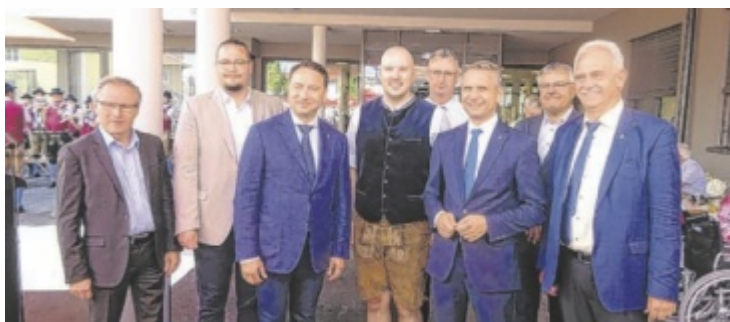
Feierliche Eröffnung des Alten- und Pflegeheimes Waizenkirchen mit viel Prominenz