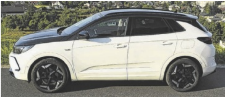
Der Opel Grandland GSe Plug-in-Hybrid 300

Erste Bilder und Zahlen gibt es vom neuen Modell bereits. So wird es den Grandland erstmals auch als rein elektrisches Modell geben, von einer Reichweite bis zu 700 Kilometern ist die Rede. Vorfreude scheint angebracht, freilich nicht auf Kosten des Moments. Zumindest, wenn der Moment ein 300 PS starkes Plug-in-Hybrid-SUV ist und auf den klingenden Namen „GSe“ hört. Der Grandland setzt auf die heilige Dreifaltigkeit aus Knöpfen, Reglern und Schaltern, mit dem zentral liegenden 10“-Touchscreen als digitalem Zentrum. Da kann man nur hoffen, dass sein Nachfolger an dem Punkt nicht zu