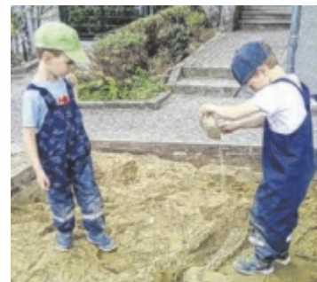
Im Kindergarten in Pötting wurde im Sand ein Klärwerk nachgebaut.

Die Kinder führten verschiedene Experimente zur Fließrichtung oder Oberflächenspannung von Wasser durch und bauten im Sand ein Klärwerk nach. Die Abwasserexpertin der Unternehmensgruppe VTA aus Rottenbach Denise Mayr erklärte den Wasserkreislauf, machte mit den Kindern Experimente mit verschlammtem Wasser und beantwortete ihre zahlreichen Fragen. Außerdem durften die Kinder durch ein Mikroskop schauen und unter anderem Bärtierchen beobachten. „Aufgrund der Begeisterung für das Mikroskop haben wir uns nun selbst ein