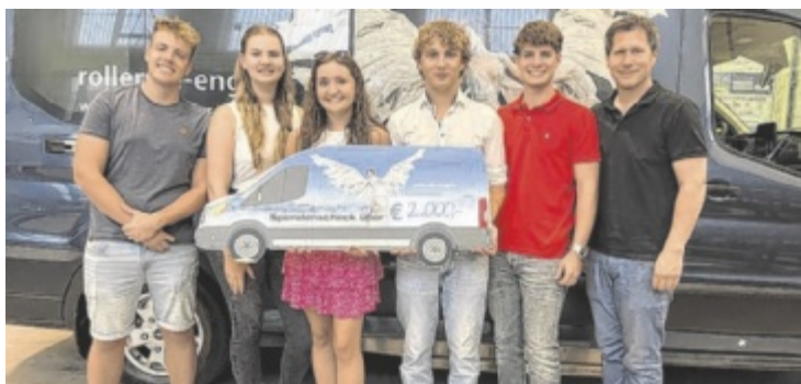
Die Dachsberger Maturanten übergaben 2.000 Euro von den Maturaballeinnahmen im letzten Jahr an den Verein „Rollende Engel“.