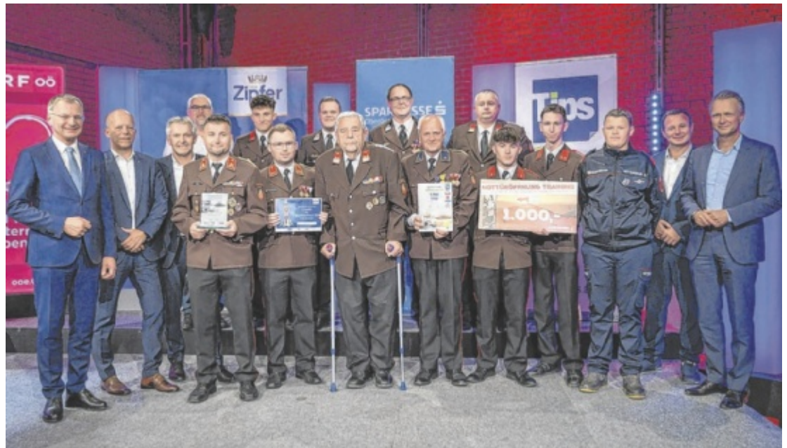
Die Freiwillige Feuerwehr Fraham freut sich über den verdienten ersten Platz.

Nach gewissenhafter Recherche und Kontrolle von abgegebenen Schachteln, Boxen und Kuverts konnte der Fehler ausgeforscht werden. Einige korrekt abgegebene und ausgefüllte Stimmzettel wurden bei der Zählung unbeabsichtigt nicht berücksichtigt. Nachdem die zusätzlichen Stimmen addiert wurden, ergibt sich ein neues Ergebnis, das zwei