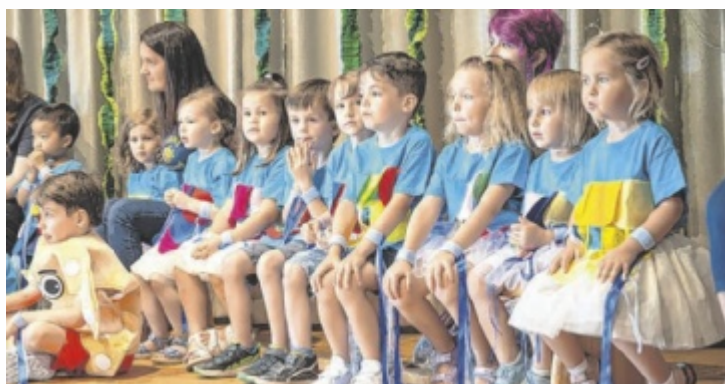
Großer Applaus für die Kleinsten: Zum 30-Jahr-Jubiläum des Klinikum-Betriebskindergartens stand der Mitarbeiternachwuchs im Rampenlicht.

WELS/GRIESKIRCHEN. Beim Sommerfest des Betriebskindergartens am Klinikum Wels-Grieskirchen wurde das 30-Jahr-Jubiläum gefeiert. Rund 270 Gratulanten begingen „den Runden“ mit einem bunten Unterhaltungsprogramm. Unter den Festbesuchern waren 85 Kinder mit ihren Geschwistern und Familien sowie zahlreiche Ehrengäste, unter anderem aus der Provinzleitung der Kreuzschwestern Europa Mitte sowie