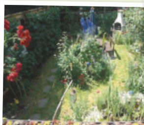
Reinhold aus Vöcklabruck