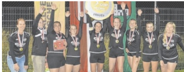
FBV Grieskirchen Damen holen sich Cup-Sieg.

Im Finalspiel lieferten sie den zahlreichen Zusehern im FBZ Grieskirchen eine spannende Show. Vöcklabruck muss nach dem verletzungsbedingten Ausfall einer Spielerin zu viert antreten, die präzisen und scharfen Service-Angriffe waren aber eine Herausforderung für die Gries-