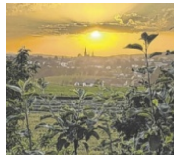
Elke Maria Weißenböck lässt Leser mit diesem Foto an ihrem Ausflug nach Bad Leonfelden teilhaben.