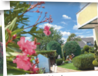
Friederike aus Vöcklabruck

Mitmachen & abstimmen auf tips.at/garten