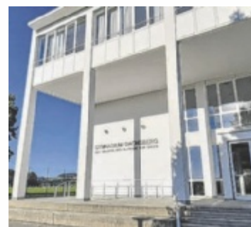
Ein ereignisreiches Schuljahr in Dachsberg ist zu Ende.