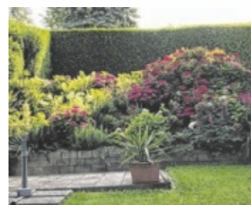
Erika Egger aus Grieskirchen zeigt ihren schönsten Platz im Garten.

EFERDING/GRIESKIRCHEN. Es grünt so grün – und zwar in den Gärten und Ausflugszielen der Tips-Leser. Das Motto für die nächste Leserfoto-Ausgabe ist „Unwetter“. Wer gerne fotografiert, kann sein Foto mit Bezug zu Blitz, Donner, Regen oder Hochwasser mit dem Betreff „Leserfoto“ und einer kurzen Geschichte an Redakteurin Tanja Auer (t.auer@tips.at) senden. ■