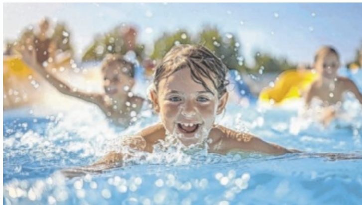
Auch wenn es in den heimischen Freibädern nur geringe Preiserhöhungen gab, ein Vergleich lohnt sich trotzdem.

Es gibt aber teilweise große Preisunterschiede bei den Tageskarten. Die günstigste Tageskarte für Erwachsene in den im Bezirk Grieskirchen erhobenen Bädern kostet 3,60 Euro, die teuerste 6 Euro. Die günstigste Kin-