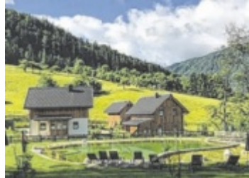
Eine unendliche Liste an (Natur-)Aktivitäten direkt vor der „eigenen“ Haustür, mitten im Dorf

Eine Holz- und Kreativwerkstatt, einen Sportplatz, ein traditionelles Wirtshaus mit wunderbarer Küche und mehr umfasst das Narzissendorf Zloam. Gleich ein ganzes Feriendorf, bestehend aus Häusern im typischen Ausseer Stil, vervollständigt diese eigene kleine Welt über dem Grundlsee. Wer hier urlaubt, entscheidet sich zwischen einem eigenen Haus oder einem Apartment, muss sich, was die Freizeitgestaltung angeht, aber keineswegs festlegen: Der Tag beginnt mit einem Sprung in den Badeteich im Herzen des Dorfs, nimmt seinen Verlauf bei einer Vielzahl an Freizeitaktivitäten wie Reiten, Bogenschießen am 3-D-Parcours, Schatzsuche im