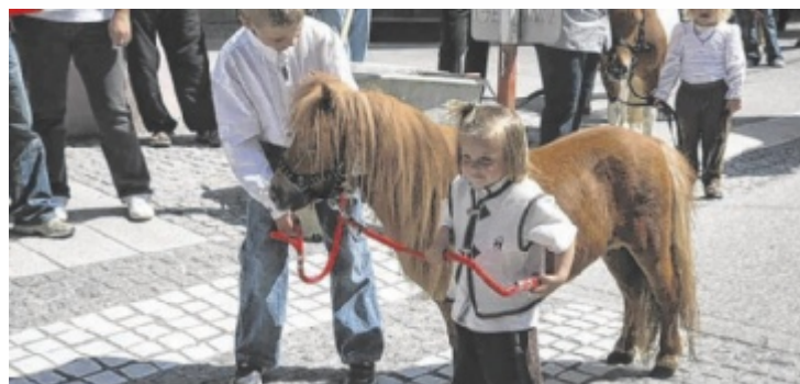
Züchter aller Altersgruppen sind beim Pferdemarkt willkommen.

FIRST CLASS KINO FÜR EINE FIRST CLASS ZEIT.