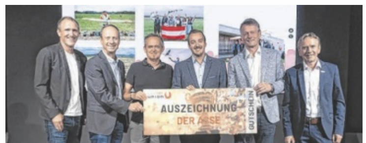
Ehrung für die Union Meggenhofen