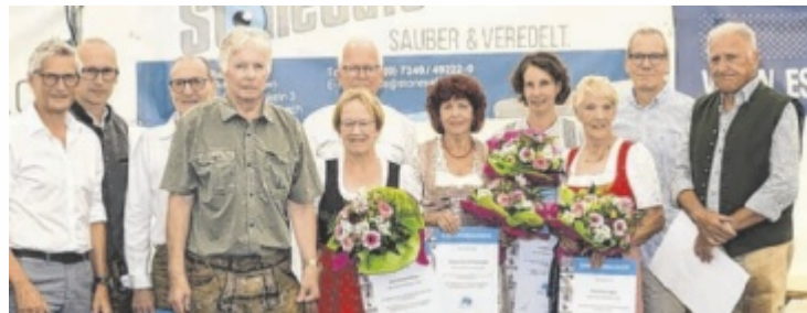
Die geehrten Funktionäre und Mitglieder des ÖTB Turnverein Bad Schallerbach bei der 100-Jahr-Feier

Die Jubiläumsfeier startete mit einem Programm für die Jungen und Junggebliebenen. DJ Kinimod heizte der Jugend bei großartiger Stimmung gehörig ein. Den zweiten Festtag startete man mit einem Festtag. Nachmittags wurden die Spielstraße, die Hüpfburg, das Kinderschminken sowie das Bullenreiten und der Wasserpark ausgiebig von den Gästen genutzt. Am frühen Abend unterhielt die Vereinsjugend das Publikum mit einer 100-Jahr-Show, bevor die Austro-Pop-Band Zaumgspüt die Bühne rockte. In einer Pause zeigte die Leistungsriege 13+ ihr Können