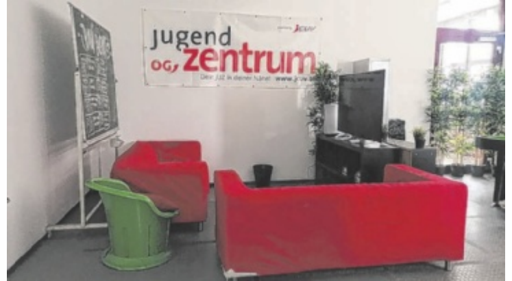
Das Eferdinger Jugendzentrum ist ein Angebot für die Jugendlichen der umliegenden Gemeinden.