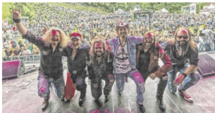
Sergeant Steel tritt in Stroheim auf.