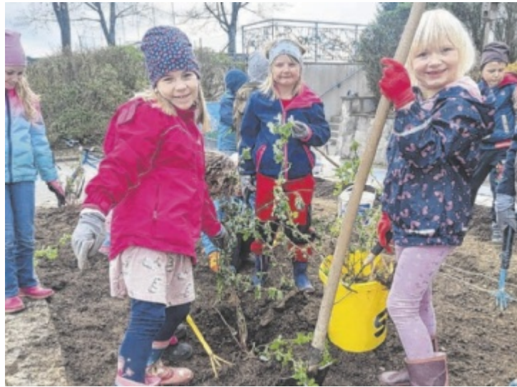
Die Schüler, Lehrer und der Elternverein der Volksschule Bruck haben einen Beeren-Naschgarten bei der Schule angelegt.

Das Peuerbacher Bauhof-Team hat bei den notwendigen Bodenbearbeitung geholfen. Die Firma Hildebrandt stellte den Kompost für den Aufbau des Beetes zur Verfügung. Der Elternverein