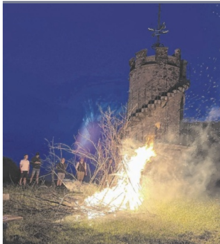
Bezirkssonnwendfeier am Mayrhoferberg Die Freiheitlichen der Bezirke Grieskirchen und Eferding feierten mit dem traditionellen Sonnwendfeuer bei der Aussichtswarte am Mayrhoferberg in Stroheim die Sommersonnenwende. EU-Parlamentsmitglied Roman Haider hielt die Feuerrede.

790.000 Euro wird die Erneuerung kosten. Man hat mit den Arbeiten bereits begonnen, diese werden bis Mitte September abgeschlossen sein. ■