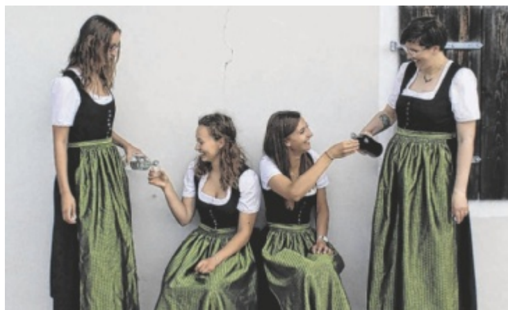
Der Musikverein St. Thomas lädt zum Sommerfest.

Danach sorgt der Musikverein St. Thomas selbst für Unterhaltung. Der Frühschoppen am Sonntag beginnt um 10.30 Uhr. Musikalisch umrahmt wird dieser vom Musikverein Natternbach. Bei Schlechtwetter findet das Fest in der Mehrzweckhalle der Gemeinde St. Thomas statt. ■