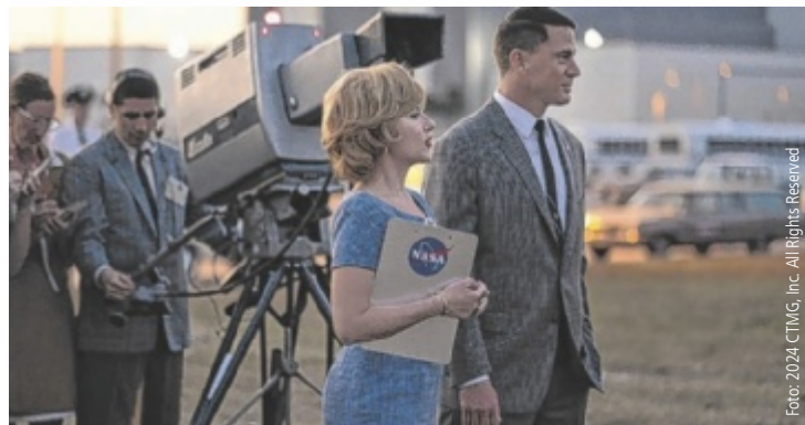
Scarlett Johansson und Channing Tatum spielen in der romantischen Komödie.

Alle Infos, Teilnahmebedingungen und einreichen/voten unter www.youngatart.at ; bis zu drei Werke pro Teilnehmer können eingereicht werden, bis 3. November.