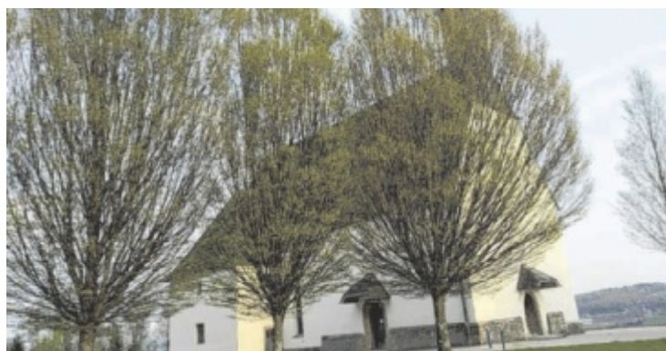
Die Kirche am Magdalenaberg ist ein Juwel der Gemeinde.

von der legendenumwobenen Entstehung wird zu hören sein. In der sakralen Atmosphäre erklingen an diesem geschichtsträchtigen Ort in den Sommermonaten alljährlich auch Musik und Texte in der Abendmusik. Der nächste Termin ist am 28. Juli. Was dort zu hören ist, kann man rechtzeitig auf www.abendmusik.at erfahren. ■