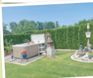
Anni aus Wels