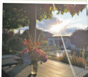
Patrizia aus Vöcklabruck