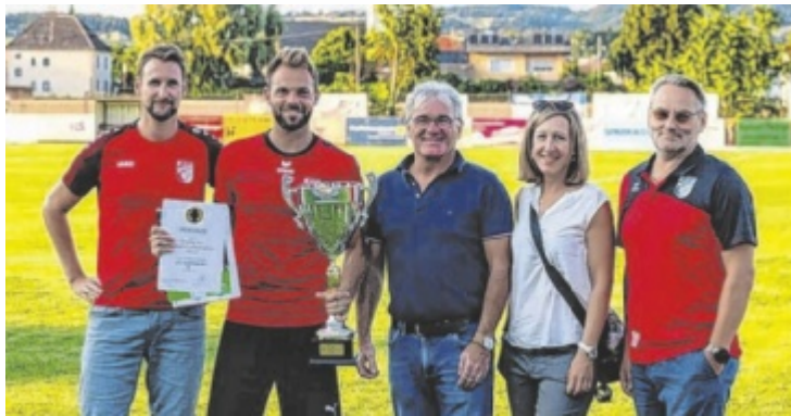
2023 holte sich der UFC Raika Hartkirchen den Trophy-Sieg.

schaften der Vereine UFC Eferding, ASKÖ Eferding/Fr., UFC Haibach/D., SK Kleinzell, Union Lembach und UFC Hartkirchen gegeneinander an. Am Sonntag gibt es ab 9 Uhr ein Nachwuchsturnier für die U8-, U9-, U10- und U11-Mannschaften. ■