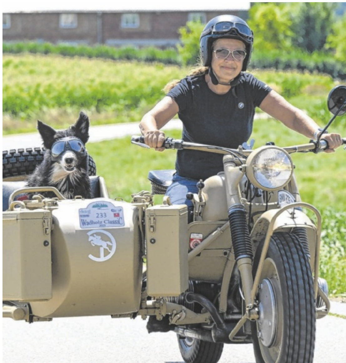
Oldtimer Rund 800 restaurierte Gefährte werden am Sonntag, 21. Juli, beim „Wadholz Classic“ durch das Hausruckviertel düsen. Für die Zuschauerbewirtung sorgen die Unterstettener Florianis. Seite 30 / Foto: Albert Mikovits, pictureshooting.at