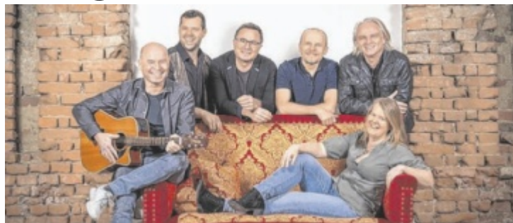
Die Band „Zaumgspüt“ kommt nach Tegernbach.

So gibt es Erlesenes aus Österreich am Donnerstag, 25. Juli (20 Uhr), von der Formation „Zaumgspüt“ zu hören. Die Leidenschaft der sechs Bandmitglieder aus der Region gehört dem Austropop. Mit den Nummern von Georg Danzer, STS, Bär, Hirsch oder Rainhard Fendrich bis hin zu Pizzera und Jaus