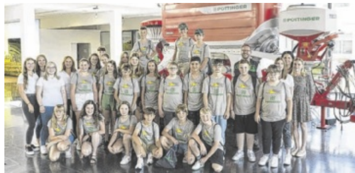
Spannende Betriebsbesuche für die Schüler der Mittelschule Hofkirchen