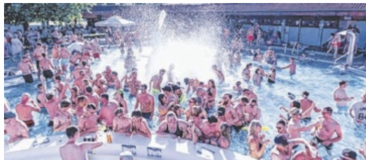
Das Freibad beschert kühlende Getränke und heiße Rhythmen.

Mit einer Unterwasser-Tanzfläche und einer eigens angefertigten Poolbar geht die „Wild Summer“-Party im Freibad Eferding in die nächste Runde. Auf die Gäste warten zudem eine Chill-out-Zone sowie eine Spiele-Zone, in der man sich beim „Beer Pong“ beweisen kann. Das Beste daran: Die gesamten Einnahmen kommen in Not befindlichen Menschen zugute. Gefeierte wird damit also zu 100 Prozent für den guten Zweck. Zugang zur Veranstaltung gibt es ab