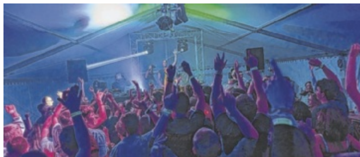
Beim Hoazing Zeltfest wird die Tanzfläche zum Beben gebracht.

Den Auftakt in das Festwochenende macht am Freitag, 9. August, das DJ-Duo 2:tages:bart gemeinsam mit DJ Kinimod. Sie werden die Tanzfläche bis in die frühen Morgenstunden zum Beben bringen. Am Samstag, 10. August, geht es im Hauptzelt mit den Partyhirschen weiter, die für ausgelassene Stimmung sorgen. Im Discozelt sorgt abermals DJ Kinimod, diesmal gemeinsam mit DJ Yon, für heiße Beats. Das Hoazing Festivalwochenende wird auch heuer tra-