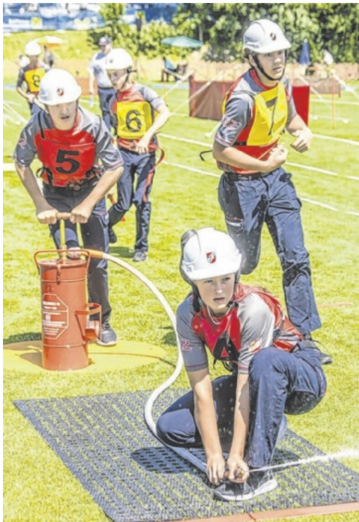
Auch 749 Jugendgruppen sind angetreten.