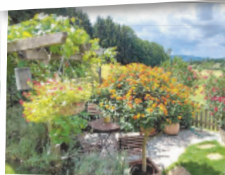
Roswitha aus Vöcklabruck