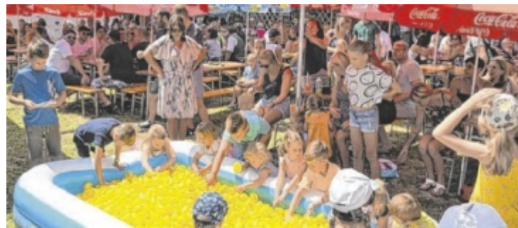
Beim gemütlichen Teichfest werden auch jede Menge Plastikentchen um die Wette schwimmen.

Natternbach: Kegeln in Neumarkt; Abfahrt Feuerwehrparkplatz, 13.30, VA: Seniorenbund.