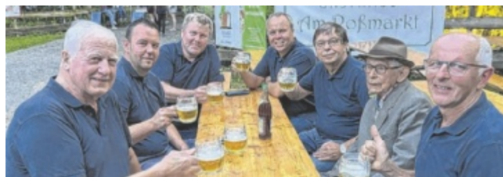
Die Feuerwehrler freuen sich auf zahlreiche Gäste.

beim Nachbarschafts-Dämmerchoppen in Breitenbach 27 auf. Am Samstag, 20. Juli (ab 16 Uhr), sorgt RestGluat beim Marktfest in Natternbach für die gute Stimmung. Ihr Repertoire ist breit gefächert. Austropop und Schlager werden genauso gespielt wie Country und Oldies. ■