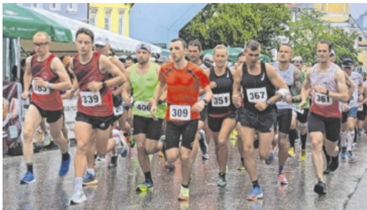
Am steilsten Marktplatz Oberösterreichs wird gestartet.