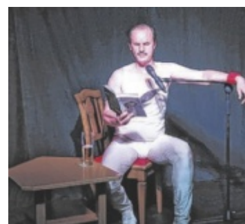
Austrofred gibt eine Lesung mit Konzert in Waizenkirchen.

Mitspielen bis 12.07.2024/10:00 Uhr www.tips.at/g/23782 oder SMS an 0676 8002525 Text: „23782 Vorname Nachname“