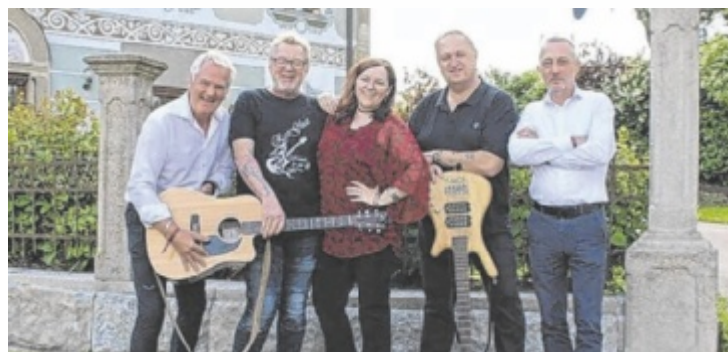
Die Gruppe RestGluat spielt beim Dämmerchoppen in Breitenbach.