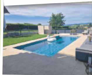
Wolfgang aus Grieskirchen