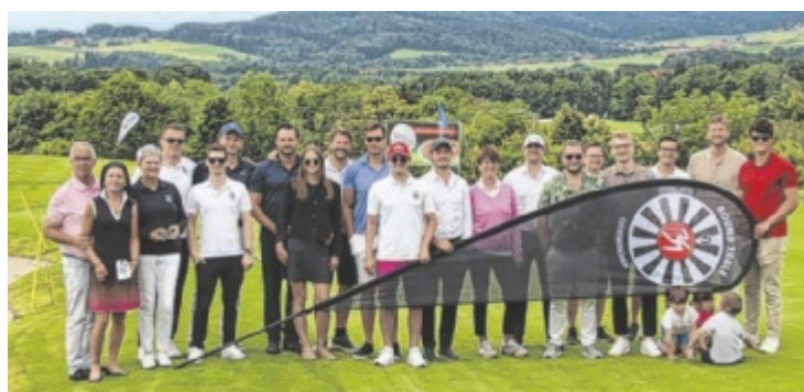
Die Sieger des Charity-Golfturniers 2024