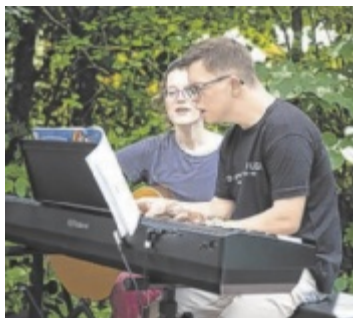
Beim Sommerfest des Instituts Hartheim wurde musiziert.