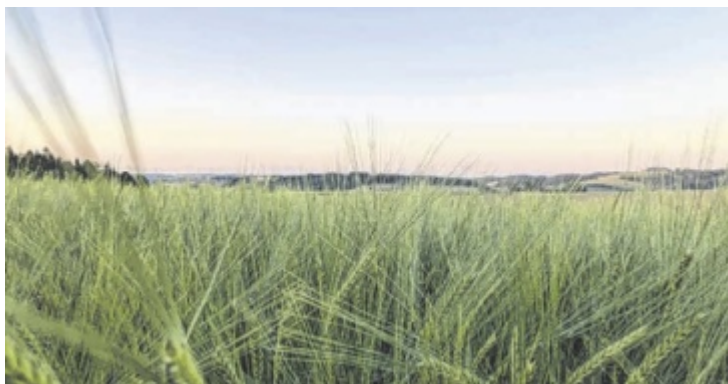
Michael Reisinger fotografierte diese malerische Kulisse in Eschenau.