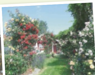
Ingeborg aus Grieskirchen