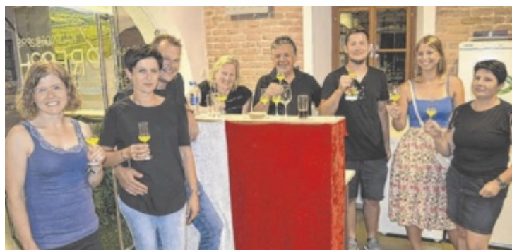
Veranstalter und Publikum haben den italienischen Abend im Presshaus in Meggenhofen genossen.

richte. Auf der Speisekarte waren unter anderem Antipasti und Pasta zu finden. Die Pizzen wurden von einem jungen Team an Meggenhofenern direkt vor Ort zubereitet und konnten so den Gästen ofenfrisch serviert werden. Nicht fehlen durften auch italienische Nachspeisen und selbstverständlich die Italo-Bar. ■