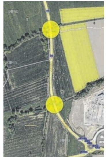
Die B137 in St. Georgen wird aufgrund der Brückenerneuerungen bis September gesperrt.