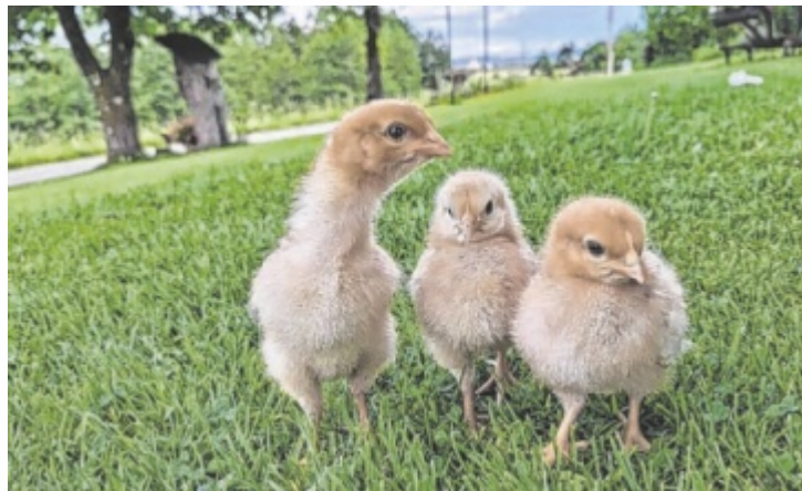
Auf Erkundungstour befinden sich die Küken von Felix Webinger aus Hartkirchen.