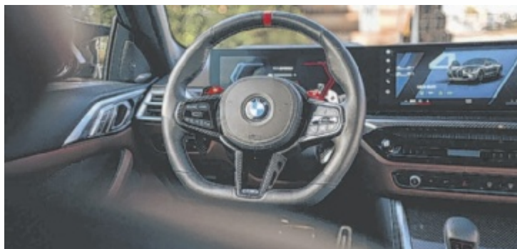
Qualitativ hochwertiges, perfekt verarbeitetes Interieur

Der M4 Competition Coupé xDrive startet bei 130.298,40 Euro. Der wunderbare Reihensechszylinder aus dem BMW Group Werk in Steyr leistet jetzt 530 PS, das maximale Drehmoment von 650 Newtonmetern blieb gleich, ist aber über ein breiteres Drehzahlband vorhanden. Damit geht es in 3,7 Sekunden von 0 auf 100 km/h, und wer jetzt sagt, das können E-Autos