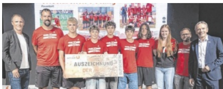
Ehrung für die UFG Grieskirchen-Pötting