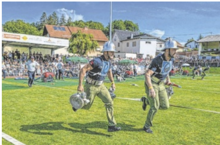
1.086 Feuerwehr-Aktivgruppen haben sich im Aufbau einer Löschleitung in Peuerbach gemessen.

Die Qualifikation haben aus Grieskirchner Sicht folgende Bewerbungsgruppen geschafft: Bronze Damen: Unterstetten 2; Bronze A Herren: Weeg 2, Unterstetten 1;