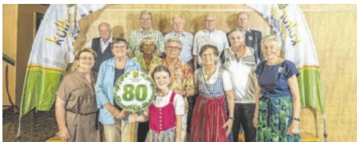
Gratulationen zum runden Geburtstag an den Jahrgang 1944