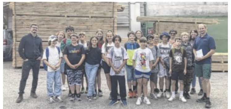
Kein Holzweg, aber eine interessante Exkursion für die 1A-Klasse