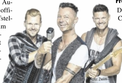
„Zwirn“ spielt zum Wiesn-Start am 14. August auf.

Die erste „Freistädter Wiesn-Challenge“, ein anspruchsvoller Sportbewerb aus sechs Disziplinen, findet am Samstag, 17. August in und rund um Freistadt statt. Start (13 Uhr) und Ziel (ab ca. 15.30 Uhr) sind am Messegelände. Mehr Infos zum Programm online: www.messe-muehlviertel.at ■