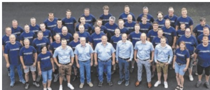
Die Haunschmidt-Belegschaft feierte 50-Jahr-Jubiläum.