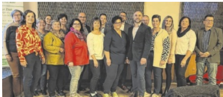
Generalversammlung des SMB Lasberg

Zur Untersuchung der Fledermausaktivitäten wird in circa 114 Metern Höhe ein sogenannter Batcorder installiert, der mittels Liftsystem ausgelesen werden kann. So sammelt die Anlage gleichzeitig Daten, die für die ökologische Beurteilung des Maststandortes am Schiffberg wichtig sind. ■