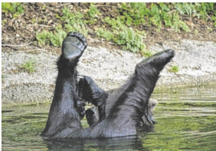
Bärig ist's im Wasser!