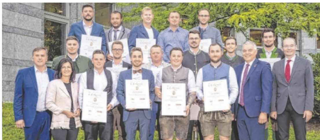
Die 20 neuen diplomierten Holzbau-Meister