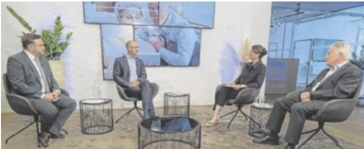
Expertentipps für Oberösterreichs Senioren – jeden Sonntag im Juli, jeweils ab 18 Uhr

LT1 informiert OÖ täglich Aktuelle Infos, Reportagen und Hintergründe. Täglich neu ab 18 Uhr. Jeder Oberösterreicher kann LT1 empfangen – via Satellit, Kabel, DVB-T, A1 TV und simpliTV.