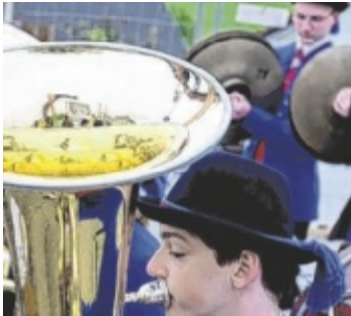
Auch die Jungmusiker haben beim Dorffest ihren Auftritt.

Im Anschluss wird die „Schönauer Böhmisches“ für Stimmung am Kirchenplatz sorgen. Das Repertoire reicht dabei von traditioneller Blasmusik bis zu Rock- und poppigen Partyhits. Dabei gibt es natürlich auch kulinarische Köstlichkeiten.