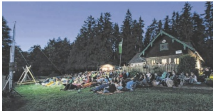
Schöner schauen: Das Sommerkino am Braunberg ist schon Kult.