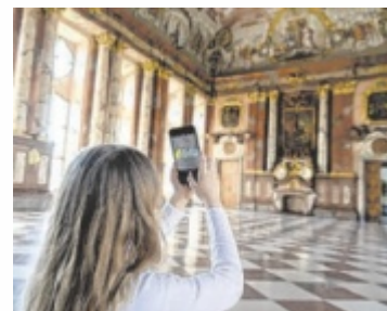
Auch mit der App hublz lässt sich Bruckner spielerisch entdecken.

Jeder Sonntag ist Suuuperkulturfamilien-sonntag! Dann wird von 13 bis 16 Uhr ein buntes Programm geboten. Kinder und ihre Begleitpersonen können spielerisch den Ho-