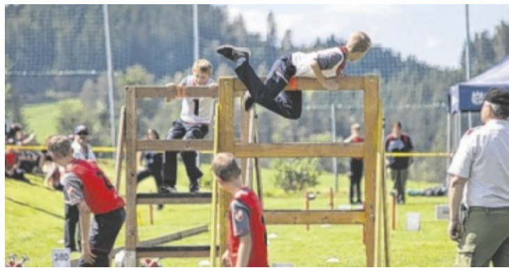
Die Feuerwehrjugend ließ in den Bewerbungen nichts anbrennen.