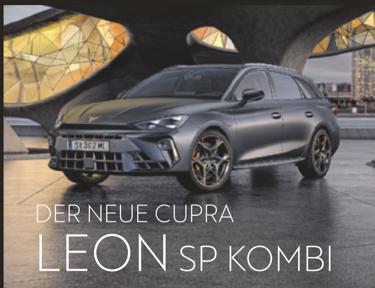
DER NEUE CUPRA LEON SP KOMBI