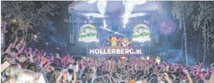
Am Hollerbergfest ist für jeden Musikgeschmack was dabei. Das Maskottchenpaar „Horni & Hornisse“ freuen sich schon auf das Fest.

Am Freitag wird die Austropop-Band Auf A Wort mit ihren Hits sowie die Mitternachtseinlage der Partyband BÄÄM auf der Hofwiese zum Tanzen einladen. Wie im