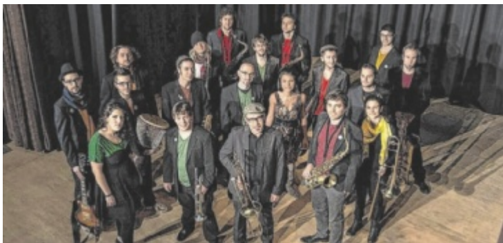
Das North East Ska Jazz Orchestra tritt in Freistadt auf.

Zu sehen ist die Ausstellung noch bis 27. Oktober, Di. bis So. 9 bis 18 Uhr. Alle Infos, Programmpunkte, Ermäßigungen und vieles mehr auf anton-bruckner-2024.at