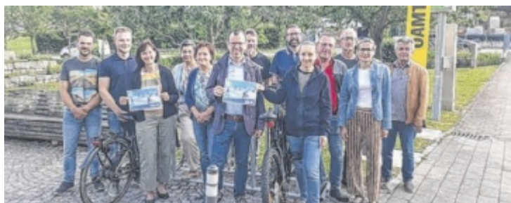
Auch der Gemeinderat fährt Rad.

4240 Freistadt, Pfarrgasse 9, Mo bis Do: 14 bis 17 Uhr Tel: 0664 6007215912 jugendservice-freistadt@ooe.gv.at www.jugendservice.at