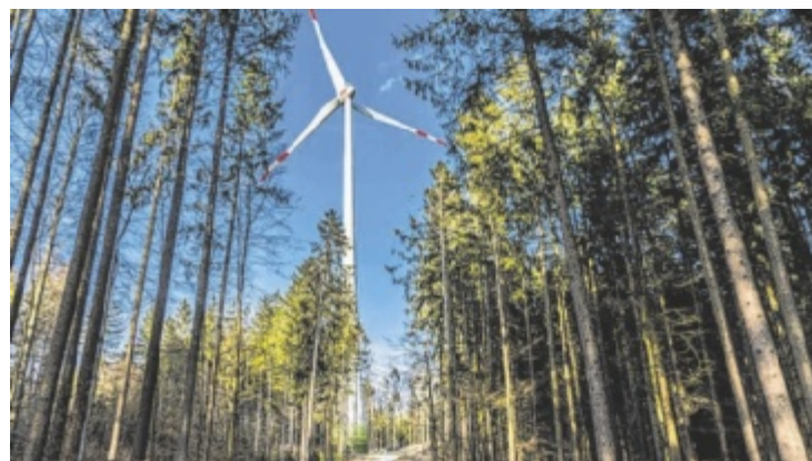
Das Thema Windkraft scheidet die Geister.