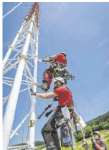
Die Arbeit am Mast verlangte den Monteuren der Firma Windhunters einiges ab.