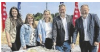
v.l.: Abordnung aus OÖ beim Spatenstich