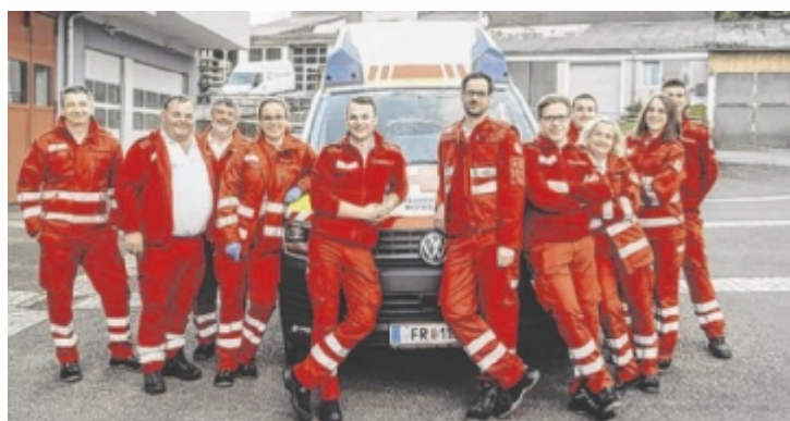
Das Rot Kreuz-Team freut sich auf viele Frühschoppengäste.