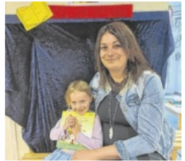
Die Kindergartenkinder luden zum Vorleseprojekt ein.

Dass Vorlesen sehr viele positive Eigenschaften hat, weiß man schon lange. Oft gerät das Medium Buch ein bisschen in Vergessenheit. Das Team des Kindergartens hat sich deshalb in diesem Jahr das Thema Vorlesen auf die Fahnen geheftet. Schon seit Dezember beschäftigen sich die Windhaager Kindergartenkinder mit dem Thema Vorlesen. Jedes Kind durfte sich im Adventkalender eine eigene Vorlesegeschichte aussuchen, die es dann exklusiv von seiner selbstgewählten Pädagogin oder Assistentkraft vorgelesen bekam. Auch der Fasching und die