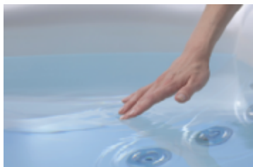
Gesundheitstipp für Haut und Haare: Salzwasser

schonend gereinigt wird, all das bei niedrigstem Strom- und Wasserverbrauch. Jetzt von der Hitze und dem besten Preis des Jahres profitieren bei der Temperaturwette. Schnell sein, die Aktion gilt nur für die ersten 99 Whirlpool-Käufer!