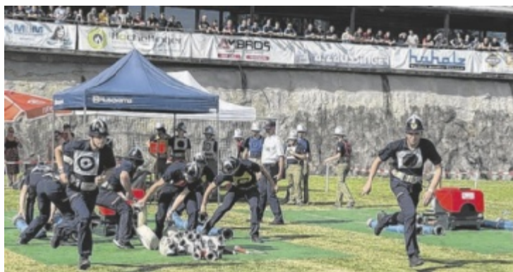
Die Bewertungsgruppen gaben in Tragwein trotz 35 Grad alles.

In der Jugend Bezirksliga siegte Erdleiten 1 vor Hinterberg 1 und Tragwein 1. Bezirkssieger Jugend 1. Klasse wurde Selker-Neustadt 1 vor Liebenstein 1 und Schwandt-Freudenthal 1. Be-