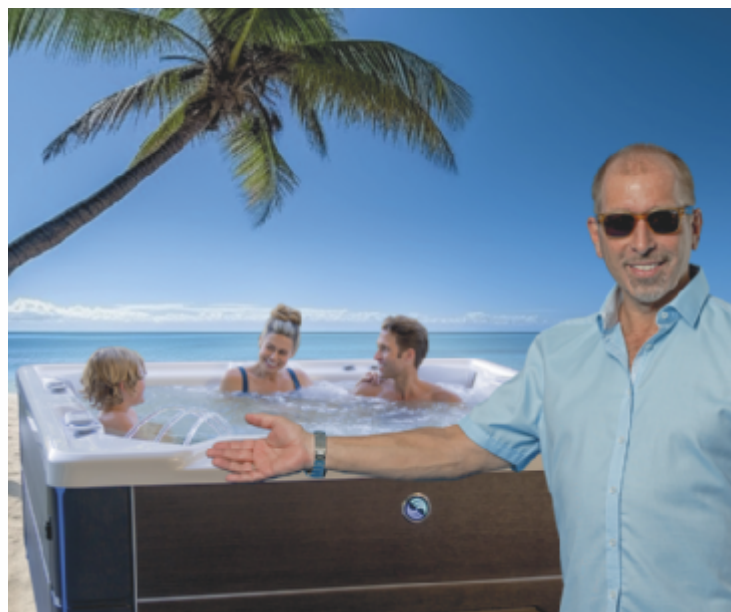
Alexander Bösl: „Eine krisensichere Whirlpool-Oase daheim ist für Lebensgefühl und Gesundheit Gold wert und garantiert Urlaubssicherheit für die ganze Familie! Mit 33% Rabatt ist schon jetzt der beste Preis des Jahres garantiert. Es wird sicher mehr. Wetten?“

rantiert man bei HotSpring, dass die höchste Temperatur (°C), gemessen an der hohen Warte, den Preisnachlass bestimmt. Steigt die Temperatur, steigt der Rabatt. Millionen Menschen auf der ganzen Welt schwören auf HotSpring und holen sich die intelligente Alternative zum herkömmlichen Schwimmbad, Spaß und Entspannung ins eigene Zuhause. Dabei ist HotSpring besonders bekannt für die patentierte MotoMassage DX und das revolutionäre Salzwasser-Pflegesystem. Als einziger Whirlpool-Hersteller ist es HotSpring gelungen, einen Weg zu finden, die Salzwasserpflege so einfach wie möglich zu gestalten - mit dem einzigartigen FreshWater IQ® System. Dieses hochmoderne Wasser Monitoring System definiert die Wasserpflege neu - es testet, reinigt und gibt Empfehlungen ganz automatisch. Das Resultat: kristallklares Wasser per Knopfdruck - die manuelle Beigabe von Chlortabletten war gestern. Man erhält kristallklares, leicht salzhaltiges Wasser, das besonders umwelt-