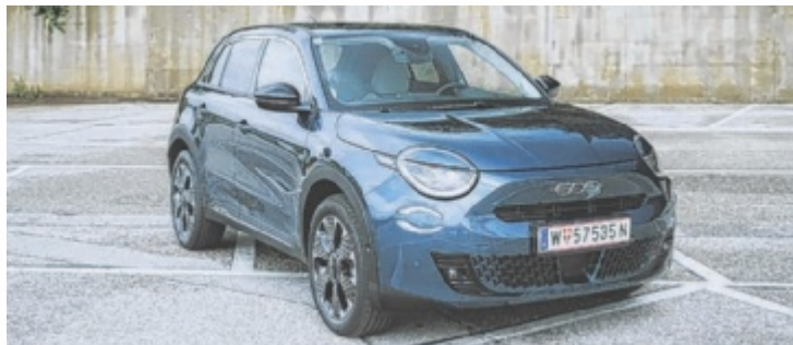
Der Fiat 600e La Prima ist ab 39.600 Euro zu haben.

Fiat 600e also. Seinem Design wohnt ein großes Maß an Sympathie inne. Retro wohl dosiert, runde Scheinwerfer, dezente Linien und konsequente Aussparung von jedweder Art von aggressiver Formsprache verfehlen ihre Wirkung nicht. Dass er gegenüber dem 500X zart kleiner wurde, hat dem Fiat 600e da-