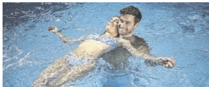
Ein Sommer zum Erholen in der Sole Felsen Welt in Gmünd

tere sprudelnde Möglichkeiten laden zum Plantschen ein. Die Sole Felsen Sauna ist einzigartig. Neben Felsen-Hamam, Saunabar, Dampfgrotte, Infrarotkabine und sechs Saunen steht auch der Saunagarten direkt am Asangteich offen. Im Vier-Sterne Sole Felsen Hotel kann man sich rundum verwöhnen lassen. Die Ausflugsmöglichkeiten in der Region bieten viel Abwechslung. ■ Anzeige