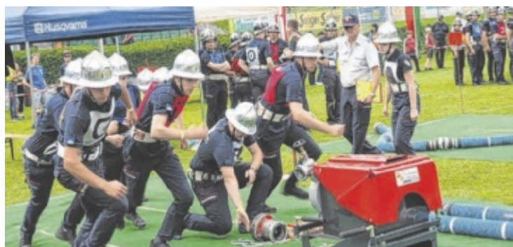
Voller Einsatz der Bewertungsgruppe Weitersfelden beim Löschangriff

eine reibungslose Abwicklung auf den Bewerbungsbahnen sorgten die Bewerber unter Johannes Rösinger und Michael Klopff. Auch das perfekt arbeitende Küchenteam lief zur Höchstform auf und gab an dem Tag insgesamt 3.200 Mahlzeiten aus. Mehr lesen und Fotos: www.tips.at/n/649929 ■