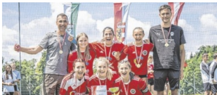
Die Freistädter U18-Mädchen holten Gold.