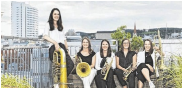
Die Musikerinnen von quintTTTonic kommen nach Kefermarkt.