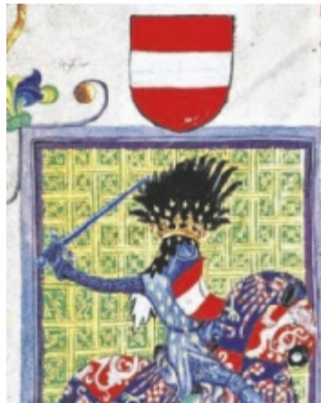
Ottokar II., König von Böhmen, Herzog von Österreich

In der aktuellen Sonderausstellung wird das Leben Ottokars II. dargestellt. Traditionell wird Ottokar als der „Eiserne und Goldene König“ genannt. Viele kennen ihn aus Grillparzers Werk „König Ottokars Glück und Ende“. Er ist bekannt dafür, dass es unter seiner Herrschaft zu zahlreichen Stadtgründungen (unter anderem Budweis) kam. Zu seiner Geschichte: Im 13. Jahrhundert gehörten die Gebiete des heutigen Österreichs, Deutschlands, Norditaliens und der böhmischen Länder zum Heiligen Römischen Reich. Die einzel-