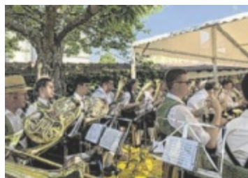
Jeder der hat, geht in Tracht!

LASBERG. Beim legendären Trachtensonntag mit Tag der Blasmusik am Sonntag, 7. Juli, in Lasberg packt jeder sein Dirndl oder seine Lederhose aus! Von 8.30 bis 13 Uhr sorgt die Trachtenmusikkapelle Lasberg für Frühschoppenstimmung auf dem Marktplatz, am Nachmittag servieren Hiatahraht und DJ Heli Musik. Den ganzen Tag über ist für ein abwechslungsreiches Programm gesorgt. ■