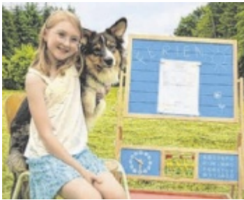
Gesucht werden kreative Fotos der Schüler samt Zeugnis.