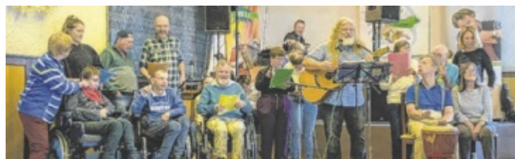
Der Chor Kunterbunt begeisterte beim Frühlingskränzchen.