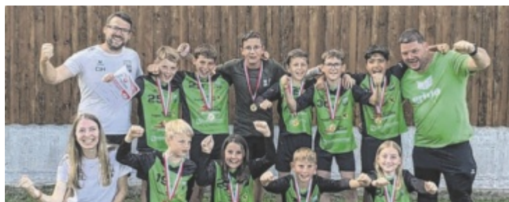
Die U12 Landesmeister mit den Trainern