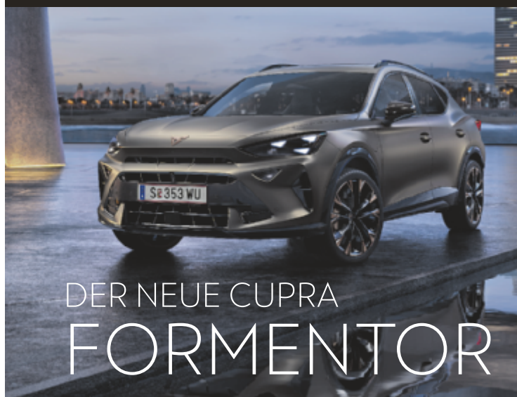
DER NEUE CUPRA FORMENTOR