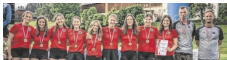
Platz drei für die Union Compact Freistadt

lich, trotz eines Wechsels bei Freistadt konnte der Satzverlust (11:5) nicht verhindert werden. Der vierte schien Urfahr zu beflügeln und sie gewannen mit einem klaren 11:5, wie auch den fünften Satz mit 11:7. Den folgenden konnte Freistadt mit 13:11 für sich entscheiden. Der Entscheidungssatz verlief nervenaufreibend. Urfahr führte mit 6:5, doch beim 8:8 war wieder alles offen. Freistadt hatte beim Stand von 10:9 sogar Matchball, aber letztlich entschieden zwei Leinenbälle das Spiel zugunsten von Urfahr. ■