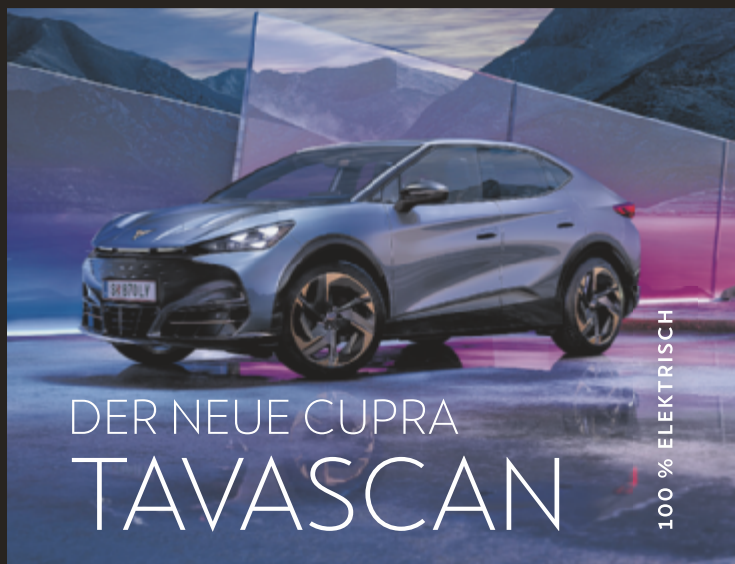
DER NEUE CUPRA TAVASCAN