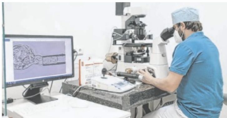
Im IVY Zentrum für Kinderwunsch in Wels erhalten Paare eine umfassende Diagnostik, gezielte Therapien und einfühlsame Begleitung.

In vielen Fällen liegen genetische Ursachen vor. Häufig sind