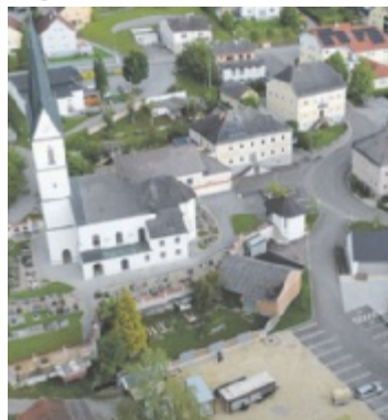
Wendling lädt zum Kirtag von 6. bis 7. Juli.

Am Sonntag, 7. Juli, beginnt der Kirtag um 8 Uhr im Pfarrhof mit einem Kirtagsfrühstück von der Goldhauben- und Hutgruppe. Um 8.30 Uhr findet die Heilige Messe in der Pfarrkirche statt. Parallel dazu läuft von 9 bis 13 Uhr die Präsentation der FF Wendling. Von 10.30 bis 14 Uhr lädt der Musikverein Wendling zum Frühschoppen im Zelt beim Kulturdorf ein, begleitet vom Treffen der ehema-