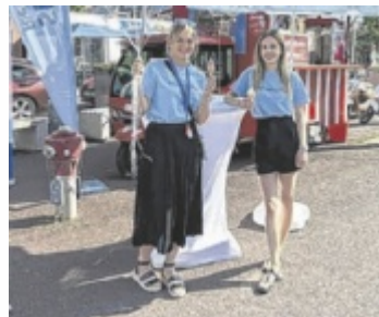
Die coole Schulschlussaktion geht in die nächste Runde.

Heuer macht nicht nur der kultige Eiswagen Lust auf den Sommer, die Stadt Ried sorgt mit lässigen Loungemöbeln für zusätzliches Urlaubsfeeling und entspanntes Verweilen am Marktplatz. Unterhaltung und viele