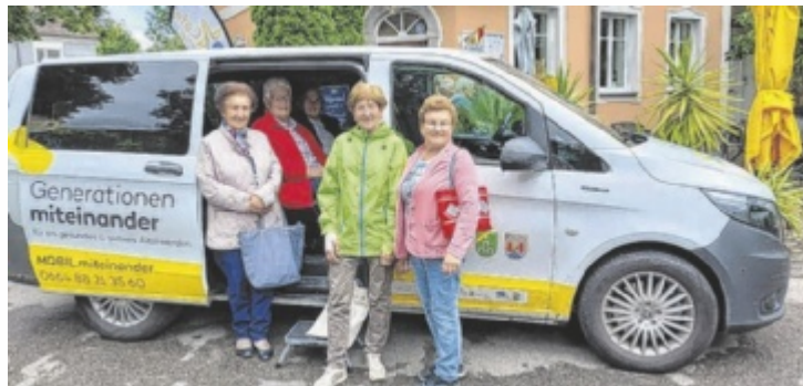
Der Seniorenbus von „Generationen miteinander“ ist schon sehr beliebt.

In Peuerbach und Steegen nimmt man sich das soziale Miteinander über Generationen hinweg besonders zu Herzen. Mit Hilfe einer Förderung der Leader-Region Mostlandl Hausruck und der Unterstützung durch die Gemeinden wurde ein neuer Verein unter dem Namen „Generationen miteinander Freiwilligenzentrum Peuerbach/Steegen“ gegründet. Mittlerweile hat der Verein mehr als 60 Freiwillige. So gibt es zum Beispiel einen Seniorentreff unter der Leitung von