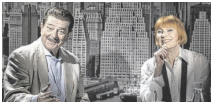
Erwin Steinhauer und Chris Lohner über die Brieffreundschaft von Marlene Dietrich und Friedrich Torberg