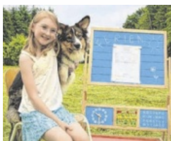
Gesucht werden kreative Fotos der Schüler samt Zeugnis.

In Kooperation mit dem Papier- und Spielwarenhandel sowie dem OÖ Verkehrsverbund sucht Tips wieder die originellsten Zeugnisfotos. Auf die besten Einsendungen, gewählt von einer Fachjury, warten pro Bezirk Gutscheine für den Fachhandel der Sparte OÖ Papier- & Spielwarenhandel im Gesamtwert von je 200 Euro. Obmann Georg Obereder: „Der Einfallsreichtum, mit dem die Teilnehmer ans Werk gehen, hat unsere Erwartungen schon die letzten Jahre übertroffen. Gerne belohnen wir die Gewinner auch heuer wieder mit Gutscheinen.“ Zusätzlich dürfen sich die Sieger über einen Gutschein für den Hochseilgarten Kirchschlag Ralf