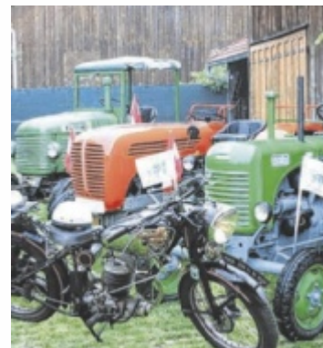
In Pötting gibt es jedes Jahr ein Treffen für hunderte Oldtimerfahrer mit ihren Fahrzeugen und Fans.

Bereits zum 15. Mal wird das Oldtimertreffen in Pötting abgehalten. Dazu werden über 400 Oldtimer – ob Mopeds, Motorräder, Autos oder Traktoren – erwartet. Der Pöttinger Kirtag beginnt mit dem Frühschoppen ab 9 Uhr. Bis 11 Uhr treffen die Oldtimerfahrer ein und können sich im Feuerwehrhaus anmelden. Die Oldtimer-Defilierungsrundfahrt startet um circa 11.15 Uhr. Jeder Teilnehmer erhält bei der Anmeldung eine Erinnerungsmedaille und ein Jubiläumsge-