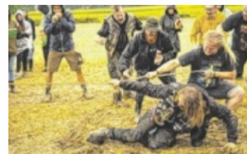
Das Festival sorgt nicht nur für musikalische Unterhaltung.

PEUERBACH. Das Brainbridge Festival, bei dem Rock und Metal auf Alternative treffen, findet von 1. bis 3. August bei der namensgebenden „Hirnbruck“ in Peuerbach statt.