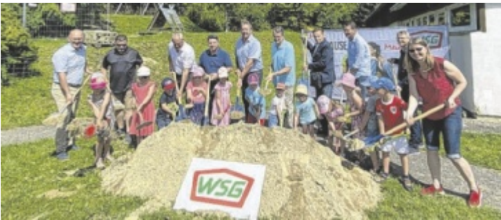
Feierlicher erster Spaten beim Kindergarten Taufkirchen