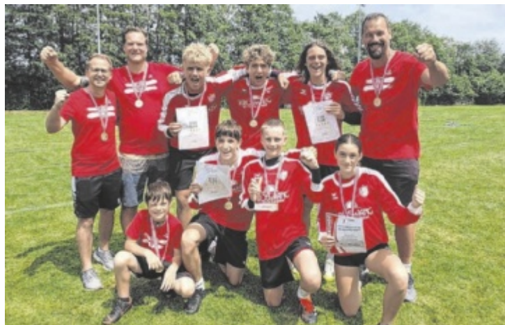
Die U16-Burschen des UFG Grieskirchen/Pöcking wurden in ihrer Altersklasse Österreichische Meister.