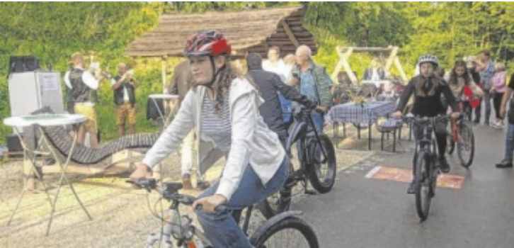
Musikgenuss und Radfahren am 5. Juli

BEZIRK GRIESKIRCHEN/BEZIRK WELS-LAND. Auf dem Haager Lies-Radweg, der Trasse der ehemaligen Bahn, wird am Freitag, 5. Juli, Musik gemacht – Trassenmusik. Ab 18 Uhr treten an zehn Stationen zwischen Haag am Hausruck und Neukirchen bei Lambach Musikgruppen auf. In Haag spielen zum Beispiel Saxeed auf. Die Teilnehmer aus „Die große Chance“ Anja und