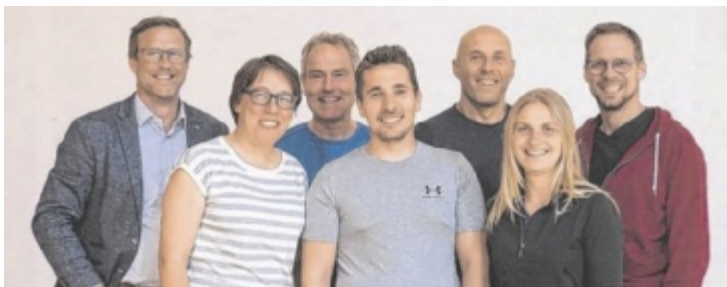
Das Landl Lauf- Organisationsteam lädt ein.