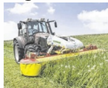
Pöttinger ist ein international führender Hersteller von Landtechnik-Maschinen.

Die Nachfrage nach Landtechnik-Maschinen sei stark gesunken, heißt es. Heuer seien für den Sommer nicht genug Aufträge da.