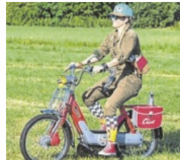
Beim 17. Wadholz Classic in Unterstetten gibt es zahlreiche Oldtimer zu bestaunen.

Autos, Motorräder, Traktoren, Busse und sogar Feuerwehrfahrzeuge aus vergangenen Jahrzehnten sorgen am Sonntag, 21. Juli, in Tollet für leuchtende Augen. Den Höhepunkt der Veranstaltung bildet die Rallye-Ausfahrt, die um 10 Uhr auf offenen Straßen durch das Hausruckviertel führt. Entlang dieser Tour gilt es, Stationen mit lustigen Spielen und Bewerben zu bestreiten. Die Oldtimer können außerdem beim Frühschoppen vor dem Feuerwehrhaus der FF Unterstetten, die als Veranstalter