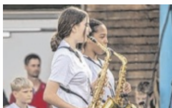
Die Schüler der Landesmusikschule spielten open air.

NEUKIRCHEN. Mit einem besonderen Konzertformat mit Strandfeeling haben sich die Schüler der Landesmusikschule in die Sommerferien verabschiedet. Entspannt auf dem Badetuch liegend oder kulinarisch versorgt an einem der Tische in Woody's Oase, konnten die rund 300 Zu-