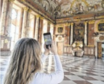
Auch mit der App hublz lässt sich Bruckner spielerisch entdecken.

In der abwechslungsreichen Schau werden biografische Details und neu entdeckte Dokumente präsentiert. Den Geheimnissen dahinter lässt sich im Rahmen von Vermittlungsangeboten für alle Altersgruppen nachspüren. Im Stiftshof nehmen drei multimediale Erlebnisräume Bezug auf Bruckners Träume und Visionen. Jeder Sonntag ist Suuuperkulturfamiliensonntag! Dann wird von 13 bis 16 Uhr ein buntes Programm geboten. Kinder und ihre Begleitpersonen können spielerisch den Ho-