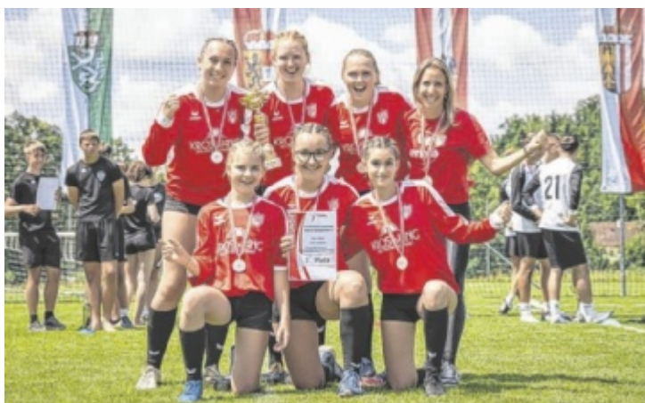
Das U18-Faustball-Damenteam der UFG Grieskirchen/Pöcking wurde Vize-Österreichische Meister.