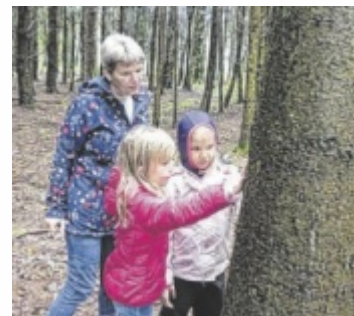
In den Ferien kann der Wald erkundet werden.

Los geht es am Sonntag, 7. Juli. Die vier Oö. Naturparke (Mühlviertel, Attersee-Traunsee, Bauernland und Obst-Hügel-Land) starten heuer erstmals gemeinsam in die Sommerferien beim ersten Oö. Naturpark-Familienerlebnistag. Die Teilnehmer erwartet ein abwechslungsreicher Tag für die ganze Familie mit einem Programm in der Natur. Je nach Naturpark können Familien Schmetterlinge beobachten, Pflanzen erkennen, mit Alpakas wandern, die Alm oder die Streuobstwiese kosten, ins Waldmeer eintauchen, Bäche erforschen, Basteln, Picknicken, Würstel grillen und vieles mehr.