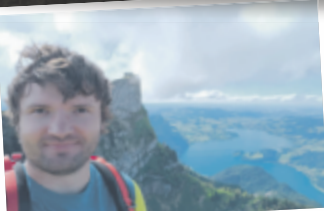
Bogdan aus Linz Spinnerin, 1725 m