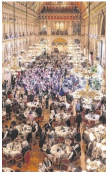
In Wien wurde oberösterreichische Lebensfreude gefeiert.

„Und ich will mit Anton tanzen...“, hieß es daher bei der Eröffnungsperformance der St. Florianer Sängerknaben und dem Kollektiv SILK Fluegge. „The Rats are Back“, Mitglieder des Linzer Musicalensembles, das DJ-Duo 2:tages:bart und viele weitere Musik-