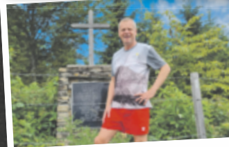
Robert aus Gmunden Hongar, 943 m