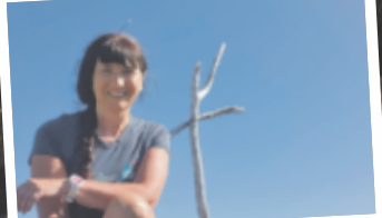
Alexandra aus Freistadt Hochgleit, 1784 m