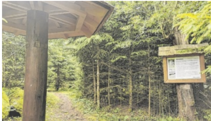
Der höchste Punkt des Moorwaldes, die Felixhöhe

Unter dem Namen Refugium Moorwald wartet ein herrliches Netz kürzerer Spazierwander-