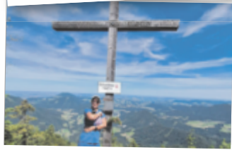
Silvia aus Linz Ochsenberg, 1483 m