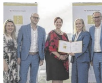
Familienministerin Susanne Raab (l.) gratulierte den Vertretern des Klinikums Wels-Grieskirchen.