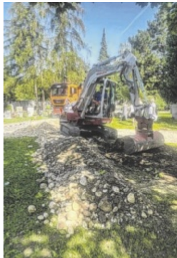
Es wird an der Schadensbehebung gearbeitet.

Die Nutzwasseranlage auf dem Friedhof muss repariert werden. Die eww hat eine Notwasserversorgung eingerichtet. Es kann in den kommenden Monaten zu kurzen Unterbrechungen der Nutzwasserversorgung kommen. Friedhofs-Referent Stadtrat Ralph Schäfer (FP): „An den ersten heißen Sommertagen kommt der Ausfall der Brunnenanlage zu einer Unzeit. Die Mitarbeiter der Stadt Wels arbeiten mit Hochdruck an der Behebung des Problems.“ Geöffnet hat der Fried-