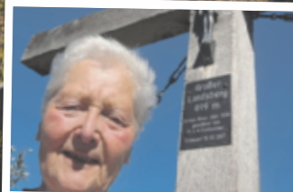
Theresia aus Steyr Großer Landsberg, 899 m