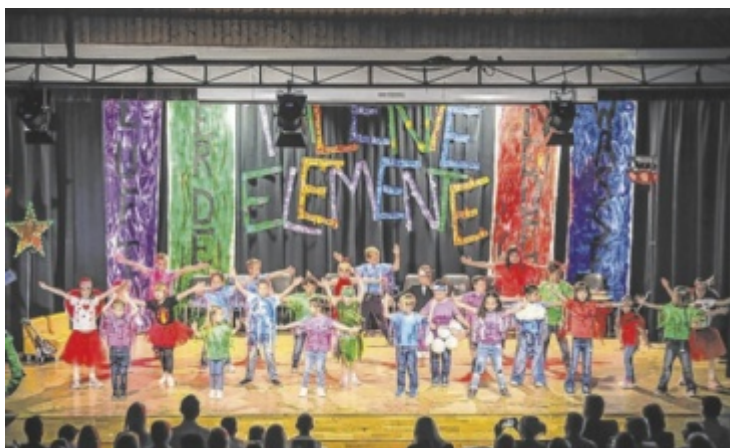
Die Musical Kids in ihrem Element