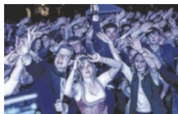
Beste Stimmung auch bei den jungen Ballbesuchern