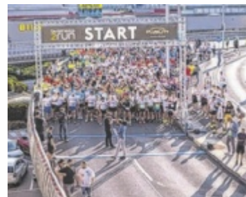
Am 4. Juli gehts los

PASCHING. Am Donnerstag, 4. Juli, macht business2run erneut in der PlusCity halt. Nachdem im vergangenen Jahr erstmals mehr als 600 Läuferinnen und Läufer beim 5,9 km-Firmenlauf teilgenommen haben, wird heuer ein weiterer Teilnehmer-Rekord angestrebt.