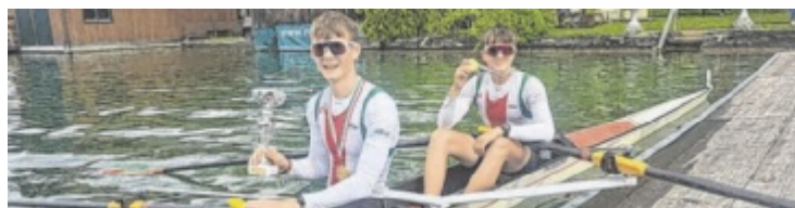
Junge talentierte Welser Ruderer