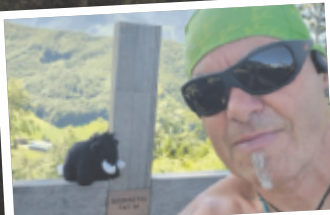
Georg aus Steyr Kessing, 745 m