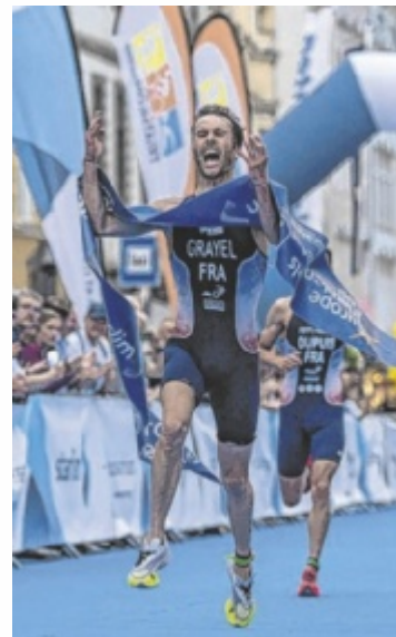
Jubel von Grayel