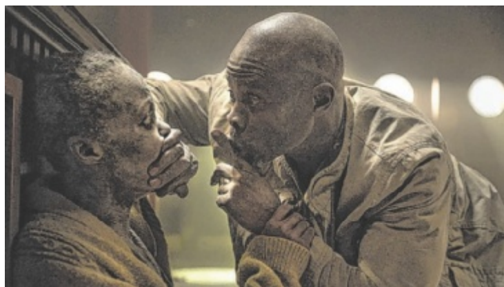
Horrorfilm: Kein Wort – denn die Aliens hören alles!

Aus den Kunstwerken von mehr als 1.200 Kindern wurden bei einer Juriesitzung drei Gewinner sowie eine Siegerklasse ausgewählt, deren Bilder in den kommenden Monaten als Plakate in den ÖBB-Regionalzügen zu sehen sein werden. Außerdem wird das Siegerbild auf einen OÖVV-Regionalbus aufgedruckt. Wer die Gewinner sind, enthüllen wir in der nächsten Ausgabe. ■