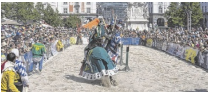
Ritter hoch zu Ross gibt's am Hauptplatz zu erleben.