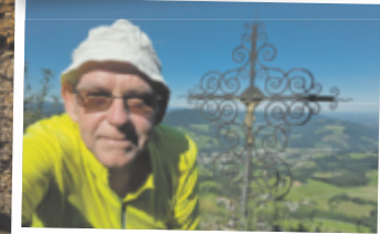
Helmut aus Enns Blassenstein, 844 m