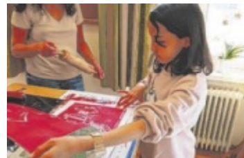
In der Volksschule St. Nikola experimentierten Schulkinder mit unterschiedlichen Techniken.

Alle teilnehmenden Schulklassen beschäftigten sich bereits im Vorfeld mit einer vom Klimabündnis bereitgestellten Kreativbox, die eine spielerische Auseinandersetzung mit dem öffentlichen Verkehr anleitet. Mit einer Fantasiegeschichte haben die Kinder eine Reise in den Zauberswald gemacht. Dabei haben sie gelernt, einen Busplan zu lesen und was auf einem Bahnticket alles draufsteht. Außerdem sind sie gemeinsam in den Zauberswald mit all den fantastischen Wesen eingetaucht.