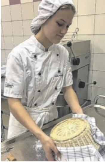
Der Teig muss im Gärkörbchen gehen, dann geht es ab in den Ofen.

Gekocht wird in der Fachschule gut und gerne, und im Schwerpunkt „Öko.Wirtschaft.Design“ lernen die Jugendlichen unter fachkundiger Anleitung auch die Herstellung des beliebten Brotes. Dabei wird nicht nur viel Wert auf den guten Geschmack gelegt, sondern auch auf die Optik. Durch kunstvolles Einschnitten entstehen so wunderschöne Brote mit extra knuspriger Kruste. Wer jetzt Appetit auf