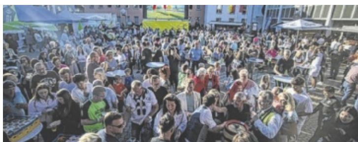
Bummvoller Marchtrenker Stadtplatz

schoppen gemütlich aus. Das war dann das 23. Marchtrenker Stadtfest. ■