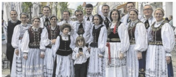
Die Siebenbürger tanzen im Herminenhof und im Burggarten auf.