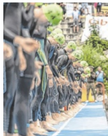
Konzentration am Start