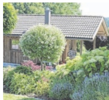
Marianne Weinberger aus Braunau holte sich den Titel „Schönster Garten 2022“.

Tips-Leser sind gefragt: Wer hat den Titel „Schönster Garten 2024“ verdient? Auf den Gewinner wartet ein Gutschein im Wert von 1.500 Euro für Gardena-Produkte. Wer sicher ist, dass sein Garten eine richtige Wohlfühl-oase und der schönste Platz daheim in der Natur ist, sollte sich online unter www.tips.at/garten registrieren, ein Foto vom Garten hochladen, Daten eingeben, und schon ist man beim Voting mit dabei. Um mehr Stimmen zu erzielen, kann das Foto mit Link auch auf Facebook geteilt werden. Pro Person kann nur ein Foto