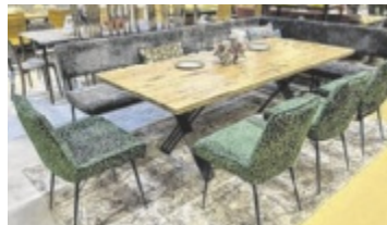
X-Markt: Maßmöbel unglaublich günstig

5 (Nähe SCW), Tel. 07242 60044, www.x-markt.at (Montag bis Freitag, 9 bis 18 Uhr, Samstag 9 bis 17 Uhr). ■ Anzeige