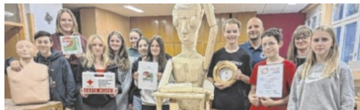
Die erfolgreichen Tischler und Ersthelfer

Helfenberg“ den zweiten Platz in der Kategorie „Funktionalität“. Außerdem konnte die 4. Klasse Gold beim Erste-Hilfe-Bezirkswettbewerb gewinnen. Die Schule ist übrigens bereits zum fünften Mal in Folge Erste-Hilfe-fit. ■