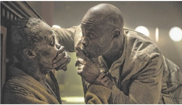
Horrorfilm: Kein Wort – denn die Aliens hören alles!