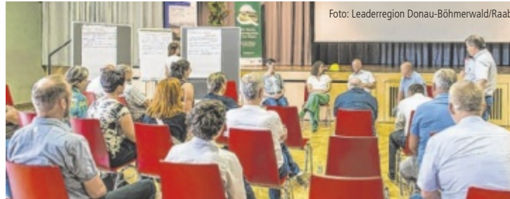
Nach den Impulsvorträgen wurde in Kleingruppen weiter diskutiert.

Ärmel hochkrepeln – darum geht es auch bei den drei großen Schwerpunkten, die man konkret anpacken will: Energie, Baukultur, Mobilität. Über letzteres Thema sprach Harald Frey (TU Wien). Er