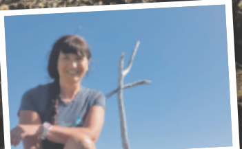
Alexandra aus Freistadt Hochglegt, 1784 m