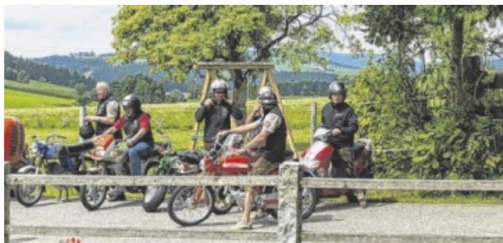
Beim Moped Gumball kann man mit allem, was zwei Räder, einen Verbrennungsmotor und eine Straßenzulassung hat, mitfahren.

Moped Gumball ist kein Rennen, sondern eine Fahrt auf öffentlichen Straßen, bei der verschiedene Checkpoints absolviert werden müssen. Dabei geht es vor allem um Geschicklichkeit am Moped. Bei diesen Stationen werden Punkte fürs Finale gesammelt. Denn abschließend werden die Teilnehmenden der Reihe nach in eine Sandgrube gelassen, um einen Schatz zu finden. Hauptpreis ist