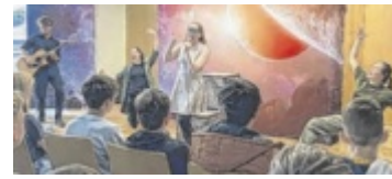
Englisches Theater erlebten die Mittelschüler aus St. Martin.

ham zur Verfügung. Bei der Abschlussveranstaltung im WIFI Linz durften die Schüler ihr ungewöhnliches Werkstück mit dem Außerirdischen, dem sie den Namen UZ-C1-176d gegeben haben, präsentieren. Die Jury prämierte dieses mit dem 3. Preis in der Kategorie Stabilität. ■