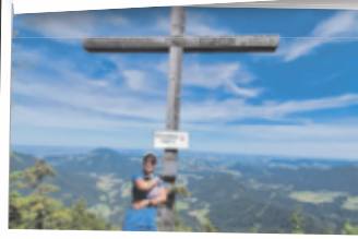
Silvia aus Linz Ochsenberg, 1483 m