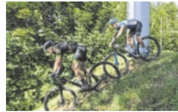
Die Mountainbiker absolvieren einige Höhenmeter.

Speziell in den Teamwertungen ist für jeden (Hobby-)Biker in der Drei- oder Sechs-Stunden-Wertung das Richtige dabei. Die Big-Team-Wertung (Achter-Team), eignet sich perfekt für Hobbyteams und Vereine. Viererteams von Feuerwehr, Rettung und Polizei treten in einer eigenen Blaulichtwertung gegeneinander an. Ab Anfang Juli ist die Strecke zum Trainieren beschildert und befahrbar. Der Streckenverlauf (inklusive GPS-Daten) steht auf der Webseite www.kernlandtrophie.ff-gruenbach.at zum Download bereit. Die Sechs-Stunden-Wertung startet um 9 Uhr, das Drei-Stunden Rennen um 12 Uhr. Team-