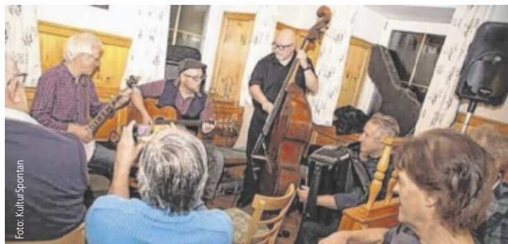
So wie hier in Haslach kommt „A Neichtl komot“ bald auch nach Nebelberg.