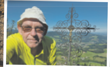
Helmut aus Enns Blassenstein, 844 m