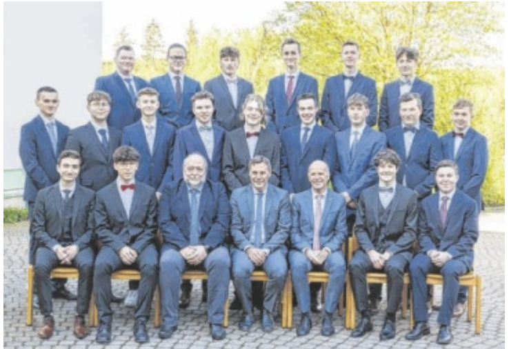
Die Maturanten der 5BHMBA