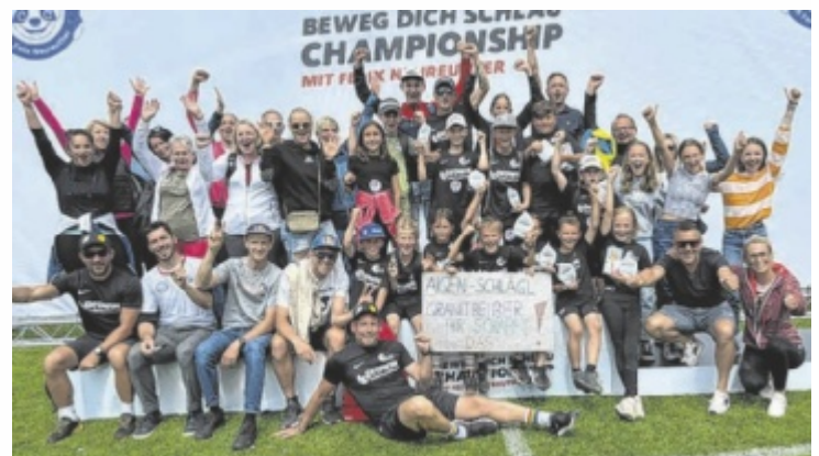
Das Team aus Aigen-Schlägl mit Trainern und Fans

Beim Bundesbewerb ebenfalls angetreten war ein Team aus Rohrbach-Berg. Es belegte schließlich Rang 16.