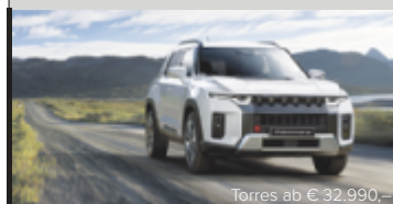
Torres ab € 32.990,-