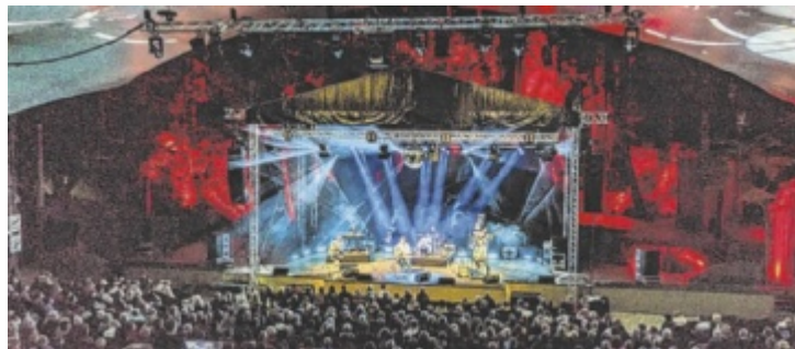
Austropop zum Mitsingen bringt „Auf A Wort“ auf die Bühne.