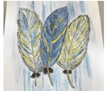
Schon eingereicht hat Chiara aus dem Bezirk Grieskirchen.

Tips, OÖ Landes-Kultur GmbH, Talente OÖ, Bildungsdirektion OÖ, Prager Fotoschule, Pädagogische Hochschule OÖ, Life Radio, TV1, OÖN und Uniqa machen sich wieder auf die Suche nach Kunsttalenten. In drei Alterskategorien (acht bis elf Jahre, zwölf bis 15 Jahre, 16 bis 18 Jahre) vergibt eine hochrangige Jury zahlreiche Preise. Außerdem werden ein Foto Award und der Art Award sowie erstmals der Digital Award (für Videos, KI-generierte Werke oder Audioprojekte) vergeben. Die Tips-Leser stimmen zudem unter allen eingereichten Werken online