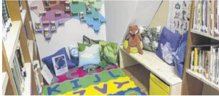
Gemütliche Lesecke in der Bibliothek Helfenberg

Der Begriff „dritter Ort“ für Bibliotheken – also neben dem eigenen Zuhause (erster Ort) und dem Arbeits- bzw. Ausbildungsort (zweiter Ort) eine Möglichkeit der Kommunikation und Begegnung – wurde von Stadtsoziologie Ray Oldenburg Ende der 1980er-Jahre geprägt. Für die Bibliothek Helfenberg stellt dieses Konzept ein prägendes Leitbild dar, das sich heuer in vier Veranstaltungen spiegelt. Als erste Bibliothek in Oberösterreich bietet jene in Helfenberg schon seit fünf Jahren in den Sommerferien die KinderUni OÖ on Tour an. Dabei wird ein Raum zum gemeinsamen Lernen,