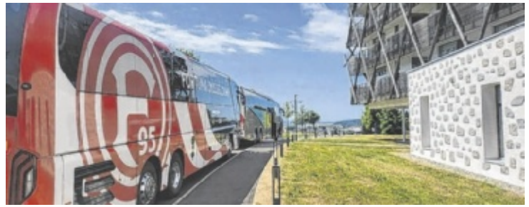
Fortuna Düsseldorf zu Gast im Mühlviertel

Gerade in Zeiten, wo Lebensmittelabfall und Kunststoffmüll zum täglichen Problem werden, bietet das Angebot von Gscheid Guat eine neue Lösung an. ■ Anzeige