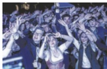
Beste Stimmung auch bei den jungen Ballbesuchern