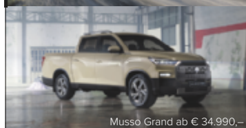
Musso Grand ab € 34.990,-