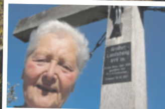
Theresia aus Steyr Großer Landsberg, 899 m