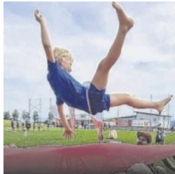
Spaß an der Bewegung bei den Ugotchi-Festen

Infos und Anmeldung: sportunion.at/ooe/ugotchibewegungsfeste/