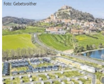
Imposant thront die Riegersburg über dem neuen Camping Resort.

Ende März eröffnete das Camping Resort Riegersburg im Thermen- und Vulkanland, eine Erlebnisregion in der Südoststeiermark. Auf über 25.000 Quadratmetern können die Urlauber zwischen 45 modernen, voll ausgestatteten Mobilheimen für zwei bis sechs Personen, 120 unterschiedlichen Stellplätzen oder drei Campingfässern wählen. Dazu kommt eine Zeltwiese und ein Kinderspielbereich. Ein Nahversorger ist nur wenige Schritte entfernt. Im großen Rezeptions- und Betriebsgebäude ist zudem alles vorhanden, was das Camperherz begehrt. Schließlich bringt die Betreiber-Familie Gebetsroither über 40 Jahre Erfahrung im Campingbereich mit. Der neue Campingplatz entstand durch ein Joint Venture mit der Familie von und zu Liechtenstein, den Besitzern der Riegersburg.