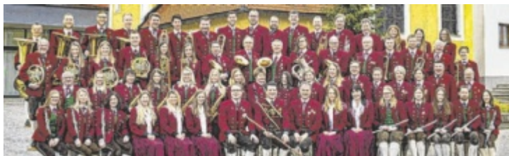
Der Musikverein Lacken lädt erstmals zum Lackinger Sommerfest.

Neu: Early Bird Ticket: 7 Euro Diese sind nur online ab 1. Juli erhältlich unter www.hollerberg.at Abendkasse ist an beiden Tagen für jeweils 14 Euro erhältlich.