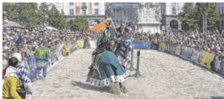
Ritter hoch zu Ross gibt's am Hauptplatz zu erleben.