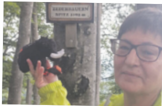
Elisabeth aus Urfahr Umgebung Zederbauernspitz, 1075 m

Wir wünschen allen Teilnehmern eine erfolgreiche Wandersaison!