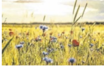
Landwirte sorgen für Artenvielfalt.

agrarischen Flächen. Wie weit das gehen soll, sei völlig unklar, ergänzt Mairhofer: „Das sind bisher nur Überschriften und noch viele Details offen. Und es gibt auch kein Budget dafür.“