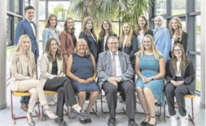
Die Maturanten der 5c HLW