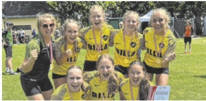
Ulrichsbergs U14 jubelt über die Goldmedaille.