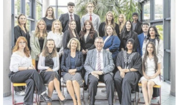
Die Absolventen der 3 FSD