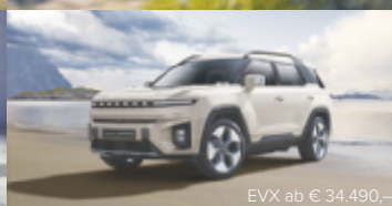
EVX ab € 34.490,-