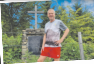
Robert aus Gmunden Hongar, 943 m