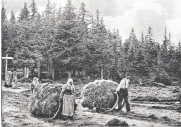
Altheutransport in der Dreieckmark

Die sogenannten „Denkörter und Zwieselflecken“ sind zwei Waldwiesenkomplexe inmitten des Stift Schlägler Forstes. Im Buch wird das Werden und Vergehen der Hochwaldwiesen auf dem Zwieselrücken zwischen Plöckenstein und Zwieselberg im Gemeindegebiet von Schwarzenberg im Zeitraum von vier Jahrhunderten unter die Lupe genommen. Von jeder der 60 Waldwiesenparzellen konnte die Besitzerfolge aufgestellt werden. Doch erst die Geschichten, die noch von den letzten Besitzern der Denkortwiesen und Zwieselflecken über deren mühsame Bewirtschaftung zu erfahren waren, verlebendigen den historischen Text. Darüber hinaus wird auf zahlreiche Besonderheiten der Kleinregion hingewiesen: auf geologische Erscheinungen, auf verschwundene Biodiversität, auf die