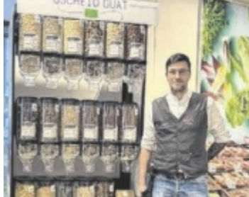
„Gscheid guat“ im REWE Miggitsch in Waldkirchen

ROHRBACH. Neuerung in den Stamm-Supermärkten: Unverpackte Bio-Lebensmittel zum Selbstabfüllen sind nun auch für alle Ernährungsbewussten und nachhaltig Denkenden im Bezirk Rohrbach verfügbar.