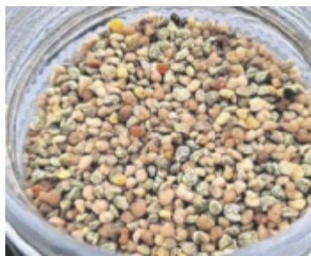
Bunter Nährstoffreichtum im Glas

Trennung von Pollen und Schmutz erfolgt direkt im Bienenvolk, der zeitaufwändige Reinigungsprozess entfällt. Wenn der Bioimker also täglich seine Bienenvölker besucht und die Laden entleert, kommt reiner Blütenpollen zusammen.