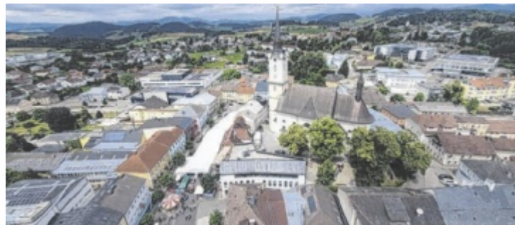
Im Stadtzentrum tut sich ordentlich was.

Am Samstagvormittag können die Gäste regionale Produkte auf dem Wochenmarkt einkaufen und Schmankerl im Festzelt genießen. Die „Straßhäusbuam“ sorgen für Stimmung, bevor es nachmittags mit einer Kinderdisco mit DJ Maxx und Sparefroh weitergeht. Abends heizen die „Danube Sparrows“ im Zelt ein und bereiten die Bühne für den Hauptact, die „Mountaincrew“, vor.