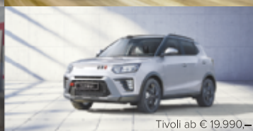
Tivoli ab € 19.990,-