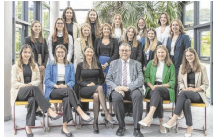
Die Maturantinnen der 5b HLW