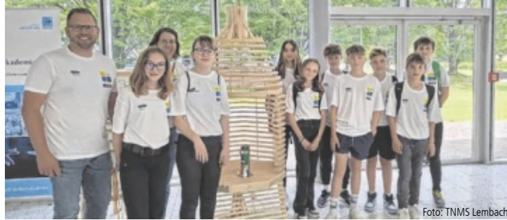
Die Schüler der 3a der Mittelschule Lembach mit ihrem preisgekrönten Werkstück

Die Mittelschüler zeigten bei ihrer Arbeit zum Thema „Ein Außerirdischer, der eine Zeitkapsel in seinem Körper verborgen hat, landet bei euch an der Schule“ nicht nur handwerkliches Geschick, sondern auch Kreativität, Ausdauer und großen Teamgeist. Von Dezember bis April haben die zehn Drittklässler im technischen Werkunterricht geplant, skizziert, gesägt, geleimt,