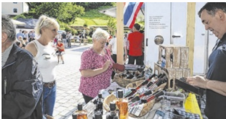
Es darf wieder gestöbert und gekauft werden.