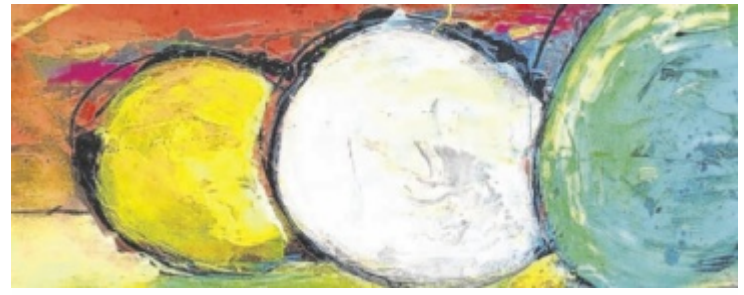
Eines der Werke von Walter Öllinger