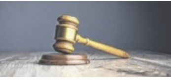
Am Freitag werden 32 Kunstwerke versteigert.