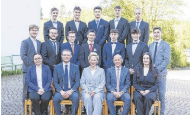
Die Maturanten der 5AHWII