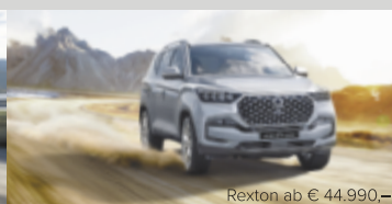
Rexton ab € 44.990,-