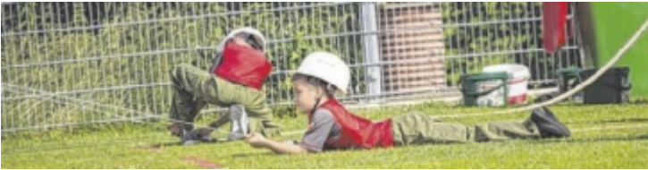
Junge Feuerwehrler gaben ihr Bestes.