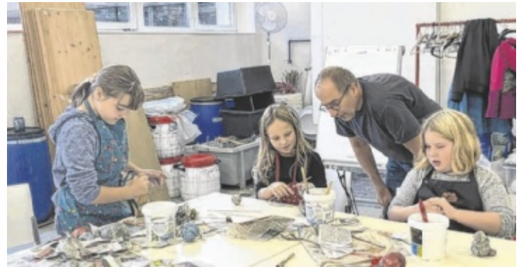
Arbeit mit Papiermâché

Alle zwei Wochen wurde an einem Nachmittag in einer offenen und kreativen Umgebung mit Material und Farbe experimentiert, Neues entdeckt und nach Herzenslust gewerkt. Kunstschaffende und Spezialisten aus der Region stellten dabei verschiedene Techniken und Gestaltungsverfahren vor: Malen, Drucken, Weben, Zeichnen, Töpfern, Schnitzen, Fotografieren, Videofilmen und vieles mehr. Die Kunst- und Kreativwerkstatt ist eine Kooperation der Landesmusikschule mit dem Textilen Zentrum Haslach.