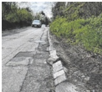
Die Pachmayrstraße wird täglich von vielen Pendlern genutzt.

Die Pachmayrstraße dient vielen Pendlern aus dem Mühlviertel, etwa aus Lichtenberg, Eidenberg, Gramastetten usw., als tägliche Verbindungsstrecke nach Linz. Jener Straßenabschnitt, der sich von Gründberg bis hin zur Lichtenberger Gemeindegrenze zieht, ist seit Jahren in desolatem Zustand. Schlaglöcher sowie kaputte Randsteine und Bankette erschweren das Befahren der ohnehin engen und steilen Straße. Zwischen dem Haus Pachmayrstraße 20 (kurz nach dem Spar in Gründberg) und der Gemeindegrenze Lichtenberg wird nun eine Sanierung der Straße durchgeführt – das beschloss der Linzer Stadtsenat am 13. Juni. Der Be-