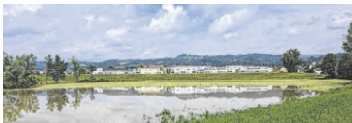
Das Hochwasser verwandelte für einen Tag die Schlosswiese in Ottensheim in eine Badewiese.