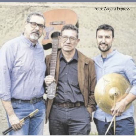
Kultur-Dienstag Beim nächsten Kultur-Dienstag im Café & Bistro Kowalski in Gallneukirchen am 25. Juni, 19 Uhr, ist das Trio Zagara Express zu Gast. Das Publikum erwartet eine Reise durch internationale italienische Hits und weniger bekannte Perlen der italienischen Popmusik. Eintritt frei.

OBERNEUKIRCHEN. Keine Chance für Langeweile während der Sommerferien garantiert das Ferienprogramm „SommerAktiv 36 “ auch heuer. Die Kinder und Jugendlichen können diesmal aus über 40 Angeboten wählen.