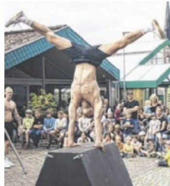
Straßenkünstler beeindrucken mit ihrem Können.

Freitag und Samstag wird das offene Gelände von 14 bis 20 Uhr mit Straßenkünstlern bespielt: Musik, Akrobatik, Tanz, Schuh-