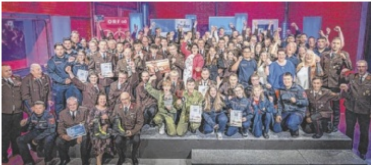
Die Top 10 Feuerwehren feiern ihren Erfolg bei der Landeswahl.

Insgesamt wurden in den letzten Wochen über eine Million Stimmen für die teilnehmenden Feuerwehren abgegeben, davon allein rund 873.000 bei der Landeswahl. Tips-Geschäftsführer Moritz Walcherberger ist begeistert: „Wir haben es den Feuerwehren ja um einiges schwerer gemacht als im Vorjahr. Bis dato waren sieben Stimmzettel in jeder Zeitung, heuer nur mehr vier. Und trotzdem haben sie es wieder geschafft, über eine Million Stimmzettel zusammenzubringen.“ In-