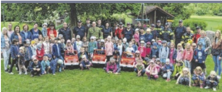
Drei Feuerwehr-Unimogs Große Freude herrscht bei den Kindergartenkindern in Vorderweißenbach und Köckendorf über drei neue Feuerwehr-Unimogs. Diese erhielten sie von den fünf Feuerwehren anlässlich der jährlichen Brandschutzfrüherziehung „GSF – Gemeinsam Sicher Feuerwehr“.