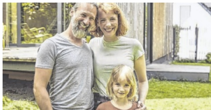
Der Hausbau ist für viele Menschen die größte Einzelinvestition.

„Billig ist beim Bauen nicht immer günstig. Für die Behebung von Mängeln muss man später tief in die Tasche greifen. Man spart