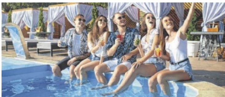
Tips sucht das coolste Foto am Wasser.