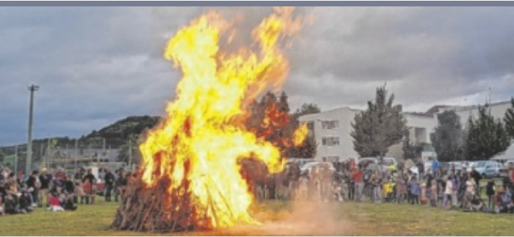
Sonnwendfeuer Das Volksbildungswerk Lichtenberg lädt am Freitag, 21. Juni ab 20 Uhr zum Sonnwendfeuer auf den alten Sportplatz ein. Geboten wird Musik und Kulinarik. Die Veranstaltung findet nur bei Schönwetter statt.

tiert Familie Durstberger beim Scherer's Milchtage ihre Milchprodukte. Warme Leberkäsemmerl vom Burgschattenhof, Käse, Kaffee und Kuchen sowie eine feine Auswahl an Weinen von WolfsWeindepot runden das Angebot ab. ■