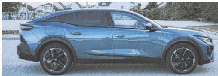
Der Peugeot 408 GT PureTech 130 EAT8

„PureTech 130 EAT8“ heißt der Bursche mit vollständigem Namen. In der besseren „GT“-Ausstattung startet der Peugeot 408 damit bei attraktiven 38.370 Euro. Zum Vergleich: Der kleinere Plug-in-Hybrid beginnt bei 47.490 Euro. Jetzt würden die Testfahrer natürlich niemals behaupten, die Mehrkosten wären zum Fenster rausgeschmissenes Geld. Es sei denn, man braucht keine 180 PS, hat keine eigene Lademöglichkeit, dafür aber ein Faible für große Kofferräume. Damit wären die größten Unterschiede auch schon herausge-