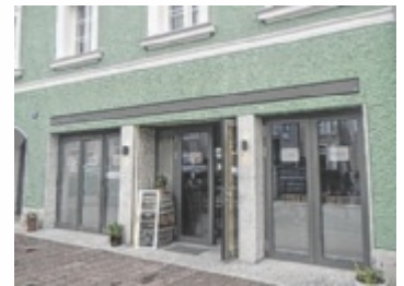
Eine Bereicherung für den Ortskern

Das Lokal am Ottensheimer Marktplatz wird von Donnerstag bis Samstag von 10 bis 22 Uhr und am Sonntag von 9 bis 18 Uhr für Gäste geöffnet sein. ■