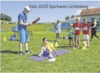
Vielfältige Sportangebote testen