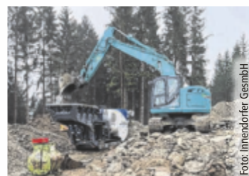
Steinbrechanlage im Einsatz

Ein weiteres Spezialgebiet der Josef Innendorfer GesmbH ist die Verle- gung von Natursteinmauern. Mit einem Auge für Detail und einer Leidenschaft für hochwertige Ma- terialien schaffen die Experten