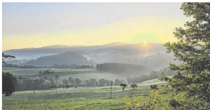
Wunderschöne Aufnahme, per Mail eingesandt von Dani Stadler aus Haibach.

geladen, dieses (mindestens 350 kB) unter dem Betreff „Leserfoto“ samt einer kurzen Info dazu, wo und wann das Bild aufgenommen wurde und was es zeigt, an j.stitz@tips.at zu senden. Mit etwas Glück ist es dann vielleicht in einer der nächsten Ausgaben zu sehen. ■