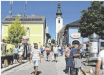
Flohmarkt und Fest der Begegnung zugleich

Bereits zum 16. Mal findet Gramastettens größter Flohmarkt unter Federführung des örtlichen Pensionistenverbandes, des Arbö, der Kinderfreunde und der Naturfreunde statt. Im Laufe der Jahre hat sich dieser mit jeweils bis zu 60 Ständen zu einem Fest der Begegnung entwickelt. Auch heuer haben wieder zahlreiche Aussteller ihre Teilnahme zugesagt. Zu einem Gutteil werden die Erlöse für soziale Zwecke verwendet. Für kuli-