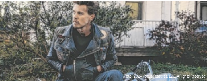
Austin Butler ist zwischen Frau und Motorrad-Gang-Anführer hin- und hergerissen.