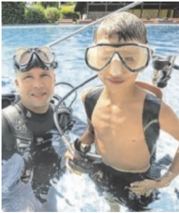
Abtauchen in das Angebot des aktuellen Ferienprogramms

Das Programm wurde erneut vom Verein Eltern-Kind-Zentrum Wichtelhaus und der Gemeinde Oberneukirchen-Waxenberg-Traberg in Zusammenarbeit mit den örtlichen Vereinen und Organisationen erstellt. „Wie in den letzten Jahren möchten wir ein vielseitiges und spannendes Ferienprogramm in allen drei Orten der Marktgemeinde Oberneukirchen anbieten. Dies ermöglicht fröhliche Tage mit