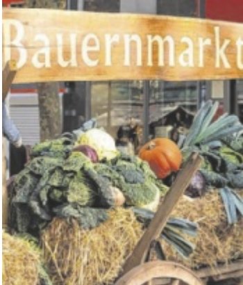
Heimische Produktvielfalt beim Bauernmarkt, jeden Freitag am Marktplatz