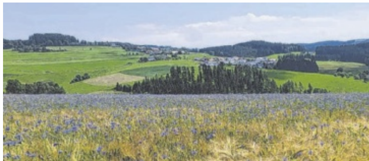
Toller Blick auf Sonnberg.