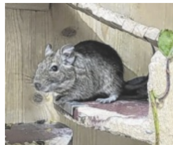
Der Degu gehört zur Gattung der Strauchratten.

Die aktiven Strauchratten sind etwa dreieinhalb Jahre alt und kamen ins Tierheim, da ihre Besitzerin eine starke Allergie gegen die Einstreu der Kleinnager entwickelt hat. Degus benötigen ein großes Gehege mit mehreren Ebenen und ausreichend Platz zum Klettern. Ebenso nötig sind mehrere große Häuser und ein großes Laufrad mit einer geschlossenen Lauflfläche. Da sich Degus durch Holz und Plastik schnell durchnagen, eignen sich vor allem Voliere aus Metall. Grundlegendes Zubehör