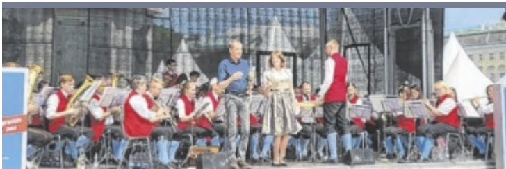
Vielfältiges Mühlviertel Die Destination Mühlviertel präsentierte sich bei der OÖ. Sommerfrische am Wiener Heldenplatz als herausragende Urlaubsregion, die reich an Kultur und kulinarischen Köstlichkeiten ist. Die vielen Besucher entdeckten die Spezialitäten der Produzenten und Wirte des Mühlviertels. Daneben sorgten Musiker – etwa die Trachtenmusikkapelle Bad Leonfelden mit Vierstern (Bild) oder die Weissenbecka Wirtshausmusi – für Stimmung.