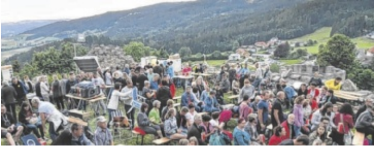
Kinogenuss unter Sternen

Über die Bühne geht die beliebte Veranstaltung, die zum Ferienstart schon ein fixer Bestandteil des Veranstaltungskalenders der Markt-gemeinde ist, bereits zum fünften Mal. Die Organisation liegt in den Händen der ÖVP Oberneukirchen-Waxenberg-Traberg. Heuer steht die österreichische Komödie „What a Feeling“ (2024) am Programm. Zum Inhalt: Ihren Hochzeitstag hat sich die erfolgreiche Ärztin Marie Theres anders vorgestellt. Bei einem Candlelight-Dinner mit Freunden als Überraschungsgäste