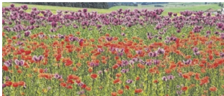
Sandra Poimer aus Traberg hat diese Mohnblumen in Reichenthal fotografiert.