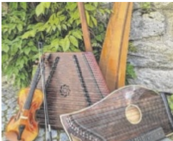
Saitenklänge im Salzhof

RAPPER ALLIGATOAH BEI CLAM LIVE BURG CLAM. Alligatoah, einer der erfolgreichsten Hip-Hop-Künstler Deutschlands, kommt am Freitag, 19. Juli, auf die Burg Clam. Abgerundet wird das Line-up von Tream, Deutschlands ersten Schlager-rappern, Mehnersmoos und Lostboi Lino. Tickets & Infos auf: www.clamlive.at