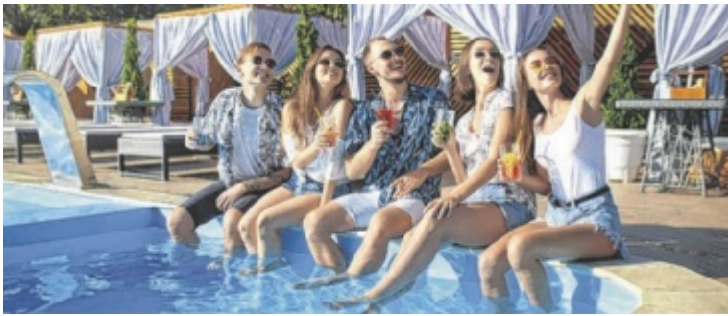
Tips sucht das coolste Foto am Wasser.