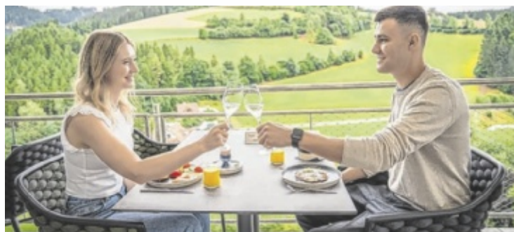
Ein wahrer Geheimtipp im Mühlviertel – Der Königswieserhof