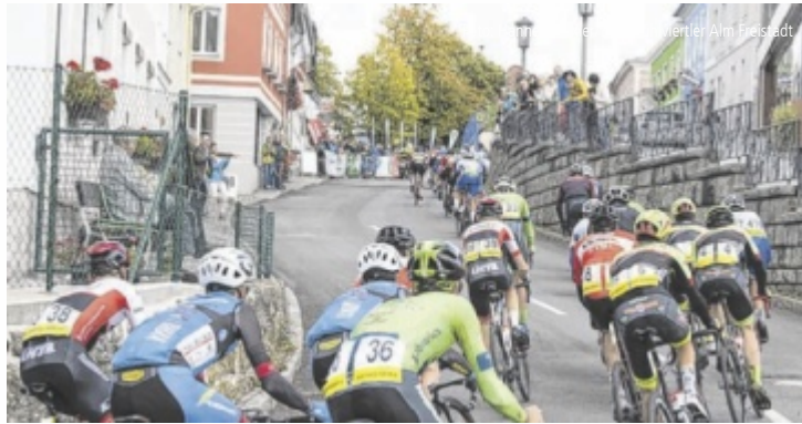
5. Mühlviertler Hügelswelt Classic: Spitzensport in Top-Ambiente