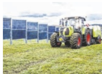
In Hiltischen ist eine Agri-PV-Anlage in Planung.

Modulreihen werden in einem Abstand von acht beziehungsweise zwölf Metern in den Boden gerammt. „Auf einer belegten Fläche von zirka drei Hektar erzeugen die zweiseitigen Photovoltaik-Module einen jährlichen Strom von zirka 2,6 GWh. Dies entspricht dem jährlichen Stromverbrauch von rund 750 Haushalten in der Region. Der erzeugte Strom wird zu 100 Prozent in das öffentliche Netz eingespeist“, beschreibt Hannes Leit-