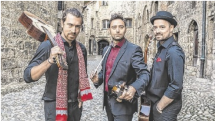
Cobario bringt spanisches Flair auf die Burg Reichenstein.