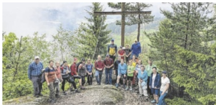
Zwischenstopp beim Gipfelkreuz am Hansberg

derbaren Mühlviertler Landschaft konnte an ausgewählten Plätzen berührenden Impulsen des Stelzhamerbundes gelauscht werden. Besonders spürbar war die Freude über die immer größer werdende Gemeinschaft, je näher man dem Ziel kam. Zum Abschluss wurde in der Wallfahrtskirche Kaltenberg gefeiert. Gemütlicher Ausklang war eine Jause am Kirchenplatz. ■