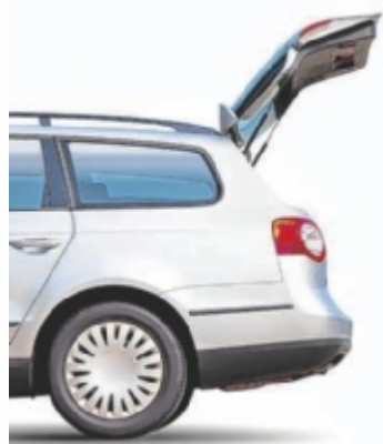
Verkauf aus dem Kofferraum in Kefermarkt

KEFERMARKT. Baby- und Kindersachen sowie Spielzeug werden beim Kofferraum-Flohmarkt am Samstag, 22. Juni, von 14 bis 17 Uhr am Parkplatz beim Lagerhaus verkauft. Der Verkauf erfolgt direkt aus dem Kofferraum. Einparken für Verkäufer ab 13 Uhr; eine Anmeldung unter Tel. 07947 5910-12 oder per E-Mail an gemeinde@kefermarkt.ooe.gv.at ist unbedingt erforderlich; Standgebühr: 5 Euro; Der Flohmarkt findet nur bei Schönwetter statt. ■