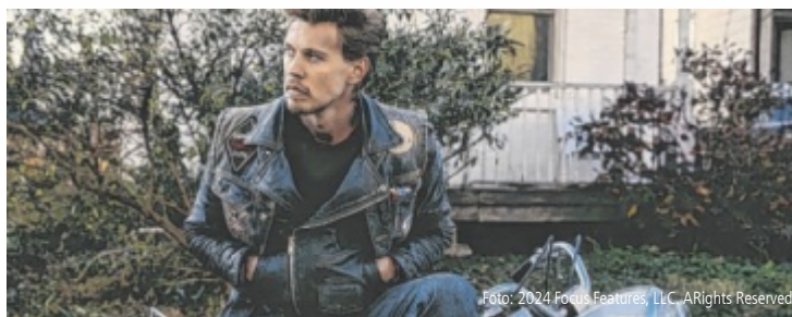
Austin Butler ist zwischen Frau und Motorrad-Gang-Anführer hin- und hergerissen.