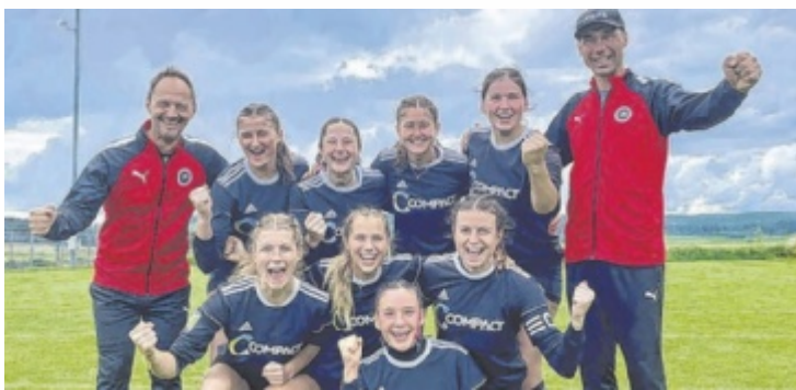
Das Freistädter Frauenteam siegte im dritten Viertelfinale.

21. Juni 2024: Staatsmeisterschaft Einzelzeitfahren in Königswiesen; Para-Cycling, Damen, Herren; Start: 15 Uhr, Marktplatz; 22. Juni 2024: Bikement Austrian Pumptrack Series 2024, Eröffnung Pumptrack Königswiesen, 9 bis 17 Uhr, Sportanlage Königswiesen 23. Juni 2024: Österr. Staatsmeisterschaft Straße, Königswiesen, Start: 11 Uhr, Marktplatz