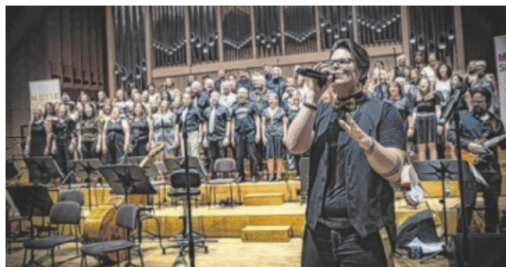
Der 120 Stimmen starke Chor tritt im Salzhof Freistadt auf.

Rock und Pop geboten, mit Songs von David Bowie, Elton John und Tina Turner, David Guetta, Sia und vielen anderen. Das Konzert beginnt um 19.30 Uhr. Karten um 15 Euro gibt es im Vorverkauf bei der Local-Bühne Freistadt oder in der Musikschule Linz. ■