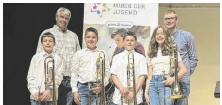
93,20 Punkten und einen 1. Preis für die Sliders