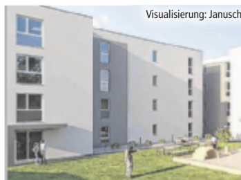
Visualisierung: Janusch Moderne Wohnungen in Hagenberg

Die neuen Wohnungen in Hagenberg überzeugen durch durchdachte Grundrisse und eine optimale Ausrichtung nach Süden oder Westen, wodurch sie den ganzen Tag über von viel natürlichem Licht durchflutet werden. Im Obergeschoss sind die Wohnungen mit Balkonen oder Loggien ausgestattet, die zusätzlichen Wohnraum im Freien bieten und zum Entspannen einladen. Im