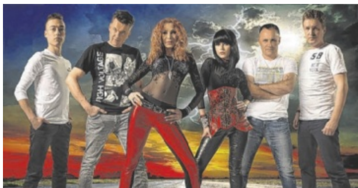
Smash sorgen beim Hüttenfest in Freudenthal für Stimmung.

GUTAU. Die Zeugfärberei Gutau feiert am Samstag, 29. Juni, ab 16.30 Uhr mit einem Gartenfest bei der Alten Schule Gutau ihr zehnjähriges Bestehen. Mehr dazu gibt es in der nächsten Tips-Ausgabe.