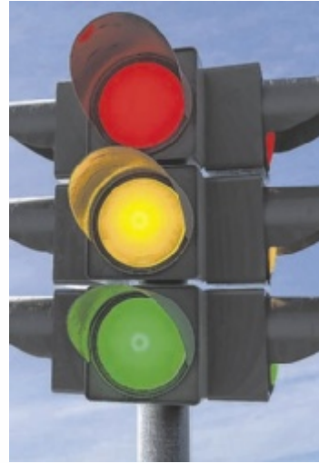
2025 wird der Kreisverkehr in Unterweikersdorf in eine ampelgeregelte Kreuzung umgebaut.

Bereits 2007 wurde das ursprüngliche Projekt eingereicht, doch die tatsächliche wirtschaftliche und verkehrliche Entwicklung übertraf die damaligen Prognosen erheblich. In den Morgen- und Abendspitzenstunden kommt es regelmäßig zu Über-