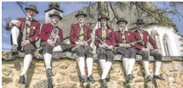
Der Musikverein Grünbach freut sich auf viele Besucher.

Festzelt auf, am Abend wird DJ Hoidi die Bühne rocken und für gute Stimmung sorgen. Die Feuerwehr Windhaag und die Jugend- und Aktivgruppen beim Bewerb freuen sich über zahlreiche Besucher. ■