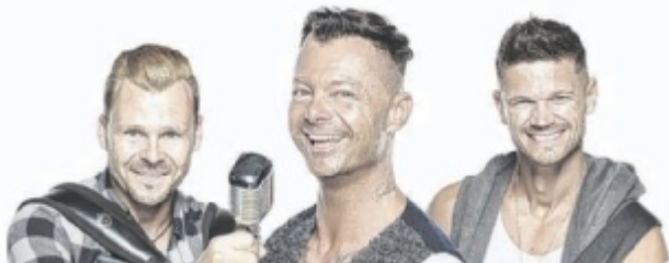
Garanten für heiße Sommerklänge: die Burschen von Zwirn