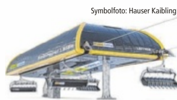
Symbolfoto: Hauser Kaibling