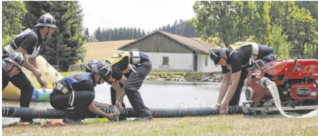
Mehr als 100 Bewerbungsgruppen kämpfen beim Ligabewerb in Windhaag um die besten Zeiten.

Die Freiwillige Feuerwehr Windhaag wurde 1884 gegründet. Wie auch andernorts waren in Windhaag verheerende Brände, die beinahe den ganzen Markt in Schutt und Asche gelegt hatten, Auslöser für das Errichten einer eigenen Feuerwehr. Damals wie heute ist die Feuerwehr ein unverzichtbarer Teil der öffentlichen Sicherheit und des Gemeinschaftslebens. Gefeiert wird das runde Jubiläum mit einem Festakt am Freitag, 21. Juni, um 19.30 Uhr am Sportplatz in Windhaag. Zahlreiche Feuerwehren und Ehrengäste sowie die