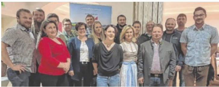
Der neue Vorstand mit Ersatzmitgliedern