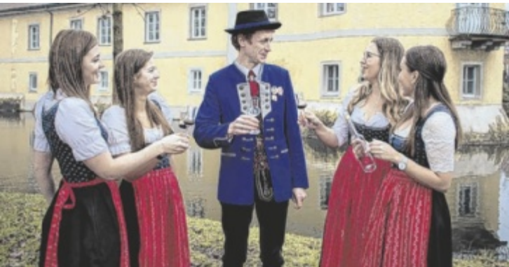
Der Musikverein Waizenkirchen ist Gastgeber des Bezirksmusikfests.

WAIZENKIRCHEN. Unter dem Motto „Huat auf, Stutzen gricht – unser Musifest is Pflicht!“ richtet der Musikverein Waizenkirchen das Bezirksmusikfest von Freitag, 21., bis Sonntag, 23. Juni, aus. Am Freitag findet ein Vereins- und Firmenabend statt. Umrahmt wird dieser vom Einmarsch der Gastkapellen und vom Festauftakt mit der