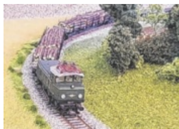
Der Modelleisenbahnclub Eferding lädt zum Tag der offenen Tür nach Hinzenbach.

Theater Meggenhofen Kircheckerhof, Schlatt 4 www.theatermeggenhofen.at 0664 88213374 info@theatermeggenhofen.at