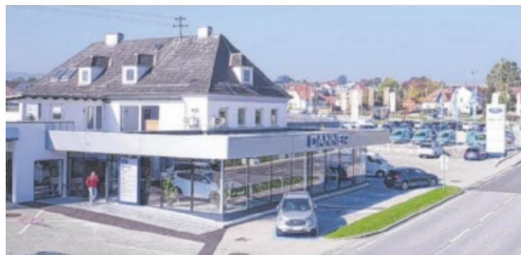
Der Danner-FiDa-Standort in Gaspoltshofen