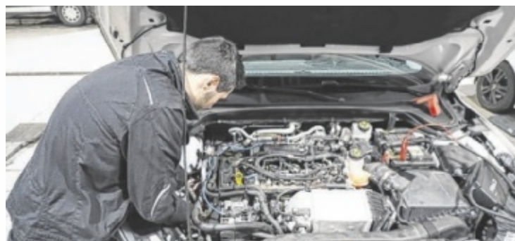
Die alternierende Vier- und Fünftageswoche findet Anklang in der Belegschaft