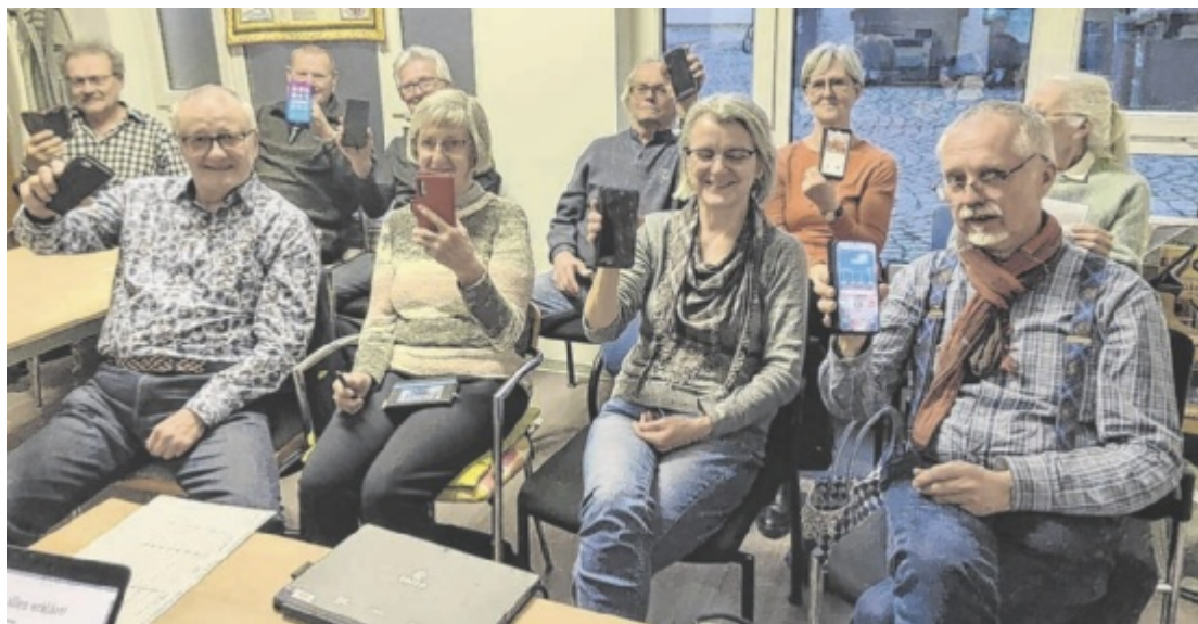
Das Smartphone und seine Möglichkeiten stehen im Mittelpunkt des Handy-Stammtisches für Senioren.

Um den Umstieg zu erleichtern und Senioren die Angst vor der Digitalisierung zu nehmen, kooperiert das Otelto Grieskirchen mit der Volkshilfe. Sie bieten Unterstützung bei Themen rund ums Smartphone an. Bei einem „Handy-Stammtisch“ werden die vielfältigen Einsatzmöglichkeiten und Funktionen auf verständliche Weise erklärt. Woher die anfänglichen Ängste kommen, weiß Harald