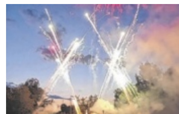
Ein Musikfeuerwerk beim Sonnwendfeuer

PUPPING. Der Chor Cantus Toccare veranstaltet am Montag, 24. Juni, um 19 Uhr ein Mitmachkonzert mit dem Titel „Singing African Together“ im Klostergarten Popping.