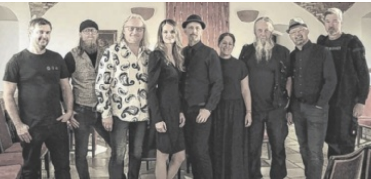
Sänger und Musiker bringen im Eferdinger Pfarrzentrum St. Hippolyt bekannte und unbekannte Lieder von Leonhard Cohan auf die Bühne.