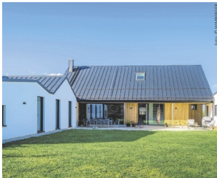
Die ideale Fusion - die Kombination aus Holz- und Ziegelmassivbau vereint Stabilität, Langlebigkeit und natürliche Ästhetik mit hoher Energieeffizienz.