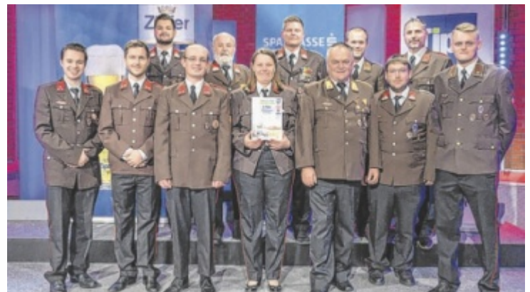
Die Florianis aus Grieskirchen sicherten sich ebenso einen Platz unter den Top 10 der beliebtesten Feuerwehren in Oberösterreich.