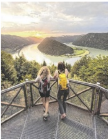
Die 24-Stunden-Wanderung sorgt auch heuer wieder für Geselligkeit, Action und eine sagenhafte Wanderkulisse.

Bereits zum zehnten Mal findet die Veranstaltung rund um das Naturwunder Donauschlinge statt. Heuer wird die Route aus dem ersten Jahr mit einer kleinen Extrarunde wiederholt. Somit warten rund 60 Kilometer sowie 1.660 Höhenmeter Aufstieg auf motivierte Wanderer. Die 24-Stunden-Wanderung am Donausteig soll jedoch kein Wettkampf auf Zeit sein, sondern ein Wandererlebnis der Extreme, wel-