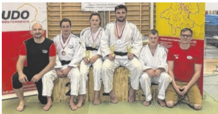
Der Verein Dynamic One war Veranstalter der Judo-Landesmeisterschaften.