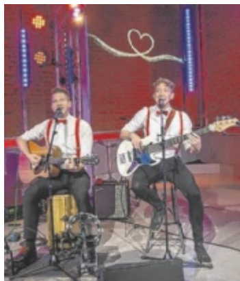
Musikalisch umrahmt wurde der Abend vom Duo The Bowties Light.