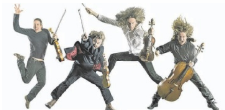
Das SSQ Spring String Quartet tritt in Aschach auf.

die vier Musiker am Samstag, 22. Juni, um 20 Uhr auf die Bühne. Vorverkaufskarten um 23 Euro gibt es im oeticket-Online-shop der Sparkasse. An der Abendkasse kosten sie 25 Euro. Kartenreservierung ist unter Tel. 0699 11196979 oder manfredloimayr@me.com möglich. ■