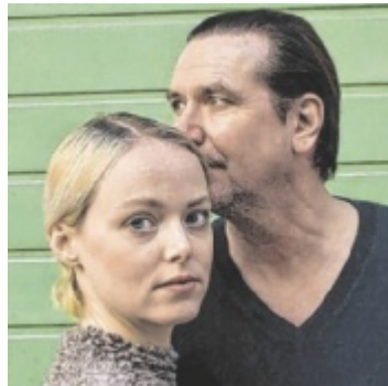
Marie-Luise Stockinger und Michael Maertens am 7. Juli

Wofür es noch Karten gibt ist der Abend (Sonntag, 7. Juli) mit den