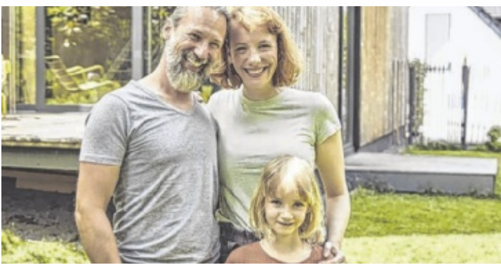
Der Hausbau ist für viele Menschen die größte Einzelinvestition.

„Billig ist beim Bauen nicht immer günstig. Für die Behebung von Mängeln muss man später tief in die Tasche greifen. Man spart