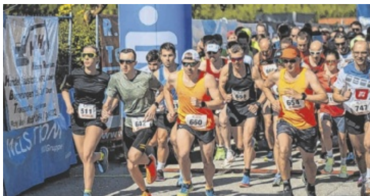
Das war der Start zum Pichler Innbachtauf.