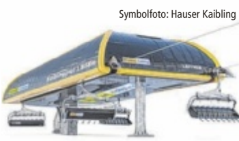
Symbolfoto: Hauser Kaibling