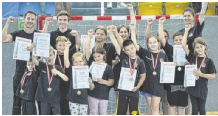
Beim letzten Minuturnier der Saison erhielten alle Urkunden und Medaillen.