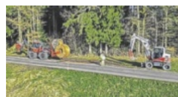
Der Glasfaserausbau in Natternbach schreitet voran.

dem Ausbau erhalten 885 Haushalte in den Gemeinden Natternbach, Neukirchen und Eschenau die Möglichkeit, sich an die Glasfaser-Infrastruktur der BBOÖ anzuschließen. ■