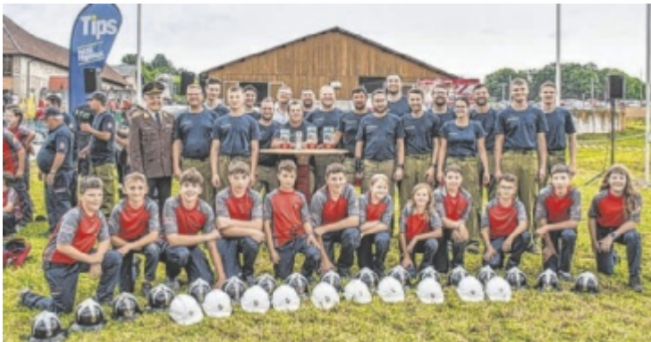
Die Bestplatzierten Aktiv und Jugend nach dem Bewerb in Aubach