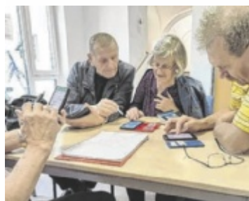
Ängste überwinden, Selbstwirksamkeit fördern und Spaß am Tun sind die Ziele des Workshops.