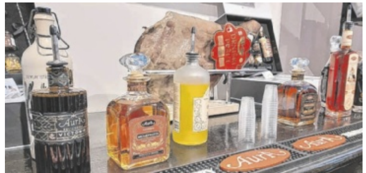
So lässt es sich leben.

kulinarische Vielfalt – von Wein, Schnäpse und Liköre bis hin zu Schokolade, Schinken, Käse und viel mehr. Man kann die Aromen mit allen Sinnen entdecken, denn Kosten gehört dazu. Jedes Produkt steht für absolut höchste Qualität und authentischen Geschmack. ■