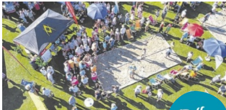
Zuschauer und Fans sind herzlich willkommen.

Der USC Sipbachzell leistet einen großen Beitrag im Vereinsleben der Gemeinde und hat jeden Winter zahlreiche Höhepunkte zu bieten. Beim Kinderskikurs am Kasberg sind an drei Tagen rund 100 Kinder und über 20 Betreuer mit dabei. Kinder ab fünf Jahren lernen dort von ausgebildeten Instruktoren, Übungsleitern und vielen freiwilligen Helfern das Skifahren. Außerdem gibt es vier Kinder- und Jugendskiauffahrten auf die Höss, wo die Verbesserung der Technik und der Spaß im Vordergrund stehen. Auch die Ortsmeis-