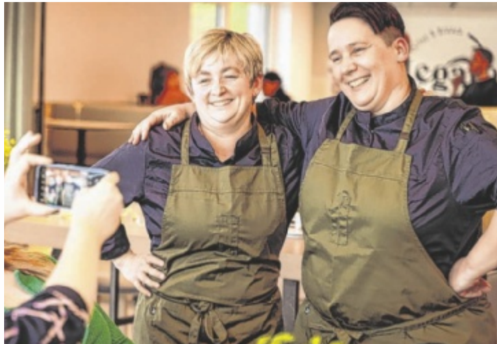
Das Legato erweitert sein Angebot um einen Samstagsbrunch.

Das Angebot wird nun um den Samstagsbrunch erweitert, wo Gäste sich neben Frühstücksklassikern und verschiedensten Ei-Gerichten auf frische Waffeln