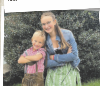
Manuela aus Grieskirchen