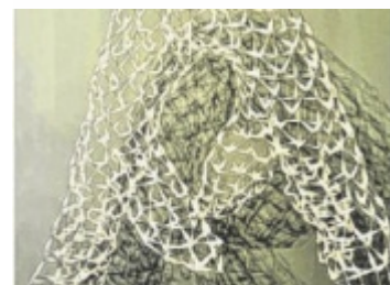
Metallobjekt aus Kanülen

Wels: Sammlertreffen Münzverein Wels, GH Irger "Knödelwirt", ab 17.00