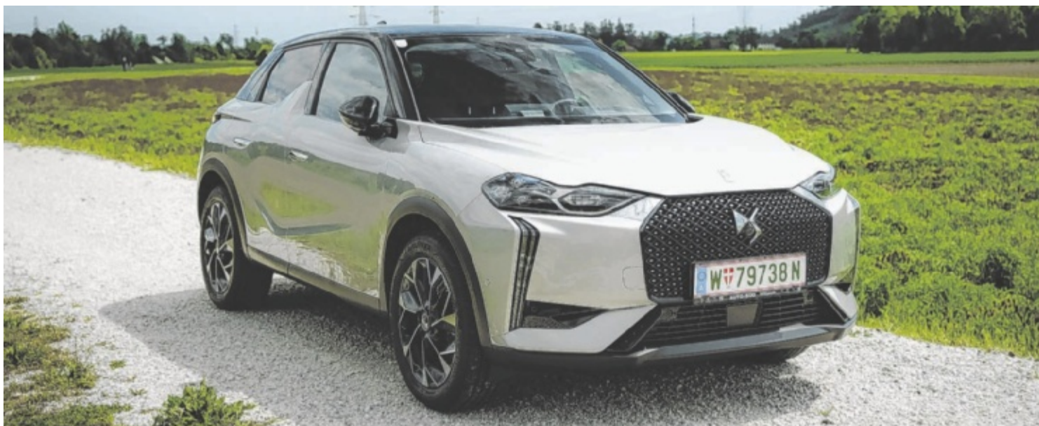
Der DS3 E-Tense Opera ist ab 50.390 Euro zu haben.