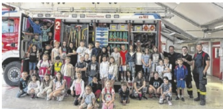
Die Schüler im Zeughaus der FF Marchtrenk

4600 Wels, Vogelweiderstraße 5, Mo bis Do: 14 bis 17 Uhr Tel: 0664 6007215924 jugendservice-wels@ooe.gv.at www.jugendservice.at