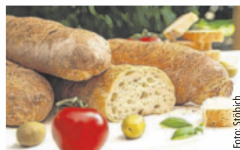
Baguettes der Bäckerei Stöbich

Die Auswahl geht von „Weizensauer“ bis „Italiener“. Das sind die beliebtesten Baguettes: Weizensauer: Ein rustikales Baguette mit saftiger Krume und knuspriger Kruste. Kräuterbaguette: Mit aromatischen Kräutern verfeinert und einer knusprigen Oberfläche. Kräuter-Käse-Baguette: Eine köstliche Kombination aus Kräutern und geschmolzenem Käse. Zwiebel-Speck-Baguette: Herzhaft und würzig mit Zwiebeln und Speckstücken. Wurzelbaguette: Das gedrehte Baguette. Der „Italiener“: Ein mediterranes Baguette mit