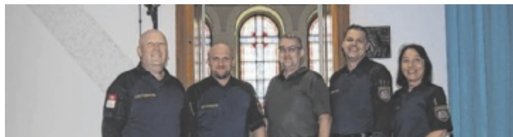
Anstaltskapelle mit den Abteilungsmitarbeitern und dem Anstaltsseelsorger (Mitte)