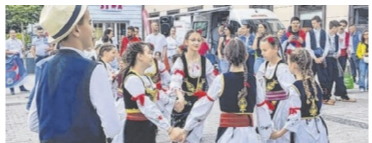
Mitten in der Welser Innenstadt wurde mit Freude getanzt.