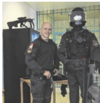
Kommandant der Einsatzgruppe und die Ausstattung

nur einige zu erwähnen – in einer Justizanstalt und des österreichischen Strafvollzugs gewinnen“, erklärt Heigert. Dazu kamen die Vorführungen der Justizeinsatzgruppe. Die Beamten erklärten die Ausrüstung und standen natürlich auch für Fragen rund um die Ausbildung zur Verfügung. ■