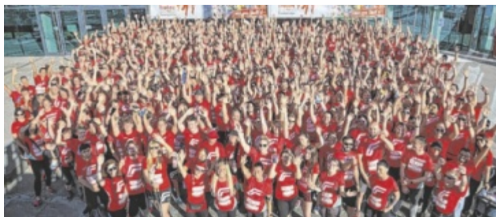
Fronius stellte wieder die größte Gruppe.