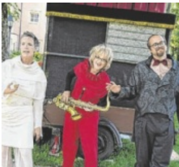
Der „Jedermann“ kommt als Handpuppenspiel zur Aufführung.

heimer Pfarrkirche geöffnet und lädt vor allem Kinder ein. Unter dem Motto „Hallo Mister Gott“ kann man am Sonderpostamt seine Wünsche, Bitten und Sorgen aufschreiben oder Malen. Von 15.30 bis 16 Uhr können Kinder bis sechs Jahre mit ihrer Taschenlampe die Wimmelbibel und die Kirche erkunden. Die Kirchen-Rallye von 16.30 bis 17 Uhr offenbart die Geschichte der Pfarre. Um 17.30 Uhr werden Briefe der Volksschulkinder an den lieben Gott präsentiert und um 18.30 Uhr wird im Kreis getanzt. Es folgen „Antworten von oben“ (19.30 Uhr), eine Meditation (20.30 Uhr), Orgel und Psalmen (21 Uhr), „Musik zur dunklen Stunde“ (22 Uhr) vom Vokalsensemble und zum Abschluss um 23 Uhr gibt es Kirchen-Ziehharmonika-Musik mit Geigenbegleitung. ■