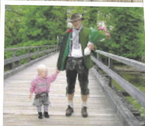
Günter aus Wels