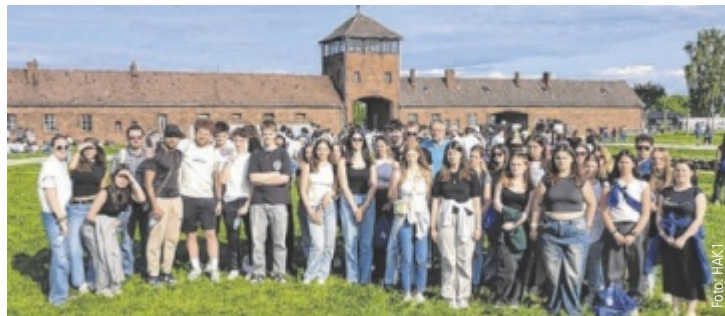
Die Schüler marschierten vom KZ Auschwitz ins Vernichtungslager Birkenau.

Jugendliche aus aller Welt kamen in Polen zusammen, um gemeinsam der Befreiung zu gedenken und ein Zeichen gegen das Vergessen zu setzen – beim drei Kilometer langen Marsch vom Konzentrationslager Auschwitz in das Vernichtungslager Birkenau. Dabei wurde der HAK Wels unter 1100 Teilnehmern aus Österreich die Ehre zuteil, ganz vorne dabei zu sein. Ein weiterer Höhepunkt der dreitägigen Reise, bei der das jüdische Viertel Kazimierz in Kra-