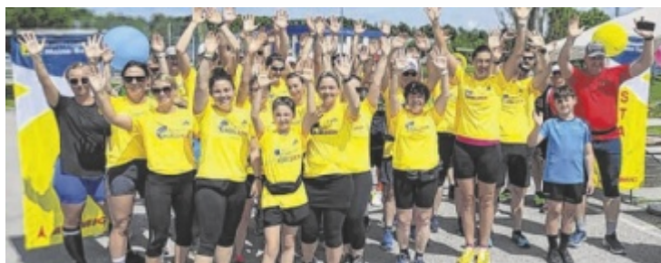
Gemeinsam macht Laufen gleich noch mehr Spaß und hilft sogar!