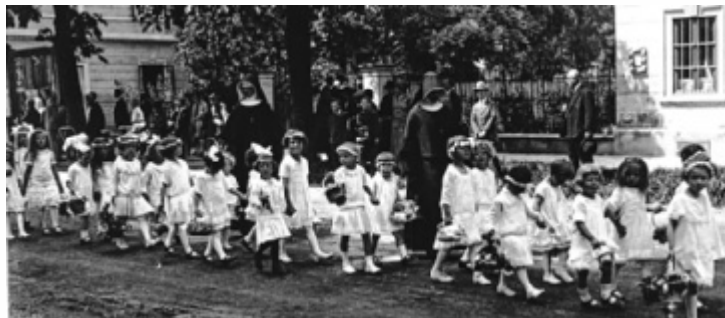
Fronleichnamsprozession im Jahre 1928

Dann folgen neben Feiern mit Speis und Trank, Kinderprogramm, Tombola und Musik. ■