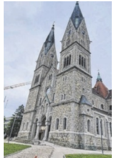
Die Herz Jesu Kirche