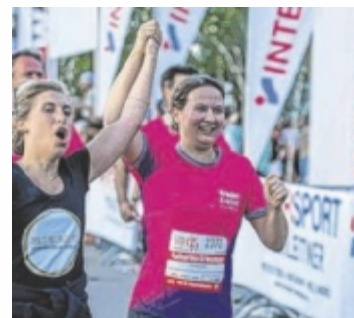
Gemeinsam ins Ziel