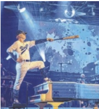
One Night with Elton John

kin“ und die „Imagine Dragons“ auf, während am Samstag, 13. Juli, „The Rolling Stones“, „David Bowie“ und „Elton John“ auf der Bühne performen. Dazu gibt es Side-Events in der Gastro, eine Bühne am Stadtplatz mit Auftritten von Matatu und den unverwüstlichen Hoamspü sowie auch Konzerte lokaler Bands im Schlachthof. ■