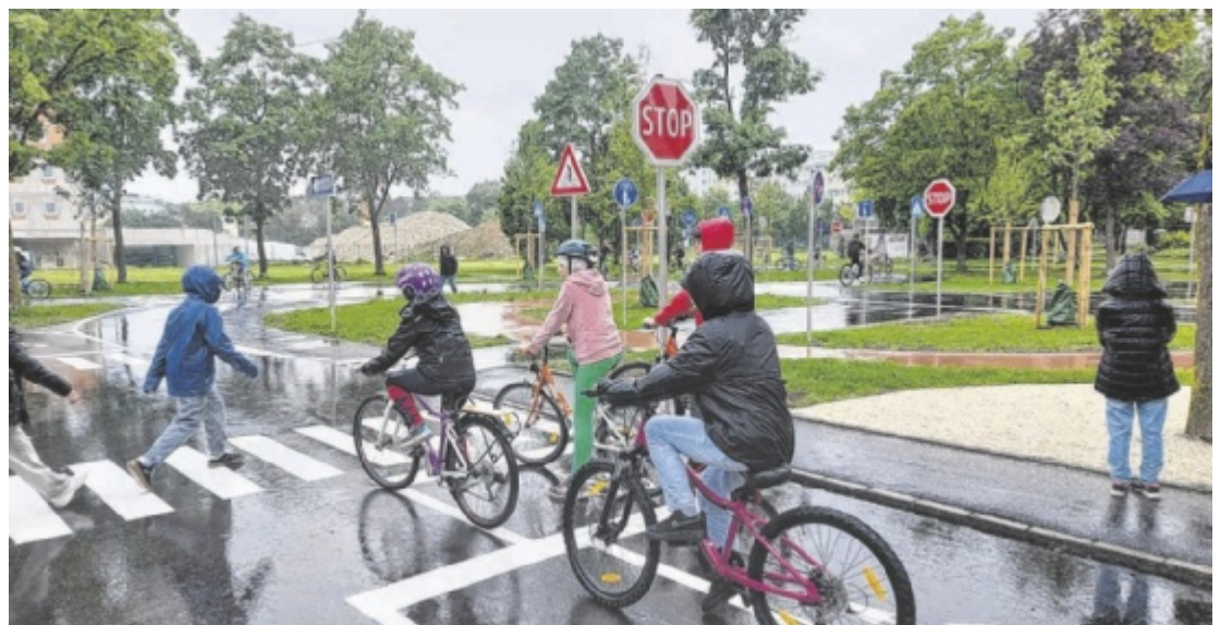
So ist es richtig: Stehenbleiben bei der Stopptafel und Fußgänger queren lassen.

Beim Radweg an der Vogelweiderstraße bei der VFI erfolgt der Lückenschluss. Kosten: 700.000 Euro für 335 Meter. Die Roseggerstraße wird ab Mitte Juli umgebaut und für Radfahrer geöffnet. Kosten: 390.000 Euro.