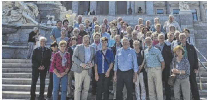
Seniorenbund-Ortsgruppe Frankenburg-Redleiten in Wien