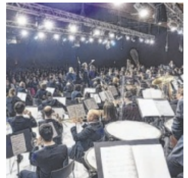
Konzert in der Steinbach-Halle