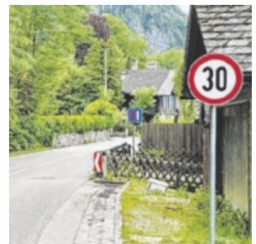
In Steinbach gibt es bereits 30er Zone.

Gerade in den Sommermonaten ist der Attersee Ziel für tausende Tagesplantscher aus den Städten, die ihre Köpfe auf einem freien Fleckerl entlang der B152 abkühlen wollen, dadurch Parkplätze regelrecht überquellen lassen und ihre Fahrzeuge teils ohne Rücksicht sogar auf diesem Multifunktionsstreifen abstellen und damit blockieren und erschwert passierbar machen. Treffen allerdings Fußgänger und Radfahrer auf diesem Streifen aufeinander, wird es ebenfalls zur Gefahrenzone. Radfahrer weichen oft ohne Blick nach hinten auf die Straße aus, um Kollisionen zu vermeiden, wobei man stets hoffen muss, dass nicht gerade ein Pkw oder gar Lkw daherkommt. Das I-Tüpfelchen obendrauf: Rennradfahrer boykottieren diesen Streifen ohnehin. ■