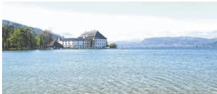
Stiller Attersee mit dem Schloss Kammer

Senden Sie uns Ihre schönsten Fotos aus dem Bezirk per Mail mit dem Betreff „Leserfoto“ an redaktion-voecklabruck@tips.at