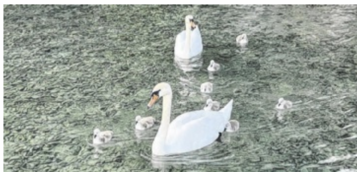
Auf den Seen im Bezirk tummeln sich derzeit auch viele Küken.