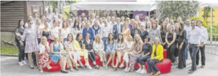
Die Erlöse der Veranstaltung kommen Bedürftigen zugute.