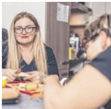
Betreuer und Bewohner geben beim Tag der offenen Tür Einblicke.

Der Tag der offenen Tür im Volkshilfe-Wohnverbund Ampflwang (Stelzhamerstraße 11) bietet einen realistischen Einblick in dieses wichtige Berufsfeld. Bei Snacks, Getränken, Kaffee und Kuchen informieren die Betreuer über ihre erfüllende und sinnstiftende, zu-