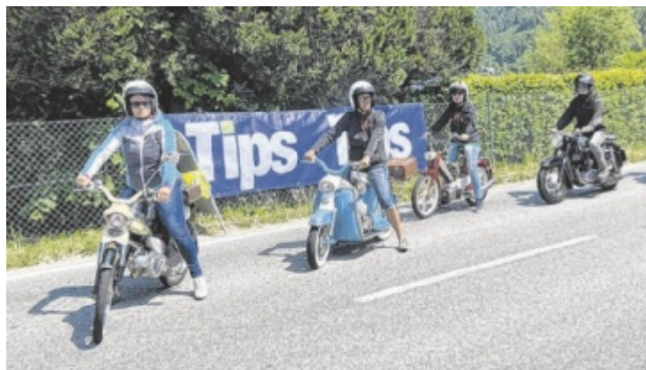
Das legendäre Puch-Treffen findet heuer am Samstag, 8. Juni, statt.

über Seewalchen und Weyregg bis nach Steinbach, wo man sich bei den Fischgrillern in Weißenbach zum „Boxenstopp“ trifft. Gestärkt geht es für die historischen Zweiräder über Unterach und Nußdorf wieder zurück zum Ausgangspunkt, wo Livemusik wartet und man den Tag gemütlich ausklingen lässt. ■