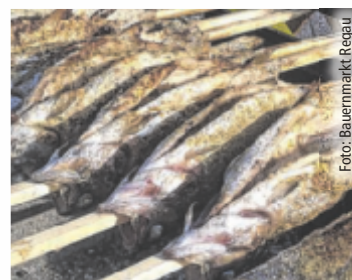
Steckerlfische vom Holzkohlengrill