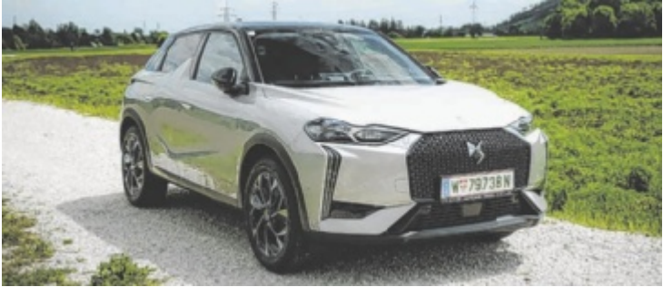
Der DS3 E-Tense Opera ist ab 50.390 Euro erhältlich.

Hier die Kurzbeschreibung des DS3 E-Tense: extravagante Premiummarke mit unverwechselbarem Design. Die neuen LED-Scheinwerfer samt markantem Look, der erweiterte Wabengrill und viele kleine Details stehen dem DS3 gut. Den Rest übernimmt die sportlich-dynamische Seitenlinie mit Coupéanleihen. Das Interieur übernimmt den Schwung des Exterieurs gekonnt, auch hier würde selbst eine Blindverkostung zu einem klaren Ergebnis kommen. Das will was heißen in einer Zeit, wo sich gefühlt eh alles um den Touchscreen und seine Größe dreht. Da dann: 10,3 Zoll groß und in idealer Griff- und