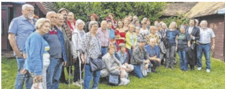
Die Gruppe besuchte das Weinviertel.