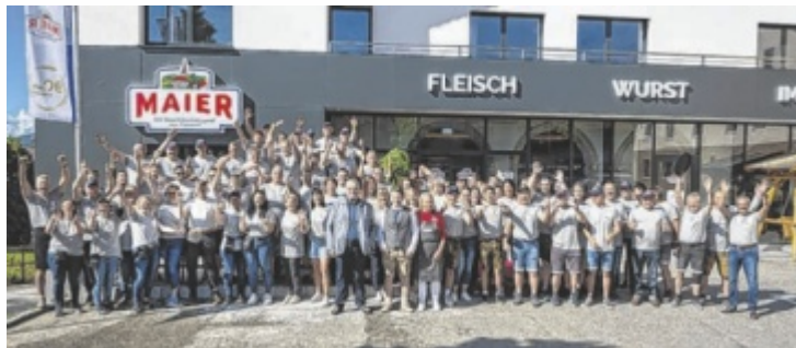
Team und Helfer

Die Jubiläumsfeier begann mit einem traditionellen Frühschoppen. Für gute Stimmung sorgte dabei die Trachtenmusikkapelle Pöndorf. Ein kulinarischer Genuss waren die hauseigenen Fleisch- und Wurstspezialitäten vom Grill. Am Nachmittag fand ein moderierter Festakt statt, mit Gratulationsreden aus Politik und Wirtschaft sowie Segnung der Metzgerei durch den Gemeindepfarrer. Die Live-Band „Vöcklablech“ sorgte für beste Unterhaltung und es gab eine Tanzeinlage der Schuhplattler aus Hip-