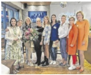
Zu Besuch in der Destillerie