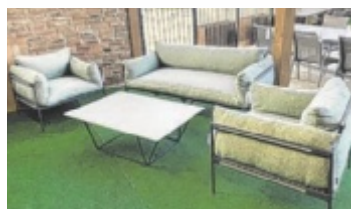
Erstaunlich niedrige Preise

Bänke, Eckbänke, Lounge-Garnituren und auch Keramiktische mit hochwertigen Oberflächen sind bei X-Markt auch zentimetergenau planbar. Der Trend geht zu Gartenmöbeln, die dank hochwertiger Materialien den Indoor-Möbeln in Sachen Komfort