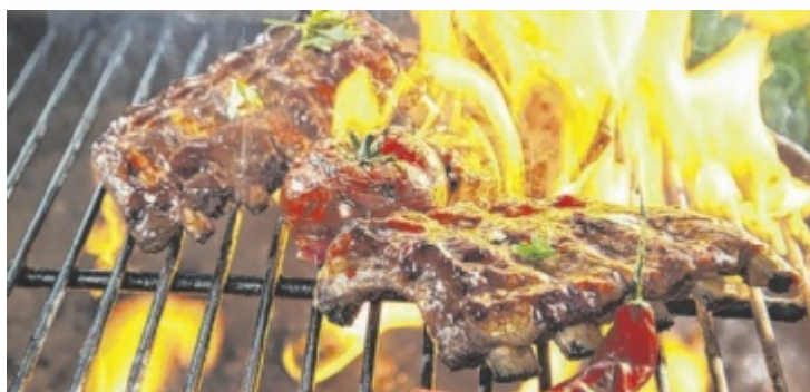
Frische Grillkreationen warten.