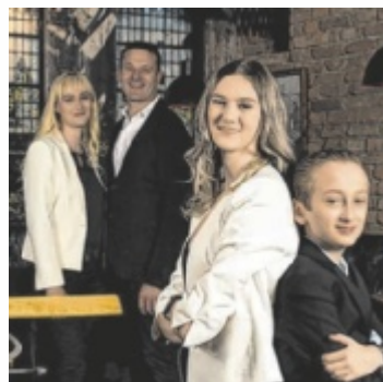
Die „Kitcherias“ freuen sich schon.

REGAU. Das Restaurant Kitcheria in Regau lädt am Freitag, 7. Juni, und Samstag, 8. Juni, zum BBQ-Event in die „Kitcheria-Palm“ ein. Die Besucher dürfen sich auf den hauseigenen Foodtruck mit köstlichen BBQ-Gerichten, eine Cocktailbar mit Showbarkeeper und einen DJ, der an den Plattentellern Urlaubsgefühle weckt, freuen. Ersatztermin bei Schlechtwetter: 14./15. Juni ■