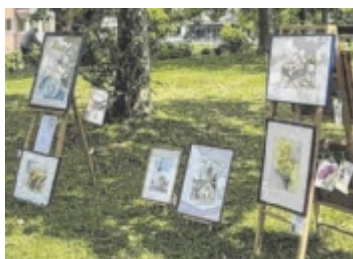
Kunst im Garten 2023