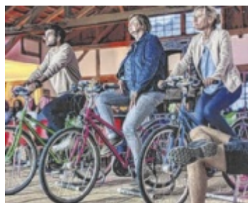
Radeln für den Film