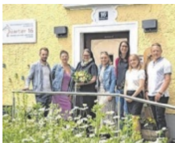
Übergabe der Spende

VÖCKLABRUCK. Mit großem Engagement und Herzblut sammelte das Team der Humanvital Praxis mittels Tombola, Spenden für das Quartier 16 in Vöcklabruck. Diese Einrichtung leistet wertvolle Arbeit in der Unterstützung von Menschen in schwierigen Lebenslagen. Die gesammelten Spenden in Höhe von 500 Euro wurden nun feierlich an das Quartier 16 überreicht. ■