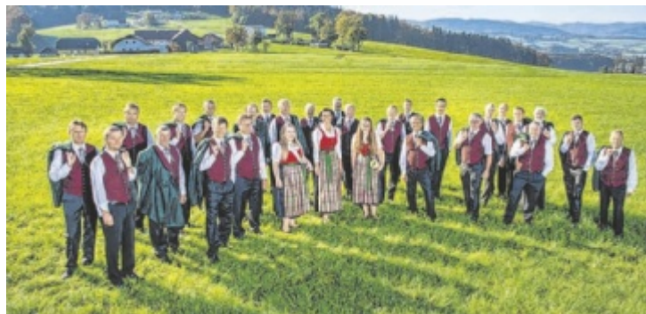
Die Mitglieder der Attergauer Liedertafel

ATTNANG-PUCHHEIM. Am Sonntag, 16. Juni, veranstaltet die Pfarre Maria Puchheim die jährliche Fußwallfahrt von Maria Puchheim nach Attersee. Start ist um 5 Uhr vor der Basilika. Es folgt der Fußweg nach Kammer-Schörfling und die Überfahrt mit dem Schiff nach Attersee. In der Pfarrkirche findet dann um 9.45 Uhr ein Gottesdienst statt. Veranstaltung nur bei Schönwetter.