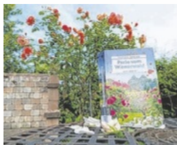
Perle vom Wienerwald