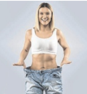
Abnehmen im Liegen: Einfach zur Traumfigur

stimulation, Wärme, Gewebe- drainage und Botenstoffausschüttung sowie eine nachhaltige Anregung der Fettverbrennung. „Wir garantieren eine Reduktion von mindestens fünf Zentimetern bei der ersten Behandlung“, erzählt die Unternehmerin. „Auch bei Lipödem und Cellulite haben wir tolle Ergebnisse, da Wassereinlagerungen abtransportiert werden.“ Wer sich selbst überzeugen will, kann sich einen Kennenlerntermin vereinbaren und eine Probebehandlung für 59,90 Euro sichern. ■ Anzeige