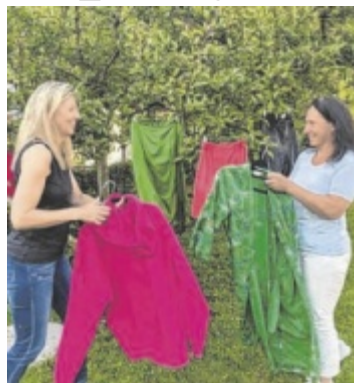
Shoppen mal anders

Ein voller Kleiderschrank und dennoch nichts anzuziehen – das kennen vermutlich viele. Kleidungsstücke, die nie oder kaum getragen werden, weil sie vielleicht einfach nicht passen oder ein Fehlkauf waren, bringt man am besten mit zum Kleidertausch. So funktioniert der Kleidertausch: Im Eingangsbereich werden die mitgebrachten Kleidungsstücke (nur Damenbekleidung) abgegeben. Für jedes Stück erhält man einen Jeton. Nun kann geschmökert und ausgesucht werden, welche neuen Kleidungsstücke man mitnehmen möchte. Getauscht wird ein Je-