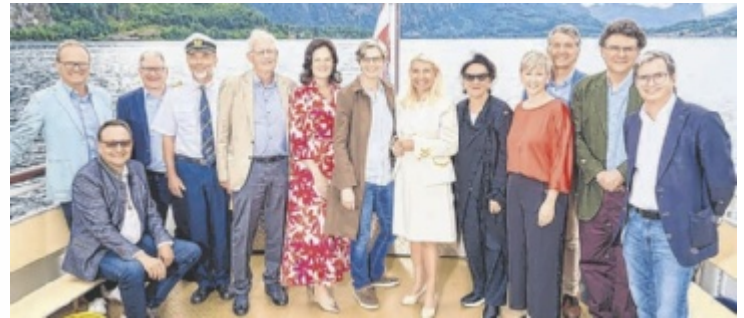
Feierliche Eröffnung des schwimmenden Künstlersalons