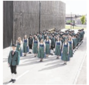
Musikverein Gampern

Rund 50 Musikkapellen aus dem ganzen Bezirk werden sich an diesem Wochenende den Bewertungen der Wertungsrichter stellen. Beginn ist am Freitag um 16.30 Uhr. Ab diesem Zeitpunkt heißt es für 22 Kapellen „Im Schritt Marsch“. Nach dem Festakt um 20 Uhr sorgen die „Mostpressers“ für musikalische Unterhaltung. Am Samstag beginnt das Programm um 16.30 Uhr, bis zum Festakt um 20.15 Uhr werden insgesamt 27 Kapellen im Ortszentrum aufmarschiert sein. An diesem Abend werden einfallsreiche Showprogramme zu sehen sein. Im