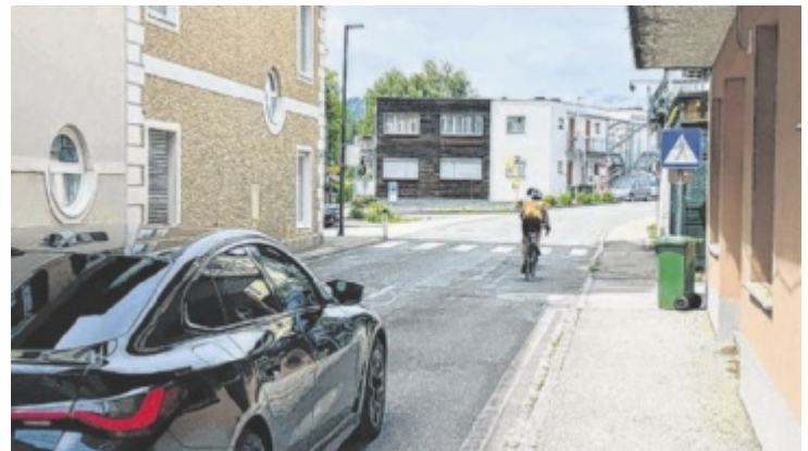
An Engstellen denkt man entlang der B152 über Tempo 30 nach.

„Ich stehe dieser Sache positiv gegenüber. Wenn man durchrechnet, wie viel Zeit man durch diesen 30er verlieren würde, schlägt sich das nicht wirklich relevant zu Buche. Es gibt Abschnitte, die gefährlich sind, das wissen wir alle. Wenn man diese Stellen nun durch ein Tempolimit entschärft, dann ist das im Sinne aller Verkehrsteilnehmer zu begrüßen“, so der Ortschef. Kritik hagelte es zum Thema Radfahren am Attersee auch immer