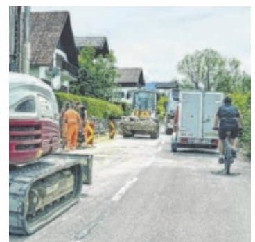
Neuer Multifunktionsstreifen wird in Weyregg gerade gebaut.