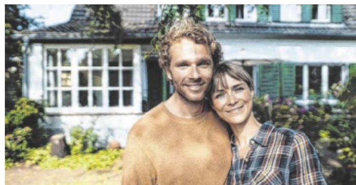
Der Hausbau ist für viele Menschen die größte Einzelinvestition.

„Billig ist beim Bauen nicht immer günstig. Für die Behebung von Mängeln muss man später tief in die Tasche greifen. Man spart