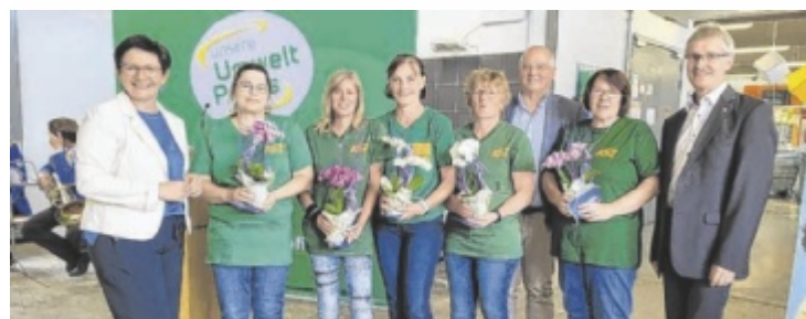
30-Jahr-Feier im ASZ Schwanenstadt

Für die Verköstigung der Gäste sorgten die Mitarbeiter der Stadt Schwanenstadt. Beim Quiz-Rad der Abfallberatung des BAV konnten die Besucher ihr Abfall-Wissen testen und eine kleine Minitonne gewinnen. Für die musikalische Begleitung sorgte eine Partie der Stadtkapelle Schwanenstadt. Unter den Gästen wurden Schwanenstädter Einkaufsgutscheine im Wert von 350 Euro und zehn Freikarten für das Freibad verlost. ■