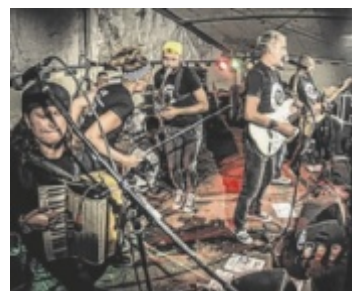
Band „No Sport“