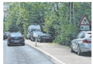
Im Hochsommer wird auf dem Radweg auch rücksichtslos geparkt.