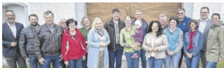
Betriebsbesichtigung am Bauernhof Zehethofer in Engerwitzdorf.