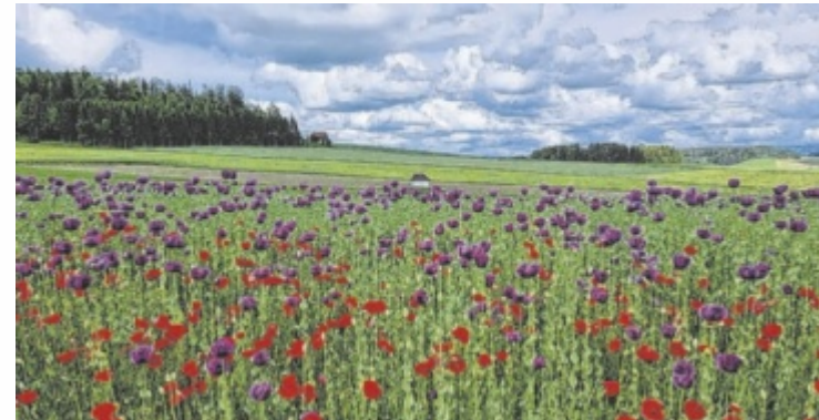
Blühender roter und lilafarbener Mohn in Reichenenthal

URFAHR-UMGEBUNG. Tag für Tag treffen in der Tips-Redaktion per E-Mail faszinierende Aufnahmen der Tips-Leser aus dem Bezirk ein. Wer auch gern sein Lieblingsfoto aus Urfahr-Umgebung hier veröffentlichen möchte, kann dieses (mindestens 350 kB) unter dem Betreff „Leserfoto“ und einer kurzen Beschreibung dazu, wo und wann es aufgenommen wurde, an j.stitz@tips.at senden. ■