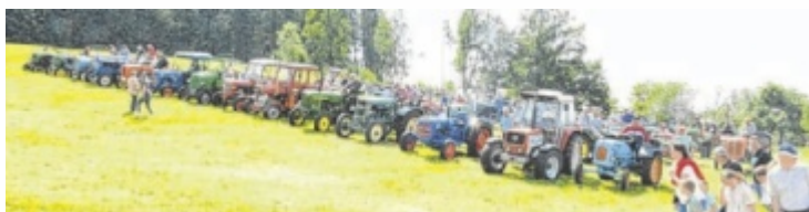
Oldtimertreffen am Sonntag, 9. Juni beim Stoabruch-Fest