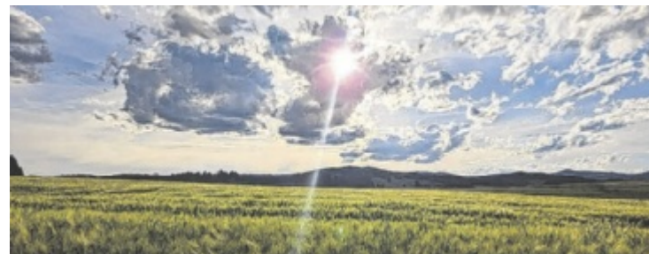
Dieses Bild wurde in Reichenenthal von Silvia Wukounig aufgenommen.