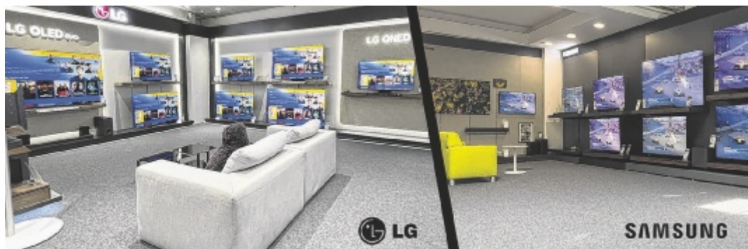
Kunden von Red Zac Kreisel dürfen sich über den modernsten und größten LG Store Österreichs freuen.

Aber nicht nur das Sortiment bei LG wurde großzügig erweitert, auch der Samsung Store wurde vergrößert und lässt keine Wünsche offen. Die brandneuen Modelle der Spitzenmarken LG und Samsung sind ab sofort erhältlich und versprechen faszinierende Bildqualität bei den neuesten OLED-QLED-Fernsehern. Die Modelle sind mit zahlreichen Funktionen und innovativen Technologien ausgestattet und ga-