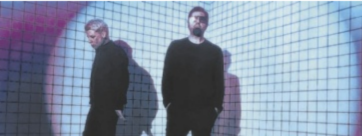
Chino Moreno und Shaun Lopez sind als „Crosses“ im Posthof zu erleben.