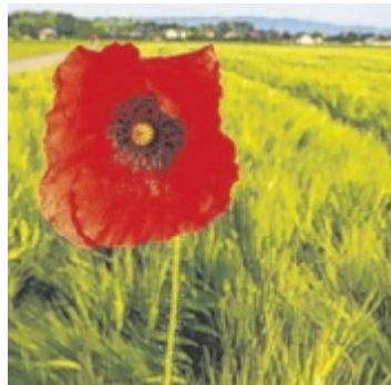
Klatschmohn im Gerstenfeld, geknipst von Gerhard Rammerstorfer, Goldwörth