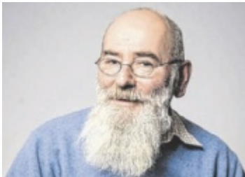
Ernst Hager