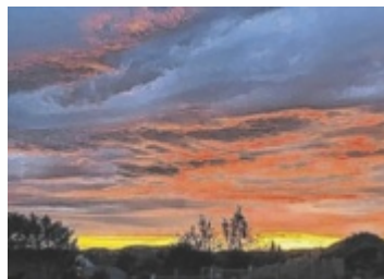
Sonnenuntergang in Vorderweißbach