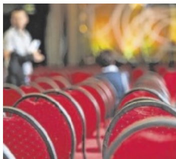
Vorhang auf für Kabarett, Theater, Musik und Kunst im Mühlviertler Hochland.