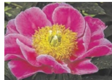
Tolle Blüte aus Ottensheim, eingereicht von Rudolf Hagenauer