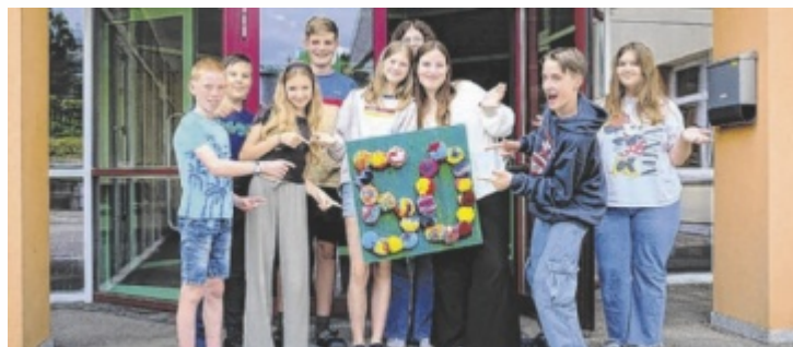
Die MS Vorderweißenbach setzt auf familiäre Atmosphäre.

Von der einstigen Volksschuloberstufe über eine Hauptschule und Tagesheimschule bis hin zur heutigen Mittelschule: in den vergangenen 50 Jahren hat sich der Bildungsstandort in Vorderweißenbach ständig weiterentwickelt. Einer der größten Veränderungsprozesse an der Mittelschule betrifft die Digitalisie-