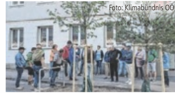
Einige hitzemindernde Maßnahmen wurden bereits gesetzt.