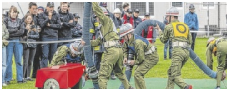
Die Feuerwehrler zeigten Top-Leistungen.