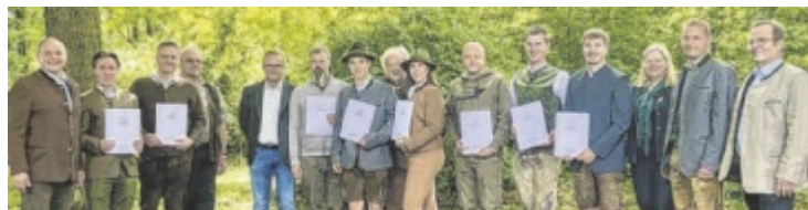
Die Prüfungskommission mit einem Teil der frischgebackenen Jungjäger