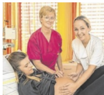
Infos zur Geburt