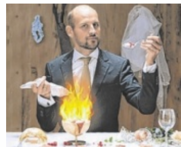
Liebe heiß serviert