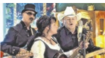
Countrymusik zum Mitsingen und Mittanzen

Samstag, 8. Juni, 19.30 Uhr Petras Genussstube (ehemals Kirchenwirt), Hellmonsödt Karten: 20 Euro (Petras Genussstube, www.john-tc.at , Tel. 0664 6480159)