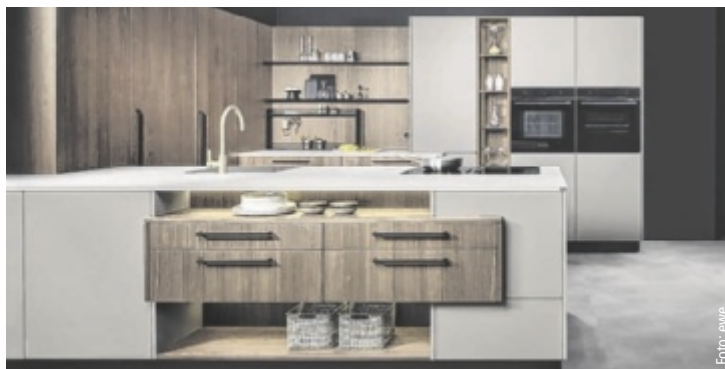
Eilmannsberger präsentiert die neuesten Trends und Designs am Küchensektor.

ROHRBACH-BERG. Als Zentrum für beste Beratung und Planung hat sich Küchenspezialist Eilmannsberger überregional einen Namen gemacht. Was 1996 als Ein-Mann-Betrieb begann, ist heute das größte Küchenstudio im Bezirk Rohrbach. Im weitläufigen Schauraum werden die neuesten Trends und Designs am Küchensektor präsentiert.