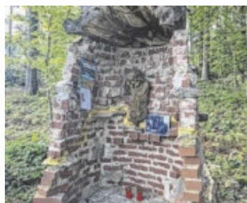
Eine Goldene Narbe zierte jetzt das Jesus-Marterl in Kirchschlag.