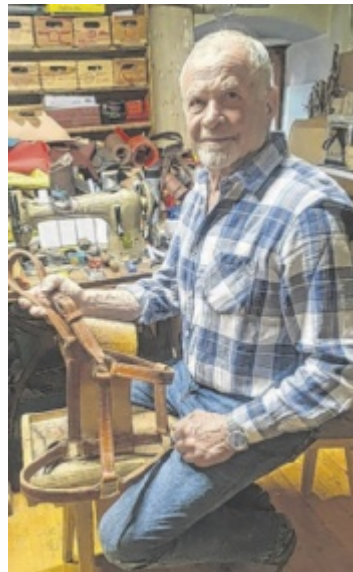
In seiner Werkstatt kann der passionierte Handwerker seinem anspruchsvollen Hobby nachgehen.

Ich kann dabei zur Ruhe kommen, Stress abbauen und währenddessen auch noch einer sinnvollen Beschäftigung nachgehen“, erklärt der talentierte Oberneukirchner, der seit seiner Pensionierung vermehrt Zeit für sein Hobby findet. Zu erwerben sind die