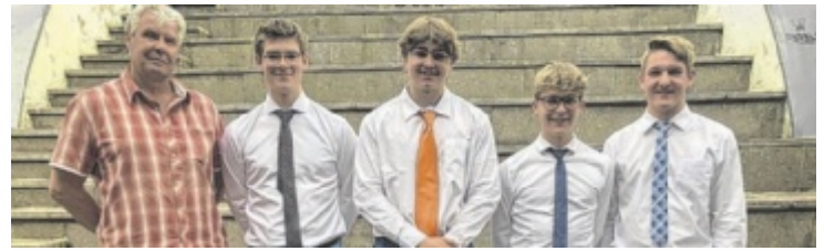
Gold und ein erster Preis für die T-Bones (Klasse Martin Dumphart)