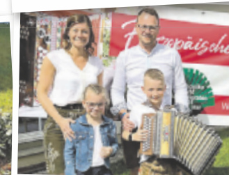
Manuela aus Freistadt