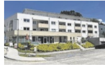
Beim Rottenegger Ze.Ro wird das Jubiläum gefeiert.

ST. GOTTHARD. Der Imkerverein St. Gotthard lädt anlässlich seines 70-jährigen Bestehens am 15. Juni ab 14 Uhr zu einer Feier beim Ze.Ro in Rottenegg. Am Schaubienenstand können die fleißigen Insekten bei Führungen direkt erlebt werden. Interessierte können sich die Arbeits-