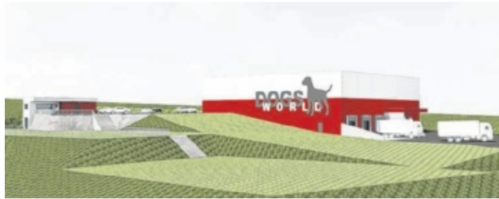
So soll das neue Hundezentrum inklusive Freiflächen aussehen.

Das Fachzentrum umfasst ein Schulungsgebäude für wöchentliche Seminare von renommierten Hundeprofis. Die Kurse reichen von Sachkundenachweisen über Rettungshunde- bis hin zu Therapiehundebildungen. Eine eingezäunte und beleuchtete Freilauffläche, nutzbar täglich von 7 bis 22 Uhr sowie eine Halle mit