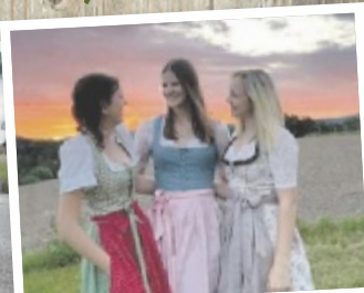
Jana aus Urfahr-Umgebung