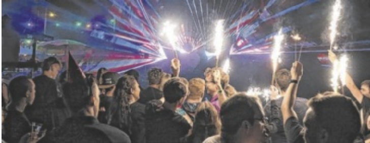
Silvesterstimmung mitten im Sommer erleben!

Die Feuerwehrmitglieder haben sich erneut ins Zeug gelegt und stecken aktuell mitten in den Vorbereitungen. Neben der beliebten schwimmenden Seidel-Bar erwartet die Besucher einige Highlights wie kostenloser Sekt und eine spektakuläre Lasershow um Mitternacht. Die Party eignet sich perfekt, um alte Neujahrs-