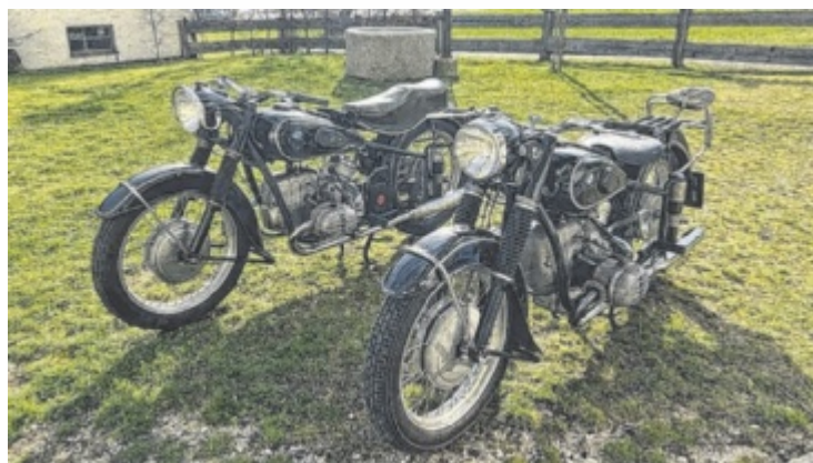
Oldtimer-Treffen in Nussdorf am Attersee

Details beim Verbund Oberösterreichischer Museen unter www.oemuseen.at ■