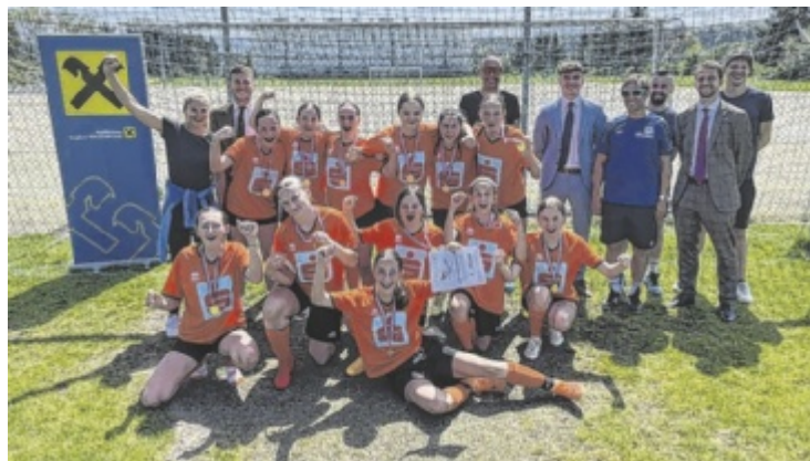
Die Siegerinnen freuten sich über die Medaillen.