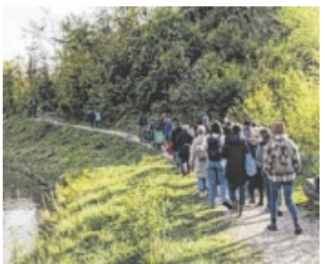
Viele Interessierte