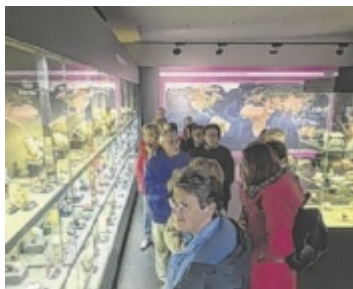
Senioren in der Amethystwelt

Mitspielen bis 21.05.2024/15:00 Uhr www.tips.at/g/23566 oder SMS an 0676 8002525 Text: „23566 Vorname Nachname“