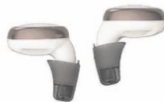
Hörgerät Signia Active

Mikrowelleneffekt, den das Handy durch die hohe Strahlungsintensität im Gehirn auslöst, weil das Mobiltelefon nicht mehr mit dem Kopf in Berührung kommt.