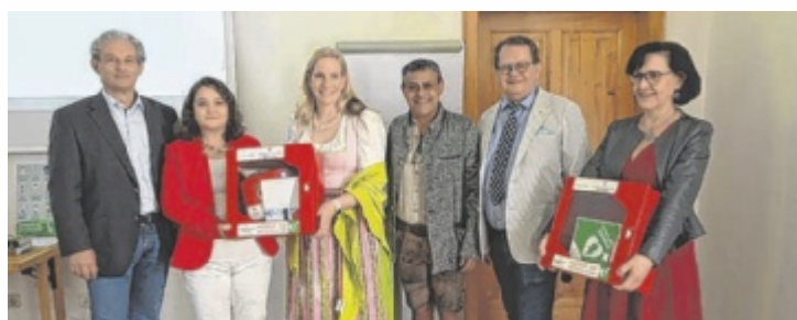
Übergabe der Defibrillatoren

Freitag, 10. Mai, 13 bis 16 Uhr. Kulturzentrum Frankenburg, Kellerweg 4. Eintritt frei ■