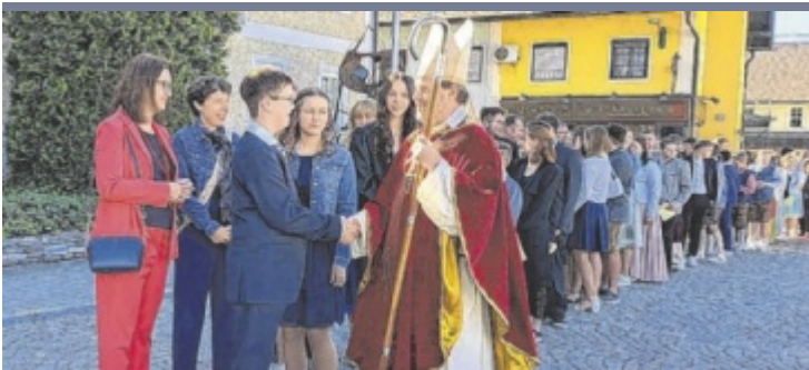
Firmung 40 Firmlinge versammelten sich mit ihren Paten und Familien auf dem Frankfurter Marktplatz, um begleitet von der Marktmusikkapelle in die Pfarrkirche einzuziehen und gemeinsam die Firmung zu feiern.

stützung von Familien in schwierigen Situationen und die Bedeutung von Bildung und Freizeitmöglichkeiten standen im Mittelpunkt der Referate. Zoister hob hervor, dass das Ziel der Kinderfreunde Salzkammergut weiterhin darin bestehe, allen Kindern und Jugendlichen eine sichere und unterstützende Umgebung zu bieten, in der sie sich entfalten und entwickeln können. ■