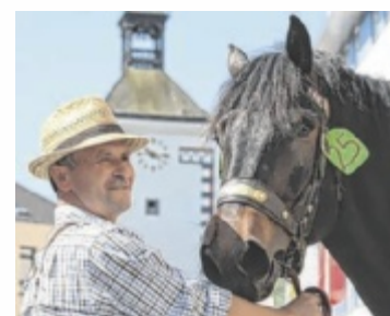
Pferde wohin man schaut

Ein besonderes Highlight ist das Schätzspiel, bei dem geraten wer-