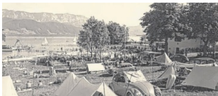
Das Strandbad Attersee um 1960