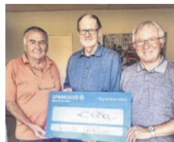
Übergabe der Spende