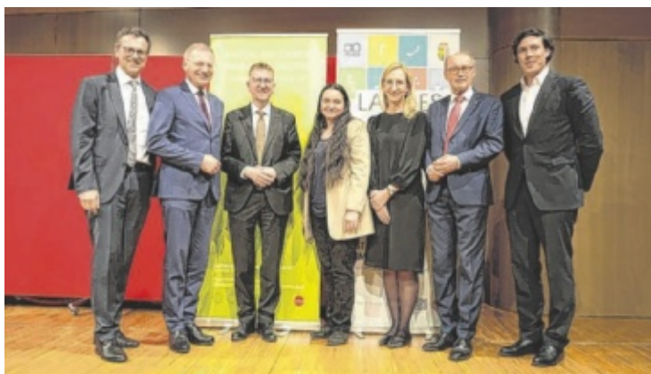
Ehrengäste bei der Eröffnung in St. Georgen im Attergau