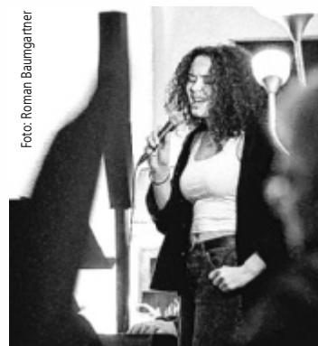
Bei „M-Jam“ darf jeder auf die Bühne.

Bei der Zusammenarbeit zwischen „thursdays4jazz“ und der Landesmusikschule Vöcklabruck steht das „M“ für „Montag“ und findet zweimal im Jahr in Kooperation mit dem Offenen Kulturhaus in der Bar des OKH Vöcklabruck statt. Auf der „Open Stage“-Bühne präsentieren sich nicht nur talentierte Schüler der Landesmusikschule, sondern die Bühne steht auch allen spielbegeisterten Musikern offen. Es gibt eine Songliste und Sheets vor Ort, aber auch mitgebrachte