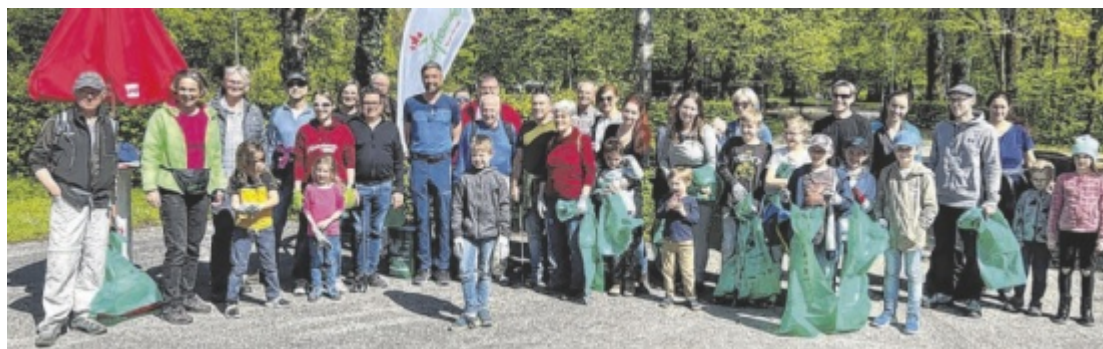
Zahlreiche Freiwillige waren bei der Flurreinigungs-Aktion in der Bezirkshauptstadt Vöcklabruck dabei.