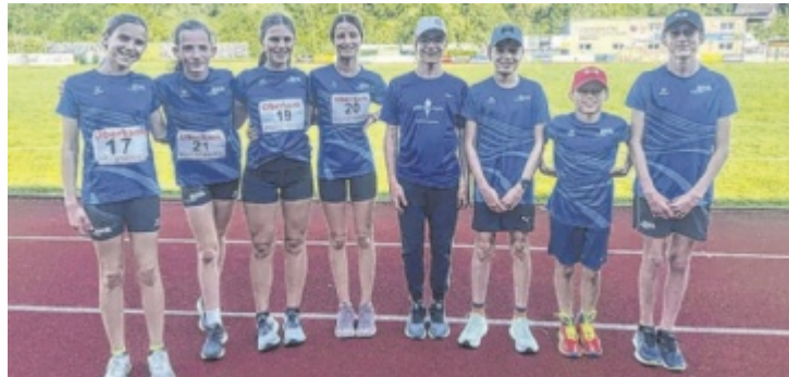
Die Athleten bei den Mehrkampf-Landesmeisterschaften

In Andorf fanden die Landesmeisterschaften der U14-Klasse