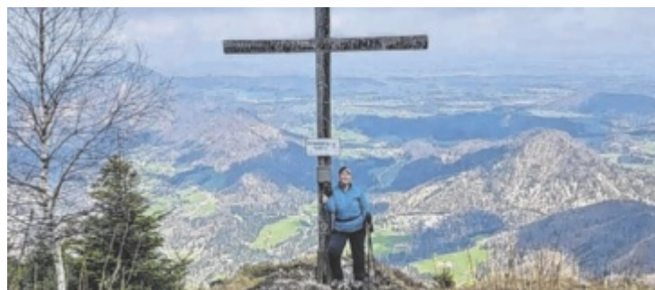
Gipfel erklimmen, Foto machen, hochladen und gewinnen