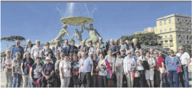
Reise nach Malta Über 70 Seniorenbundmitglieder aus dem Bezirk Vöcklabruck nahmen an der Kulturreise auf die Inselgruppe Malta teil. Vor allem die kulturhistorischen Sehenswürdigkeiten begeisterten die Reisenden.

* Rabatte können nicht addiert werden. Gilt nur auf lagernde Ware. Ausgenommen Knüllerpreise, Jubiläumspreise und S-BUDGET. Solange der Vorrat reicht. Abgabe nur in Haushaltsmengen. Maximal 4 Kisten oder Trays. Stapppreise sind - sofern nicht anders vermerkt - bisherige Maximarkt-Verkaufspreise. Irrtum und Druckfehler vorbehalten. Alle Artikel ohne Dekoration. Kein Verkauf an Wiederverkäufer.