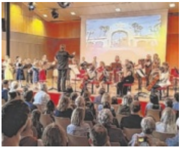
„Lord of the Strings“