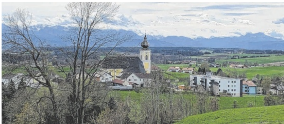
Die Gemeinde Ott nang besteht aus mehreren größeren Ortsteilen. Lange gab es ein gewisses Konkurrenzdenken.