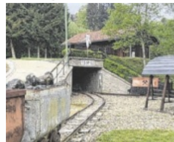
Eingang zum Südfeldstollen

Der Braunkohlenbergbau im Hausruckgebiet reicht bis 1760 zurück (erster Kohlenfund). Die Abbaugebiete um Thomasroith wurden ab circa 1847 durch die Traunthaler Gewerkschaft erschlossen. Thomasroith war bis in die 1920er-Jahre der Mittelpunkt des Hausruckbergbaus, bevor sich dessen Zentrum westwärts nach Ampflwang verlagerte. In den rund 200 Jahren Bergbau wurden im Hausruckgebiet rund 67 Millionen Tonnen Braunkohle gefördert. Die erhaltenen Teile des Südfeldstollens wurden 2004/05 vom Bergknappenverein Thomas-