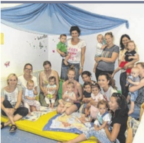
Revival Eine Spielgruppe des Eltern-Kind-Zentrums Attang-Puchheim, die 2018 gegründet wurde, erlebte ein Revival. Die mittlerweile sechs Jahre alten Kinder hatten viel Freude dabei. Zum Abschluss wurden gemeinsam Spielgruppenlieder gesungen.