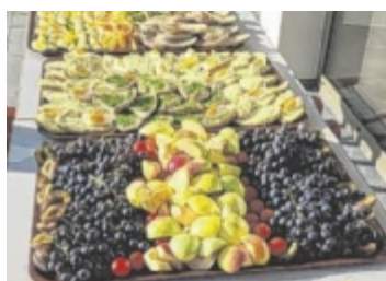
Gesunde Jause von den Ortsbäuerinnen für die Schüler

Mit engagierten Müttern werden am Tag der gesunden Jause bereits in den frühen Morgenstunden Brot gebacken, Aufstriche zubereitet, Apfelsmus gekocht, Joghurt gerührt, Knuspermüslis gebacken, Eier gekocht und vieles mehr. Dank der Unterstützung des Lehrpersonals herrscht auch bei der Verteilung Disziplin, so dass alle Schüler nach der Pause gesättigt und zufrieden in