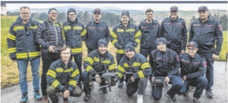
Neue Drohne Die FF Wilding-Mühlberg konnte eine neue Einsatzdrohne in Dienst stellen. Diese bietet Unterstützung bei der Erkundung von Bränden, der Suche nach vermissten Personen und anderen Aufgaben.