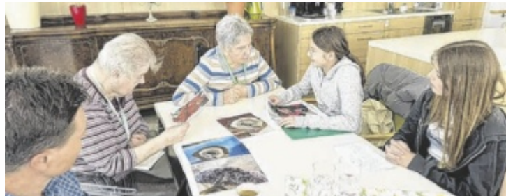
Bewohner und Schülerinnen im Gespräch

OTTNANG/H. Schüler der Mittelschule Wolfsegg lernen im Rahmen des Sozialprojektes „genial sozial“ das Leben im FraDomo Ott nang kennen. Dabei führen sie mit den Bewohnern des Alten- und Pflegeheimes der Franziskanerinnen von Vöcklabruck verschiedene Workshops durch.