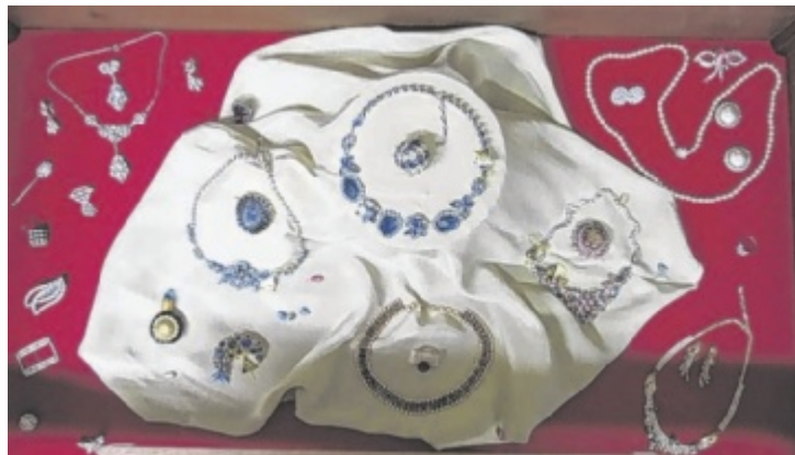
Gablonzer Schmuck im Museum der Heimatvertriebenen in Vöcklabruck