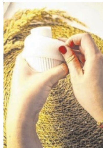
Arbeit mit Hand und Herz

keit völlig abschalten und vergesse dabei alles um mich herum“, erzählt die Pergerin. Da sie enorm viele positive Rückmeldungen von Freunden und Bekannten für ihre geschmackvollen Erzeugnisse bekam, fasste sie Ende des Vorjahres den Entschluss, sich nebenberuflich selbstständig zu machen. Unter dem Markennamen Jazzys stellt sie dabei etwa stilvolle Figuren auf Basis von Gips her.