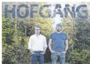
„Hofgang“ begeisterte Kinobesucher in der ganzen Region.