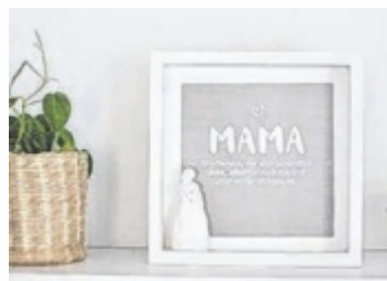
Bilderrahmen mit schönen Texten

stimmen aber Intuition und Bauchgefühl, wie ein künftiges Produkt aussehen wird. „Der Entstehungsprozess allein ist schon so wunderschön – wenn dann etwas Geschmackvolles herauskommt, an dem auch andere Freude haben, dann ist das das i-Tüpfel für mich“, sagt die Pädagogin.