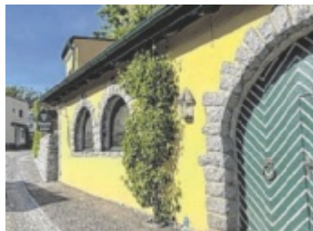
Der Mannerkeller in der Mühlsteinstraße öffnet samstags wieder.

„Für mich persönlich ist der Mannerkeller ein Lieblingsplatz. Ich fühle mich hier seit meiner Kindheit wohl, werde an die schöne Vergangenheit erinnert,