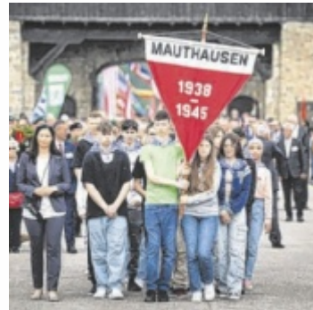
Mehr als 3.000 Jugendliche nahmen an der Befreiungsfeier teil.

„Das Streben nach Gerechtigkeit ist das Fundament einer demokratischen Gesellschaft. Im Nationalsozialismus wurde das Rechtssystem systematisch missbraucht mit dem Ziel, die Macht des Staates zu stärken und die individuellen Freiheiten und