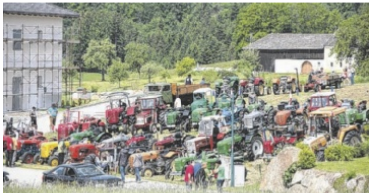
Bereits traditionell findet wieder das Oldtimertreffen statt.

Am Montag, 20. Mai, wird dann zum traditionellen Pfingstkirtag geladen, los geht's bereits um 8 Uhr. Bei der Großveranstaltung ist wieder mit einem hohen Be- sucheransturm zu rechnen. Eine der absoluten Höhepunkte wird