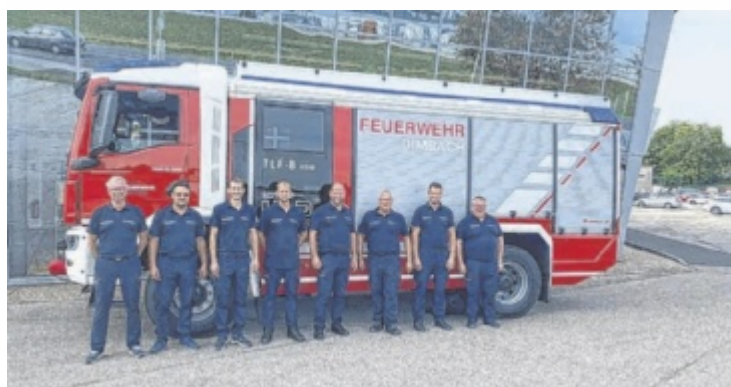
Das Kommando der FF Dimbach vor dem neuen Fahrzeug

Man darf sich auch wieder auf ei- nige Direktvermarkter freuen, auch das Kunsthandwerk wird nicht zu kurz kommen. „Es sind wieder alle auf den Beinen und helfen mit“, freut sich Bürger- meister Manfred Fenster auf die beliebte Veranstaltung. ■