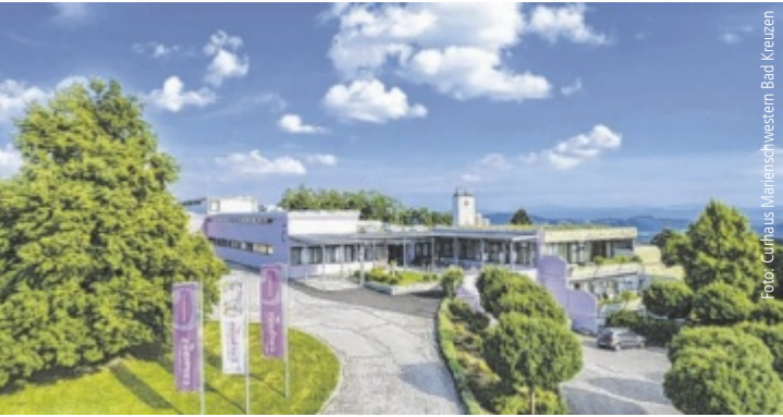
Das Curhaus Marienschwestern in Bad Kreuzen erfreut sich großer Beliebtheit.