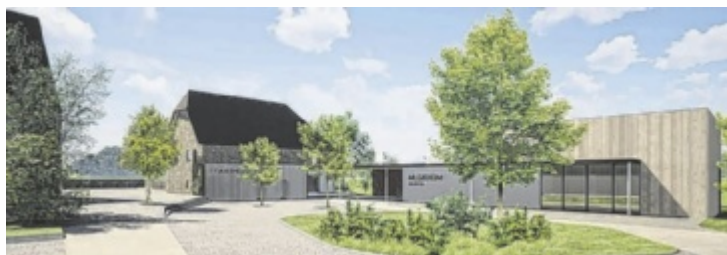
Musikverein und Pfarre wachsen durch Neubau enger zusammen.

Am 17. Mai wird mit dem Spatenstich der Bau für einen neuen Probenraum des Musikvereins Pergkirchen gestartet, ein lang ersehntes Projekt, das nach jahrelanger Planung und Überwindung zahlreicher Hürden nun Realität wird. Dieses Vorhaben ist aber nur ein Teil einer größeren Initiative, die auch den Umbau des Pfarrhofes und die