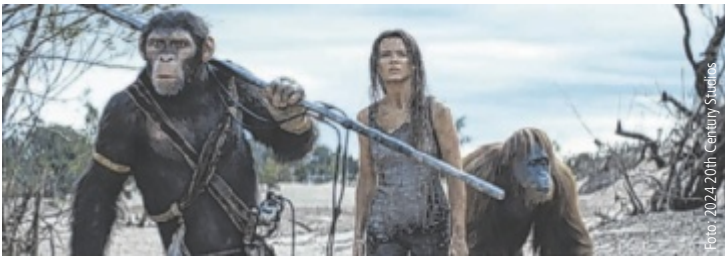
Die Zukunft der Affen – und der Menschen – steht auf dem Spiel.