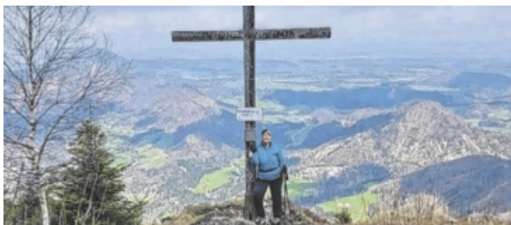
Gipfel erklimmen, Foto machen, hochladen und gewinnen