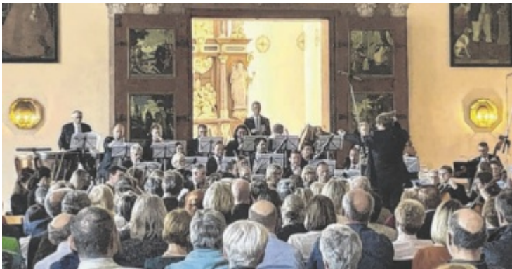
Hörgenuss mit dem Amstettner Symphonieorchester