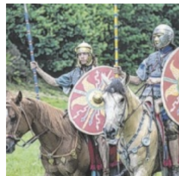
Living History in Dimbach

Zahlreiche Aussteller und Besu- cher aus ganz Österreich besuch- ten bereits im Vorjahr die mehr- tägige Veranstaltung. Dabei wurde die Geschichte von 4.000 vor Christus bis 1.500 nach Christus in verschiedenen Epo- chen und Kulturen präsentiert. Vier Tage lang werden auch heuer die Aussteller nach ihrer darge- stellten Zeit in Dimbach in Zel- ten wohnen. Unterstützung gibt es wieder von Dimbacher Ver- einen, die für einen reibungslo-