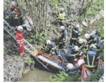
Gemeinsame Übung der FF und des

Wie schon voriges Jahr fand heuer der zweite Übungstag der FF Ried in der Riedmark statt. Gemeinsam mit dem Roten Kreuz St. Georgen an der Gusen durften die Gruppen jeweils drei Szenarien abarbeiten: Bei einem Brand eines landwirtschaftlichen Objekts galt es, zwei verletzte Personen aus dem verrauchten Gewölbe zu retten. Bei einem gestellten Verkehrsunfall