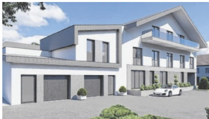
Der Baubeginn ist für den Herbst 2024 geplant.

Im Gebäude werden ein Arzt, mehrere Therapeuten, ein Optiker, ein Blumengeschäft und acht Wohnungen Platz finden. Darüber hinaus soll auch wieder ein Gastronomiebetrieb eröffnen. „Es gibt da auch bereits einen Interessenten, wir sind zuversichtlich, dass das was wird. Die Gastrotflächen im Xaverlhaus kann er auch als Zusatzräumlichkeiten für größere Feiern etc. nutzen“, freut sich Bürgermeister Manfred Fenster. „Alle Unternehmer, die sich bereits entschlossen haben, ein Geschäftslokal zu mieten, sind für Dimbach enorm