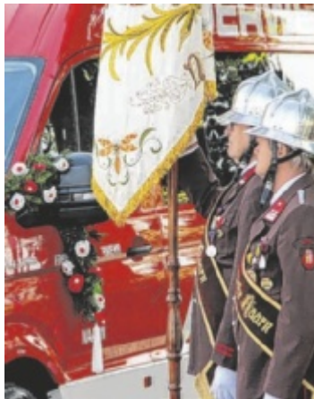
Segnung des MTF

NAARN. Im Zuge des Maibaumaufstellens und der Florianimesse, fand die Fahrzeugsegnung des neuen MTF der FF Naarn statt. Um 9 Uhr fand gemeinsam mit den Feuerwehren Naarn, Au/Donau und Holzleiten, sowie der Musikkapelle Naarn der Einzug am Vorplatz des Pfarrhofs statt. Im Anschluss an die Florianimesse fand die Fahrzeugsegnung des MTF statt. Danach wurde traditionell der Maibaum aufgestellt und ein Frühschoppen veranstaltet. ■