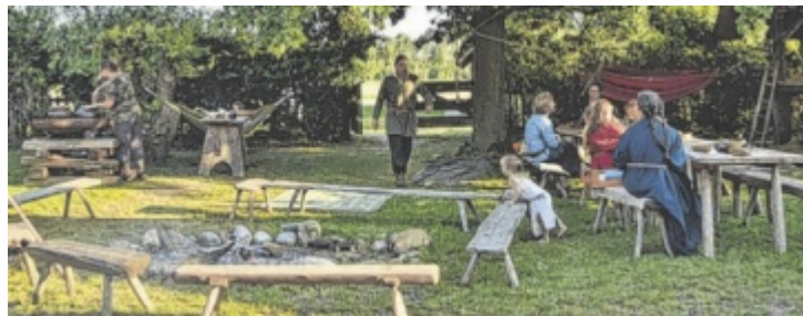
Das Keltendorf Mitterkirchen ist bei der Aktionswoche dabei.

Der Heimatverein Katsdorf lädt am 15. Mai, um 17 Uhr, zum ge-