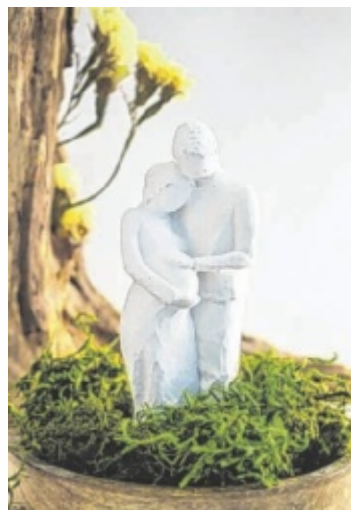
Figuren aus Gips