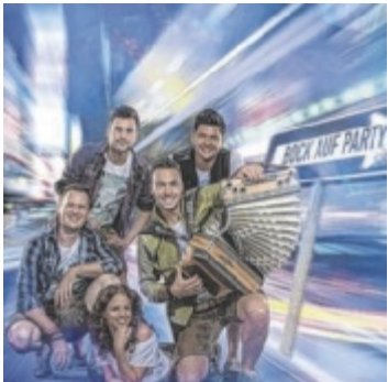
MyBock am Samstag

Die Vorbereitungen der FF Klam für eines der beliebtesten Festln in der Region laufen bereits auf Hochtouren. Am Samstag, 18. Mai, werden ab 20 Uhr MyBock für Partystimmung sorgen. Am Sonntag, 19. Mai, ab 11 Uhr wird zum zünftigen stimmungsvollen Frühschoppen mit der Marktmusikkapelle Klam geladen. Am Abend darf man sich dann auf die bekannte Mühlviertler Partyband Rockies freuen. Die lässige Atmosphäre können die Besucher entweder im Brauereigelände unter der groß-