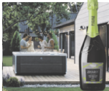
Für Kenner gibt es edlen Prosecco aus Venetien zur Verköstigung.

HotSpring Whirlpools bieten den optimalen Rückzugsort zur Stressbewältigung und Regeneration, denn regelmäßiges Baden in warmem, sprudelndem Wasser kann müde Muskeln entspannen, den Geist beruhigen und das allgemeine Wohlbefinden fördern, all das