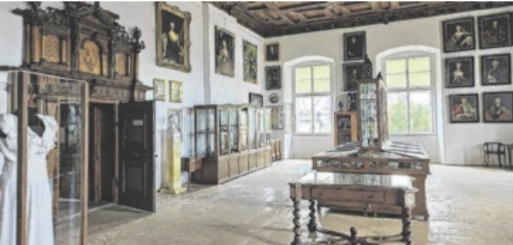
In den Räumen des Stadtmuseums und des Starhemberg'schen Familienmuseums erhalten die Besucher Einblicke in die Vergangenheit Eferdings.

EFERDING. Mit Mai hat das Eferdinger Museum seine Türen wieder geöffnet. Im Obergeschoß des Schlosses Starhemberg warten auf die Besucher verschiedenste Exponate, die einen Blick auf die Geschichte Eferdings bieten. Im Familien-