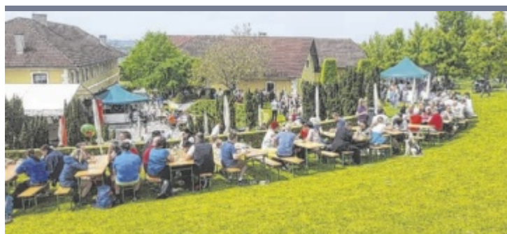
Maifest in Scharten Zum Maifest zog es hunderte Besucher aus ganz Oberösterreich zum Firlingerhof in Scharten. Mit einer Hüpfburg und Kinderschminken wurde dort auch den Jüngsten etwas geboten.

ALKOVEN. Die Bücherei Alkoven veranstaltet am Mittwoch, 15. Mai, ab 14 Uhr ein Erzählcafé mit dem Titel „Langes Fädchen, faules Mädchen“. Bei Kaffee und Kuchen werden Erinnerungen ans Handarbeiten ausgetauscht.