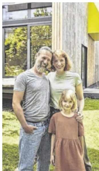
Bauen und Sanieren schafft Zukunft und Sicherheit.

Durch energieeffizientes Bauen und Sanieren kann ein aktiver Beitrag zum Klimaschutz geleistet werden – zum Beispiel durch die durchdachte Verwendung von Materialien wie Holz, Stein, Keramik, Glas. Gerade jetzt ist auch die richtige Zeit, Investitionen und Sanierungen bei bestehenden Leerständen vorzunehmen. Das kann einen starken Beitrag zu weniger Bodenversiegelung leisten.