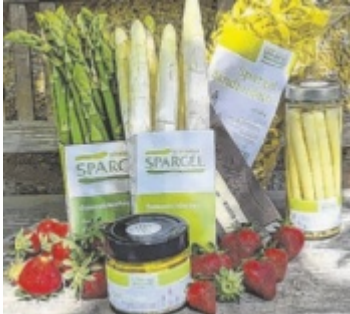
Mit Tips verschiedene Spargel-Produkte gewinnen