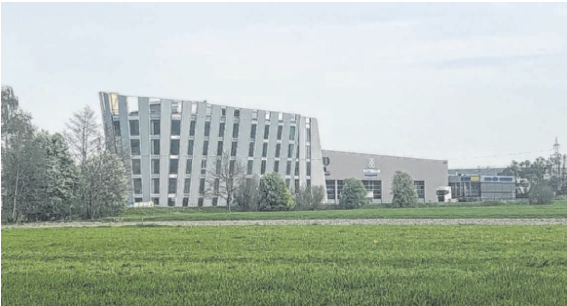
Die Außenansicht des neuen Montagezentrums (Halle rechts) und des Bürogebäudes (links) von Pöttinger Entsorgungstechnik in Taufkirchen an der Trattnach