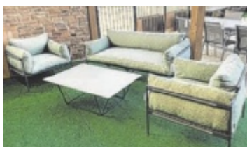
Erstaunlich niedrige Preise

Info: X-Markt in Wels, Jasminstr. 5 (Nähe SCW), Tel. 07242 60044, www.x-markt.at (Montag bis Freitag, 9 bis 18, Samstag 9 bis 17 Uhr). ■ Anzeige