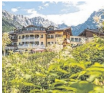
Familienurlaub in Salzburg

Bloß keine Zeit verlieren, denn zu erleben gibt es viel: Hat man sich und den Nachwuchs erst einmal am reichhaltigen Frühstücksbuffet des ***Hotel & SPA Urs-lauerhof in Maria Alm gestärkt, hält einen auch schon nichts mehr drinnen. Nicht weit vom Hotel entfernt lässt sich der Prinzenberg Natrun mit seinem Hochseilgarten erobern oder mit der Sommerrodelbahn am Biberg ins Tal hinuntersausen. Und bevor es zum Abendessen geht, lädt der hoteleigene SPA-Bereich mit Außenpool zum Planschen und