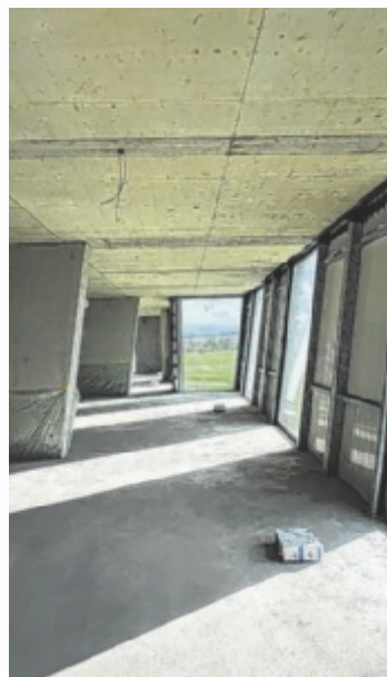
Innenansicht kurz vor der Fertigstellung

Flexibel zu bleiben ist auch wichtig, um sich schnell an neue Gegebenheiten anpassen zu können und so auch in Zukunft erfolgreich zu sein.