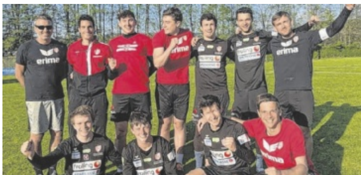
Das Team des UFG Grieskirchen-Pötting: Sieg gegen Freistadt, Niederlage gegen Vöcklabruck