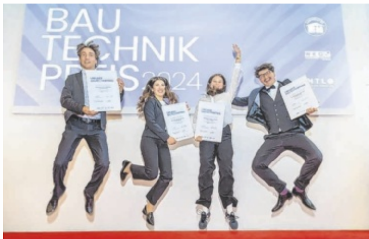
Die glücklichen Preisträger des Bautechnikpreises 2024....

Denn der Wettbewerb ist ein Praxistest, bei dem die Nachwuchsbautechniker ihr erlerntes Wissen anwenden müssen. In-