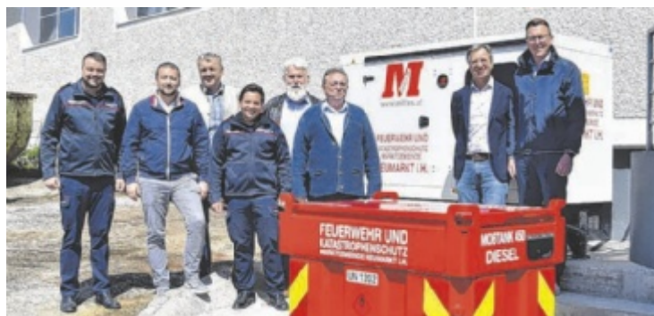
Die Vertretung von Feuerwehr und Gemeinde mit den neuen Geräten

NEUMARKT. Um die kritische Infrastruktur zu sichern, ist ein stationärer 60 Kilovoltampere-Stromgenerator angekauft worden. Der Generator startet bei einem Stromausfall innerhalb von zehn Sekunden automatisch. Nach weiteren zehn Sekunden ist das gesamte Feuerwehrhaus wieder mit Strom versorgt. Die Kosten für das neue Notstromaggregat wurden zu 70 Prozent von der Marktgemeinde und zu 30 Prozent vom Landesfeuerwehrkommando übernommen. In 250 Stunden wurde die Installation der Anlage vorbereitet. Zusätzlich hat die Marktgemeinde eine mobile Tankstelle angeschafft. Sie ist speziell für den Katastrophenschutz sowie für Großeinsätze konzipiert und kann zum Einsatzort gebracht werden. ■