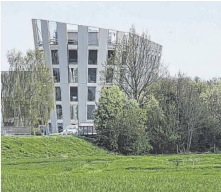
Außenansicht des innovativen Bürogebäudes

Die Halle beeindruckt mit ihrer imposanten Höhe von 14 Metern, die von Holzleimbinderträgern überspannt wird, was eine stützenfreie 32-Meter-Breite er-