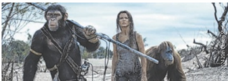
Die Zukunft der Affen – und der Menschen – steht auf dem Spiel.