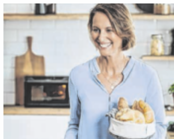
100 Jahre Resch&Frisch

WELS. Seit einem Jahrhundert steht Resch&Frisch für Qualität, Tradition und Innovation. Was einst als bescheidene Ein-Mann-Bäckerei im Herzen von Wels begann, ist heute ein europaweit angesehenes Unternehmen.