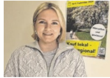
Die OÖVP Bezirk Eferding startet Neuauflage der beliebten Sammelpass-Aktion für Radfahrer

Radfahrer haben die Gelegenheit, Stempel bei teilnehmenden lokalen Nahversorgern und Dienstleistern zu sammeln. Durch regionale Einkäufe unterstützen sie nicht nur die heimische Wirtschaft, sondern haben die Chance, attraktive Gewinne zu ergattern. „Mit unserer Sammelpass-Aktion möchten wir nicht nur die Bedeutung der regionalen Nahversorgung betonen, sondern auch das Fahrradfahren als umweltfreundliche und gesunde Fortbewegungs-