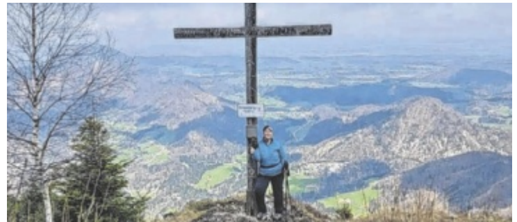
Gipfel erklimmen, Foto machen, hochladen und gewinnen