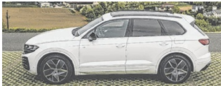
Der VW Touareg R eHybrid ist ab 94.890 Euro zu haben.

Vielleicht weil man es kann? Sein Konto bis auf den letzten Cent abzuräumen, um statt eines jungen