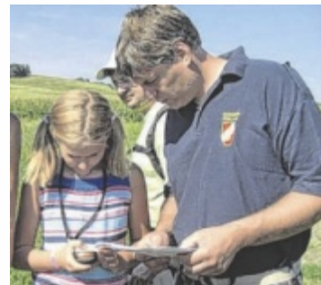
Beim „Nature Caching“ wandern die Besucher mit einem GPS-Gerät durch den Naturpark.