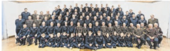
Die Grieskirchener Florianis wollen sich den Landessieg holen.

Noch bis 3. Juni, 10 Uhr, kann für die Feuerwehren gevotet werden: wie gehabt per Landeswahl-Stimmzettel aus der Tips-Ausgabe und einmal täglich auch auf www.tips.at/sympathicus . Fleißig die Werbetrommel zu rühren, lohnt sich. Denn als wäre der Titel Sympathicus 2024 nicht Ehre genug, warten auf den Landessieger 2.000 Euro für den nächsten Feuerwehrausflug, 150 Liter Freibier der Brau Union und fünf Paar Feuerwehrstiefel. ■