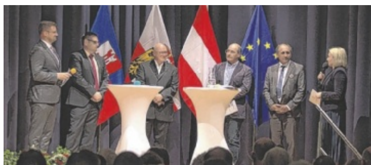
Bei den Talkrunden wurden verschiedene Aspekte des Kulturzentrums hervorgehoben.

auch die Landesmusikschule wählte ein Stück von Bruckner für den Festakt aus. „Es war ein wunderbarer Abend für unser Kulturzentrum. Das Bräuhaus ist für die gesamte Region ein besonderer Ort für viele gelungene Veranstaltungen geworden. Es ist auch ein besonderes Zeichen der