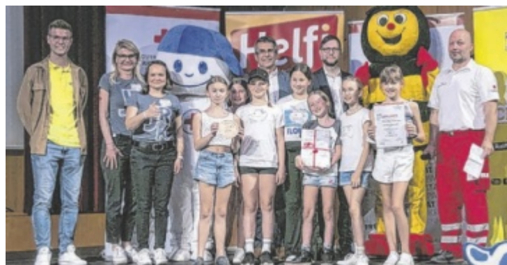
Die „Neukirchner Helfi Girls“ schafften es auf den dritten Platz.

Beweis stellen konnten. Die „Neukirchner Helfi Girls“ von der Volksschule Neukirchen landeten hinter den Siegern aus Gschwandt und den Zweitplatzierten aus St. Peter am Wimberg sowie aus Tumeltsham auf dem dritten Platz. ■