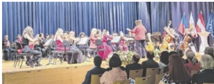
Die Schüler und Lehrer der Landesmusikschule Eferding präsentierten bei zahlreichen Auftritten ihr Können.