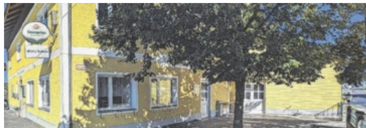
Für den Wirt in Aubach wird nach einem neuen Pächter gesucht.

Dem direkten Nachbarn des Wirtshauses Christoph Königseder liegt der Wirt in Aubach besonders am Herzen: „Das Gasthaus ist seit Generationen ein zentraler Treffpunkt für die Gemeinschaft. Es ist für mich persönlich von besonderer Bedeutung, da ich es seit meiner Geburt kenne und miterlebt habe, wie es über die Jahre hinweg der Mittelpunkt unseres Dorflebens war. Es war die erste