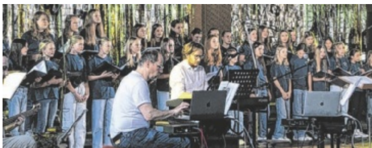
Die Schüler des Borg Grieskirchen luden zum Konzert.