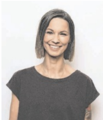
Staraufgebot am 27. Juli: heuer mit Christian Stürmer

Der große Star des Events ist dieses Jahr Christina Stürmer. Die Oberösterreicherin steht schon ihr halbes Leben auf der Bühne und hat sieben Nummer-eins-Alben und elf Amadeus-Awards vorzuweisen. Mit der Gruppe Granada kommt Neo-Austropop aus Graz nach Bad Schallerbach, selbstverständlich mit Akkor-