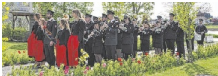
Die Eferdinger Musiker proben derzeit für drei Marschwertungen.

EFERDING. Nach einem erfolgreichen Frühjahrskonzert bereitet sich der Musikverein Eferding nun auf drei Marschwertungen vor. Doch der Musikeralltag hat zurzeit auch Schattenseiten: Der Verein hat seit fast drei Jahren kein richtiges Musikheim mehr.