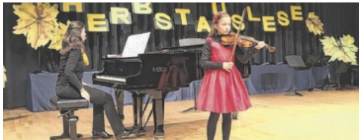
In der Landesmusikschule Eferding werden 42 Fächer unterrichtet.

Nach Ende des Zweiten Weltkrieges wurde im Schuljahr 1946/47 der Schulbetrieb wieder aufgenommen. Ab 1977/78, als die damalige Gemeindemusikschule in das oberösterreichische Landesmusikschulwerk eingegliedert wurde, reichten die vorhandenen Räumlichkeiten aufgrund der ständig wachsenden Schüler- und Lehrerzahl nicht mehr aus und der Unterricht wurde auf insgesamt zehn in