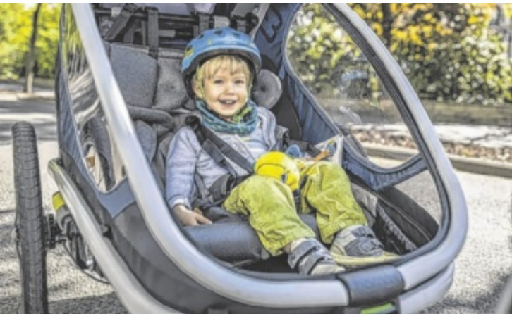
Für den Kindertransport am Fahrrad gilt Helmpflicht.

ße nicht in die Räder beziehungsweise Speichen kommen können. Der Fahrer muss mindestens 16 Jahre alt sein. Ein Kindersitz darf in Österreich nur hinter dem Fahrradsattel angebracht werden und er muss fest mit dem Rahmen verbunden sein. Damit darf nur ein Kind befördert werden. Verstellbare Fußstützen, Speichenschutz und Gurtsystem sind verpflichtend vorgeschrieben. Wer das erste Mal mit einem Passagier an Bord unterwegs ist, sollte vor der Personenbeförderung ein paar Kilometer ohne Kind, aber mit etwa gleich schwerer Ladung üben. ■