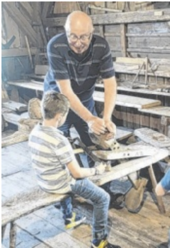
Im Freilichtmuseum Furthmühle Pram wird den Besuchern altes Handwerk vermittelt.

Die Sonderausstellung 2024 „Die große Welt im Kleinen“ im Haager Heimatmuseum im Schloss Starhemberg zeigt Modelle ver-