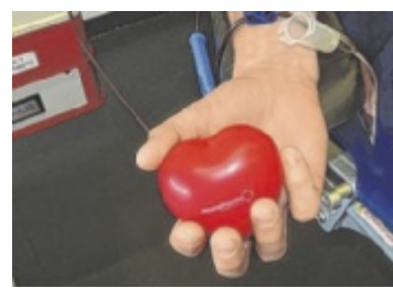
Blut spenden, Leben retten.