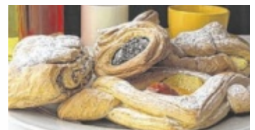
Plundergebäck von Stöbich

Der Teig wird ausgerollt, zusammengeschnitten, wieder ausgerollt und so weiter, was man „Touren“ nennt. Der Plundererteig enthält weniger Butter, daher sind weniger Touren erforderlich. Auf Touren kommen auch die Konditoren, wenn sie in der Backstube von Bäckermeister Stöbich den Plundererteig herstellen. Der Teig wird nur außen knusprig gebacken und sollte innen schön weich bleiben. Zum zusätzlichen Genuss werden die Plunderstücke unterschiedlich gefüllt, wie zum Beispiel mit Marillen, Himbeeren, Powidl, Mohn, Nuss, Kirschen, Topfen- oder Vanillecreme. Am beliebtesten ist die Topfengolatsche, gefolgt von der Nusskrone. Täglich frisch aus der