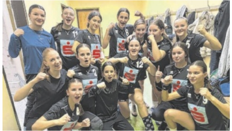
Die Damen der SMS Wels gewannen den Schul-Handballcup.

Das Damen-Team aus der Schule trat beim Handball-Bewerb an. Ungeschlagen spielten sie sich durch das Turnier und holten sich die Goldmedaille. Das musste in der Kabine ordentlich gefeiert werden. Das Bundesfinale findet in Telfs statt. Das Burschen-Team war im Basketball nicht zu schlagen. Alle Spiele der Vorrunden sowie das Finalspiel gegen das BRG Gmunden wurden klar gewonnen. Bei den Damen holte übrigens das BRG Wallererstraße die Goldmedaille. Hier findet das Bundesfinale im niederösterreichischen Tulln statt.