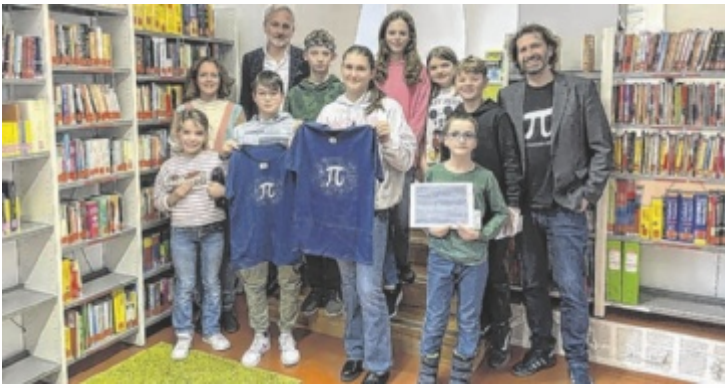
Die Schüler stellten ihr gutes Zahlengedächtnis unter Beweis.