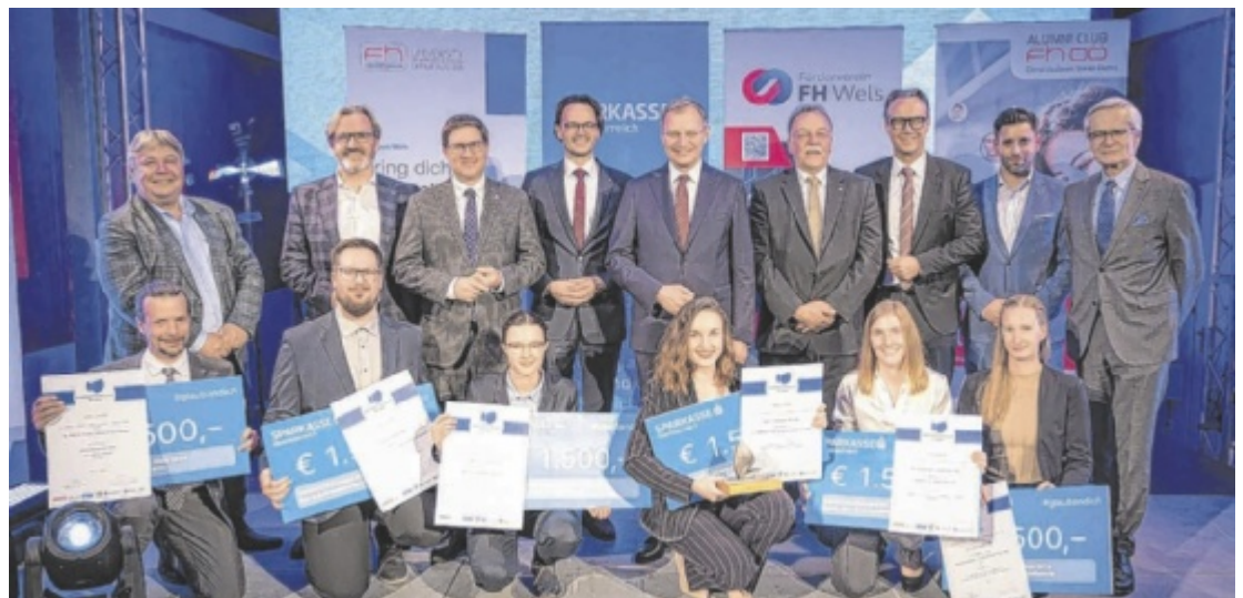
Ehrgäste und Sieger des Innovation Award 2024