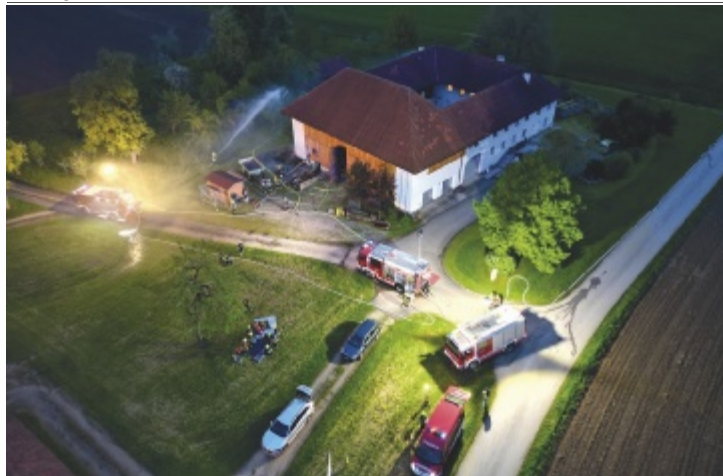
Immer wieder übten die Kameraden unterschiedlichste Szenarien.