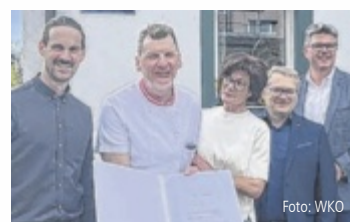
Die Kammervorteiler gratulierten.