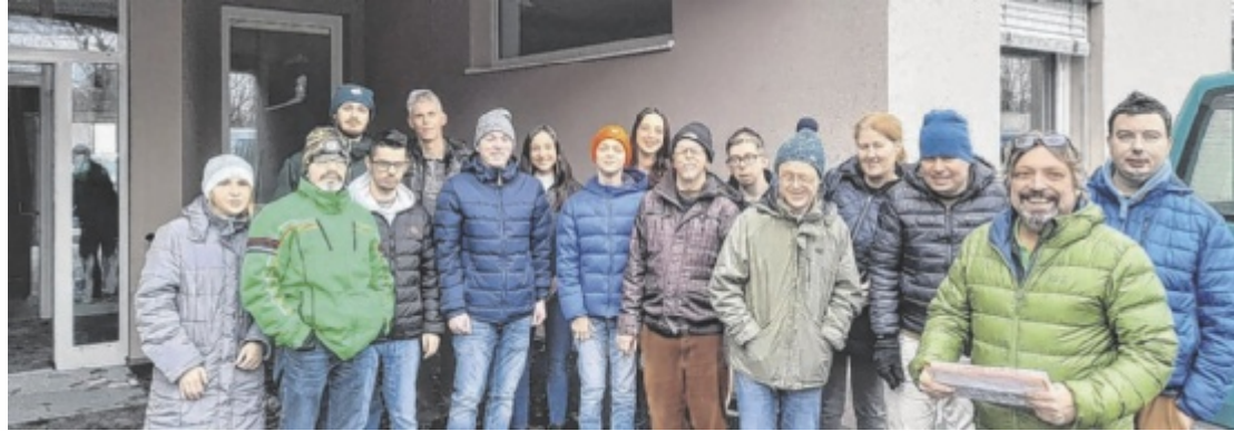
Beschäftigte und Mitarbeiter freuen sich auf den Einzug in die neue Lebenshilfe-Werkstätte in Wels.

„Das Café soll ein Ort der Begegnung werden, in dem Menschen ohne Bezug zu Menschen