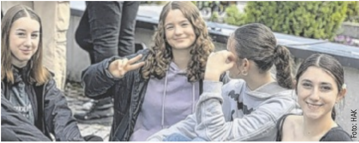
Nach dem Fußmarsch wurde vor dem Gottesdienst eine kurze Pause eingelegt.