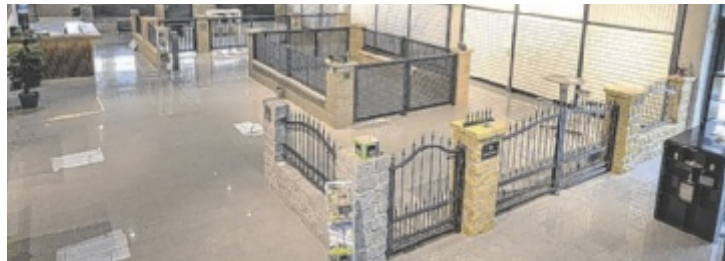
Aluminium-Zäune der Creativ Zaun Design GmbH