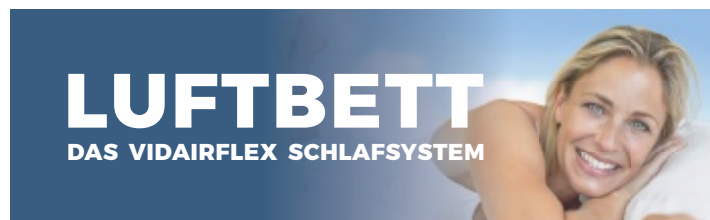
Das stromlose VIDairFlex®-Luftbett-Schlafsystem für ein druckfreies Schlafen

Menschen haben verschiedene Schlafbedürfnisse. Das VIDairFLEX®-Luftbett-Schlafsystem wird fast allen Ansprüchen gerecht. Luft ist das einzige Element, welches sich selbstständig, dreidimensional und druckfrei jedem Körper anpasst. Der aufliegende Körper ruht