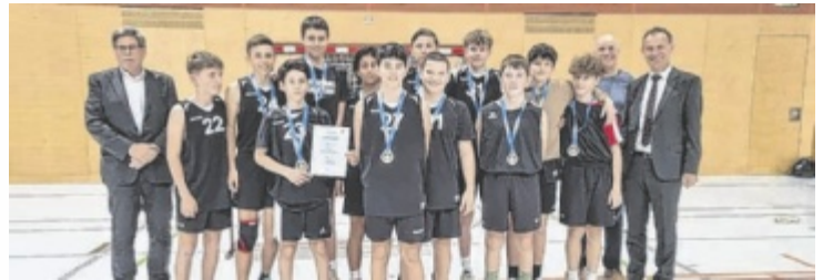
Und die Burschen waren im Basketball erfolgreich.