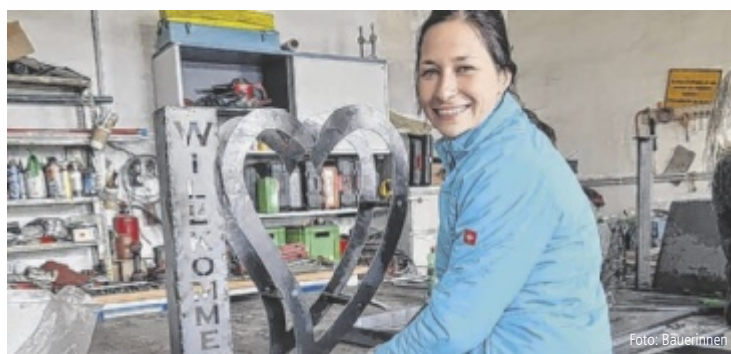
Alle sind mit Feuereifer bei der Sache und es entstehen tolle Werkstücke.

SATTLIEDT/FISCHLHAM. Metall und Schweißen und auf diesem Wege entstanden in kürzester Zeit Feuerschalen, Tröge, Herzen und sogar ein Rosenbogen. „Es war zwar teilweise eine Herausforderung, jedoch hatten wir eine Menge Spaß dabei und sind sehr stolz auf unsere einzigartigen Deko-Gegenstände für unseren Garten“, zieht die Ortsbäuerin zufrieden Bilanz über die gelungene Veranstaltung. ■