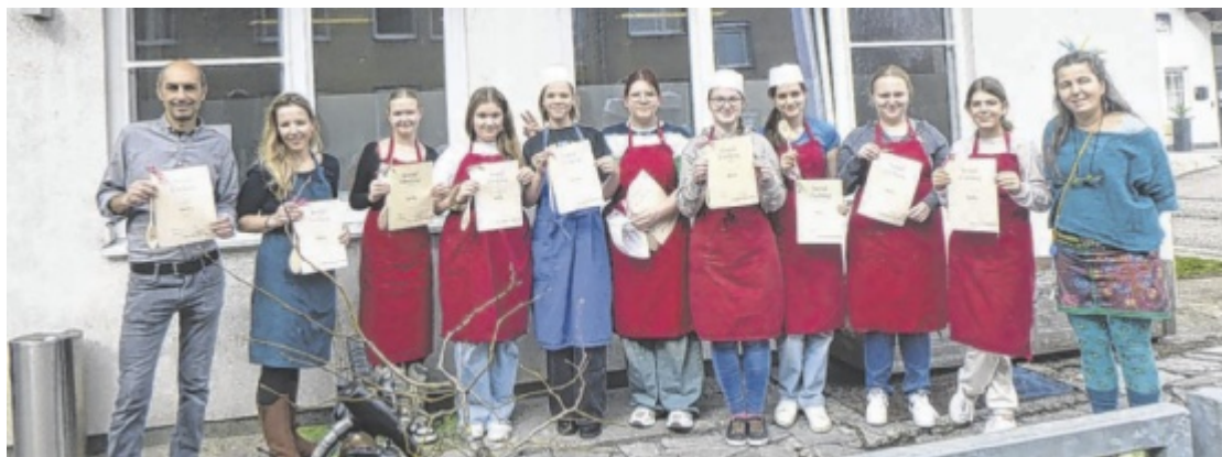
Zum Abschluss gab es eine Urkunde für die Schülerinnen.

Mittelpunkt. Aus dem Kochbuch des Erasmus+ Projektes YMOCH wurden die Gerichte Rahmsuppe und Erdäpfelreibecken zubereitet und mit Genuss und Freude verspeist, berichtet die Gruppe nach dem Einsatz im Tageszentrum an der Salzburgerstraße. ■