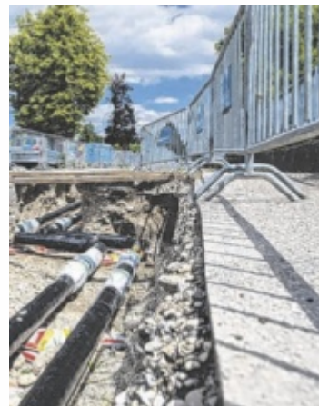
Arbeiten für die Fernwärme

Grundsätzlich bedanken sich alle Protagonisten für die Geduld und das Verständnis der Bevöl-kerung: „Wenn wir Versor-gungssicherheit haben wollen, dann müssen wir in die Leitun-gen investieren. Die Baustellen sind penibel geplant, um die Bauzeit kurz zu halten“, sagt eww Vorstand Wolfgang Nöstlinger. Ständig schließt sich die Stadt mit Land und eww kurz, um alles noch besser vorzubereiten. Auch die Anrainerinformationen flie-ßen besser als rund um das The-ma Styrol im Grundwasser in der Pernau. Viele Projekte sind in der Pipeline, das teuerste ist der Steg nach Schleißheim mit 4,5 Mil-lionen Euro. Start ist im Herbst.