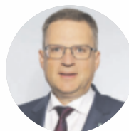
August Wöginger ÖVP-Klubobmann

Unser Ziel: Wir wollen die Eigentumsquote bis zum Jahr 2030 von 48 Prozent auf 60 Prozent steigern. Auf diesen Plan können Sie bauen!