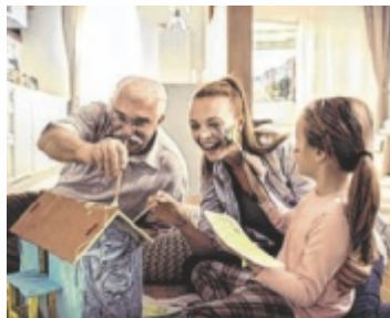
Jung und Alt in Symbiose: Tips lädt ein, ein Foto zum Thema Generationen einzureichen.

Die Tips-Leser sind aufgerufen, die Vielfalt und Symbiose zwischen den Generationen fotografisch zu zeigen – sei es die Verbindung zwischen Großeltern, Eltern und Kindern, die Dynamik zwischen verschiedenen Altersgruppen oder die Spiegelung von Traditionen und Veränderungen über Generationen hinweg. Bis 30. April kann online eingereicht und abgestimmt werden. Zu gewinnen gibt es als Hauptpreis einen Relax-Tagesurlaub im Spa Resort Geinberg und Eintritt zu den Körperwelten für zwei Personen, als zweiten Preis den Körperwelten-Eintritt für fünf