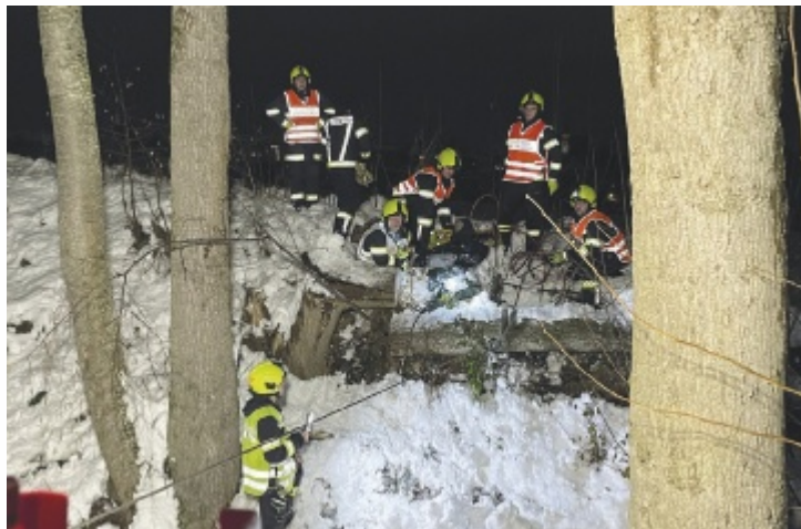
Anfang Dezember erforderte der Schnee viele Einsätze.

Insgesamt gibt es in Wels-Land 41 Feuerwehren . Im Aktivstand sind 2.463 (davon 147 Frauen ). In der Jugend sind es 609 (davon 152 weiblich ). Der Reservestand beträgt 498 . Zu 591 Brandeinsätzen mussten die Wehren 2023 ausrücken. 2022 waren es 540 . Technische Einsätze gab es 2.906 (2022: 2.063) .