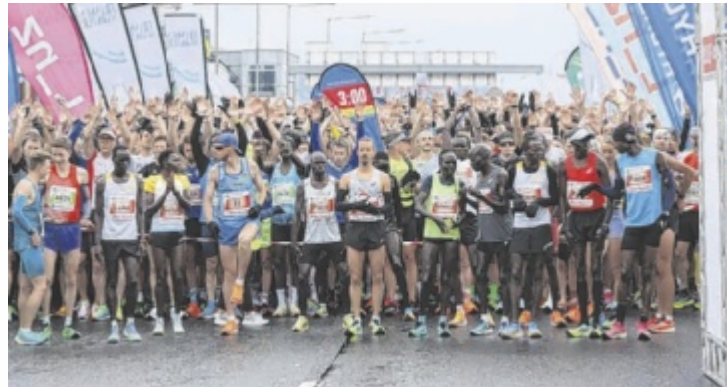
Zahlreiche Anmeldungen gibt es bereits für die neun unterschiedlichen Bewerbe beim Linz Marathon am kommenden Wochenende.

Nachmeldungen sind online und auch im Rahmen der Sportmesse am Freitag, 5., und Samstag, 6. April, in der Linzer TipsArena noch möglich, wo auch die Startnummern (Freitag, 12 bis 19 Uhr und Samstag, 10 bis 18 Uhr) aus-