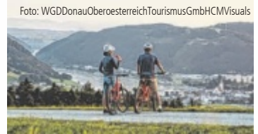
Radfahrer am Donauradweg mit Blick auf Grein im Bezirk Perg

OÖ. Die Radregion Donau Oberösterreich ist mit ihrem reichen kulturellen Erbe und den Naturschätzen das perfekte Ziel für einen Ausflug mit dem Fahrrad. Zwischen Schärding und Grein warten neben den Klassikern Inn- und Donauradweg 15 E-Bike-Genusstouren mit 700 Kilometern.