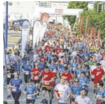
Informationen gibt es unter www.welser-businessrun.at

Alle Läufer und Walker erhalten im Ziel eine Medaille, einen Kaiserschmarren und eine Urkunde zum Gratis-Download. Natürlich können auch Einzelpersonen (Einzelunternehmer, Arbeiter, Angestellte) teilnehmen. Das Mindestalter für alle Teilnehmer beträgt 15 Jahre (Jahrgang 2009 und älter). Im Ziel gibt es Partystimmung und eine große Tombola mit wertvollen Sachpreisen.