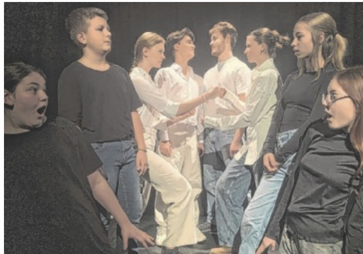
Das Jugendensemble Yes probt intensiv für das Stück.

einen tollen Abend mit den ambitionierten jungen Schauspielern auf der Bühne. ■