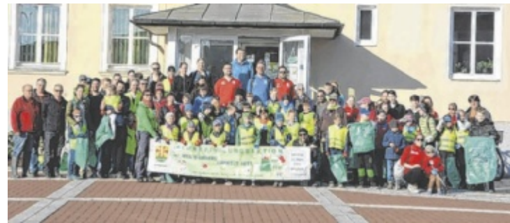
Damit in Kreinglach wieder alles sauber ist.