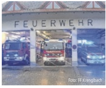
Die FF Krenglbach ist einsatzbereit.

WELS-LAND. Welche ist die sympathischste Feuerwehr im Bezirk? Diese Frage klären Tips, das Land OÖ, Sparkasse und Zipfer mit der Wahl zum Sympathicus 2024.