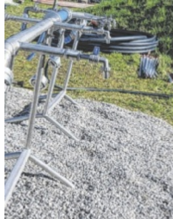
Eine der beiden öffentlichen Entnahmestellen für Trinkwasser in der Schafwiesen.

Es besteht nach wie vor Gefahr für Haushalte mit eigenem Hausbrunnen, die nicht an die Ortsleitung angeschlossen sind. Das öffentliche Trinkwassernetz ist sicher. Weitere Maßnahmen sind in Planung. Die betroffenen Anrainer werden gesondert informiert. Die Situation wird permanent überwacht.