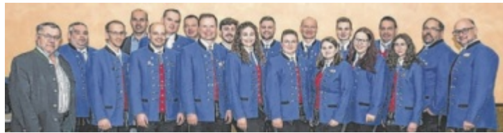
Der neue Vorstand startet voller Elan in die nächste Funktionsperiode.