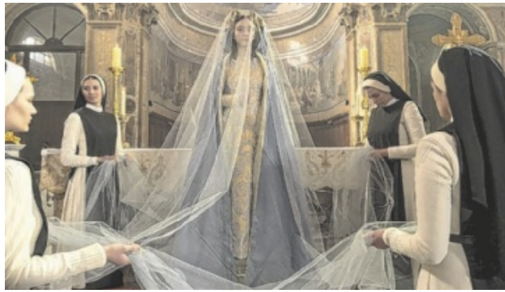
Der Schein trägt und der Aufenthalt wird zum Albtraum.