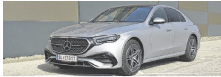
Der Mercedes-Benz E-Klasse 220d ist ab 66.625 Euro zu haben.

Das Interieur ist ein optischer und haptischer Genuss. Edle und perfekt verarbeitete Materialien und ein digitales Wunderland feiern gemeinsam ein Fest für alle Sinne. Zentrales Element ist der große Touchscreen. Das gilt zwar eh für fast jedes Modell, in der E-Klasse ist das aber nochmal eine ganz andere Nummer. Kristallklare Bilder, große und treffsichere Icons und schnelle Umsetzung aller Befehle begeistern im Alltag. Die dritte Generation von